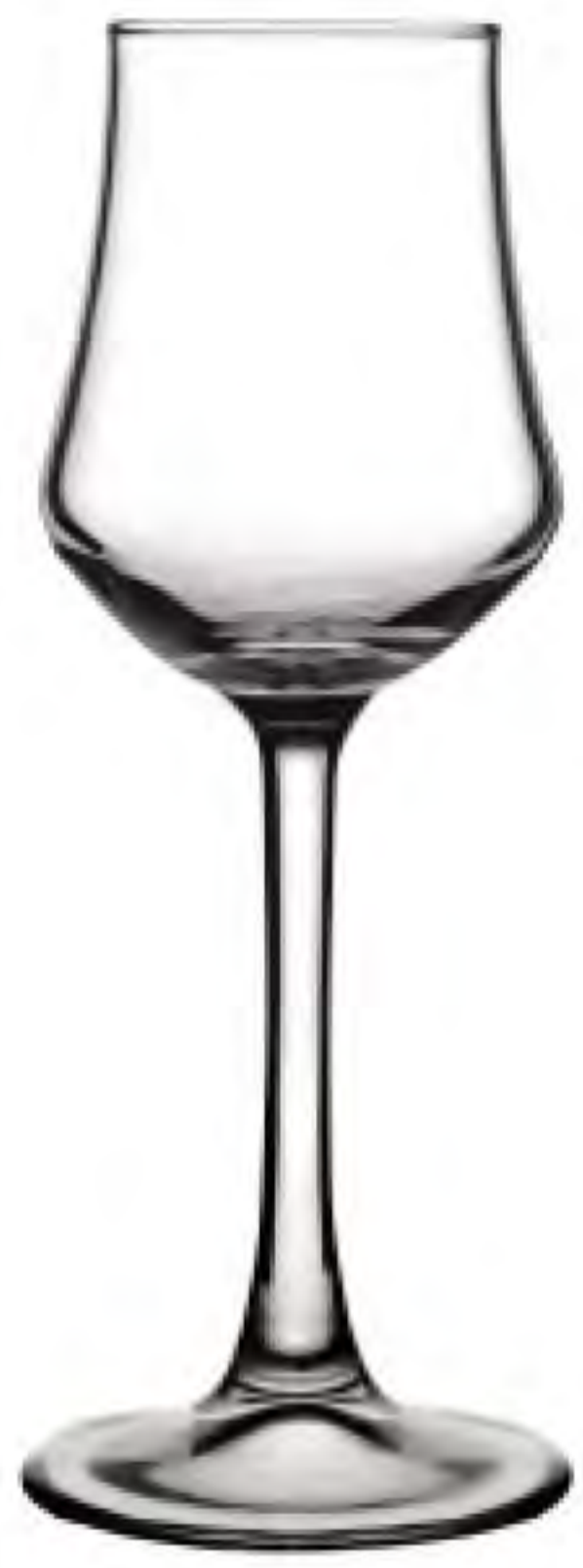
P-440107 115cc 甜酒杯 H: 169mm φ: 46mm