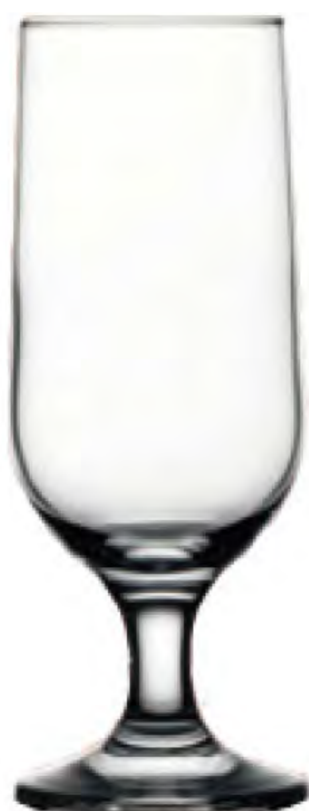
P-44882 350cc 啤酒杯 H: 180mm φ: 62mm