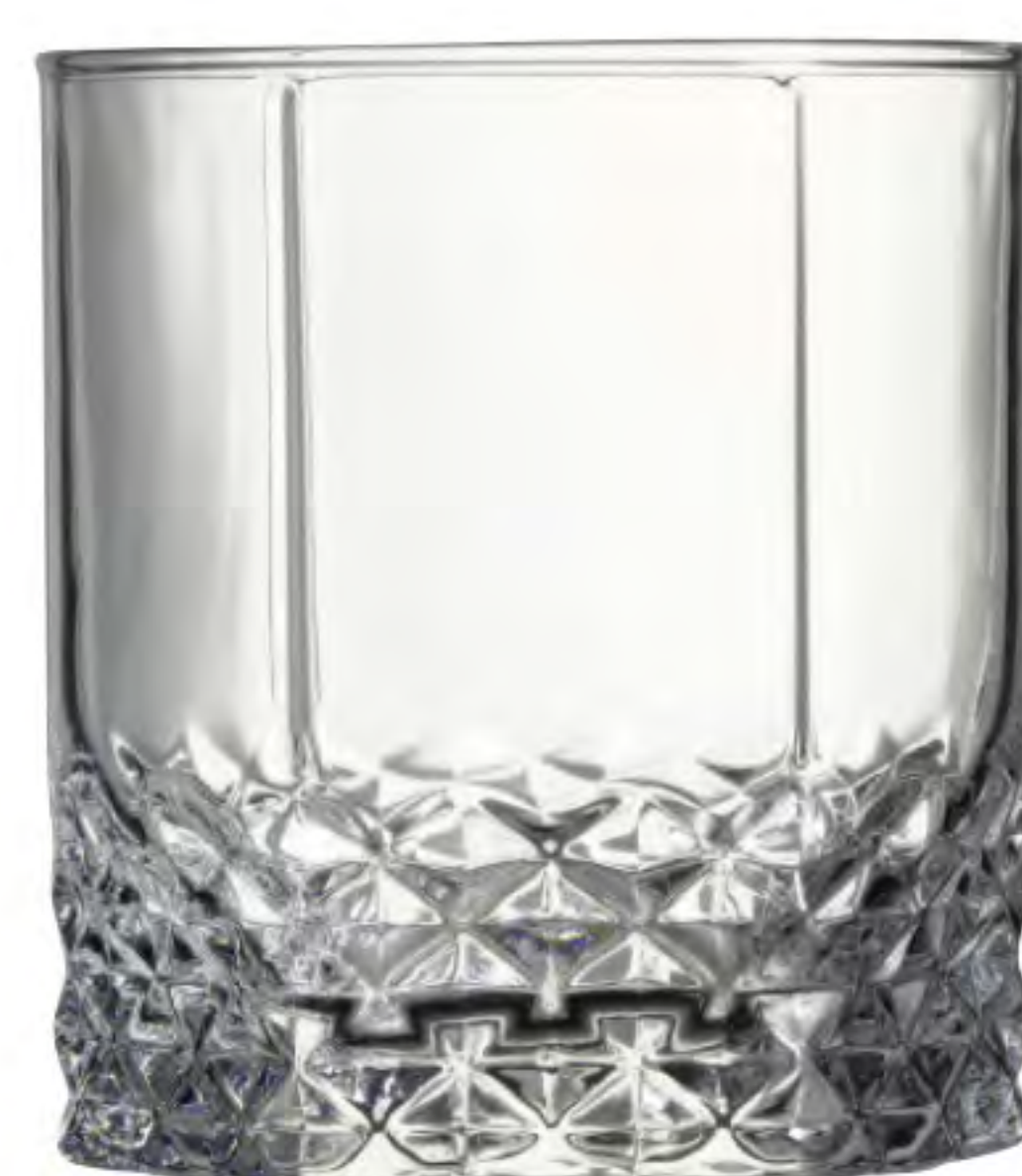
P-42945 315cc 威士忌杯 H:90mm Φ:80mm