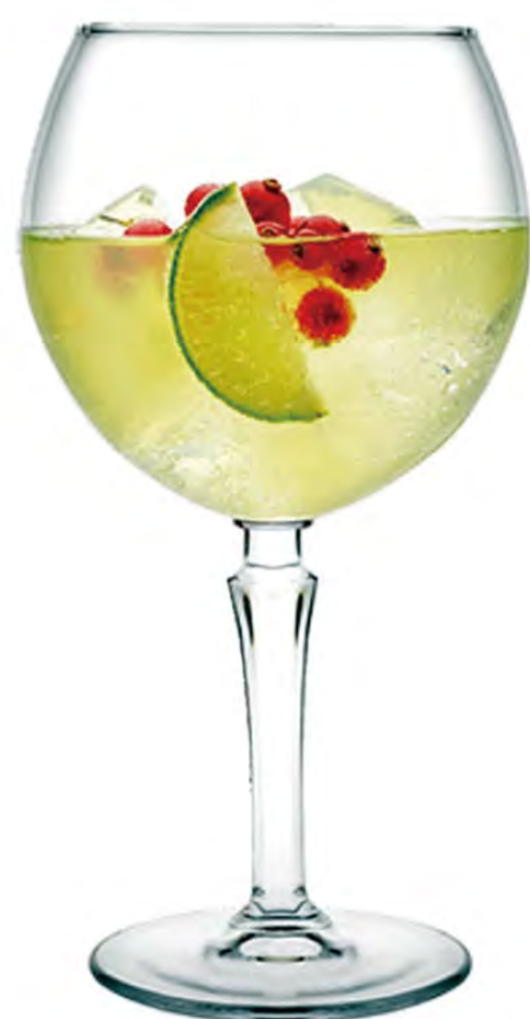
P-440253 655cc 雞尾酒杯 H:205mm Φ:85mm