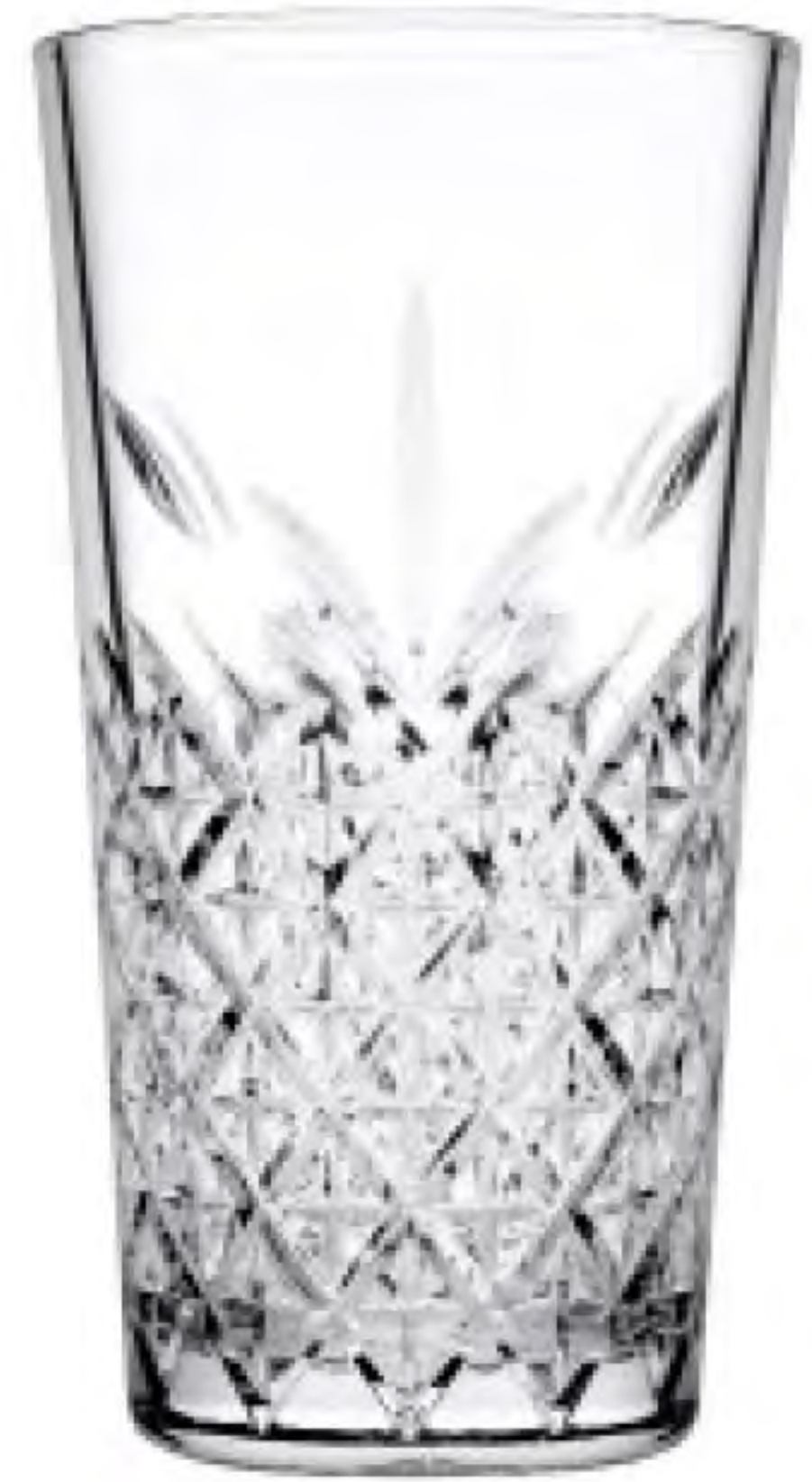
T P-520055 470cc 強化水杯 H: 159mm φ: 85.5mm