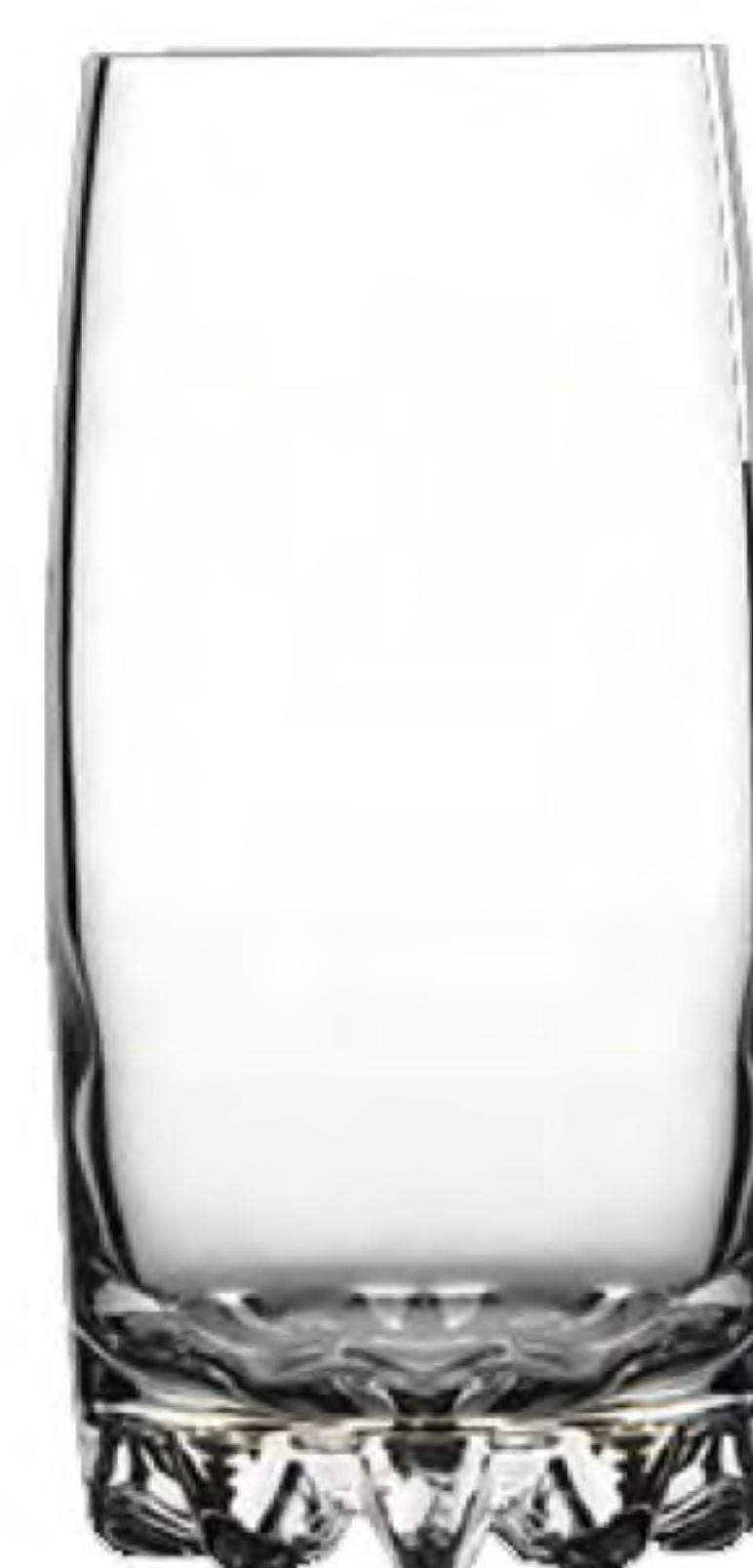
P-42812 385cc 珠底杯 H: 145mm φ: 62mm