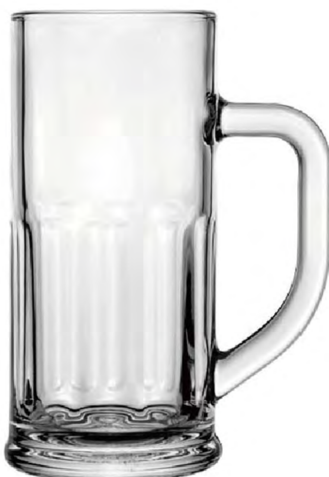
LG-311413 360cc 有柄杯 H: 148.50mm φ: 69mm 6X8