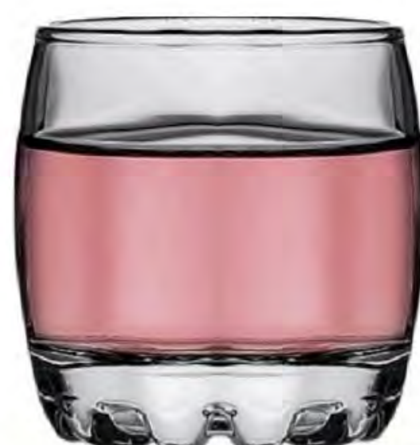
P-42244 80cc 珠底杯 H: 60mm φ: 48mm