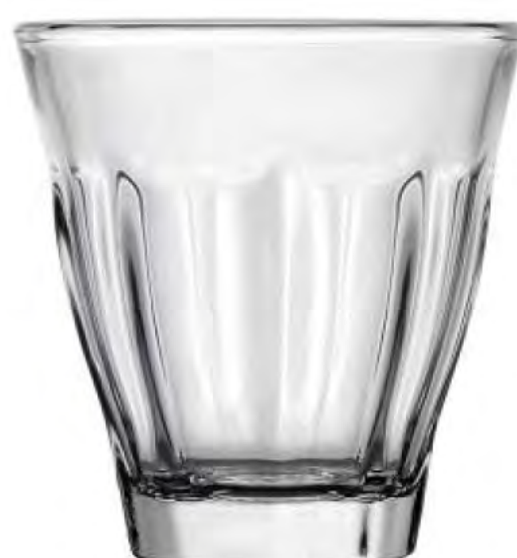
LG-100506 170cc 水杯 H: 81.50mm φ: 78mm 12X6