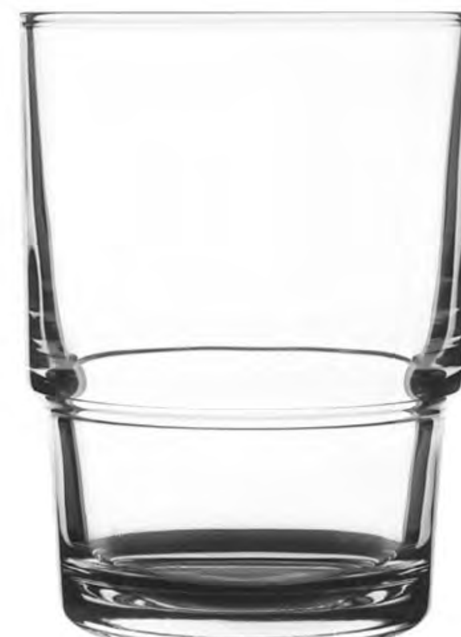
UG-388 242cc 美樂杯 H: 93.8mm φ: 67.8mm 6X12