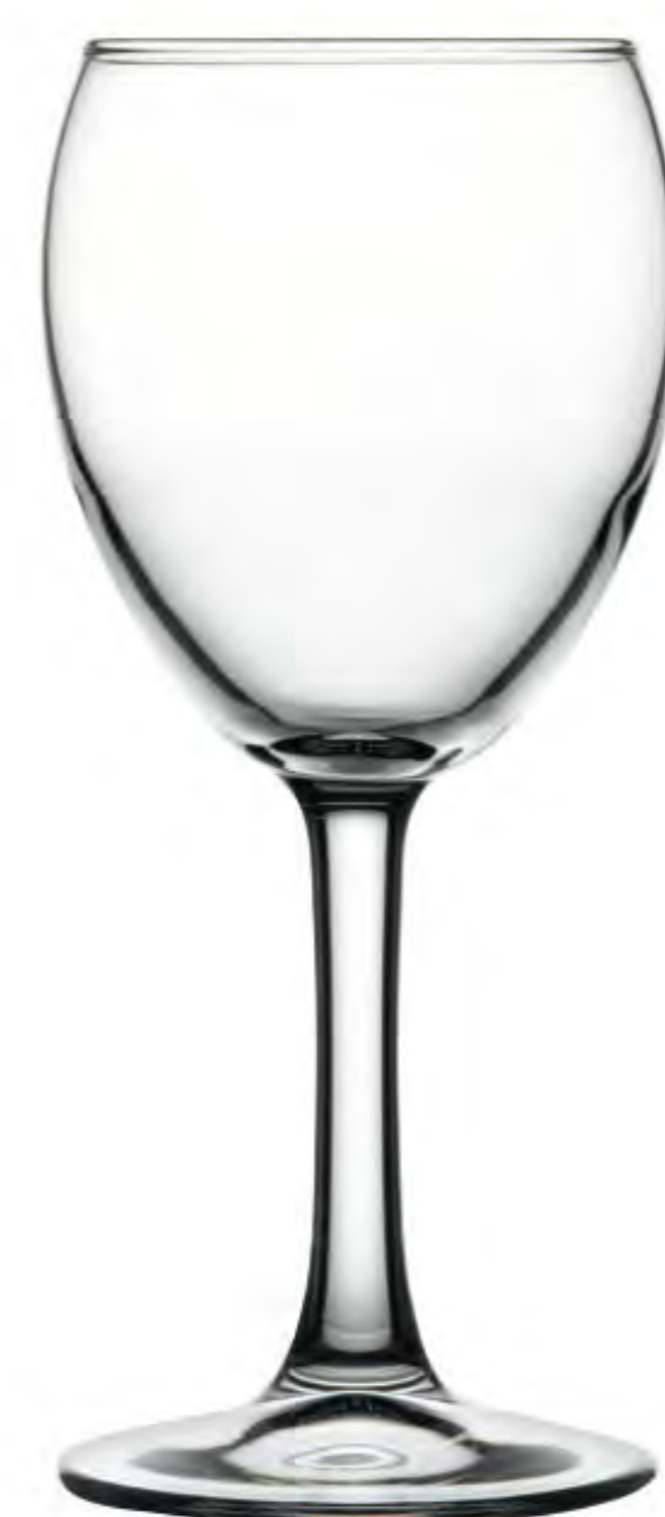
T P-44799 240cc 紅酒杯 H: 175mm φ: 64mm