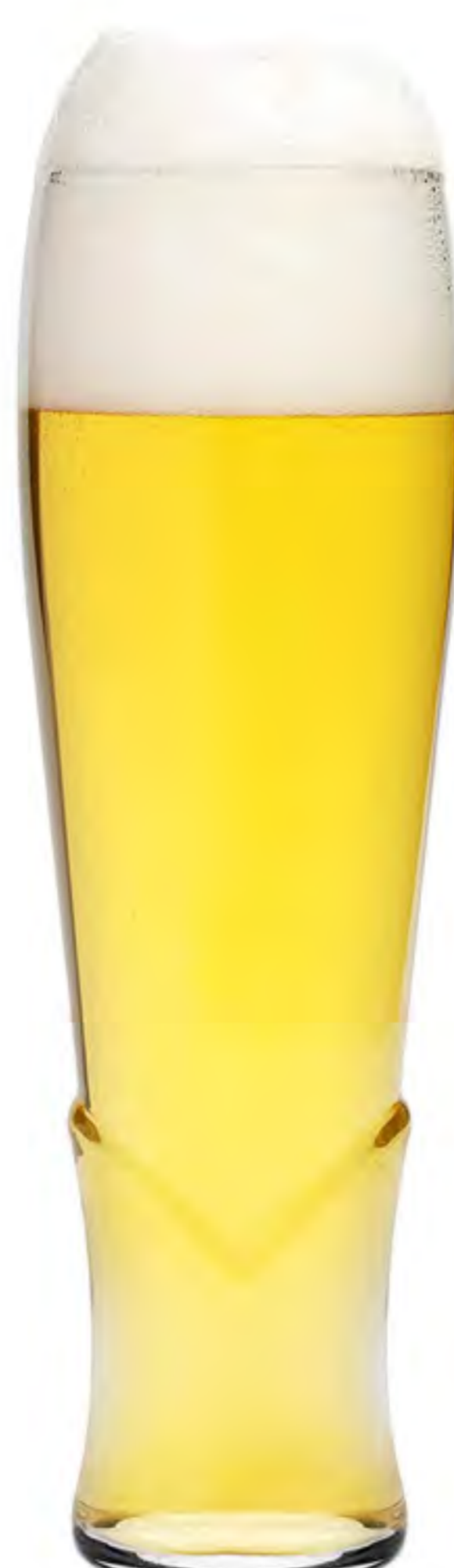
P-420748 455cc 卡拉夫啤酒杯 H: 215mm φ: 60.5mm