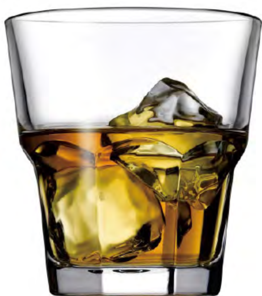
T P-52705 270cc 威士忌杯 H: 92 mm φ: 86 mm