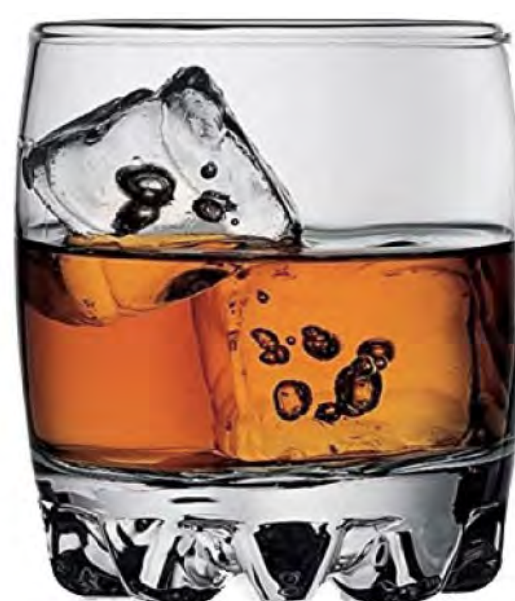
P-42415 315cc 珠底杯 H: 90mm φ: 77.5mm