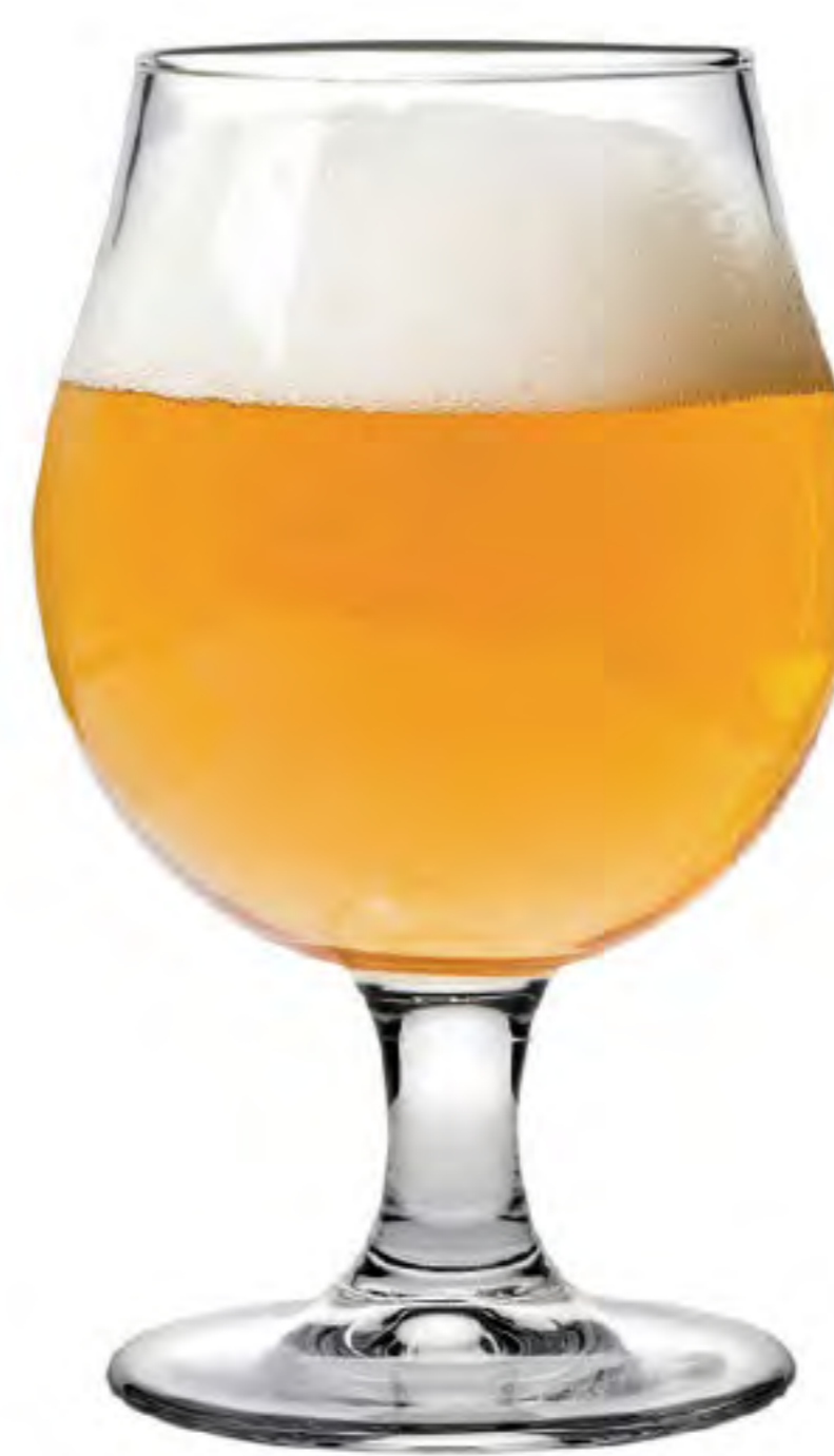
T P-440227 460cc 達夫特 啤酒杯 H: 154mm φ: 70mm