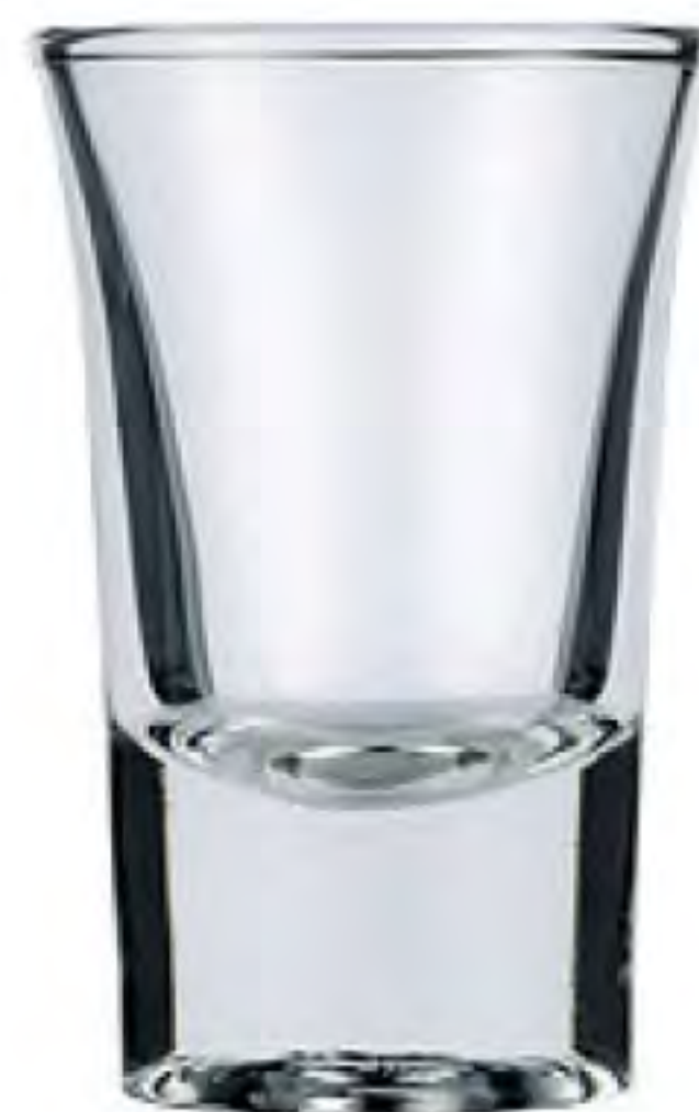
LG-440601 35cc 喇叭杯 H: 70mm φ: 45mm 12X12