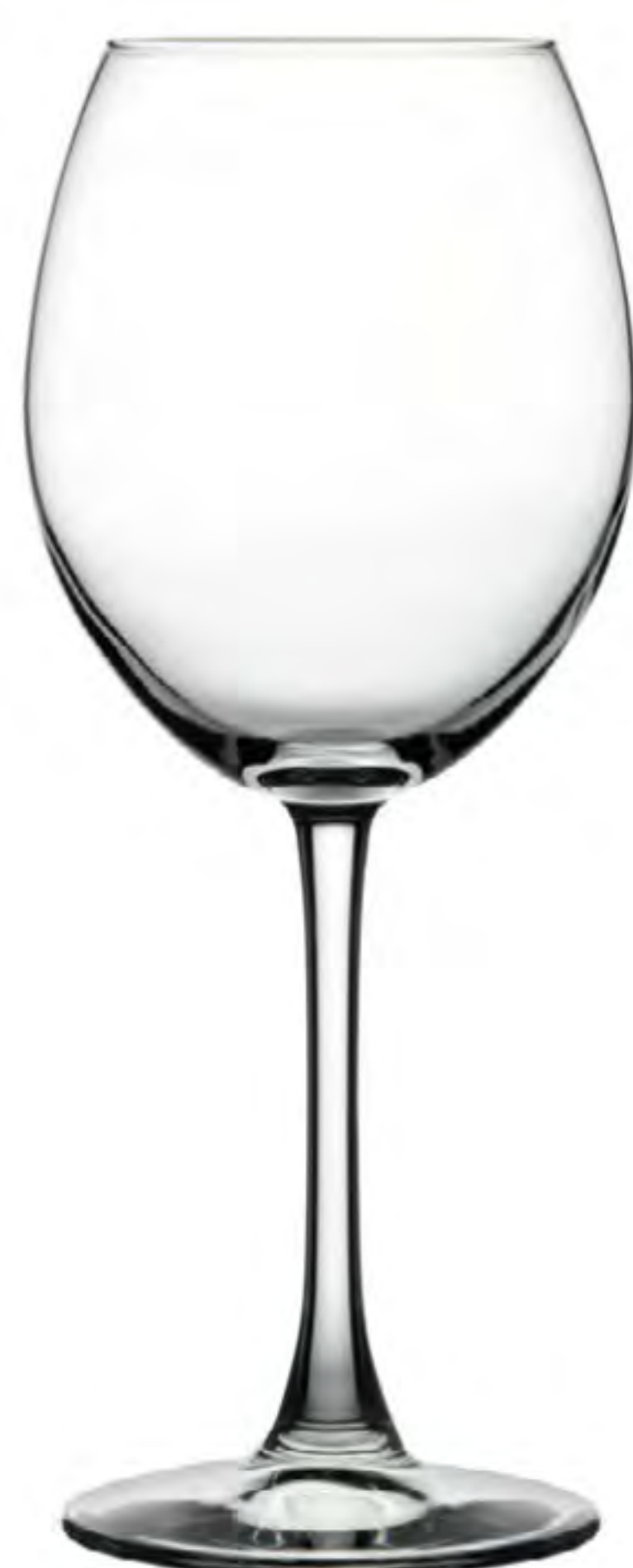
P-44728 440cc 紅酒杯 H: 223mm φ: 64mm