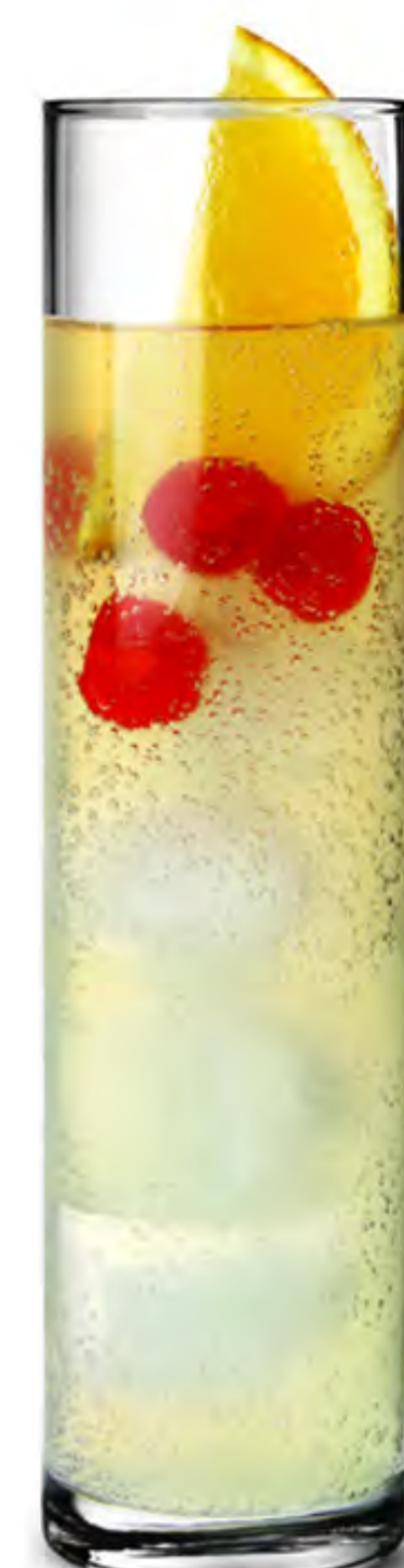
P-41716 370cc 司令直杯 H: 214mm φ: 55mm