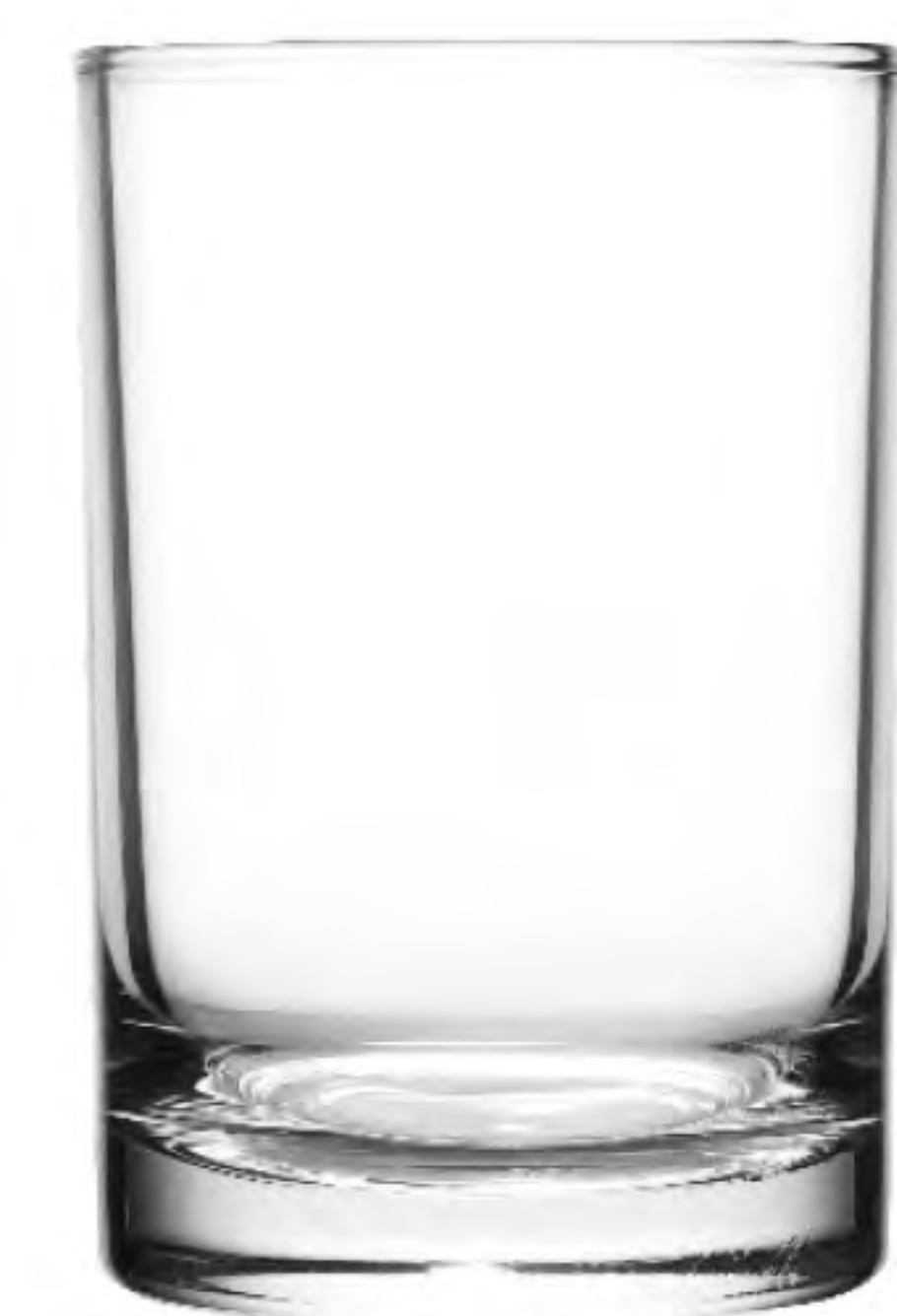
UG-381 162cc 水杯 H: 86.80mm φ: 57.50mm 6X12