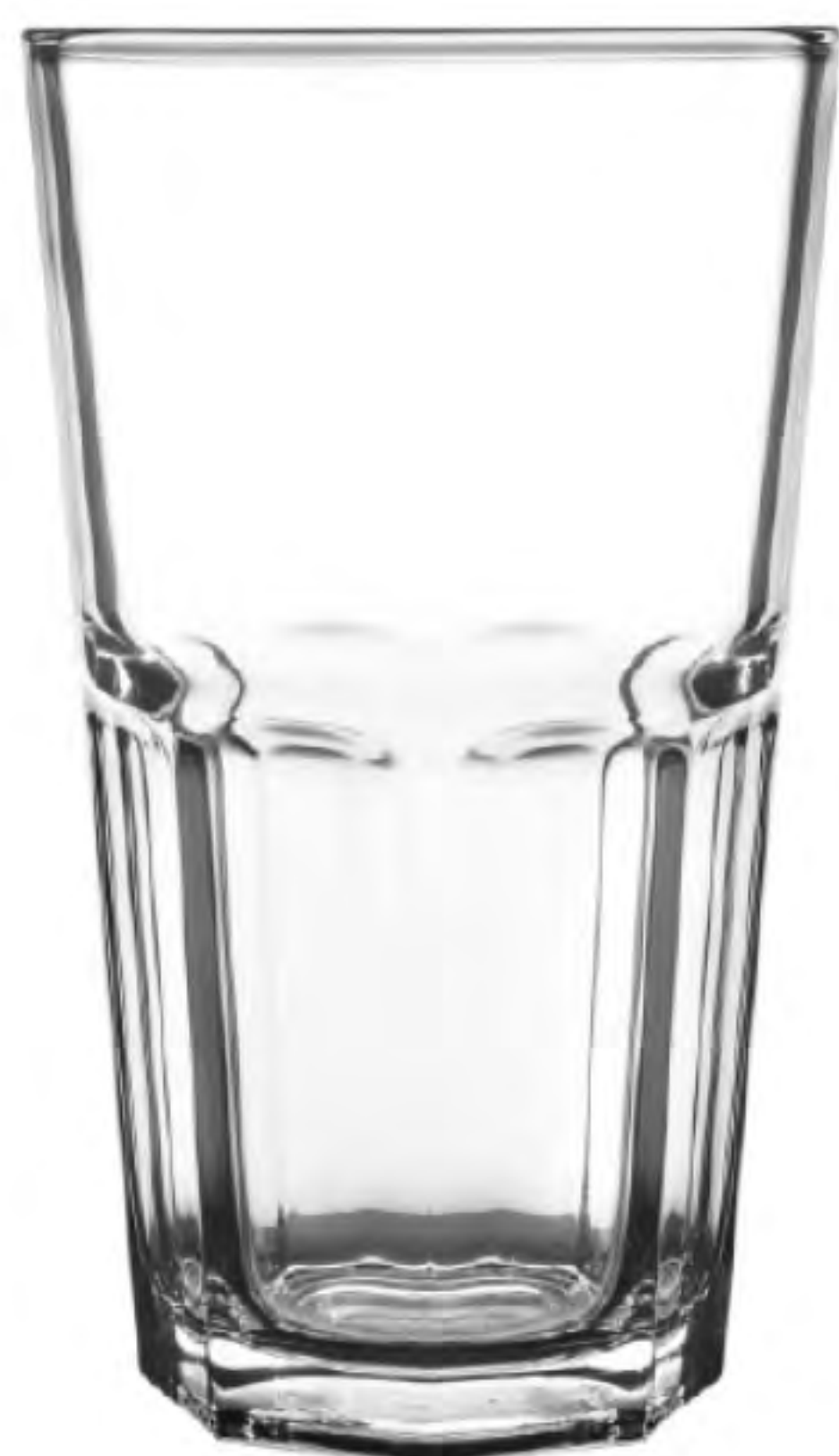
UG-390 420cc 八角杯 H: 141.5mm φ: 80.5mm 6X8