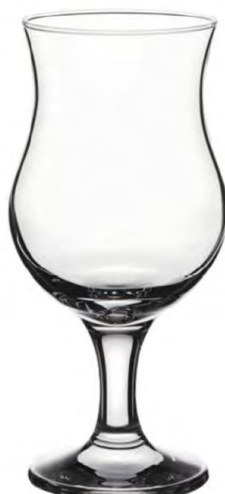
P-44872 380cc 雞尾酒杯 H: 176mm φ: 74mm