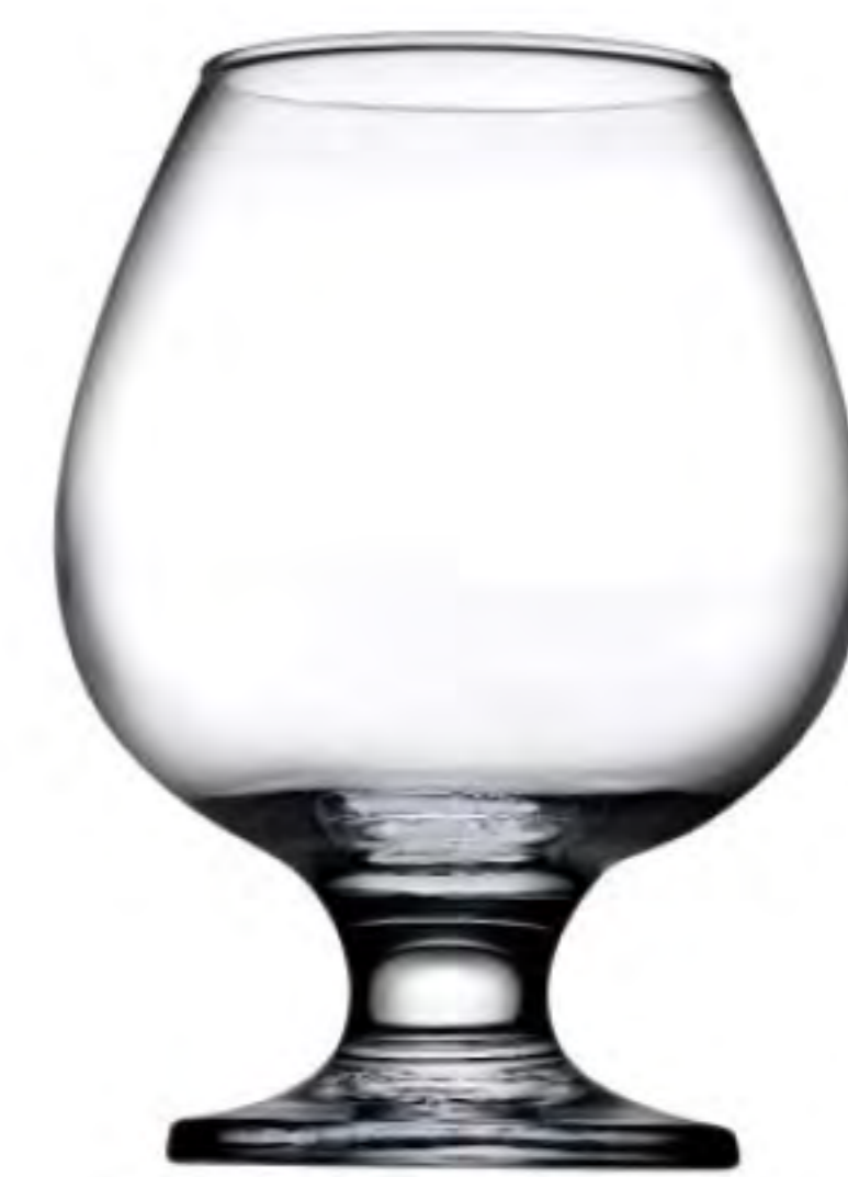
P-44188 385cc 比斯特 啤酒杯 H: 124mm φ: 60mm