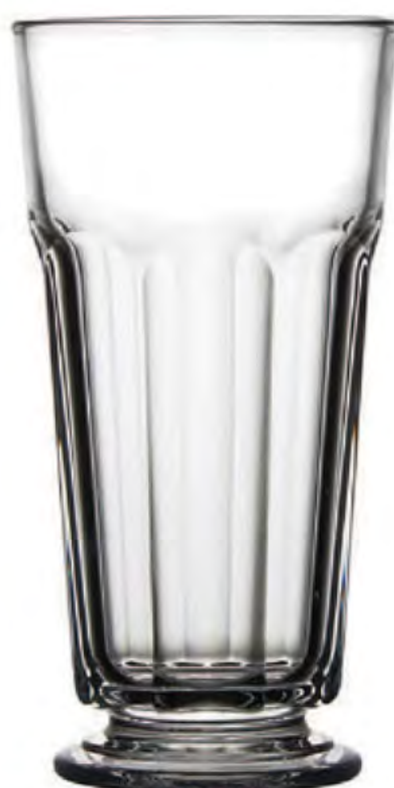
T P-52640 350cc 卡沙巴蘭 卡古典八角杯 H: 160 mm. φ: 80.5 mm