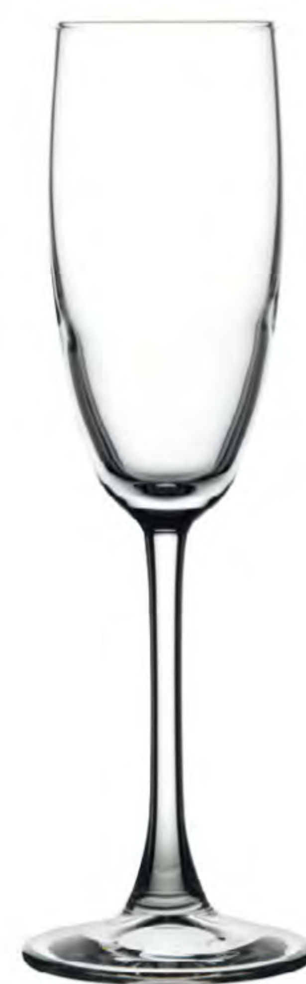
P-44688 175cc 香檳杯 H: 226mm φ: 52mm