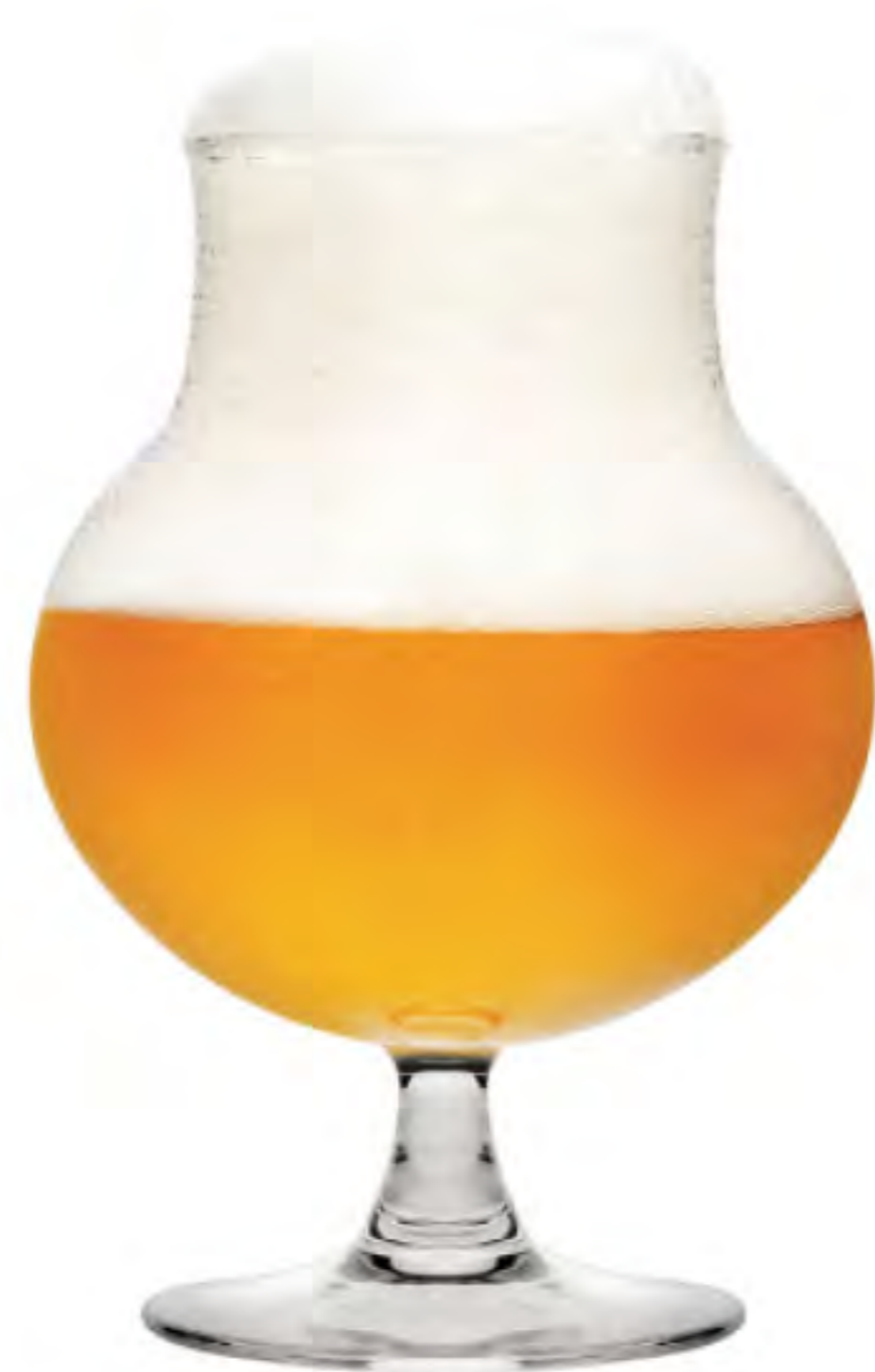
P-440327 485cc 卡拉夫 啤酒杯 H: 155mm φ: 70mm