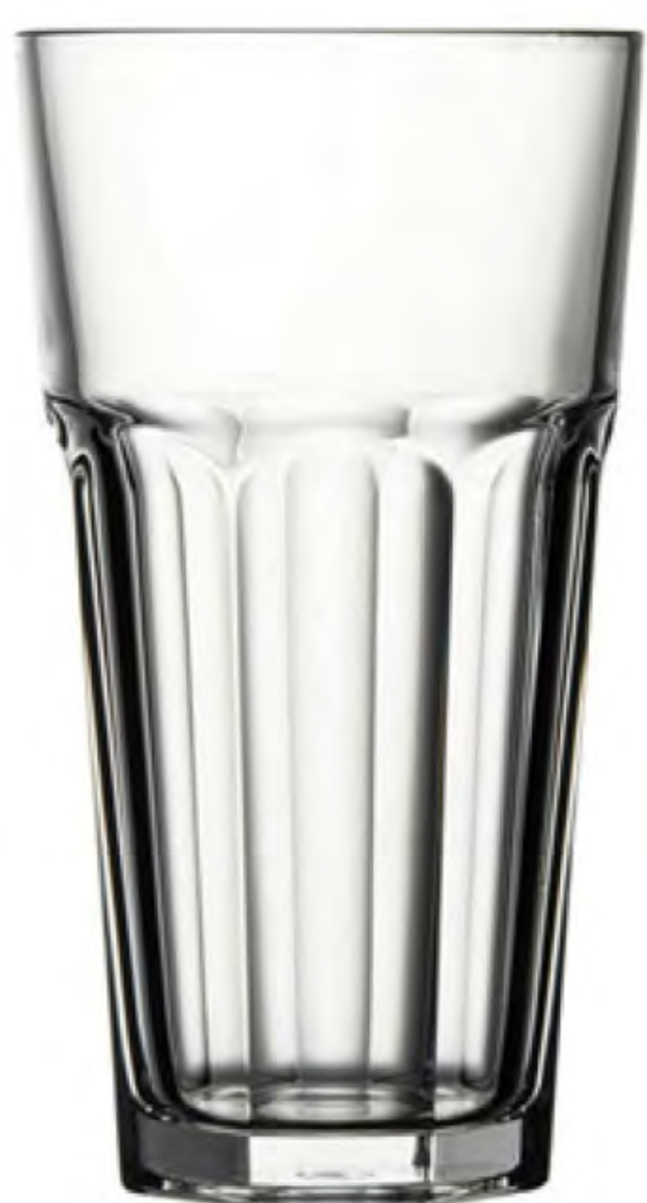
T P-52719 645cc 啤酒杯 H: 177 mm φ: 95 mm