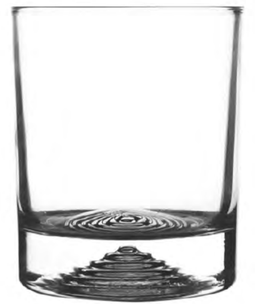
UG-396 180cc 炫底杯 H: 81.8mm φ: 67.3mm 6X12