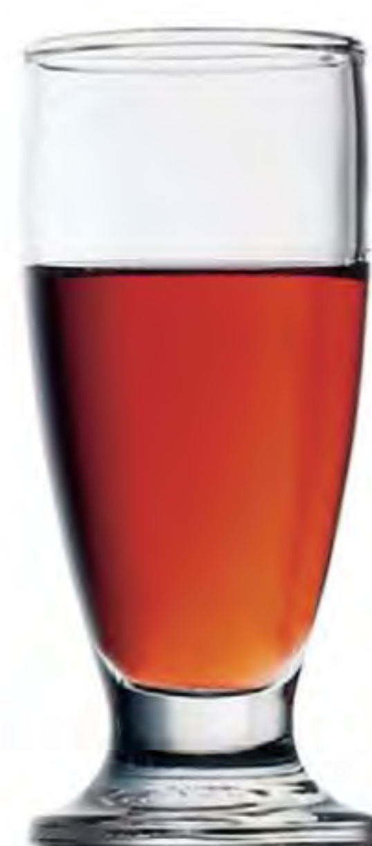
P-41104 70cc 烈酒杯 H: 100mm φ: 42mm