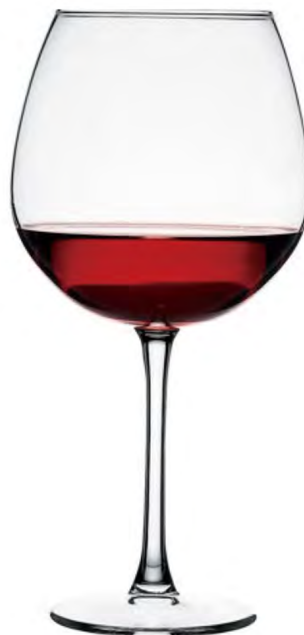
P-44248 780cc 紅酒杯 H: 288mm φ: 80mm