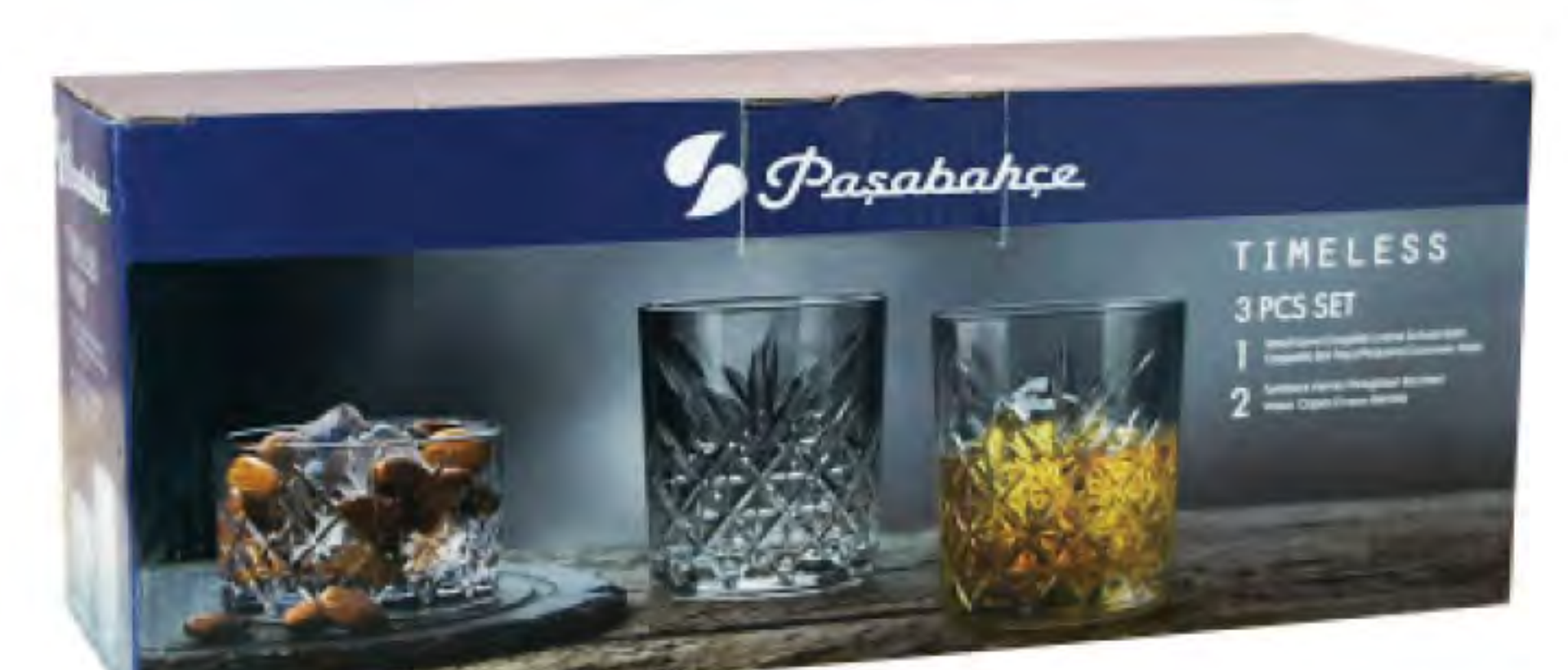
225cc 點心碗 H:54mm