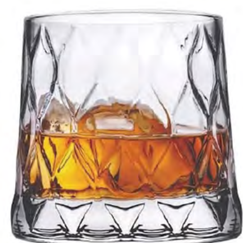
P-420194 300cc 火焰杯 H:85mm Φ:77mm 4X6