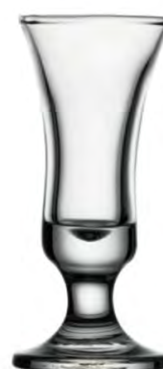
P-44404 25cc 利口酒杯 H: 95mm φ: 42mm