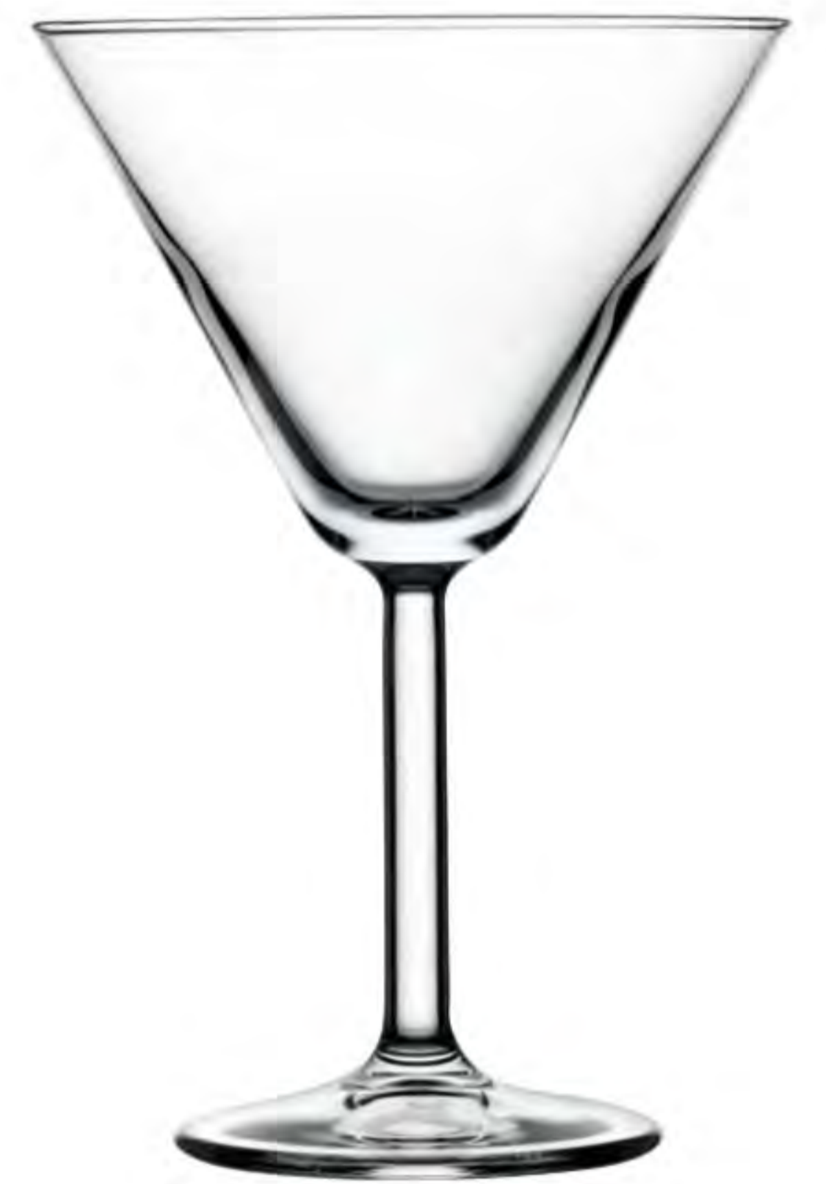
P-44904 105cc 雞尾酒杯 H: 171mm φ: 115mm