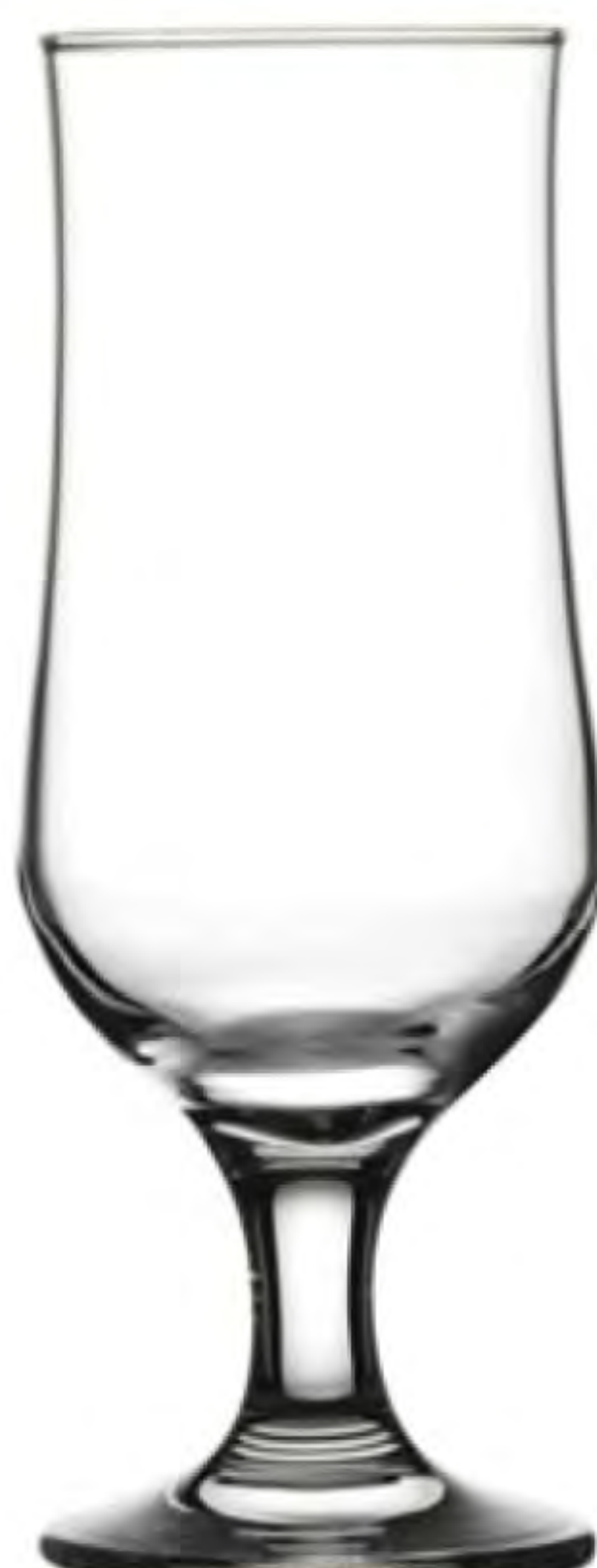
P-44169 370cc 果汁杯 H: 190mm φ: 65mm