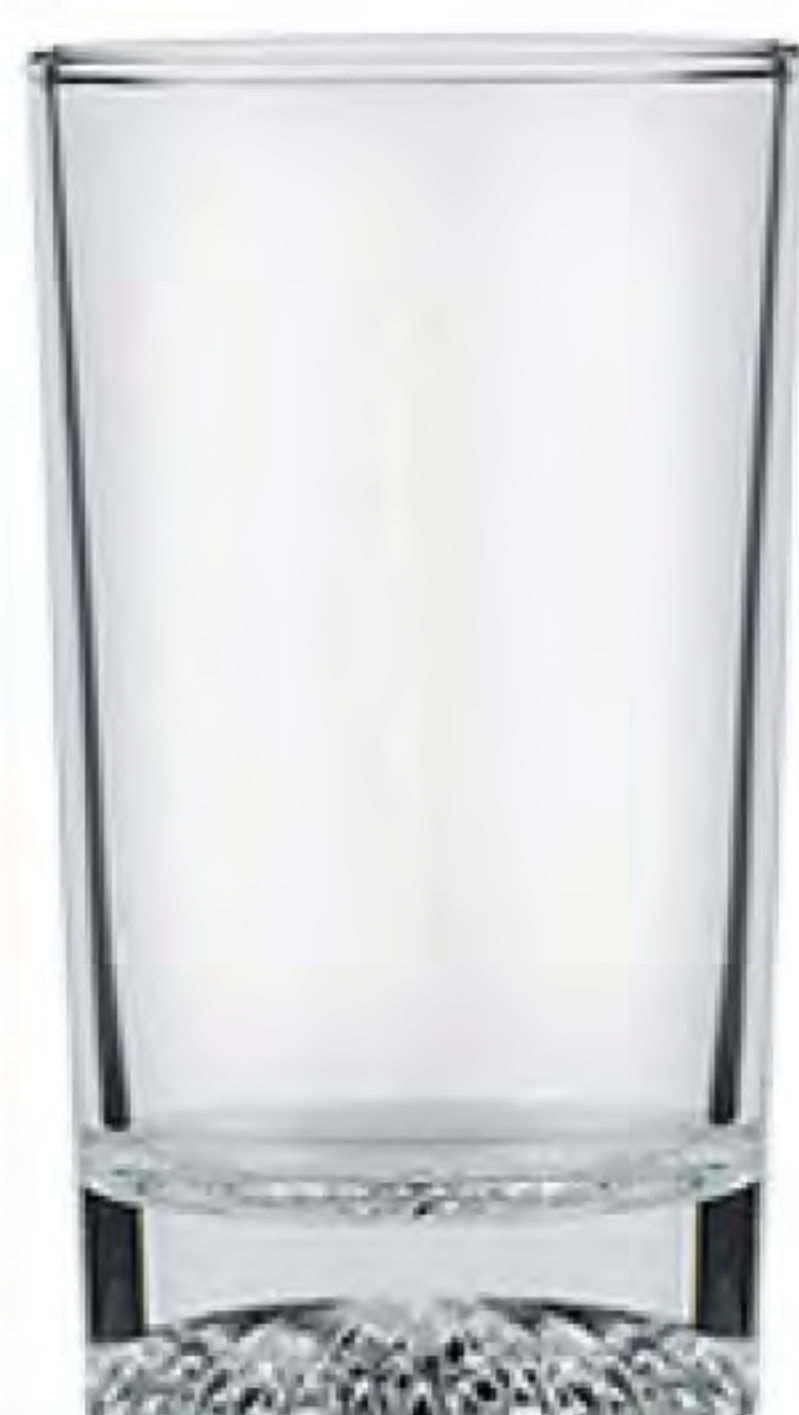
LG-143009 240cc 水杯 H: 120mm φ: 62mm 6X12