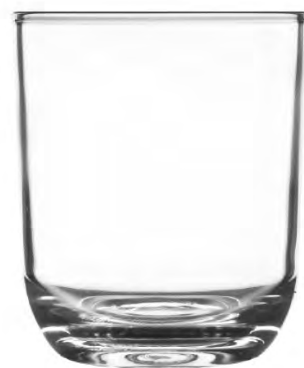
UG-328 224cc 美樂杯 H: 81.7mm φ: 70.7mm 6X12