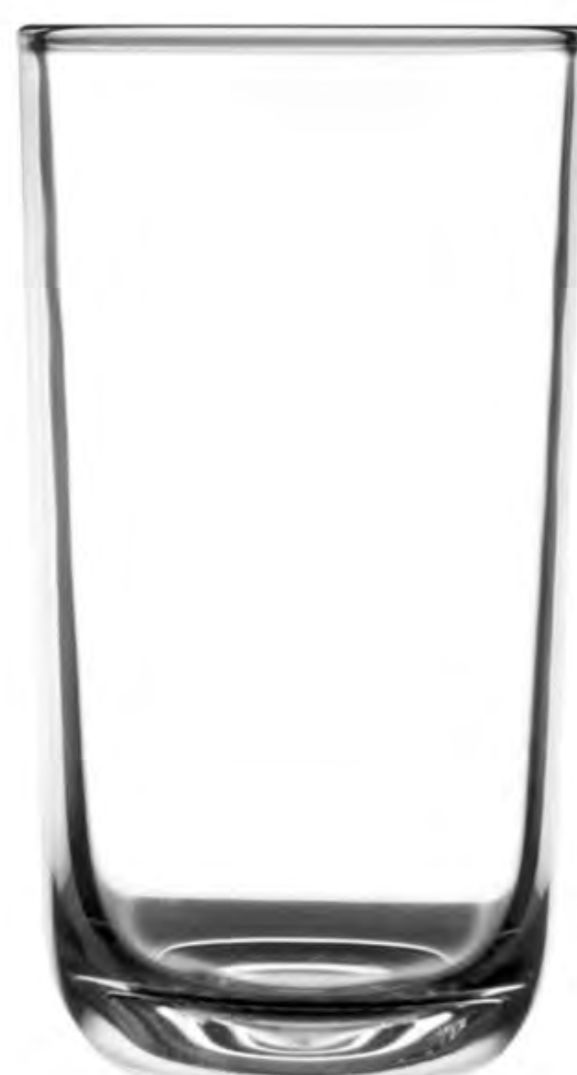
UG-335 280cc 美樂杯 H: 122.8mm φ: 64.8mm