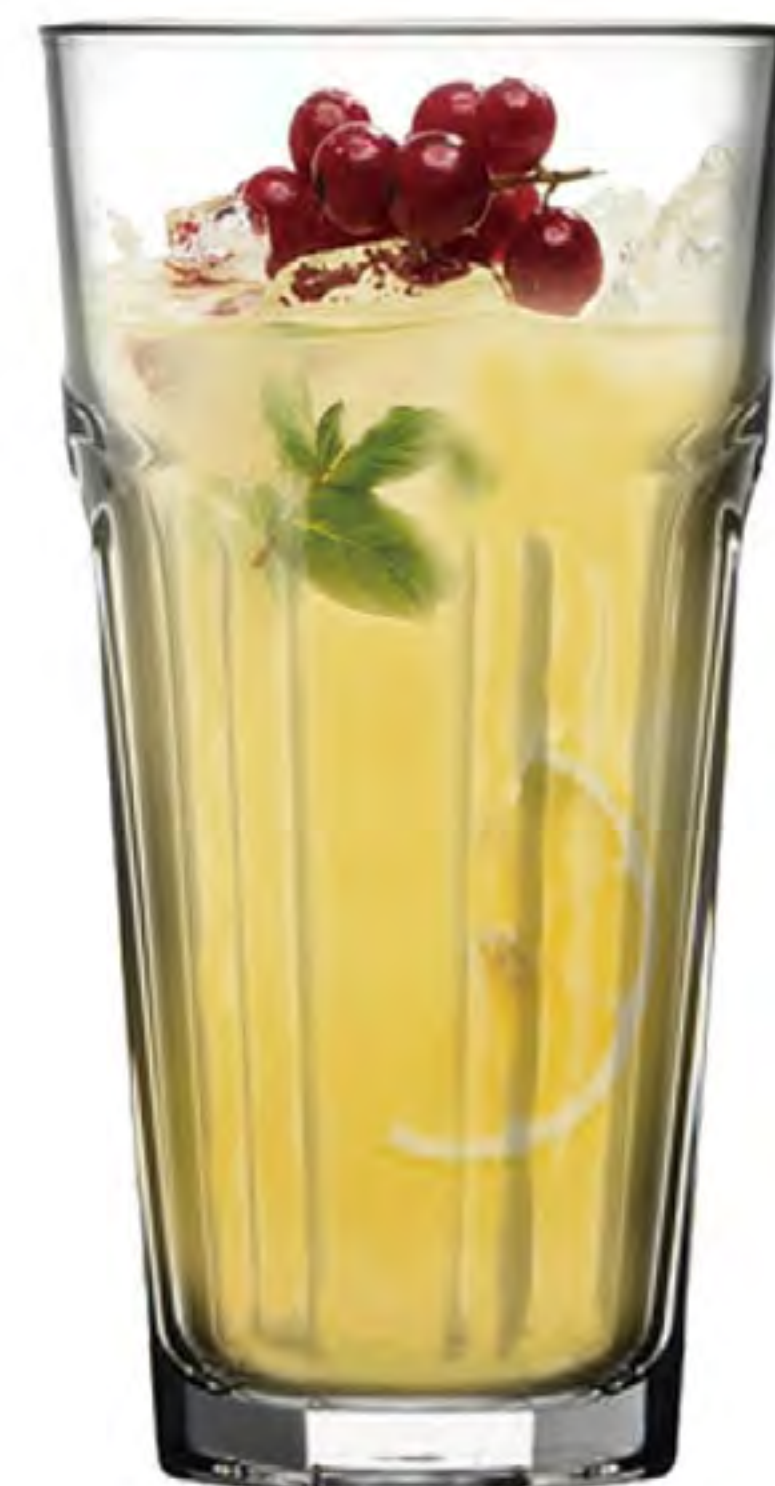
T P-52707 470cc 紅茶杯 H: 162 mm φ: 85 mm