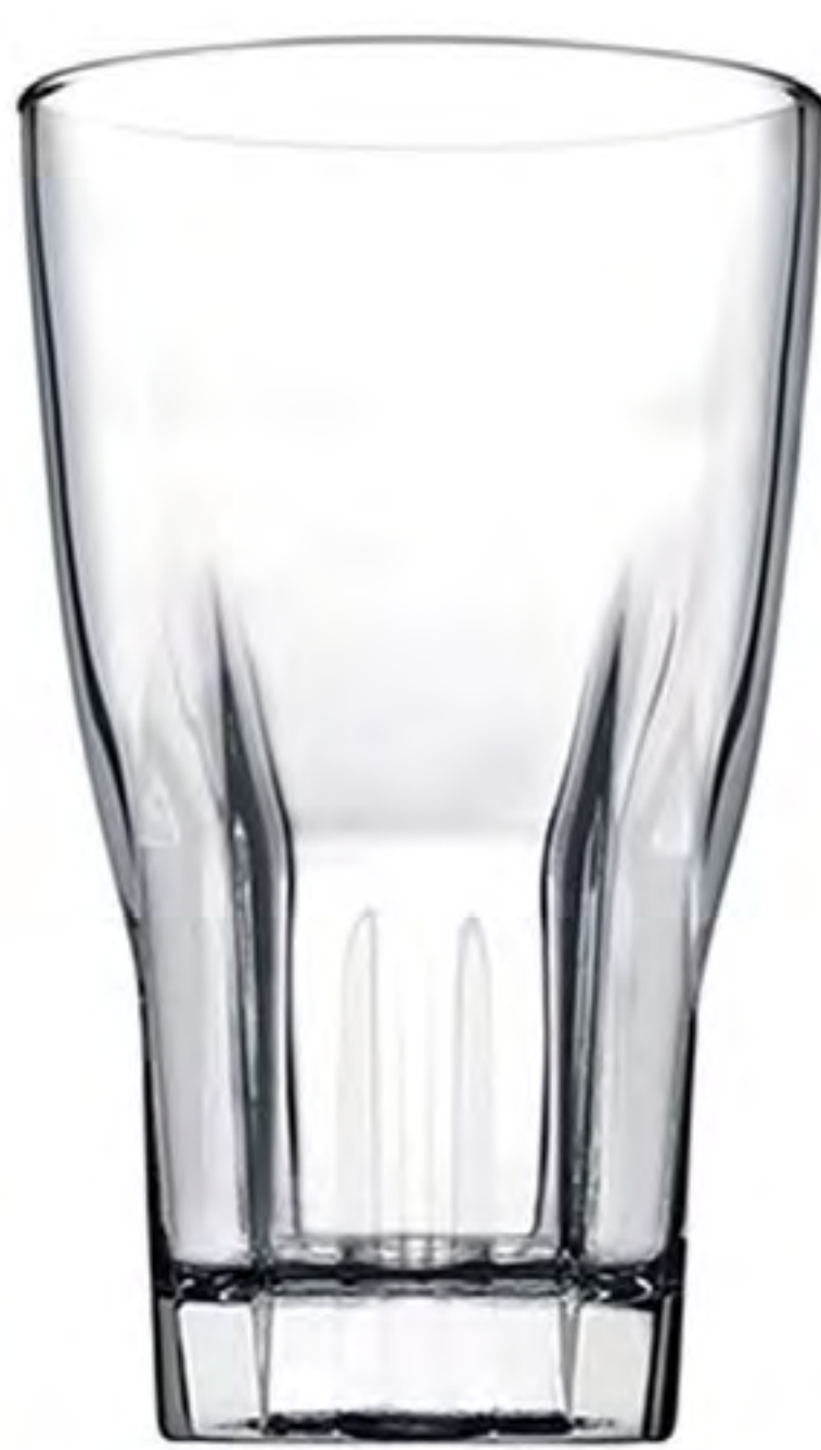
T P-52236 370cc 派對冷飲杯 H: 140 mm. φ: 84 mm