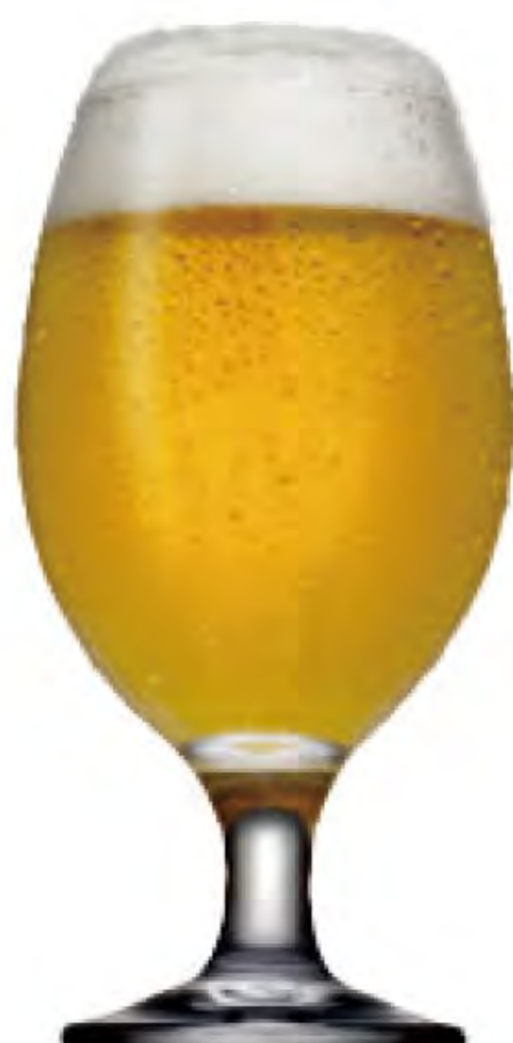
P-44417 400cc 啤酒杯 H: 160mm φ: 68mm