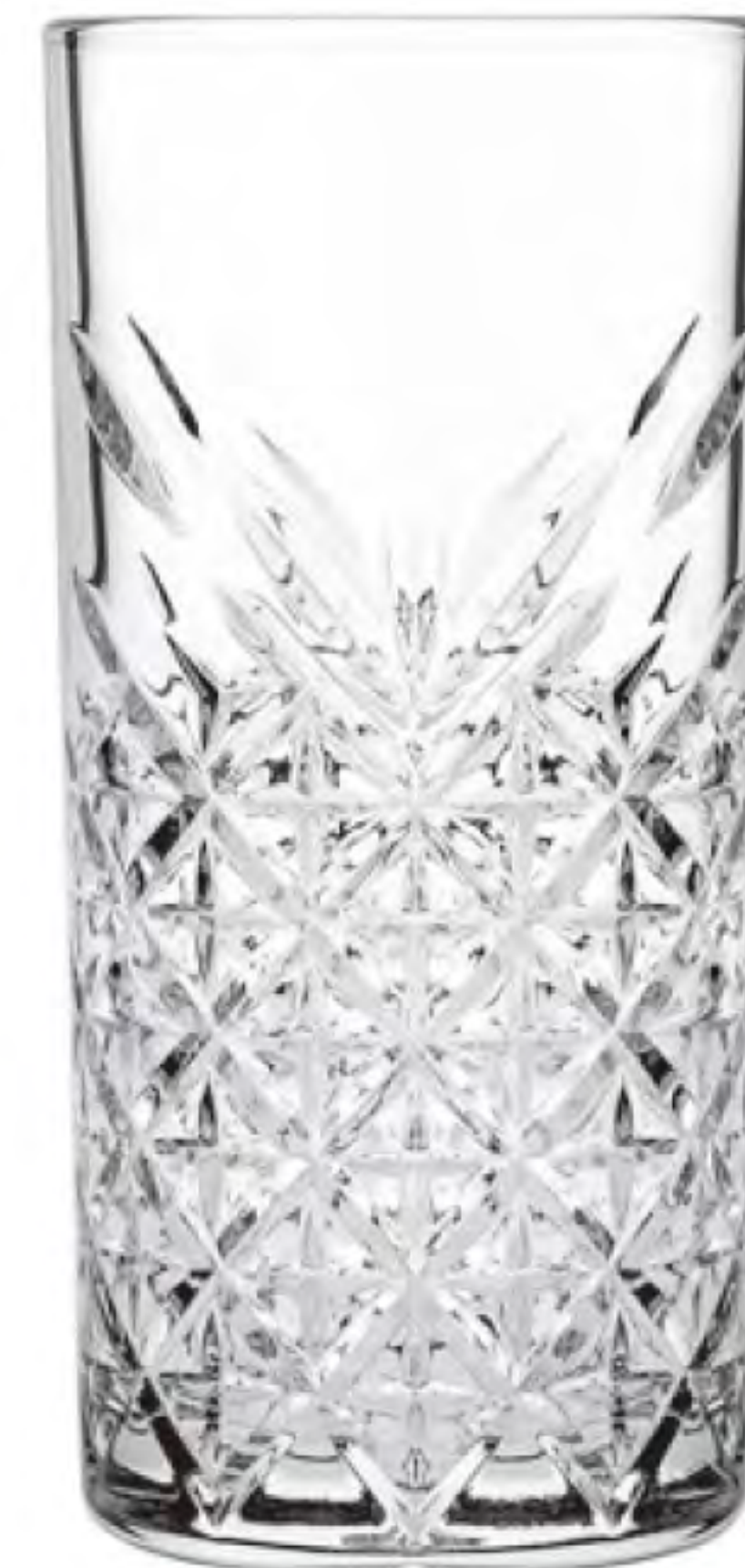
P-52800 450cc 水杯 H:161mm Φ:77.5mm