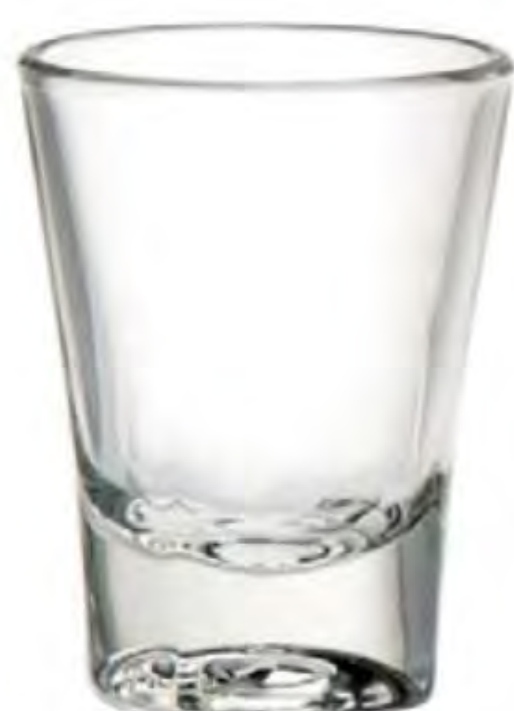
UG-404 63cc 烈酒杯 H: 69mm φ: 53mm 12X12