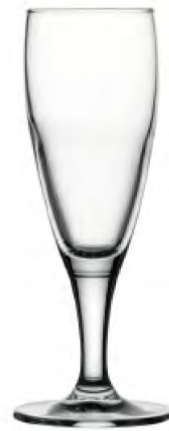
P-44874 105cc 香檳杯 H: 152mm φ: 47mm