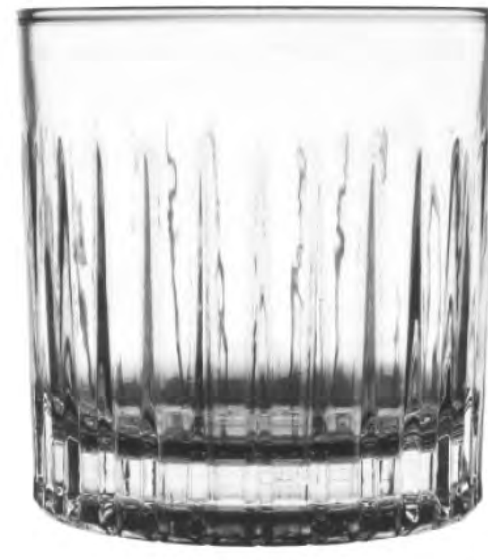
UG-395 302cc 威士忌杯 H: 85mm φ: 82mm 6X12