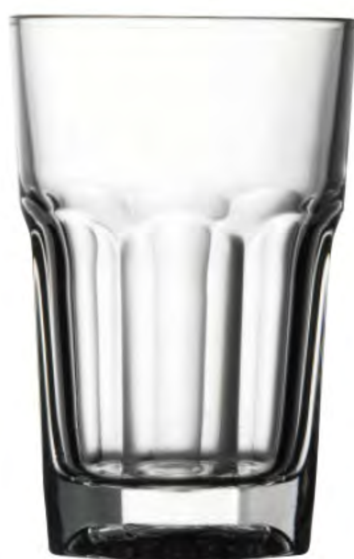
T P-52703 290cc 冰咖啡杯 H: 120 mm φ: 78 mm