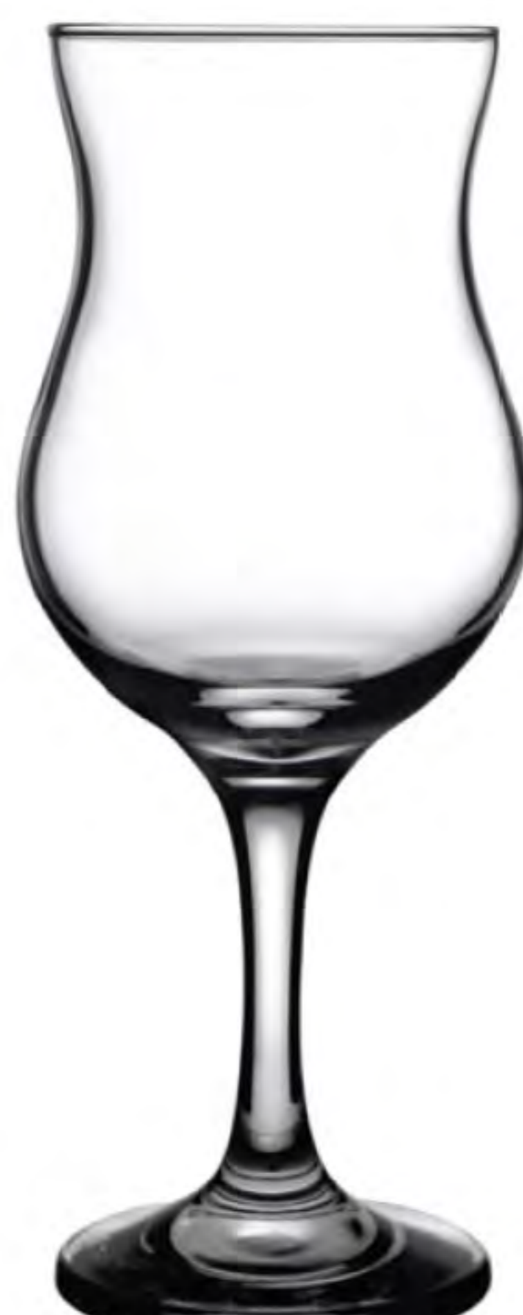
P-440038 375cc 雞尾酒杯 H: 203mm φ: 74mm