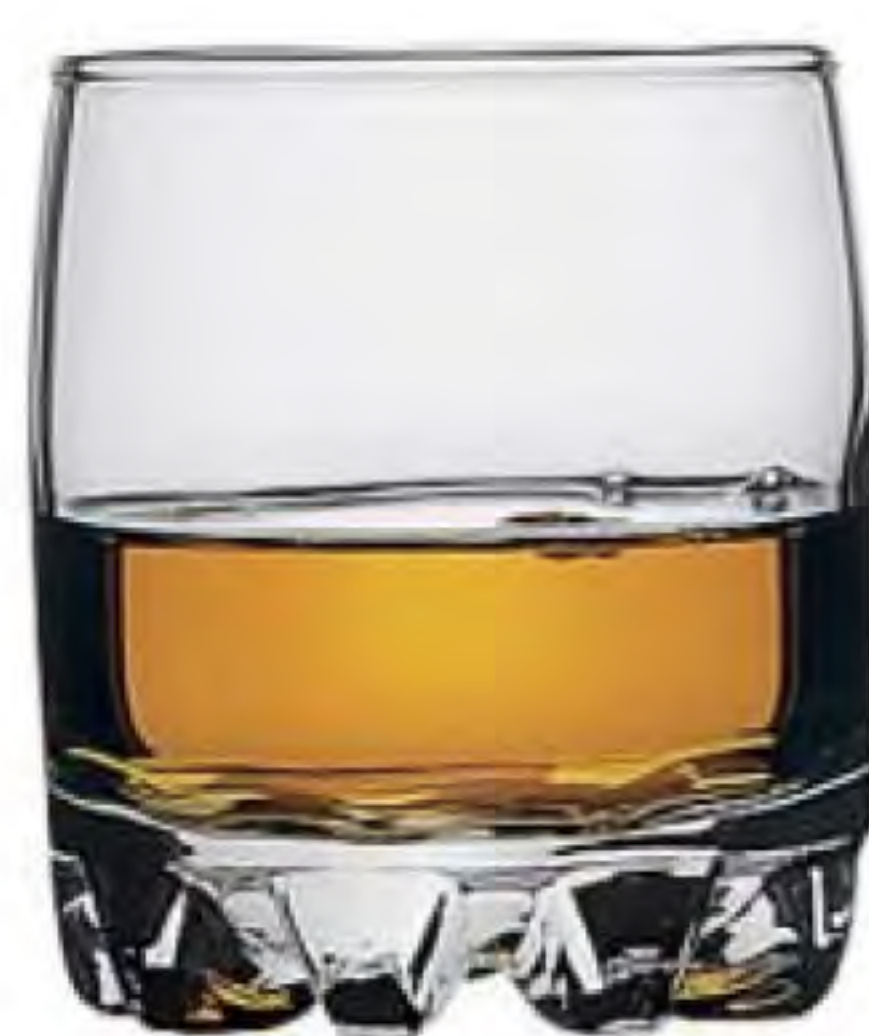
P-42414 200cc 珠底杯 H: 80mm φ: 66mm