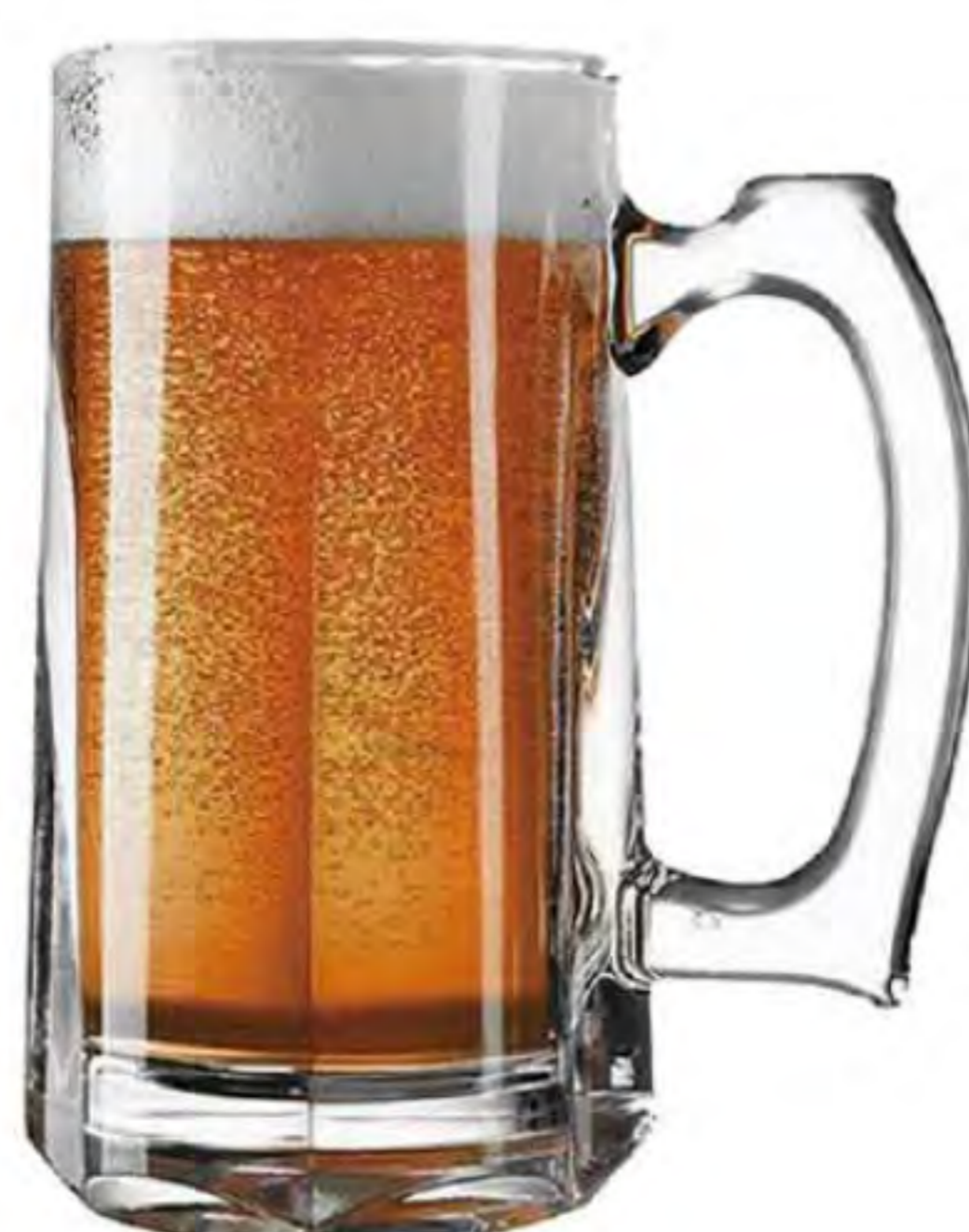
P-55049 355cc 厚底有柄杯 H: 149mm φ: 73mm