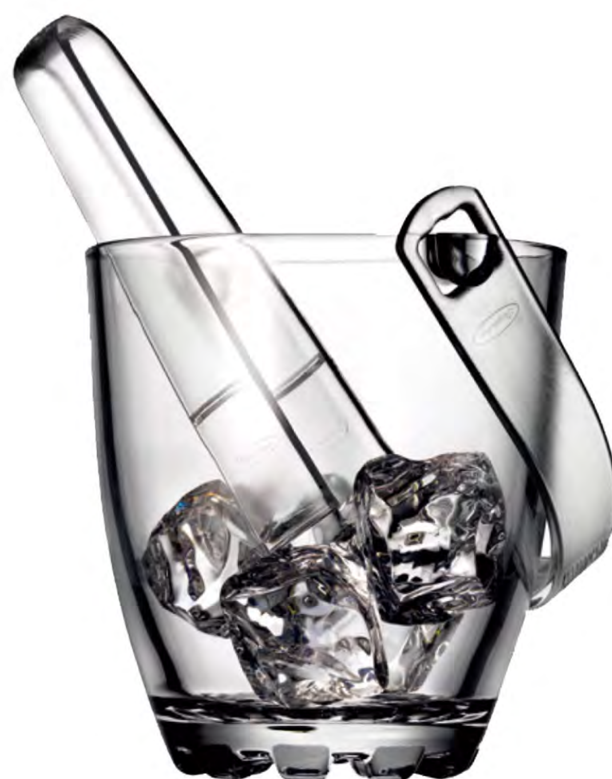
P-53628 珠底冰桶 (附夾) H: 130mm φ: 120mm