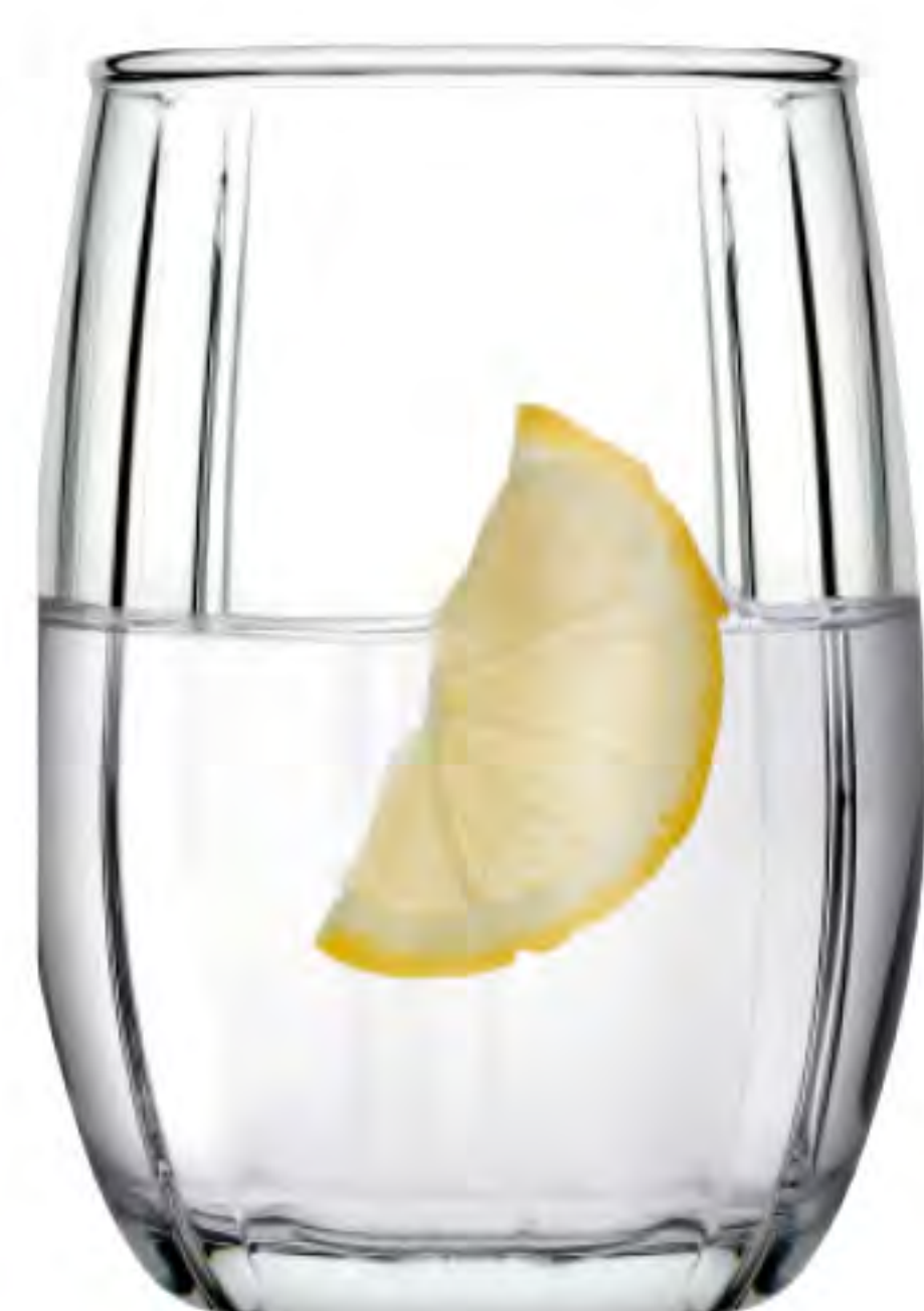
P-420302 240cc 冷飲杯 H: 96mm φ: 59mm