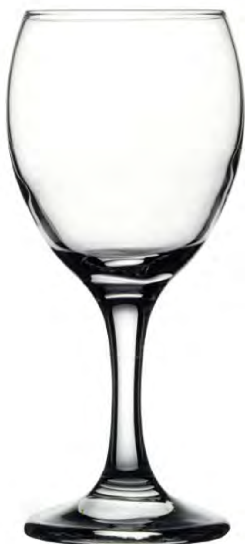
P-44272 340cc 紅酒杯 H: 180mm φ: 71mm