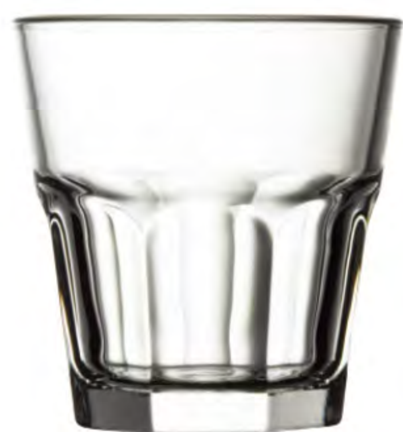
T P-52862 205cc 威士忌杯 H: 82.5 mm φ: 79 mm