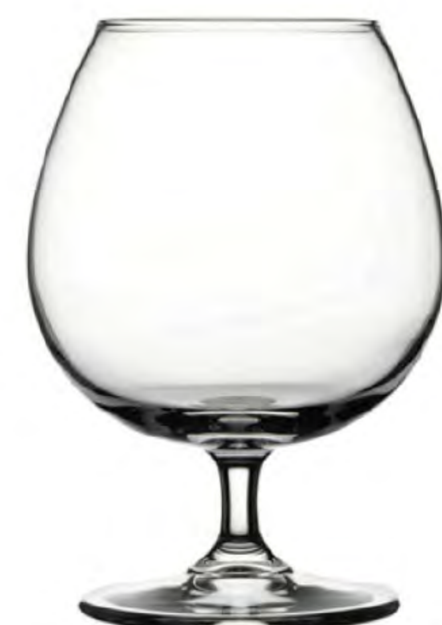
P-44825 543cc 啤酒杯 H: 143mm φ: 66.5mm