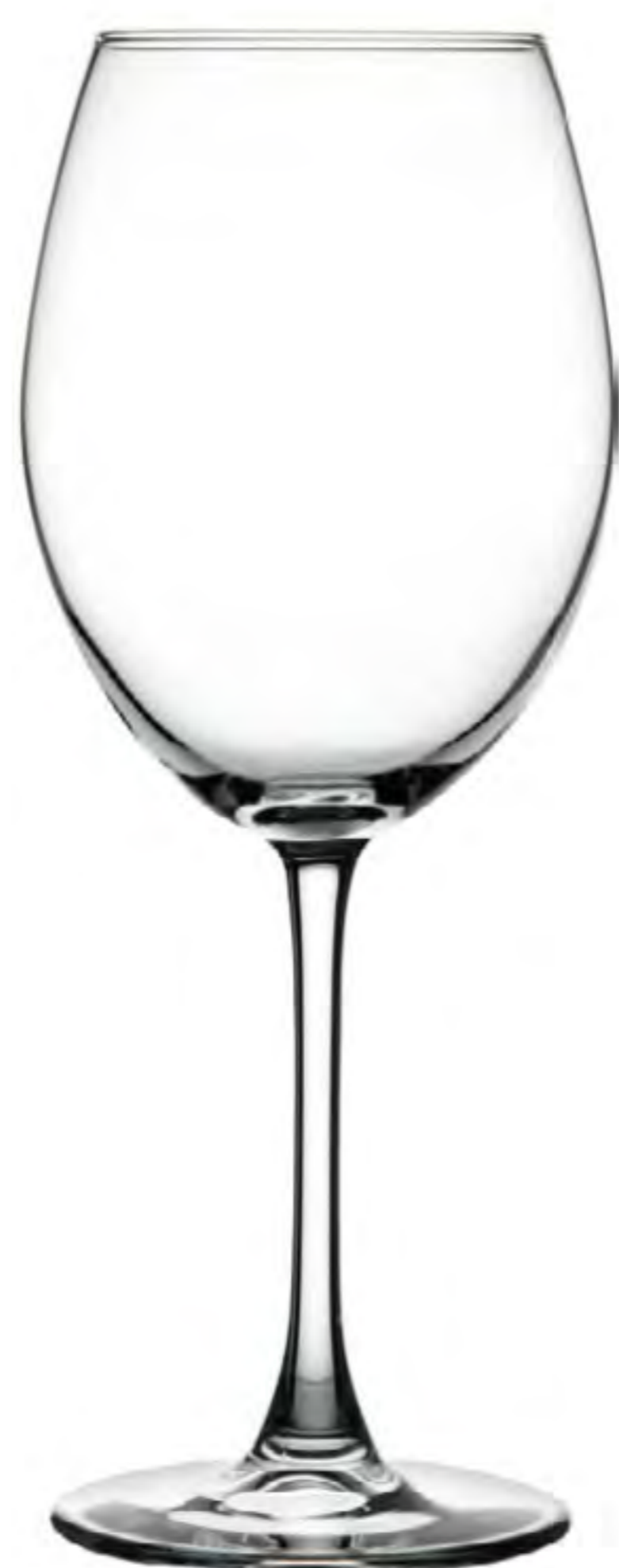
P-44738 615cc 紅酒杯 H: 238mm φ: 72mm