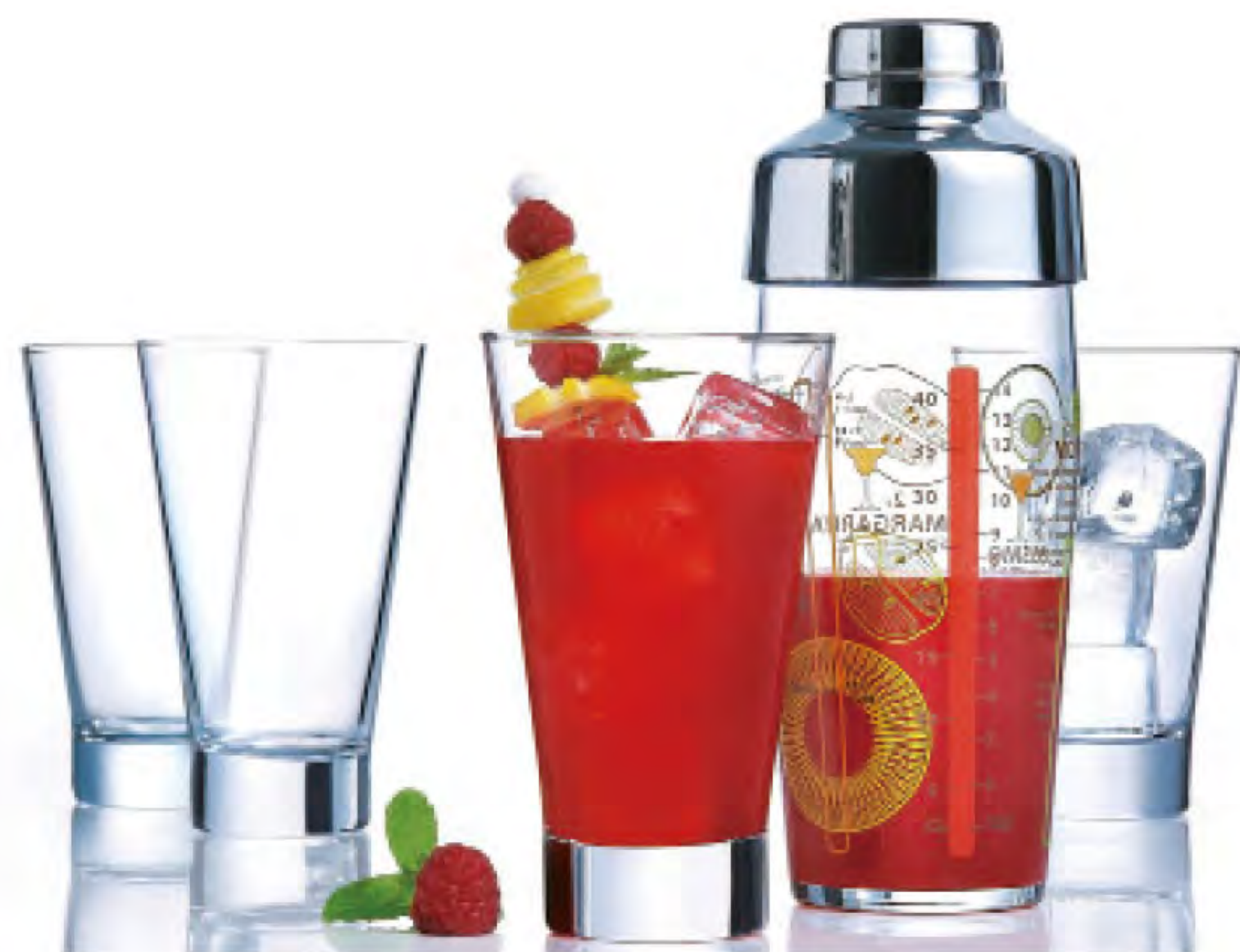
J3334 調酒套裝組 杯 : 300cc H : 138mm 雪克杯 : 585cc H : 160.5mm