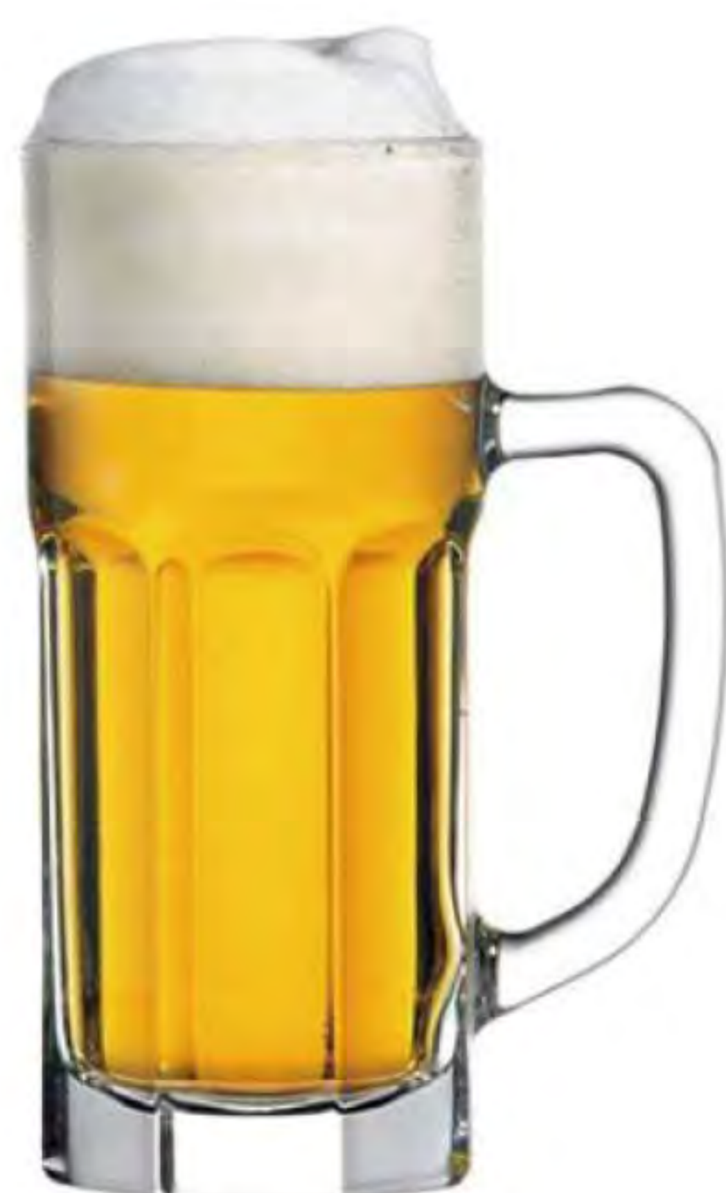
P-55369 685cc 卡沙巴蘭卡啤酒杯 H: 197mm φ: 86mm