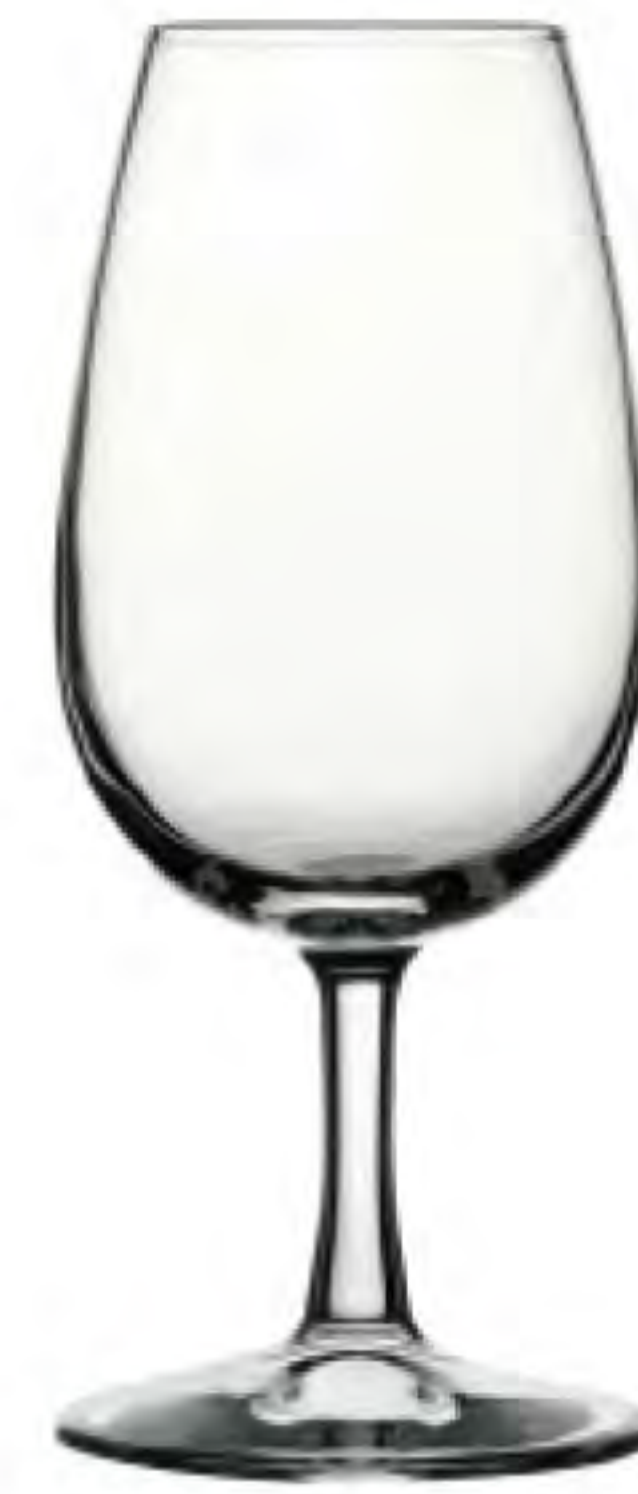
P-440037 215cc 品酒杯 H: 155mm φ: 47mm