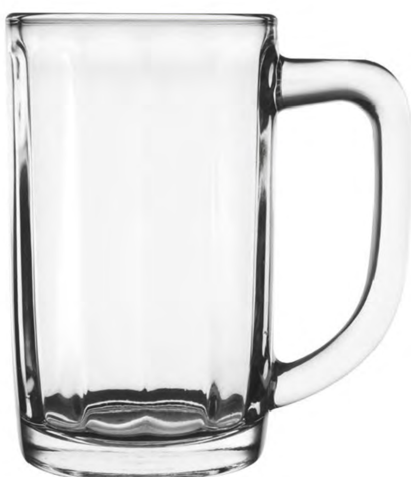
UG-366 500cc 有柄杯 H: 138.50mm φ:80.80mm