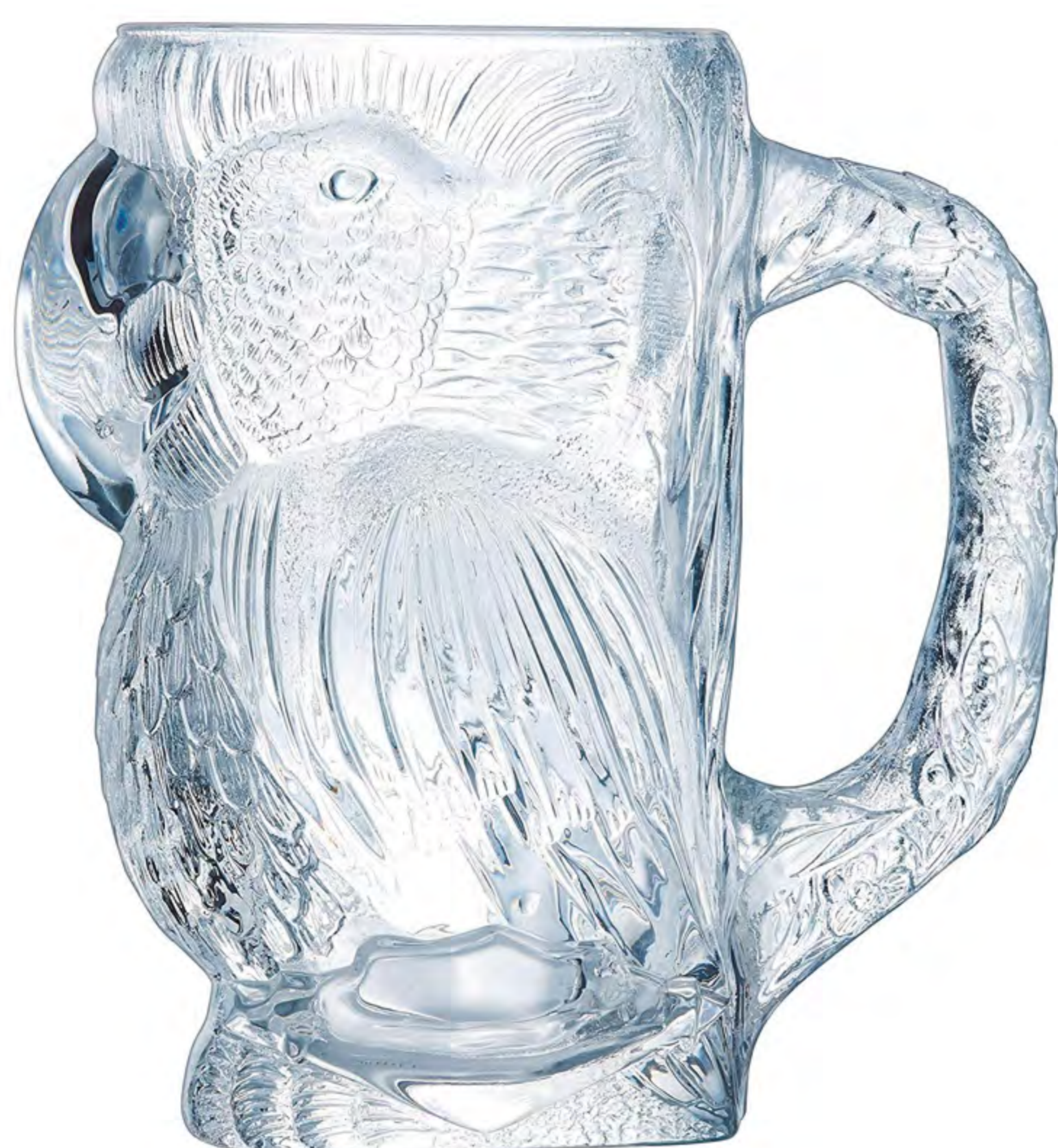
N-6647 900cc 造型啤酒杯 H : 190mm φ : 176mm