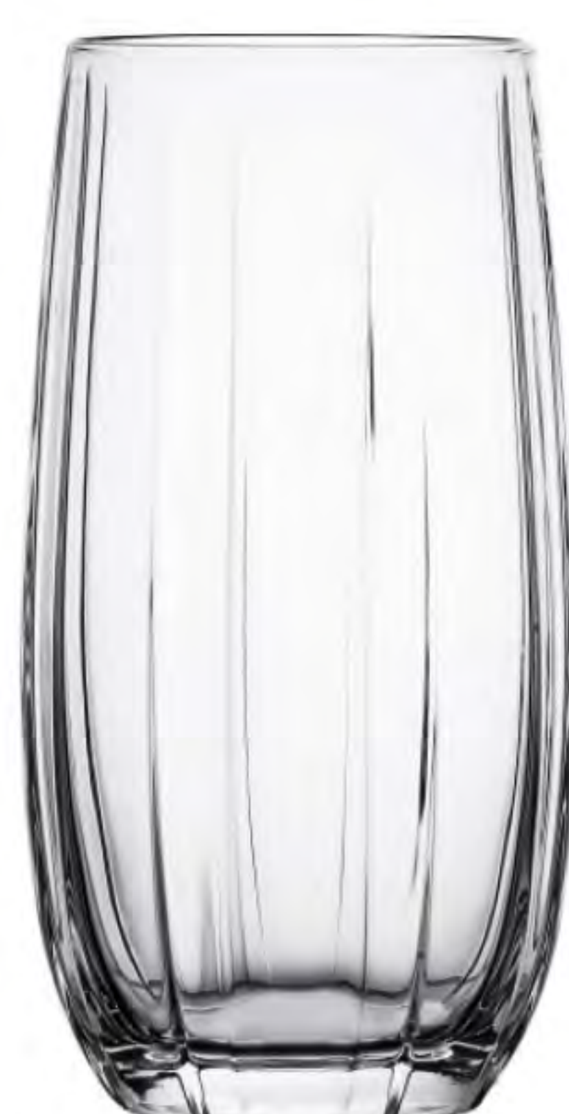
P-420415 500cc 冷飲杯 H: 150mm φ: 65mm