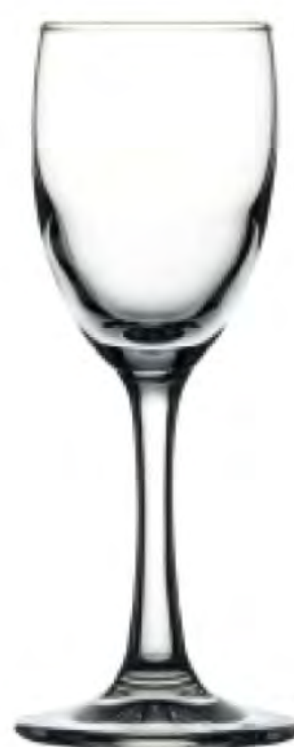
P-44929 75cc 烈酒杯 H: 139mm φ: 45mm