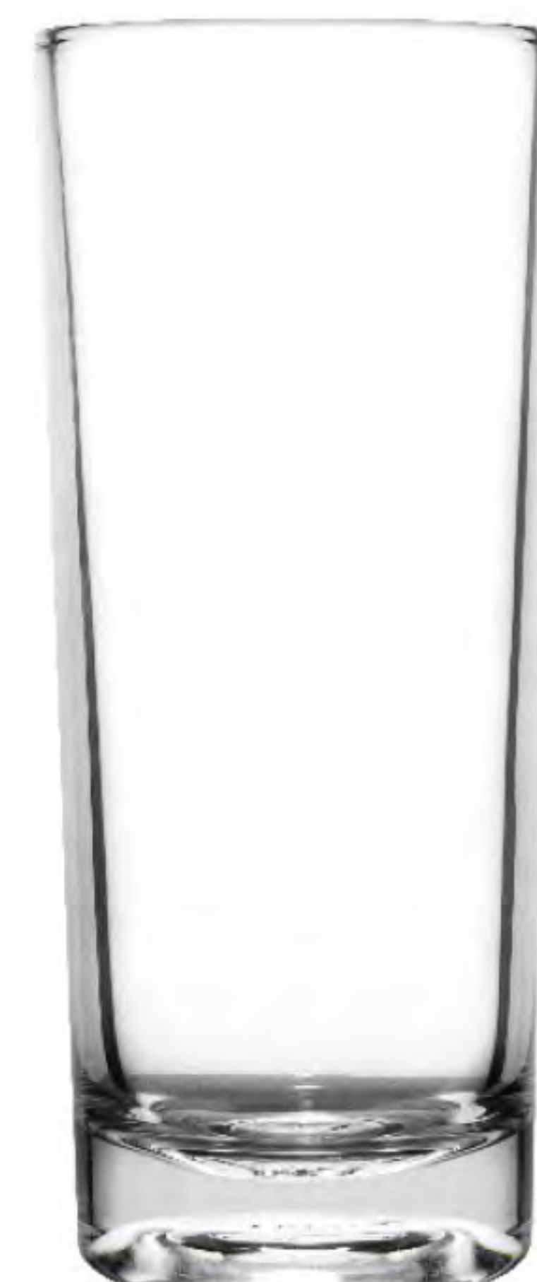
UG-393 260cc 水杯 H: 148.50mm φ: 58.80mm 6X12