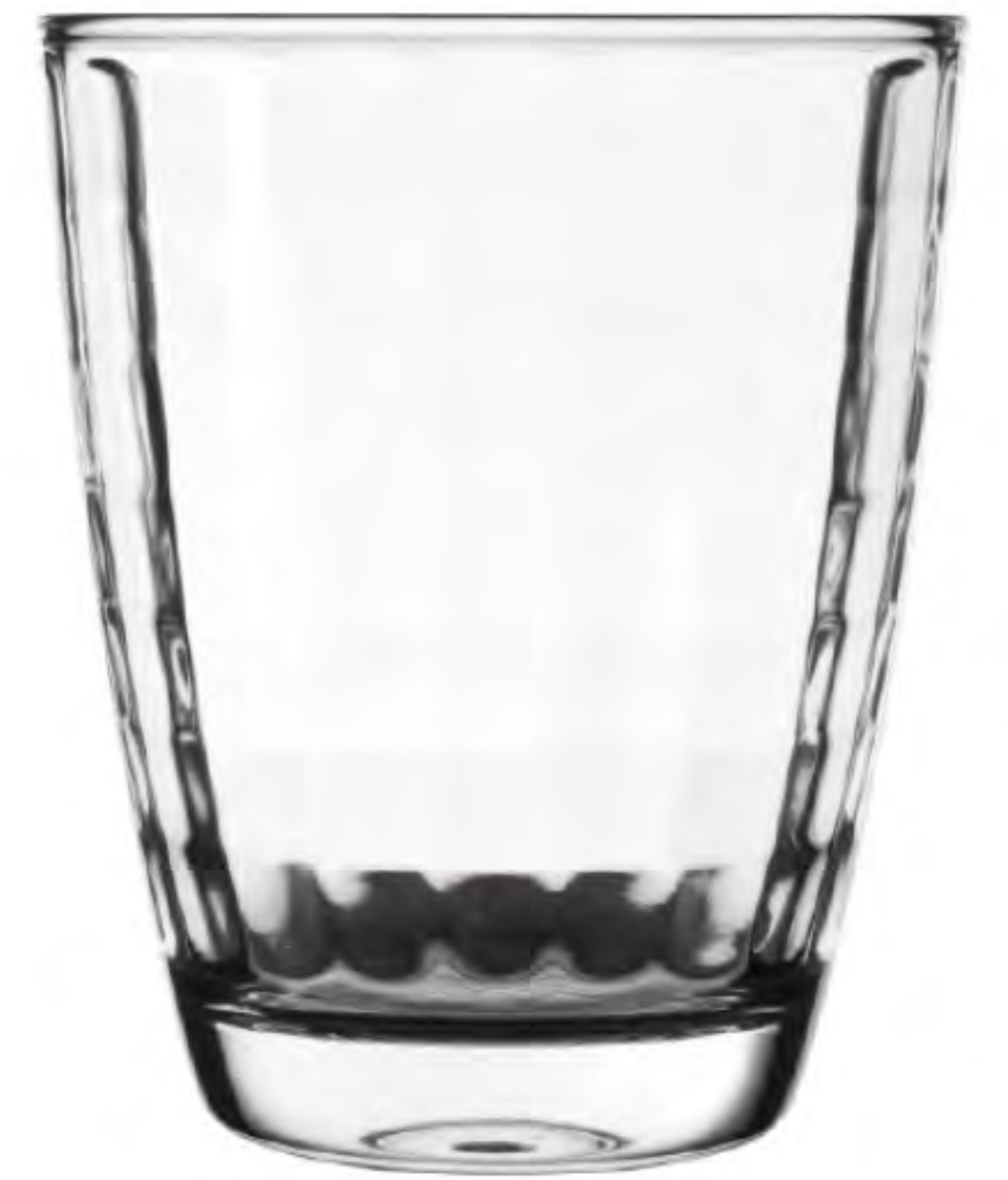
UG-374 264cc 水杯 H: 97mm φ: 79mm 6X12