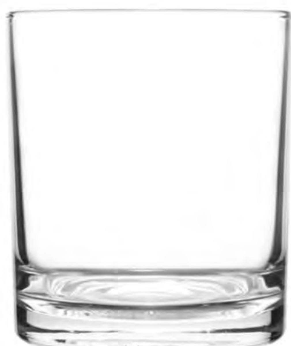
UG-327 263cc 北歐杯 H: 83.8mm φ: 69.8mm 6X12