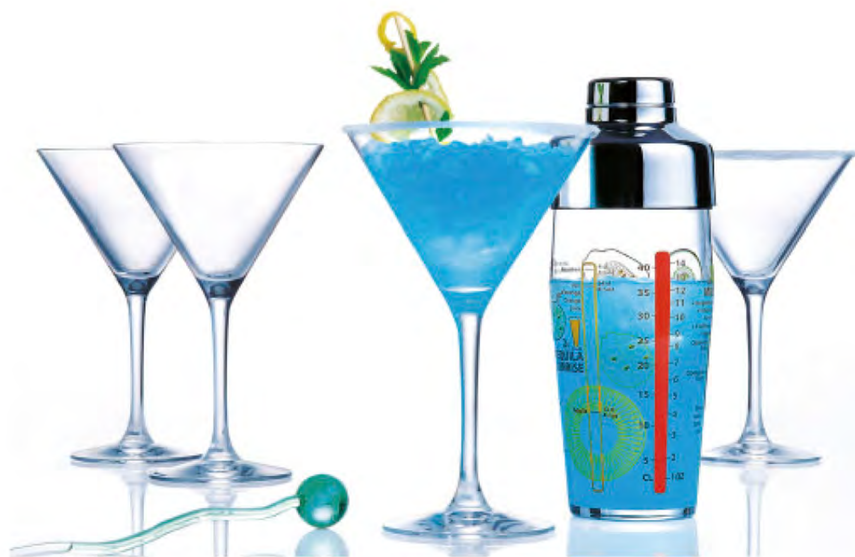
H-8930 雞尾酒套裝組 杯 : 300cc H : 188mm 雪克杯 : 585cc H : 160.5mm