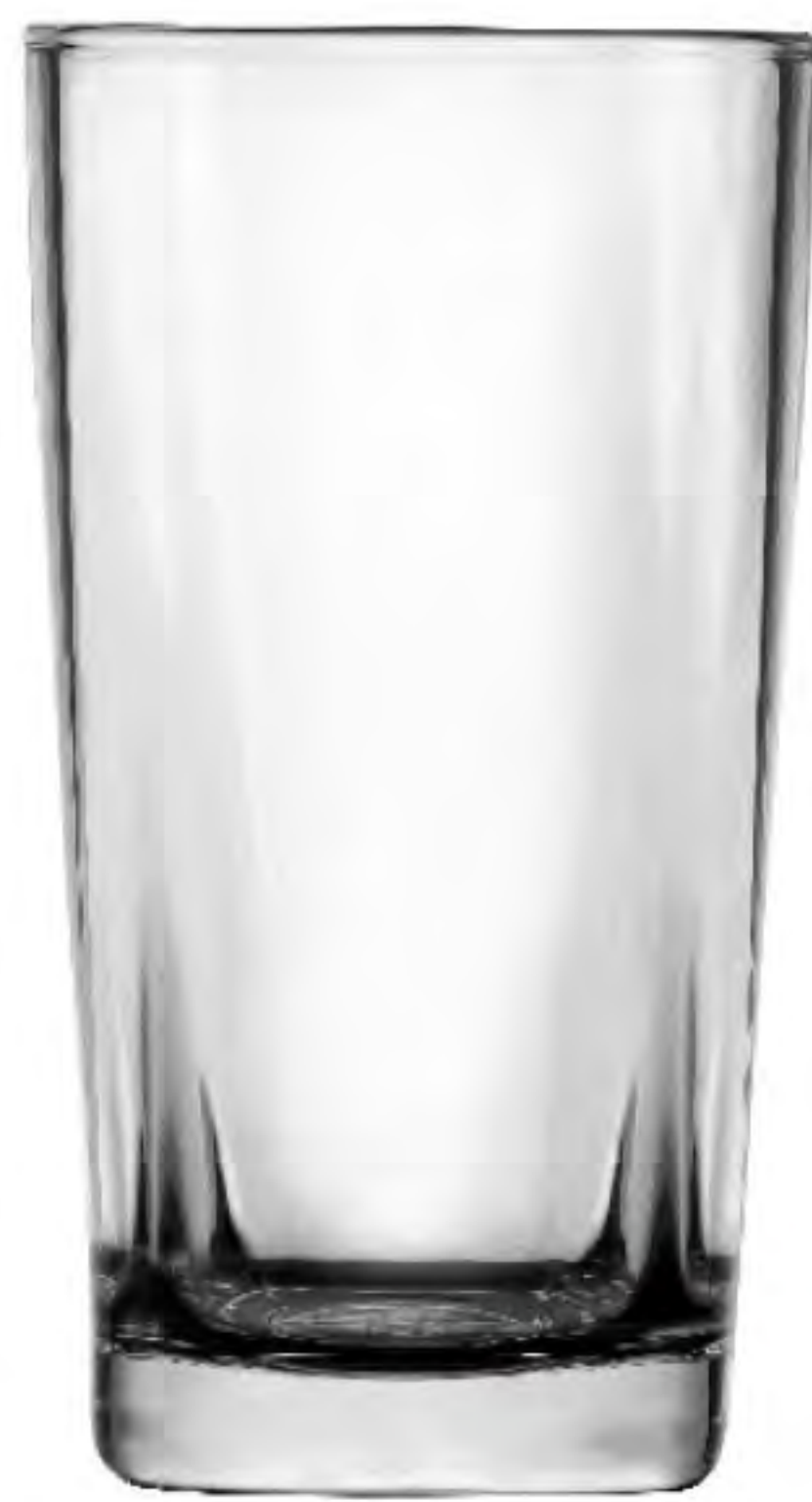
LG-100410 295cc 水杯 H: 125mm φ: 69mm 6X12