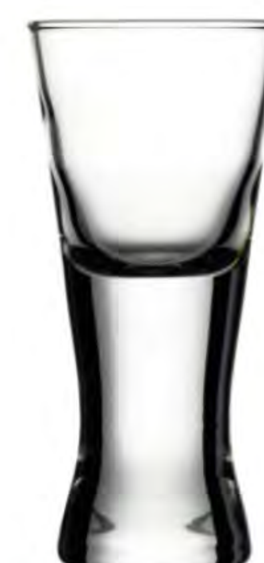
P-42584 46cc 烈酒杯 H: 95mm φ: 42mm