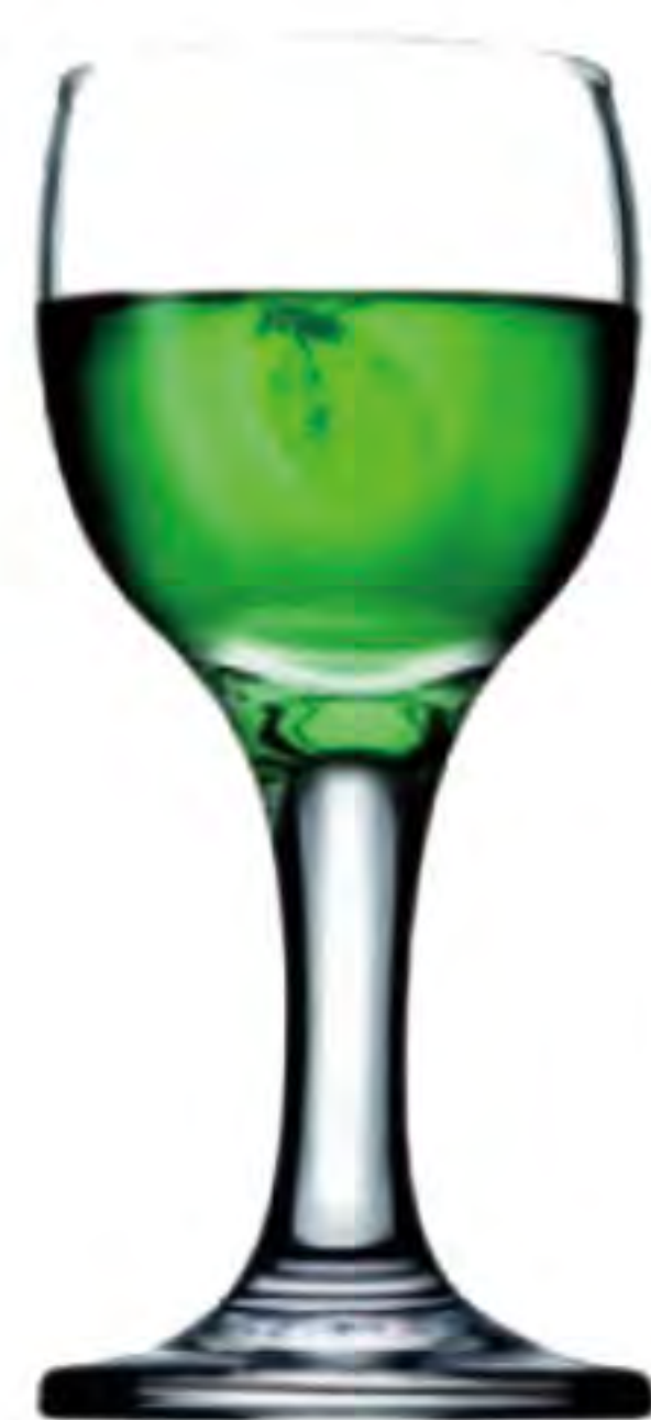
P-44134 60cc 烈酒杯 H: 112mm φ: 45mm