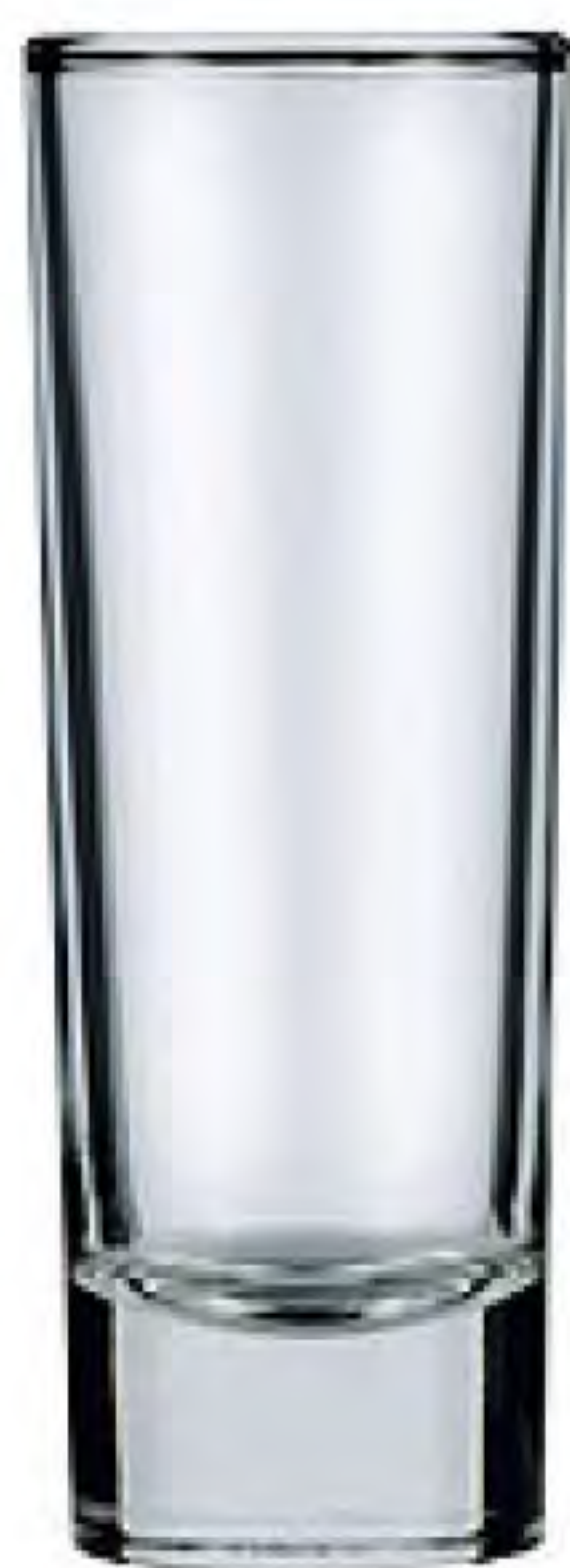
LG-440302 60cc 清酒杯 H: 104.70mm φ: 38mm 12X12