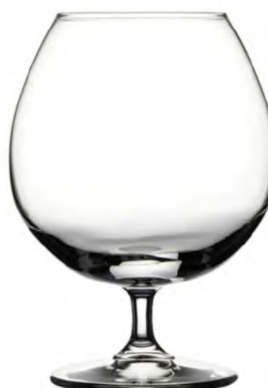
P-44835 680cc 啤酒杯 H: 149mm φ: 70mm