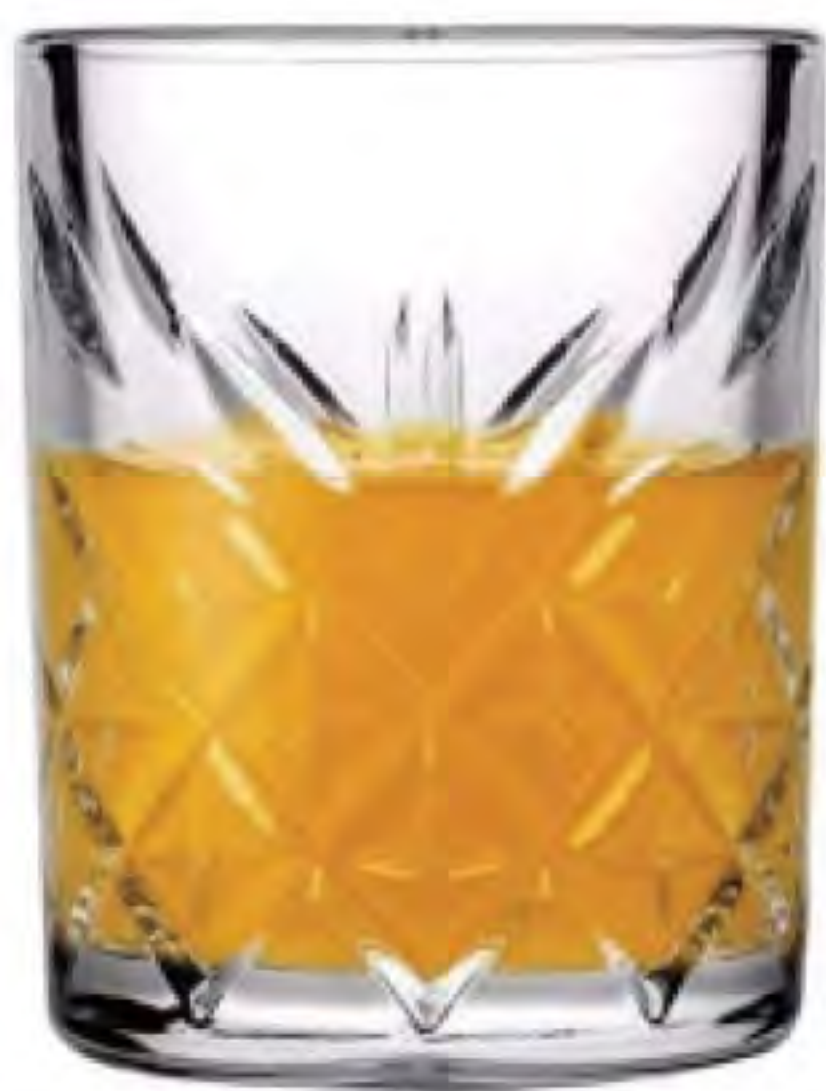
P-52780 60cc 烈酒杯 H:61.5mm Φ:48.5mm