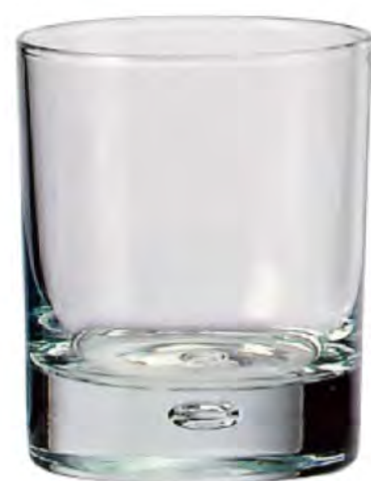
P-42535 184cc 珠底點杯 H: 83mm φ: 68.5mm