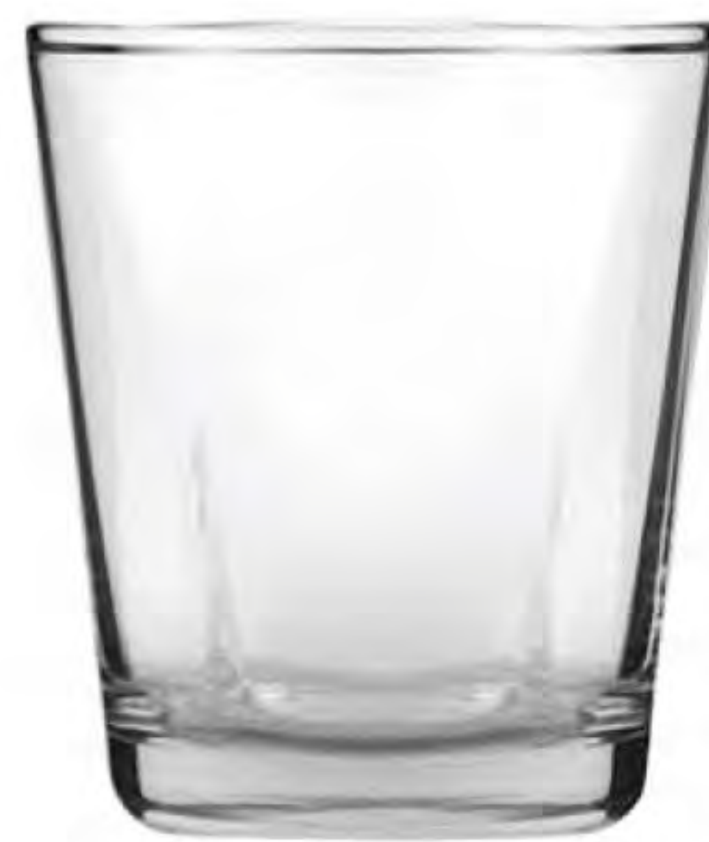
LG-100409 270cc 方底水杯 H: 88mm φ: 81mm 6X12