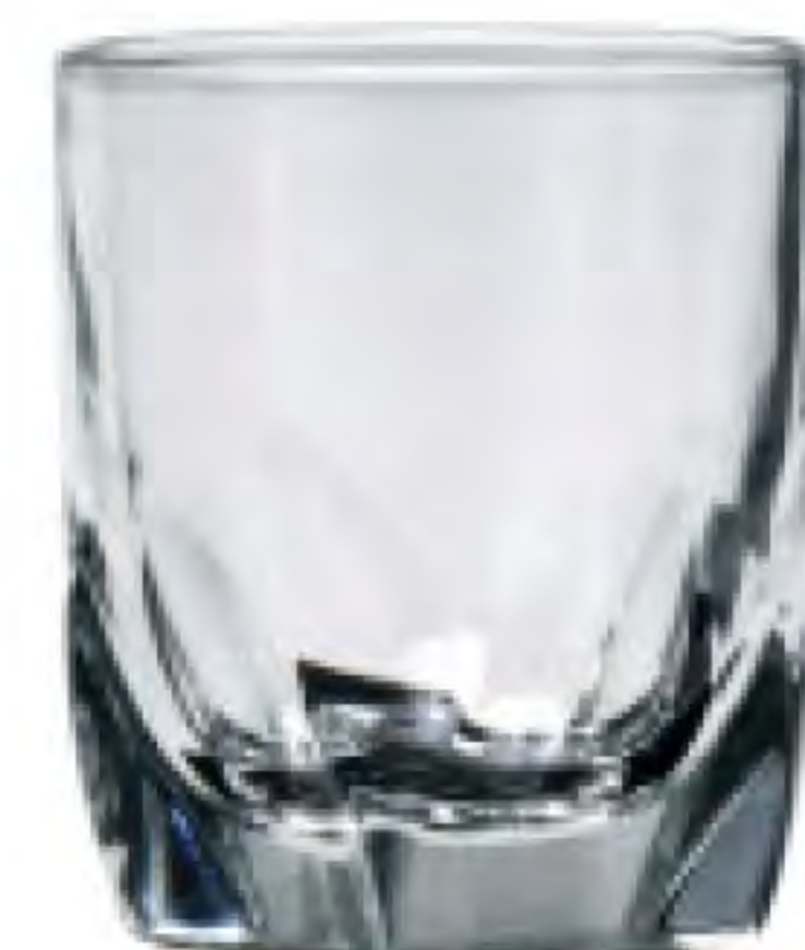
LG-440902 45cc 烈酒杯 H: 55mm φ: 47mm 12X12