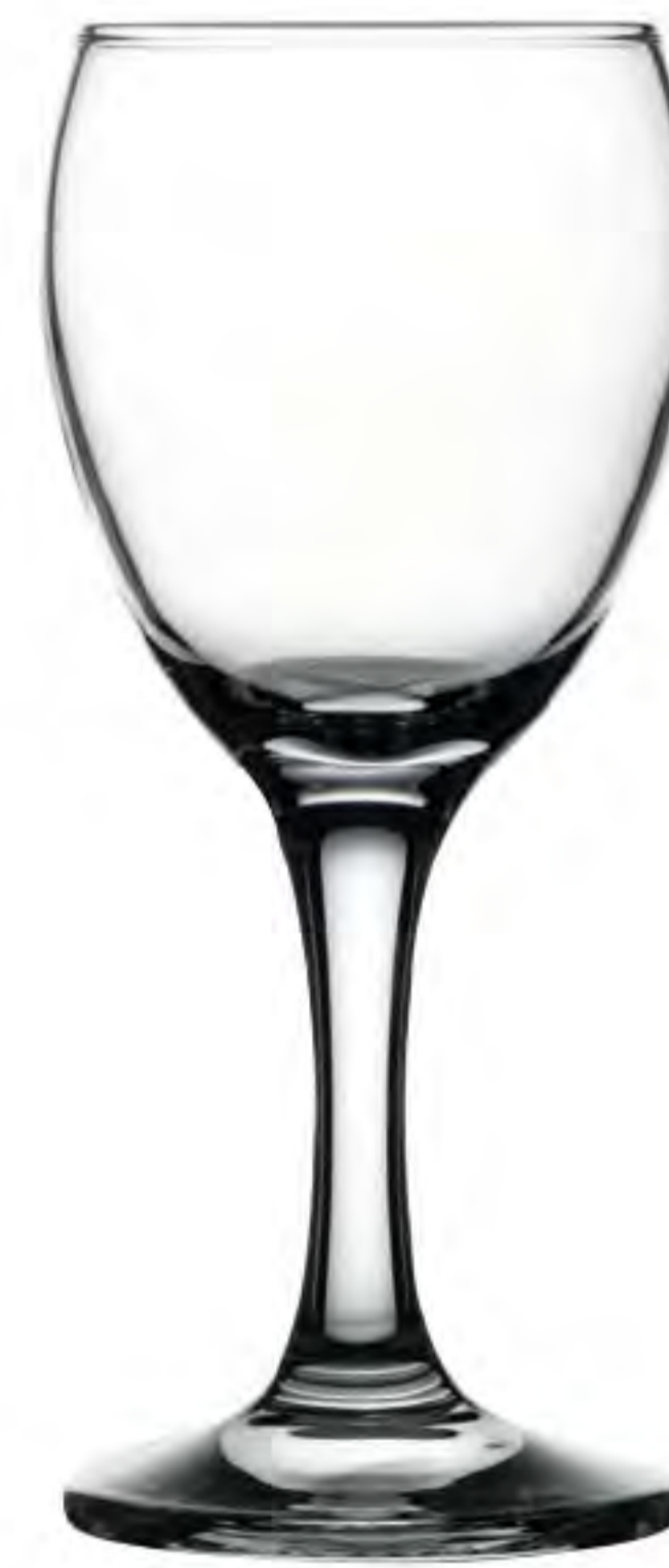
P-44705 200cc 紅酒杯 H: 160mm φ: 60mm