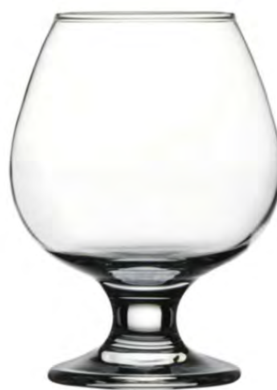
P-44188 385cc 白蘭地 H: 124mm φ: 60mm