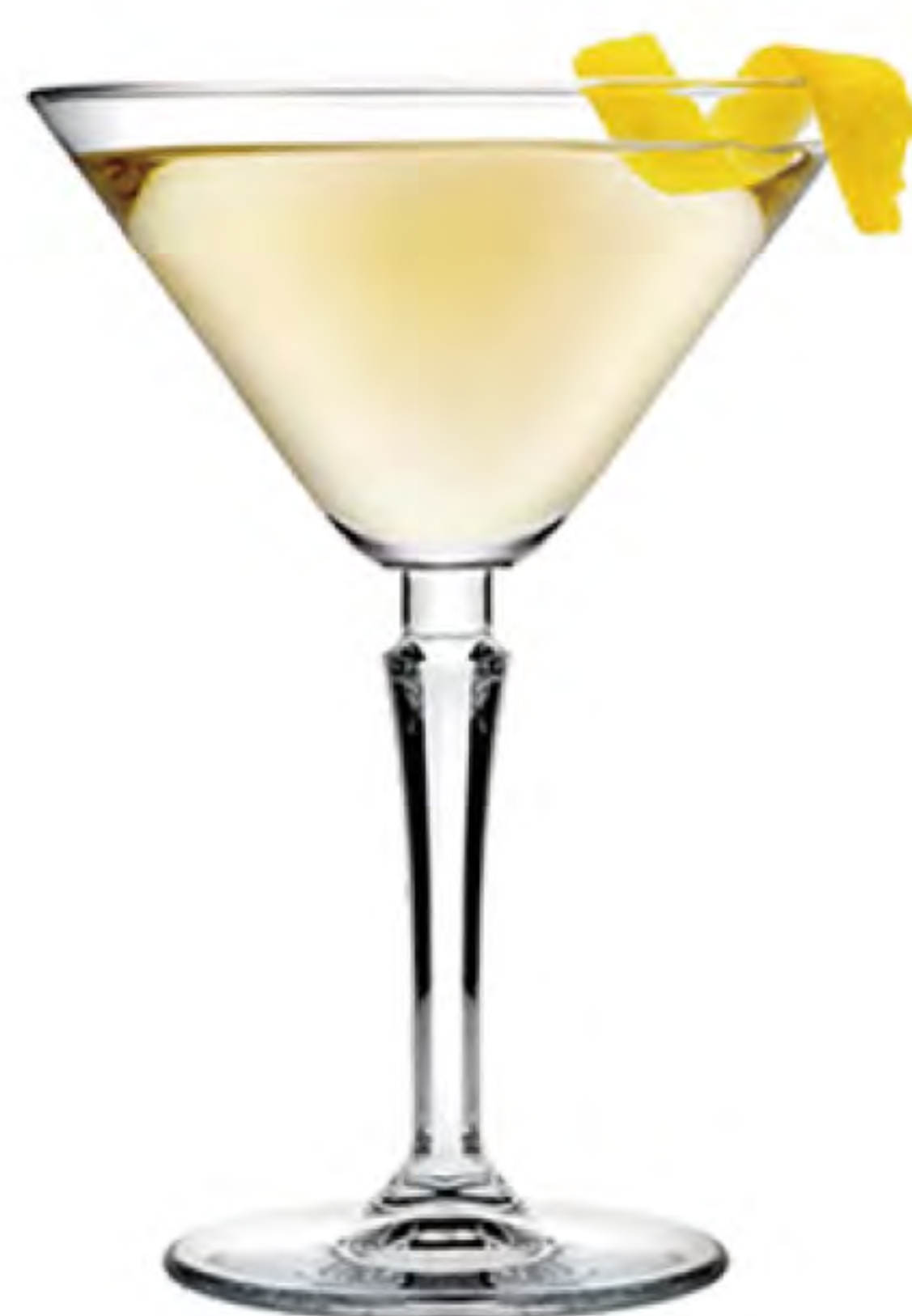
P-440263 230cc 馬丁尼杯 H:163mm Φ:114mm