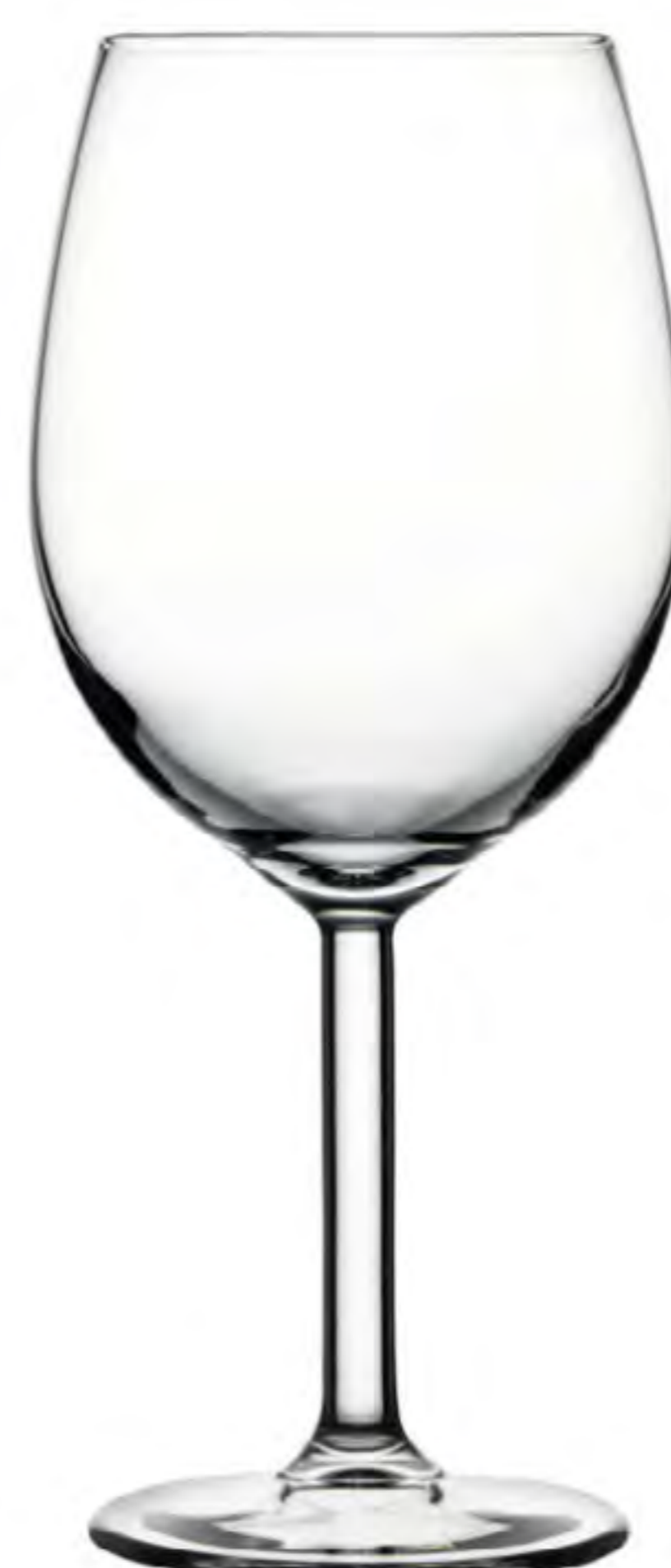
P-44984 525cc 紅酒杯 H: 215mm φ: 70mm