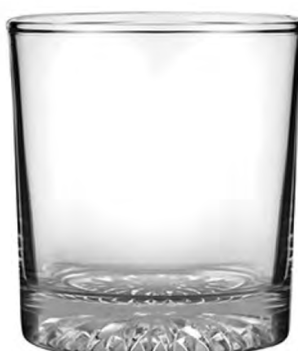
LG-143509 255cc 水杯 H: 75.5mm φ: 85mm 6X12