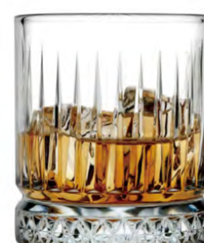
P-520014 210cc 威士忌酒杯 H:85mm Φ:73mm