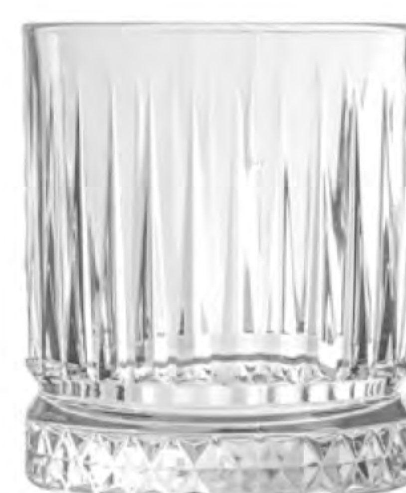
P-520004 355cc 威士忌酒杯 H:98mm Φ:84mm