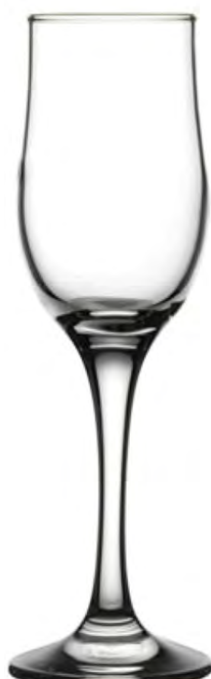
P-44160 200cc 香檳杯 H: 205mm φ: 53mm