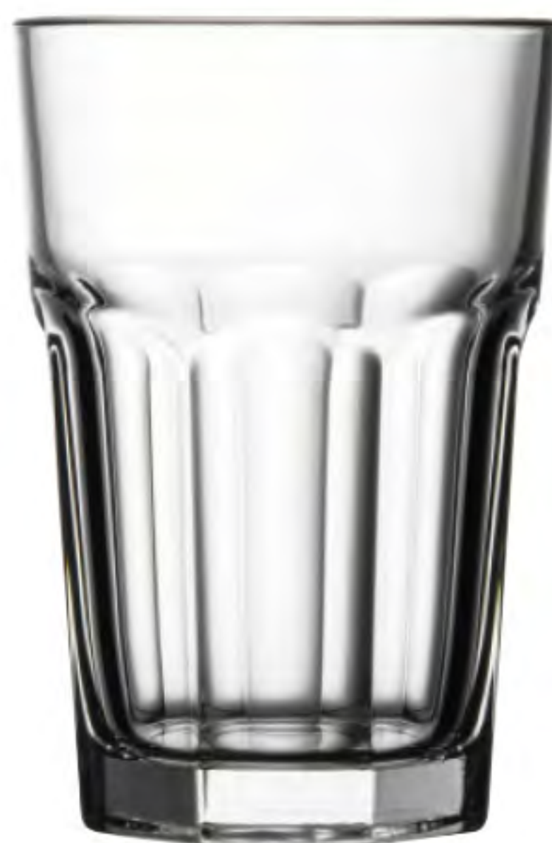
T P-52708 361cc 冰咖啡杯 H: 122 mm φ: 82 mm