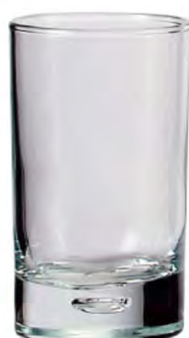
P-42474 95cc 珠底點杯 H: 93mm φ: 46mm