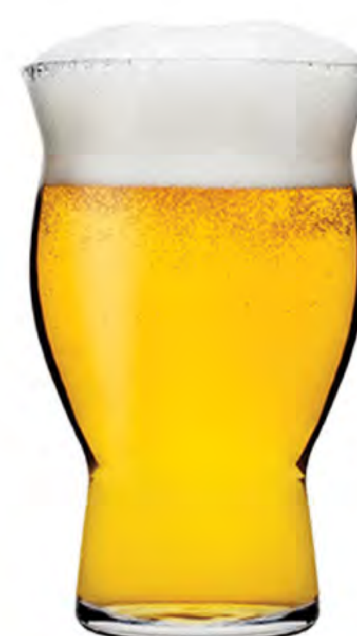
T P-420108 480cc 里維爾啤酒杯 H: 144mm φ: 90mm