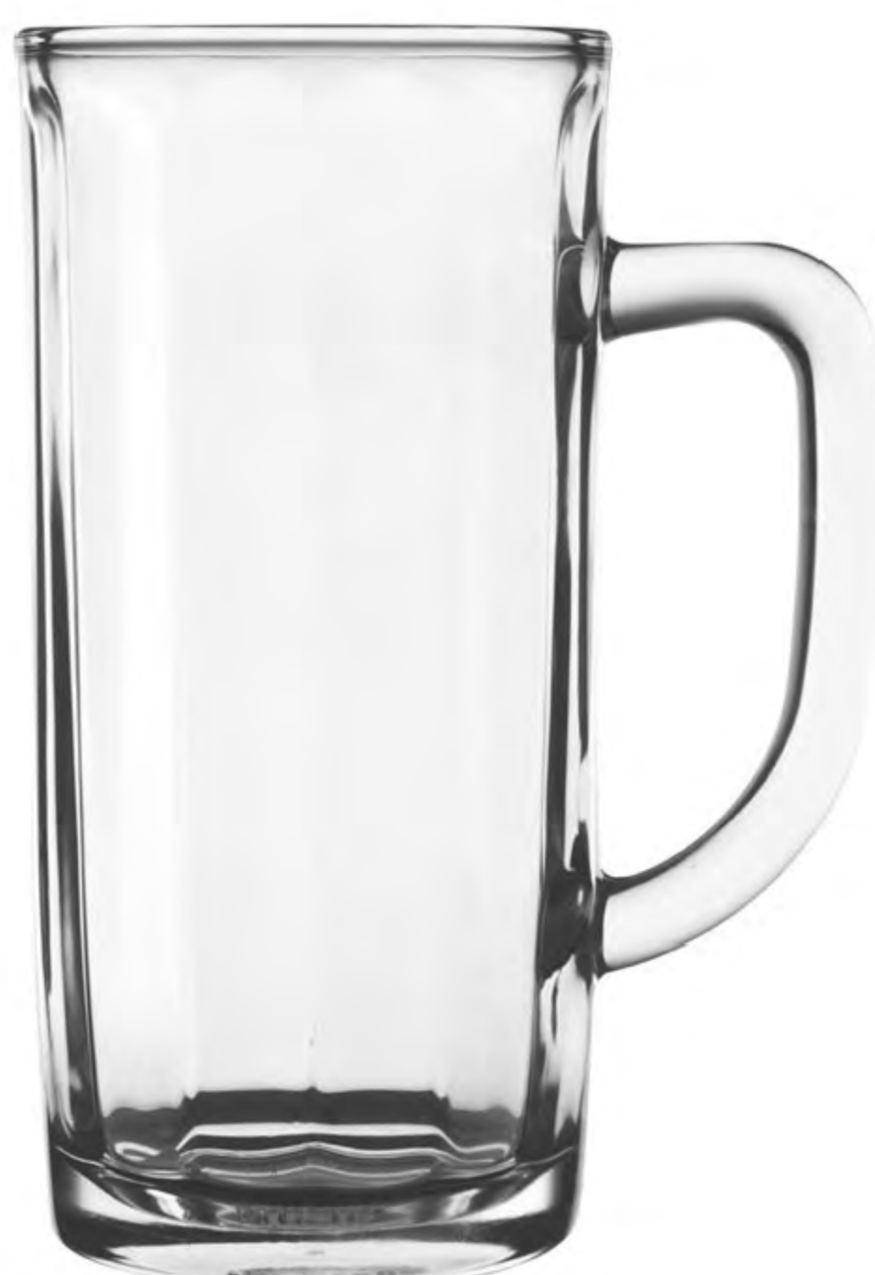
UG-367 374cc 有柄杯 H: 151.80mm φ: 67.80mm