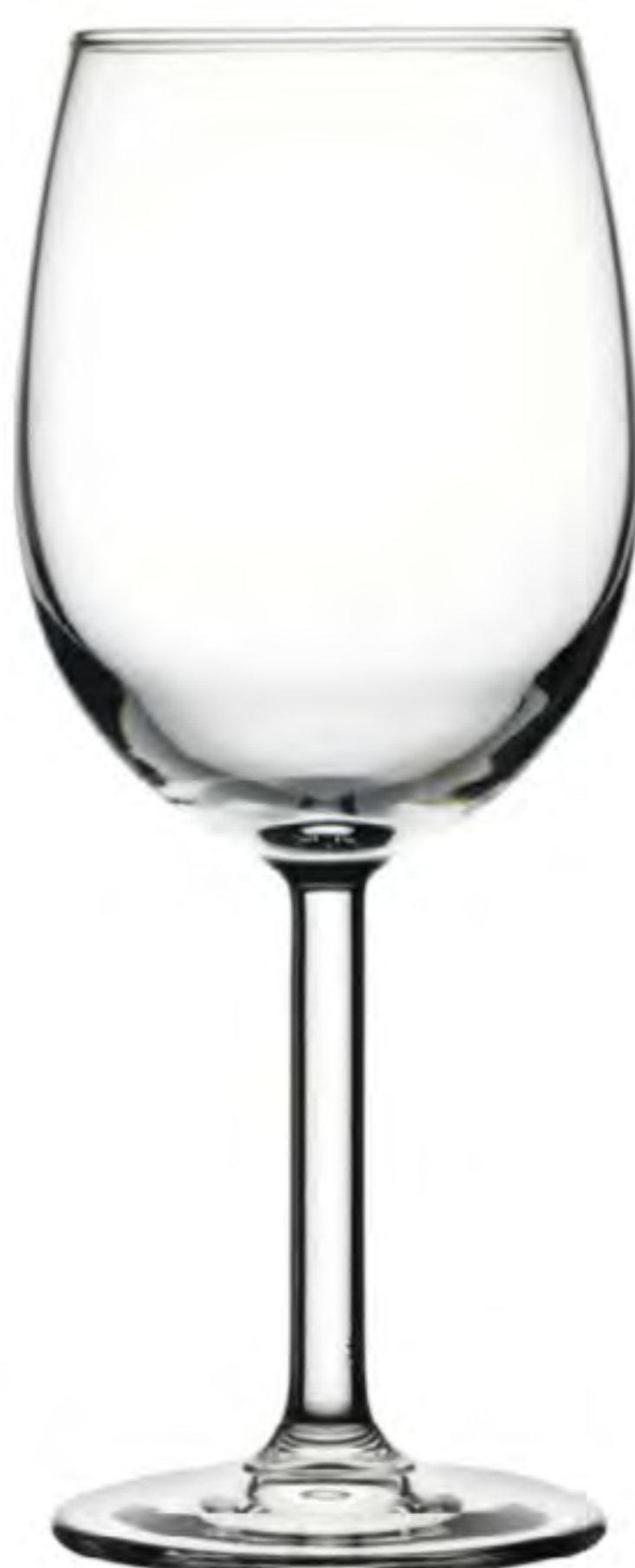
P-44974 395cc 紅酒杯 H: 200mm φ: 67mm