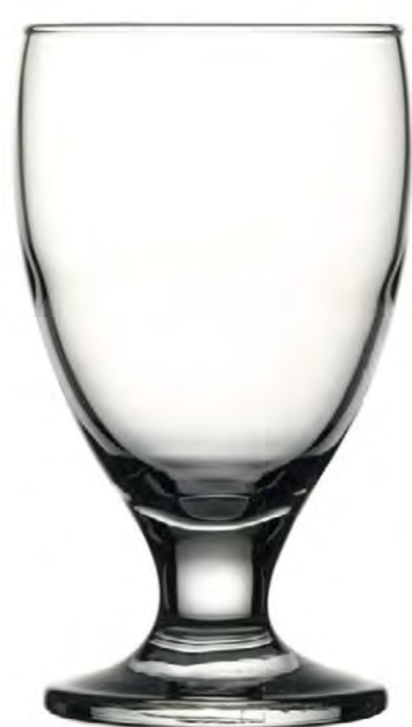
P-44701 290cc 高腳水杯 H: 133.5mm Φ: 73.5mm