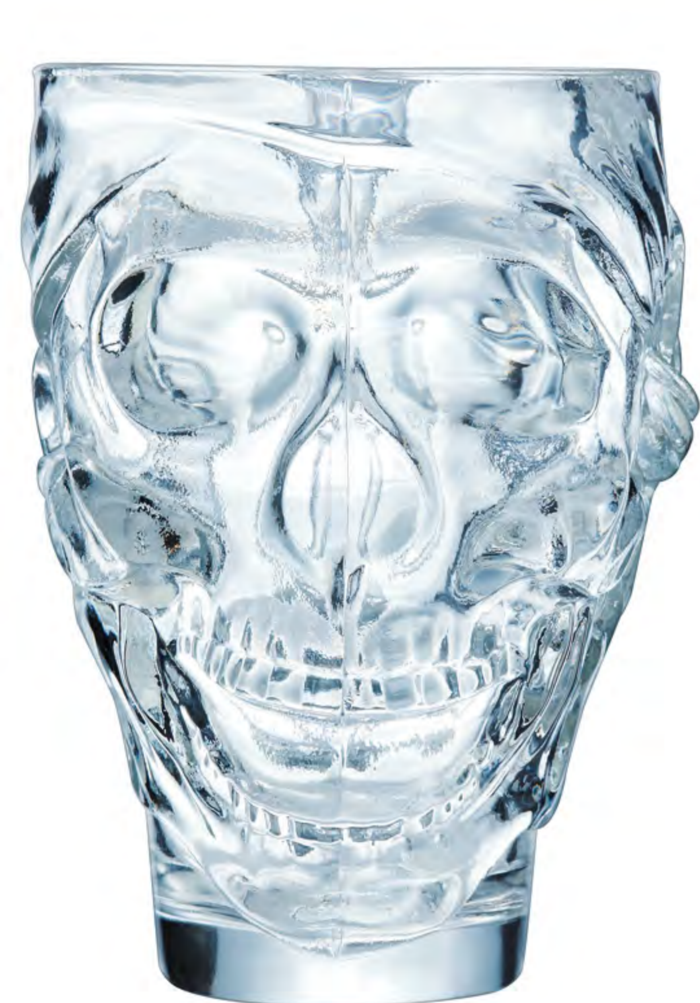
N-6644 900cc 造型啤酒杯 H : 160mm φ : 164mm