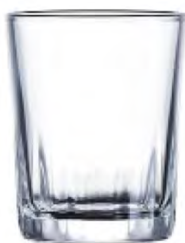
UG-351 48cc 烈酒杯 H: 58mm φ: 46mm 12X12