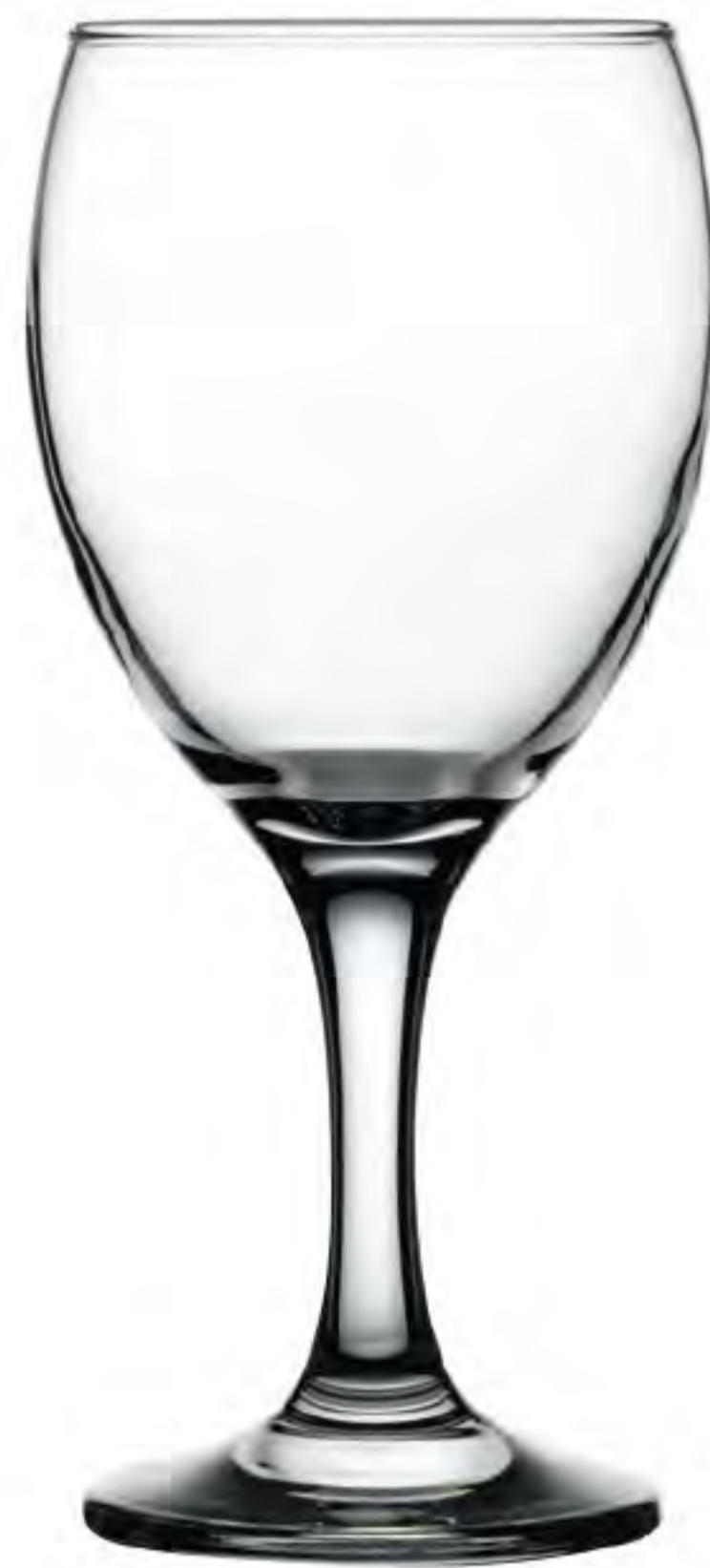
P-44703 255cc 紅酒杯 H: 169mm φ: 62mm