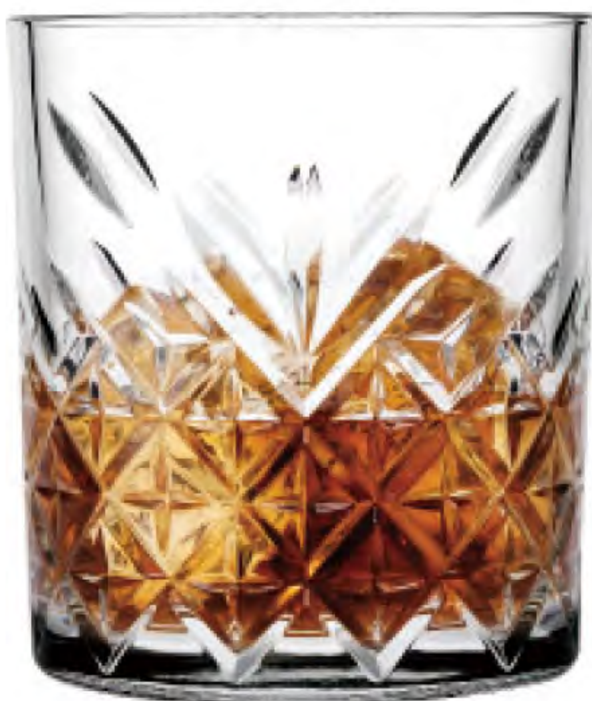
P-52790 345cc 威士忌杯 H:96mm Φ:85.5mm