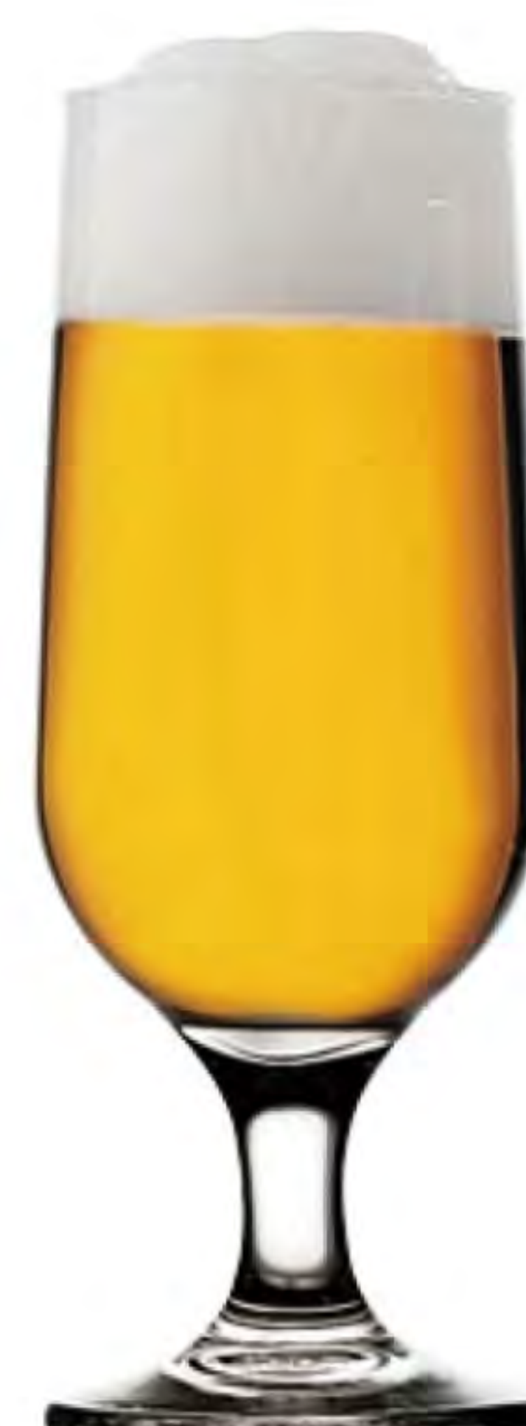
P-44852 279cc 附餐杯 H: 170mm Φ: 57mm