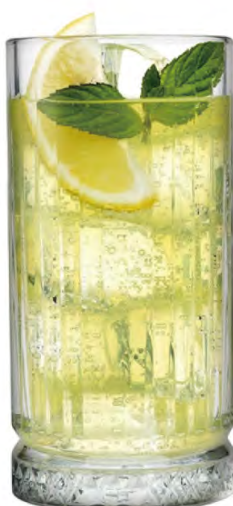
P-520015 445cc 雞尾酒杯 H:150mm Φ:76mm