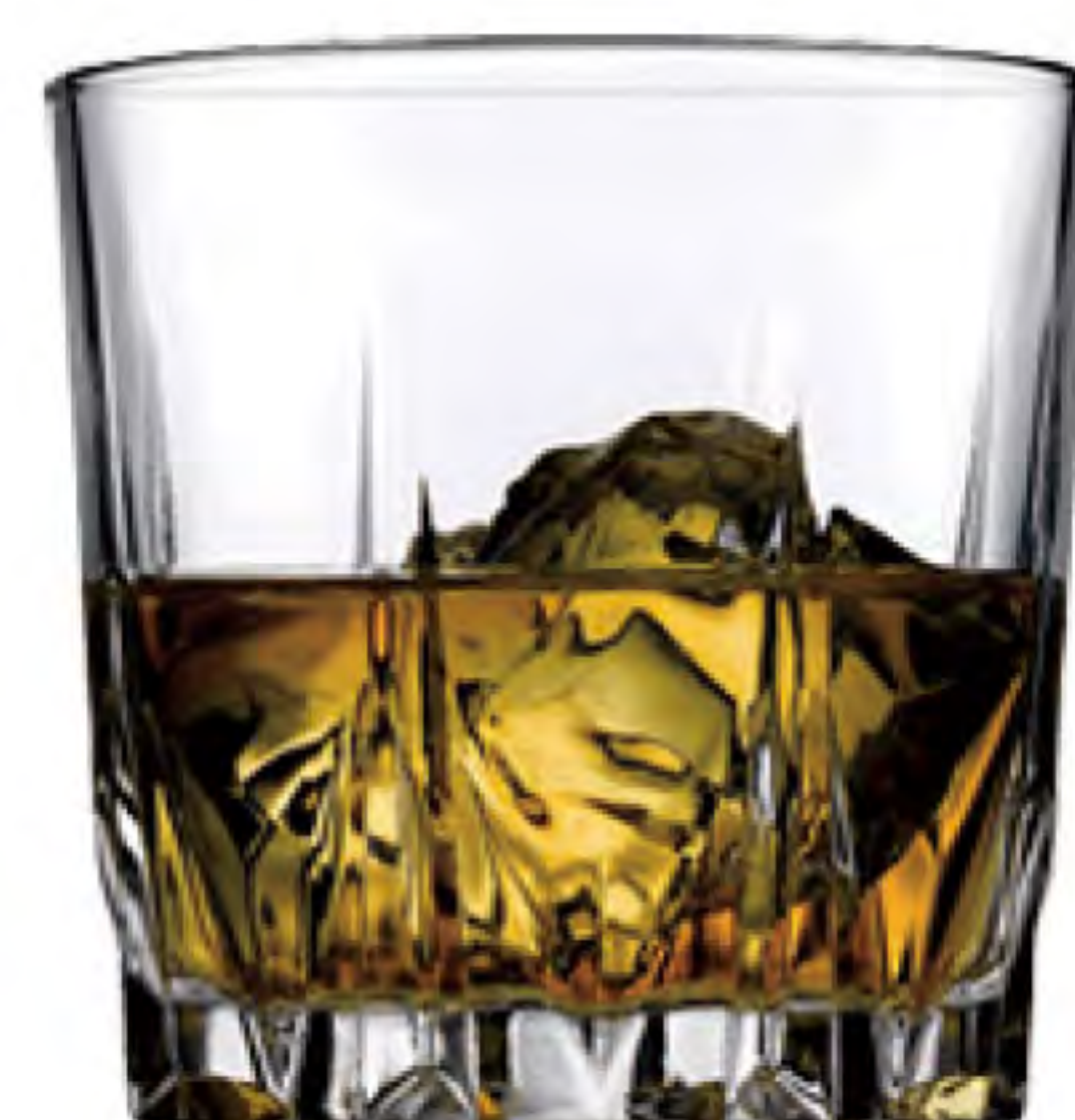
P-52885 300cc 威士忌杯 H:87mm Φ:85mm