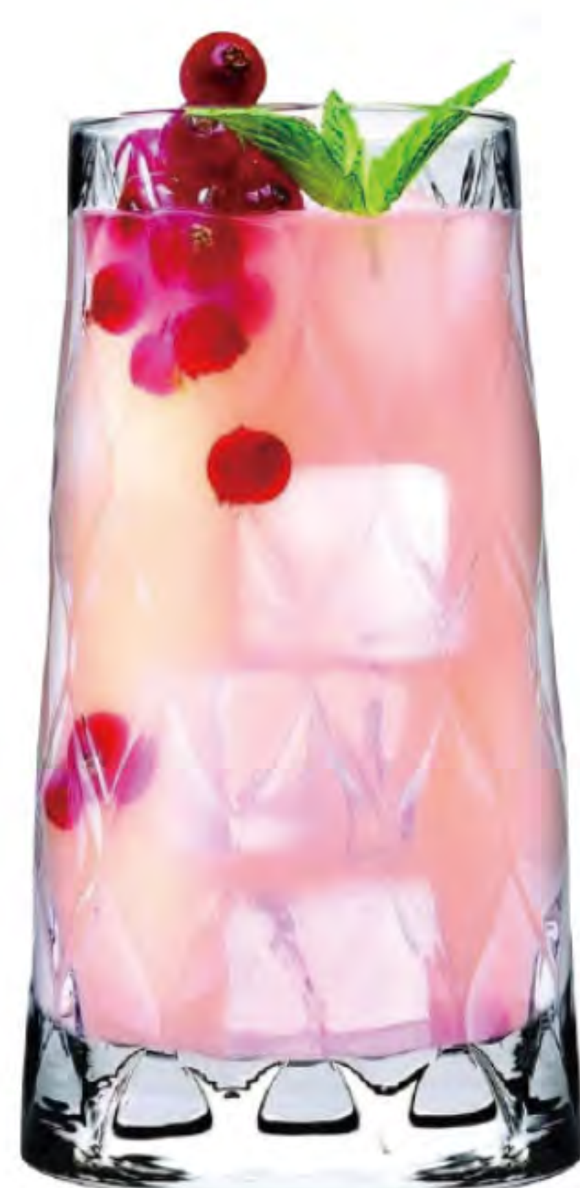
P-420955 450cc 火焰杯 H:150mm Φ:60mm 4X6