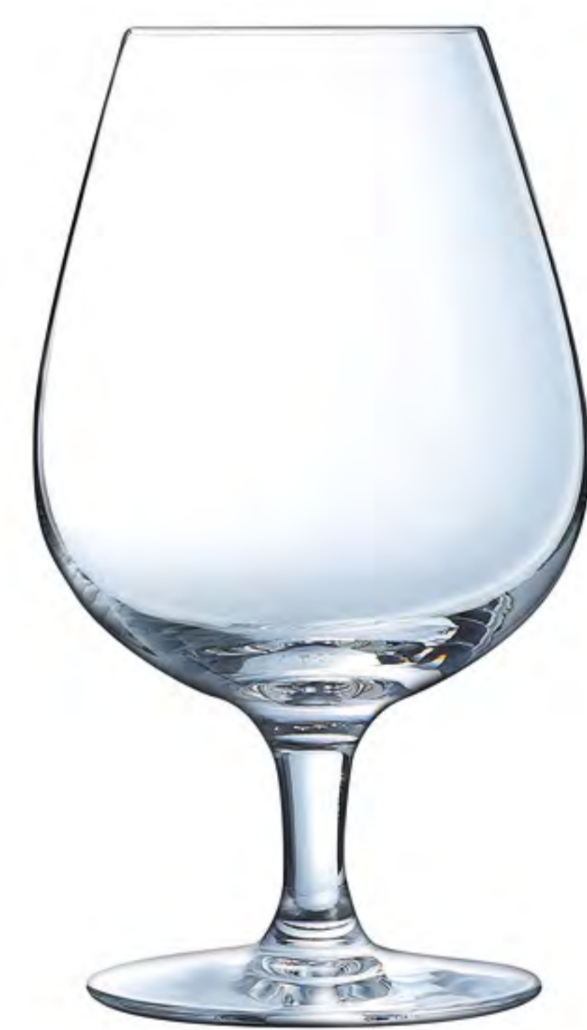
L-9938 470cc 啤酒杯 H : 165mm φ : 94mm