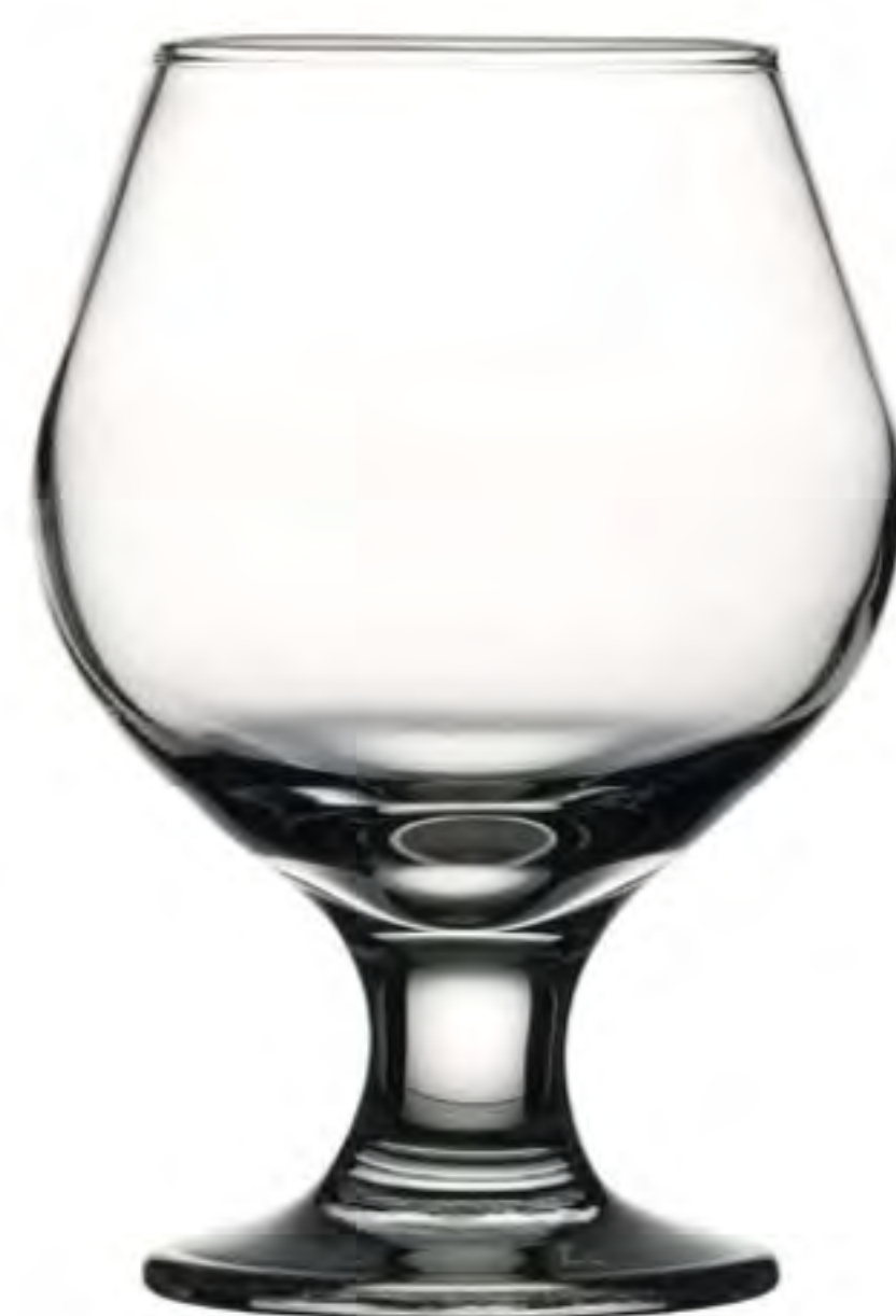
P-44741 265cc 白蘭地 H: 116mm φ: 58mm