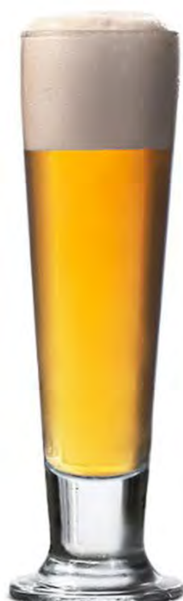
P-41099 405cc 立茲杯 H: 237mm φ: 67.5mm