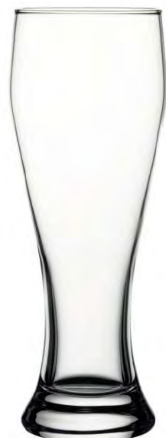
P-42116 415cc 啤酒杯 H: 199mm φ: 69mm