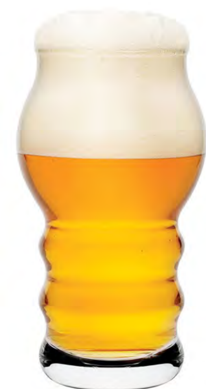
P-420685 430cc 卡拉夫啤酒杯 H: 153mm φ: 73mm