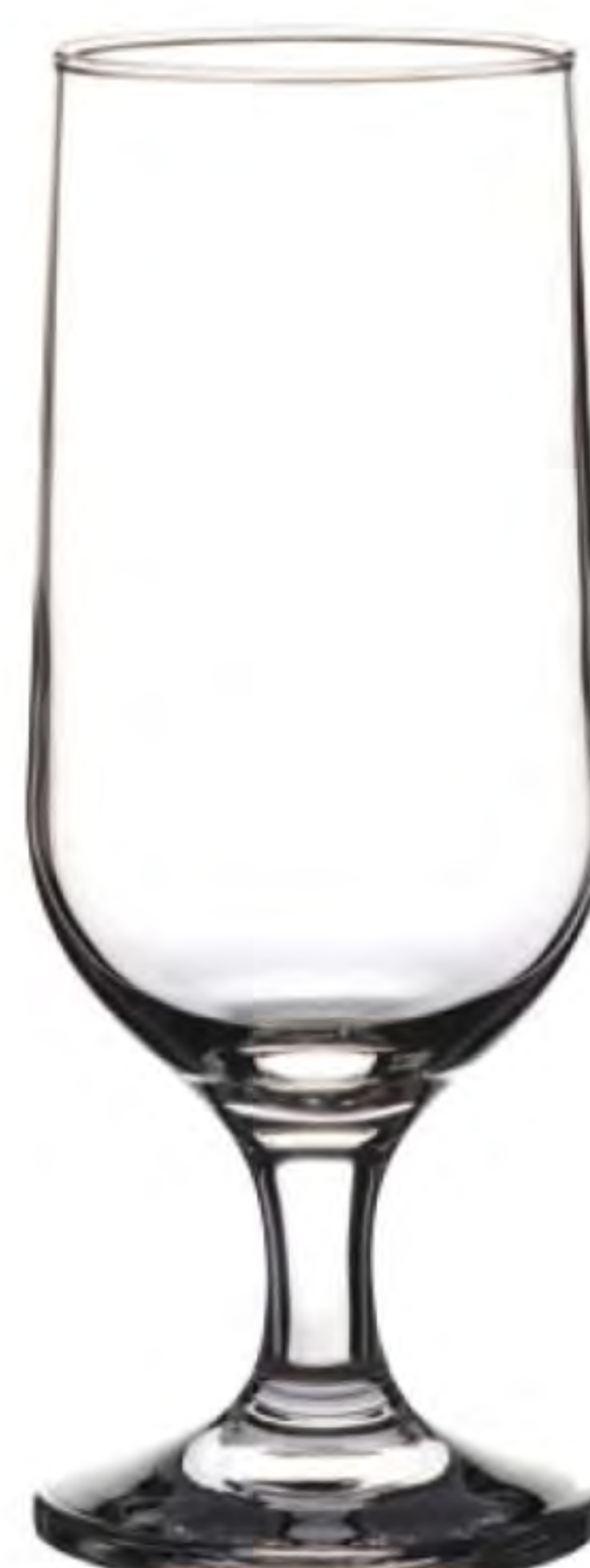
P-44882 353cc 啤酒杯 H: 180mm Φ: 62mm