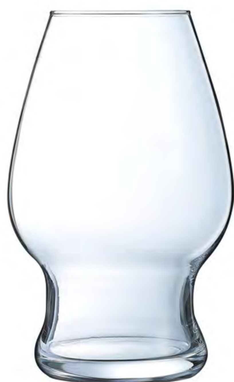
L-9941 590cc 啤酒杯 H : 151mm φ : 94mm