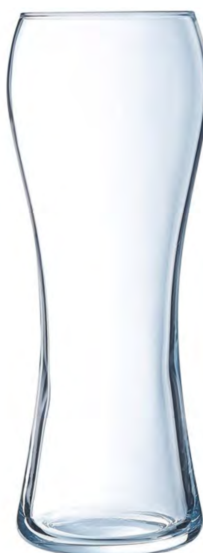
L-9944 590cc 啤酒杯 H : 210mm φ : 83mm