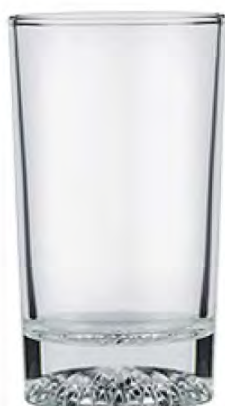
LG-143005 140cc 水杯 H: 100mm φ: 57mm 6X12