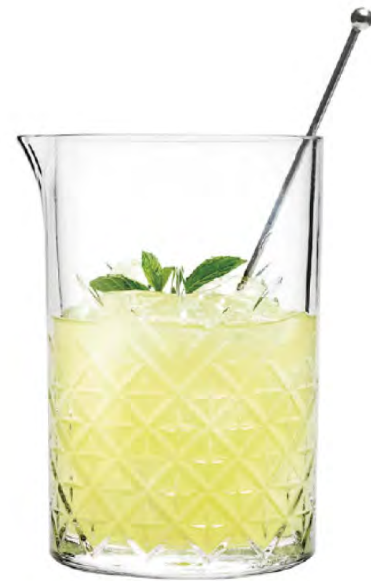
P-52849 725cc 調酒公杯 H:150mm Φ:106.5mm