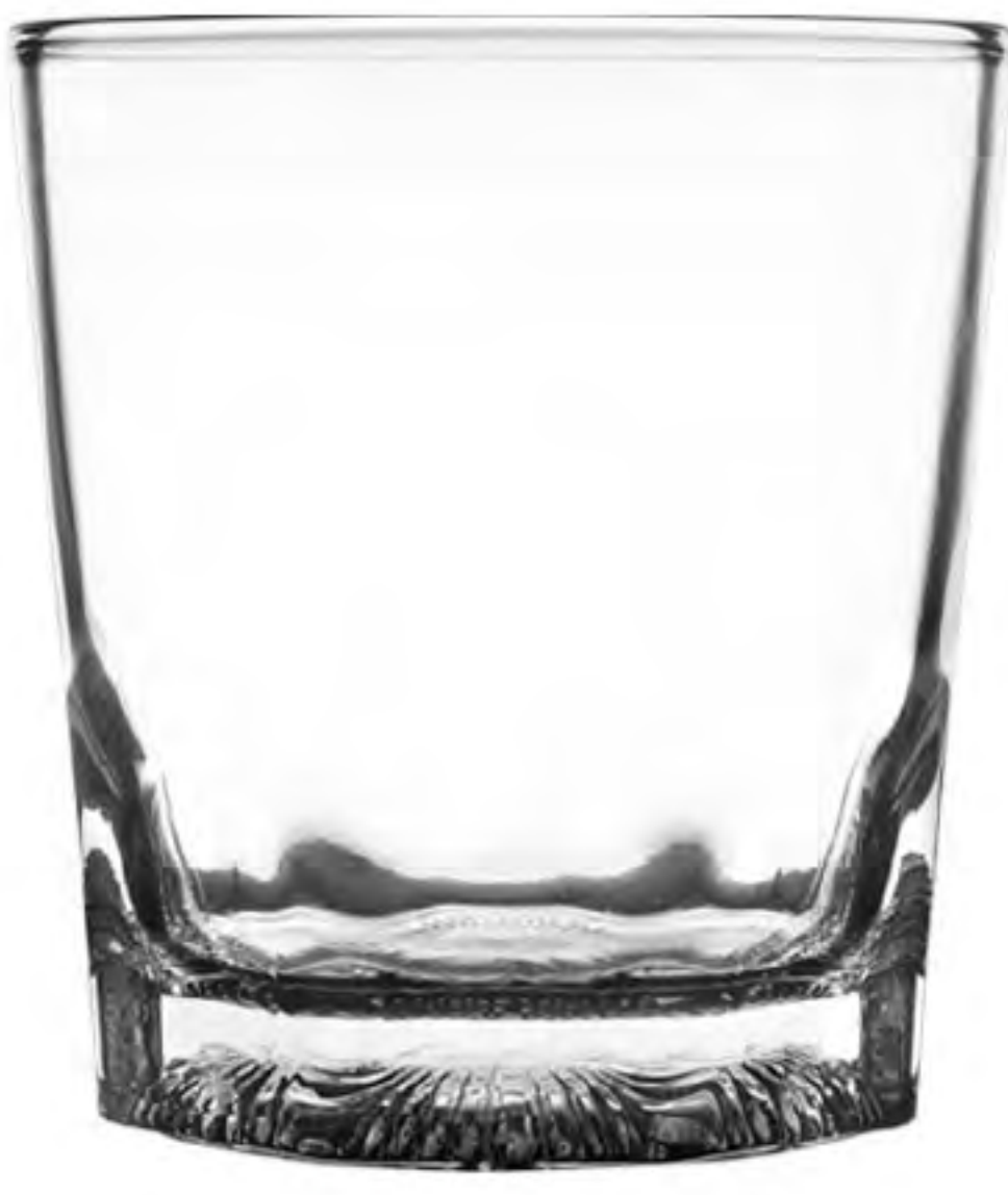
UG-356 266cc 花底杯 H: 85.8mm φ: 76.3mm 6X12