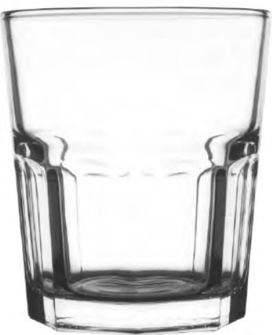
UG-389 306cc 八角杯 H: 92.5mm φ: 82.5mm 6X12