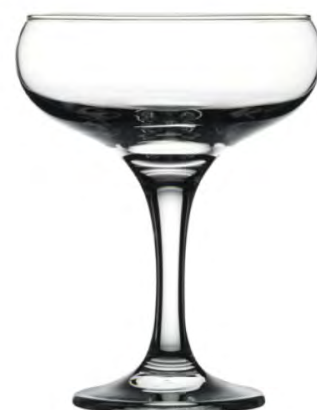
P-44136 270cc 半圓香檳杯 H: 132mm φ: 95mm