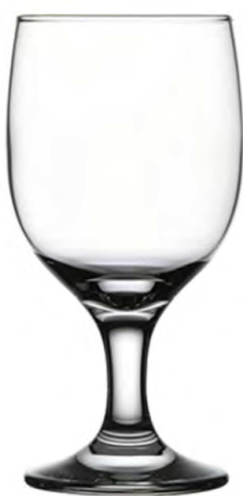
P-44862 335cc 水杯 H: 154mm φ: 72mm