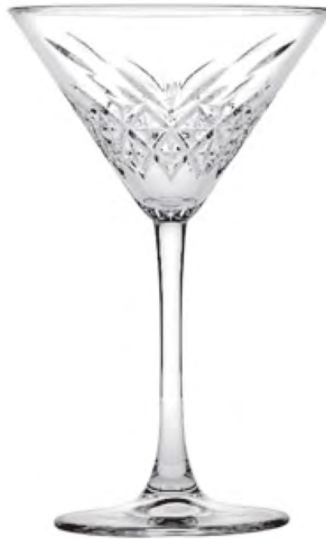
P-440176 230cc 雕花雞尾酒杯 H:172mm Φ:116mm