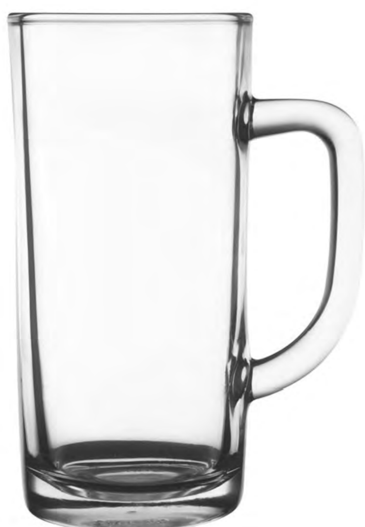
UG-376 400cc 有柄杯 H: 151.80mm φ: 67.80mm