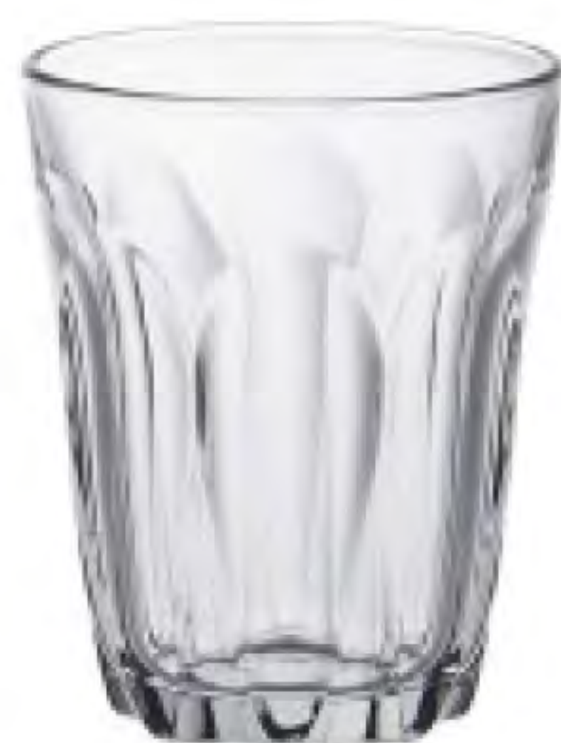
UG-344 136cc 水杯 H: 79mm φ: 64mm 12X12