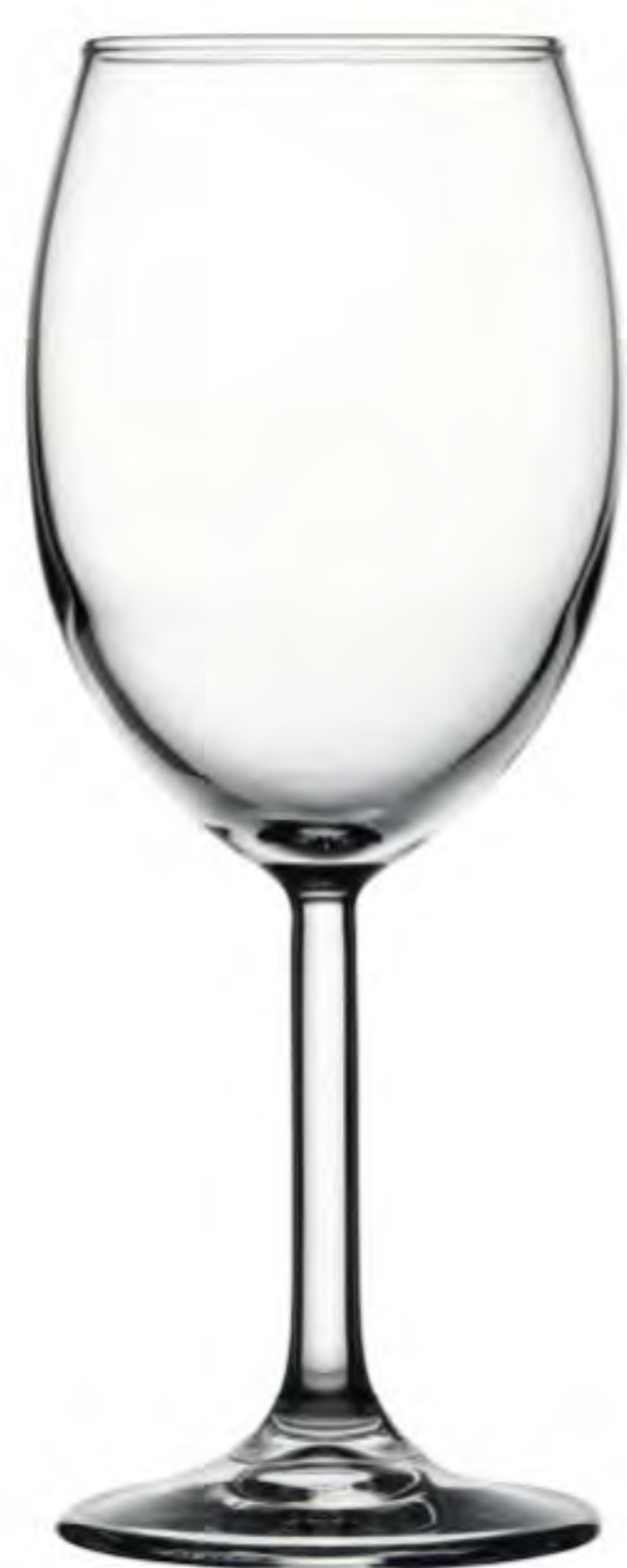
P-44733 240cc 紅酒杯 H: 178mm φ: 56mm