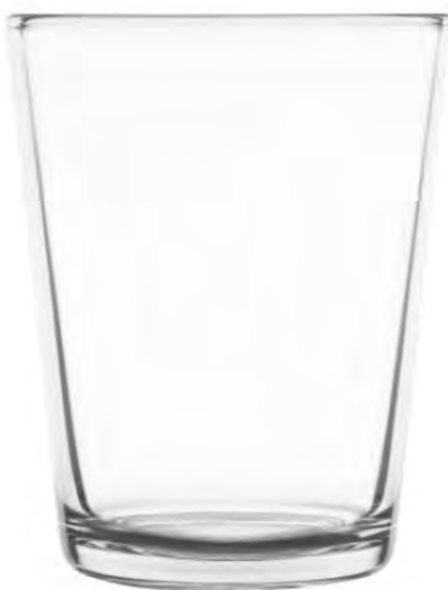
UG-104 166cc 自由杯 H: 85mm φ: 66mm 12X12