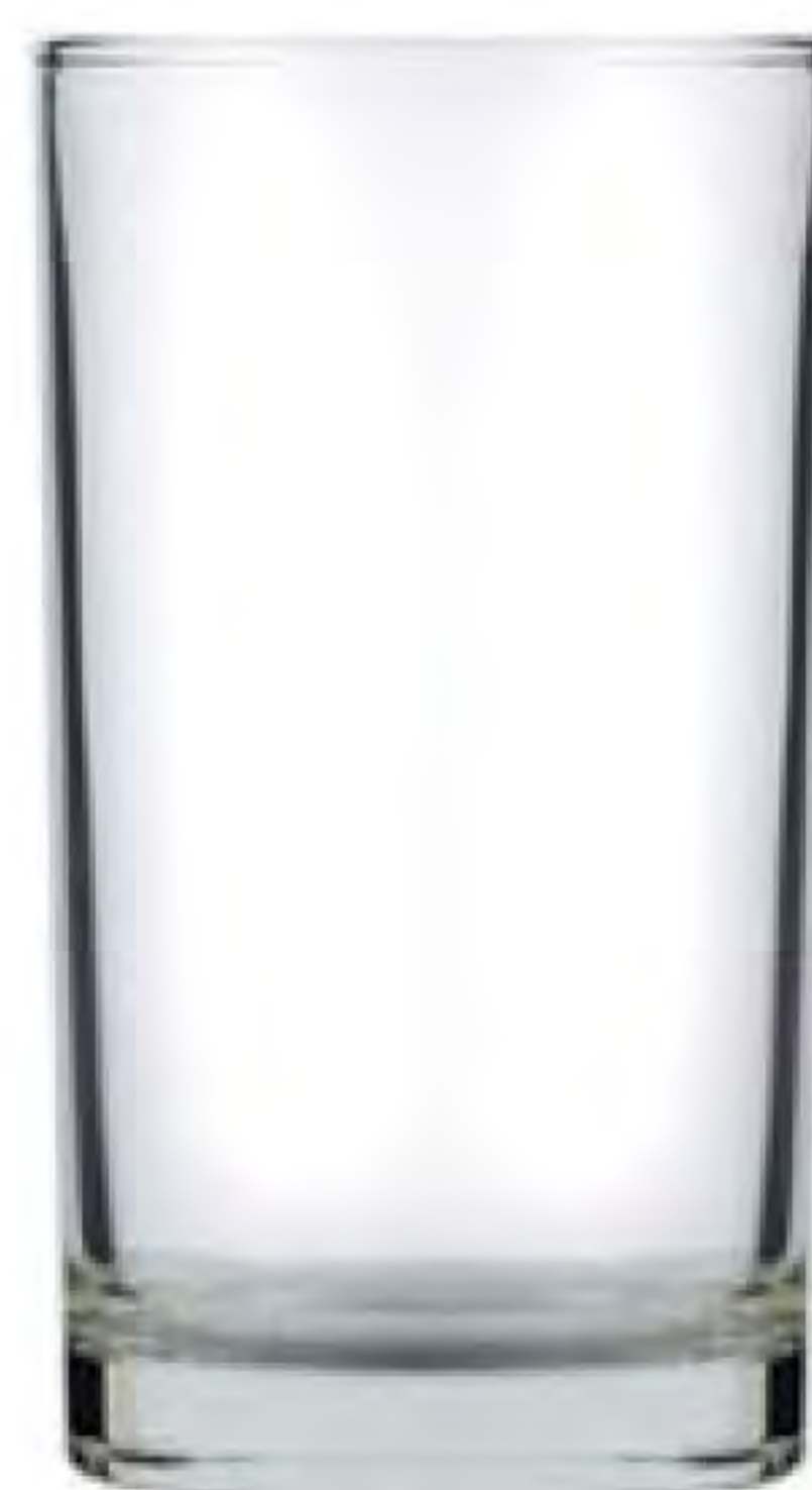
LG-103209 250cc 水杯 H: 110.50mm φ: 65mm 12X6