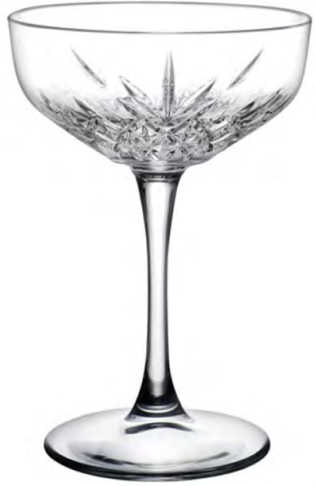
P-440236 255cc 雕花雞尾酒杯 H:157mm Φ:110mm