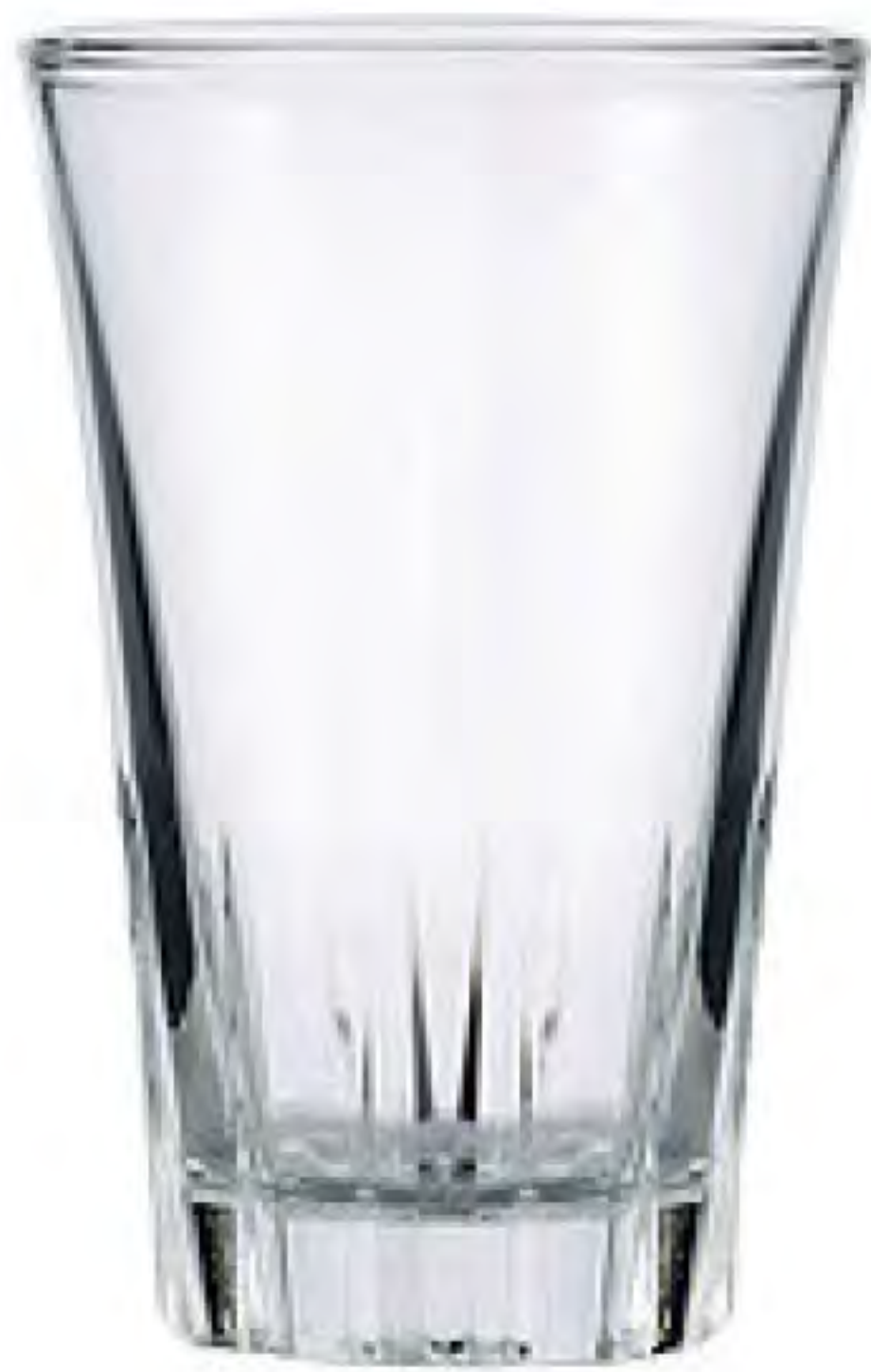
LG-404602 60cc 試飲杯 H: 80mm φ: 50mm 12X12