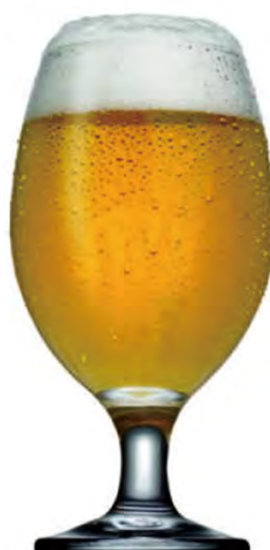
P-44417 400cc 果汁杯 H: 160mm φ: 68mm