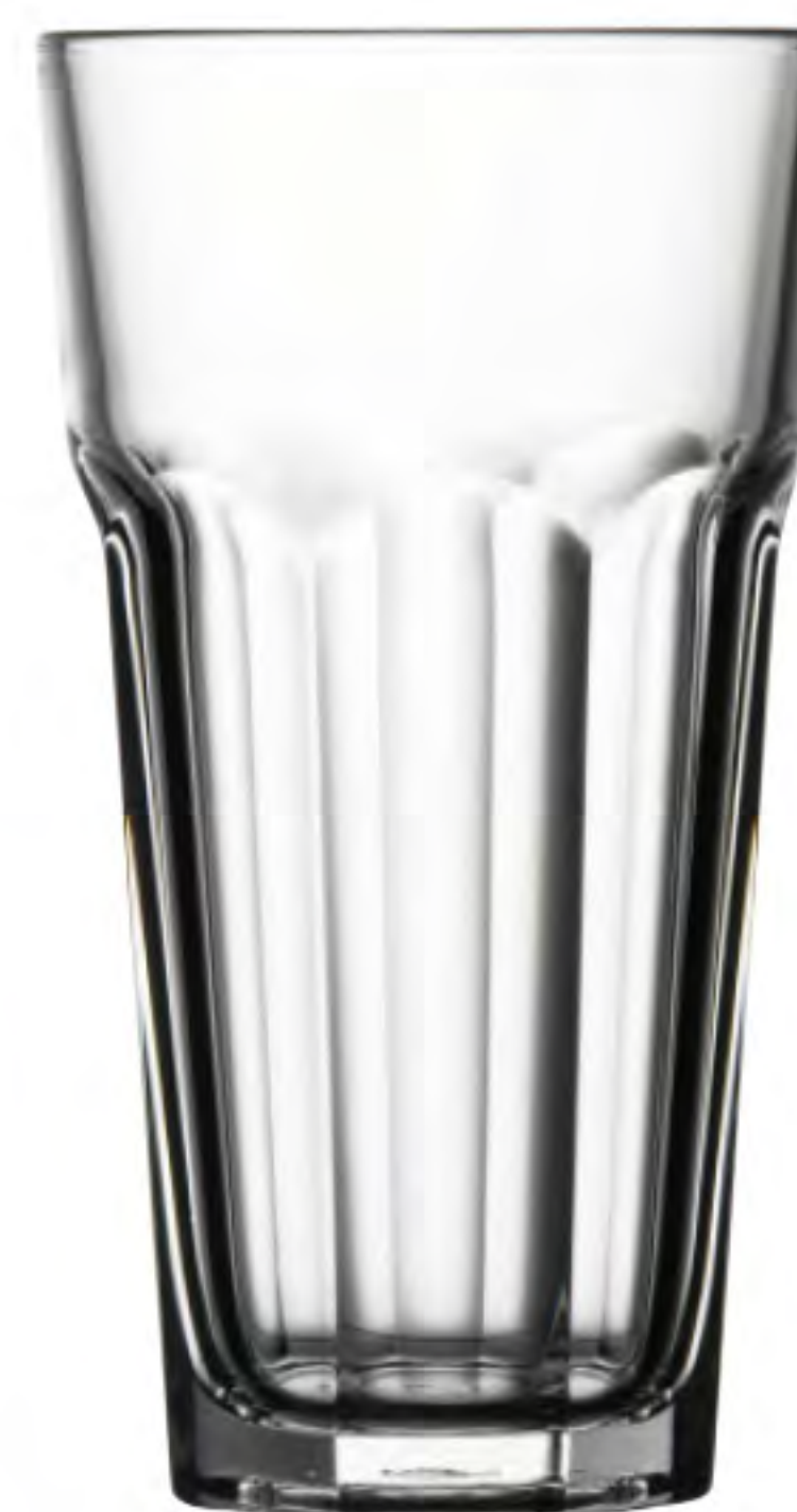
T P-52706 365cc 卡沙巴蘭卡 H: 148 mm φ: 79 mm