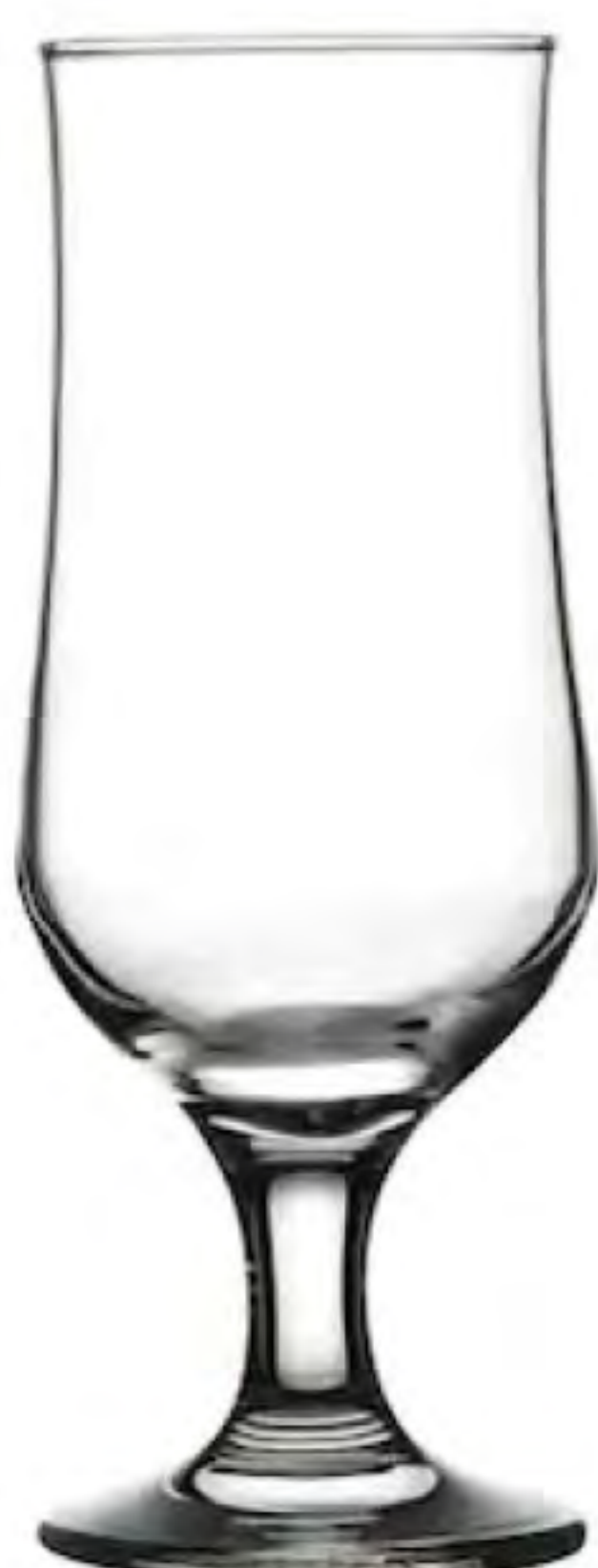
P-44169 370cc 啤酒杯 H: 190mm φ: 66mm