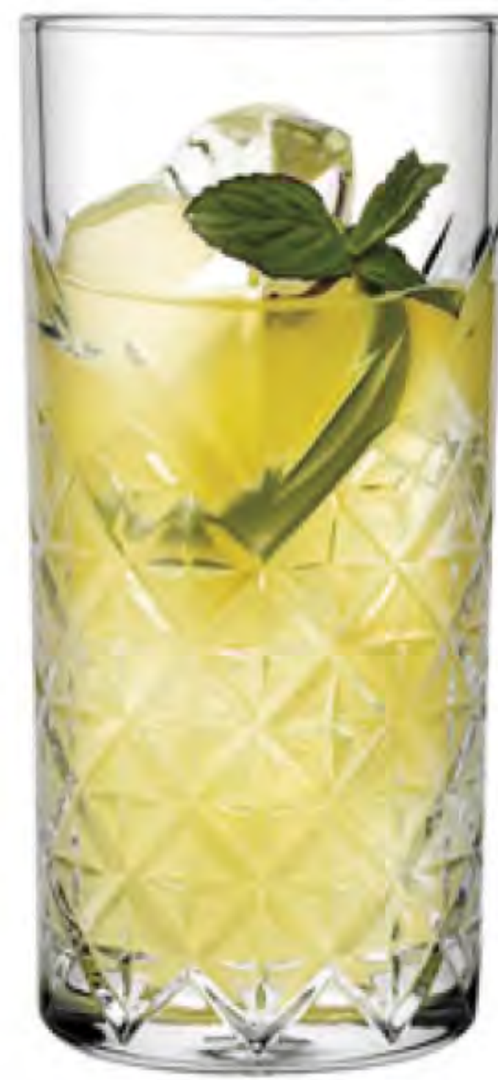
P-52820 295cc 果汁杯 H:143mm Φ:67.5mm