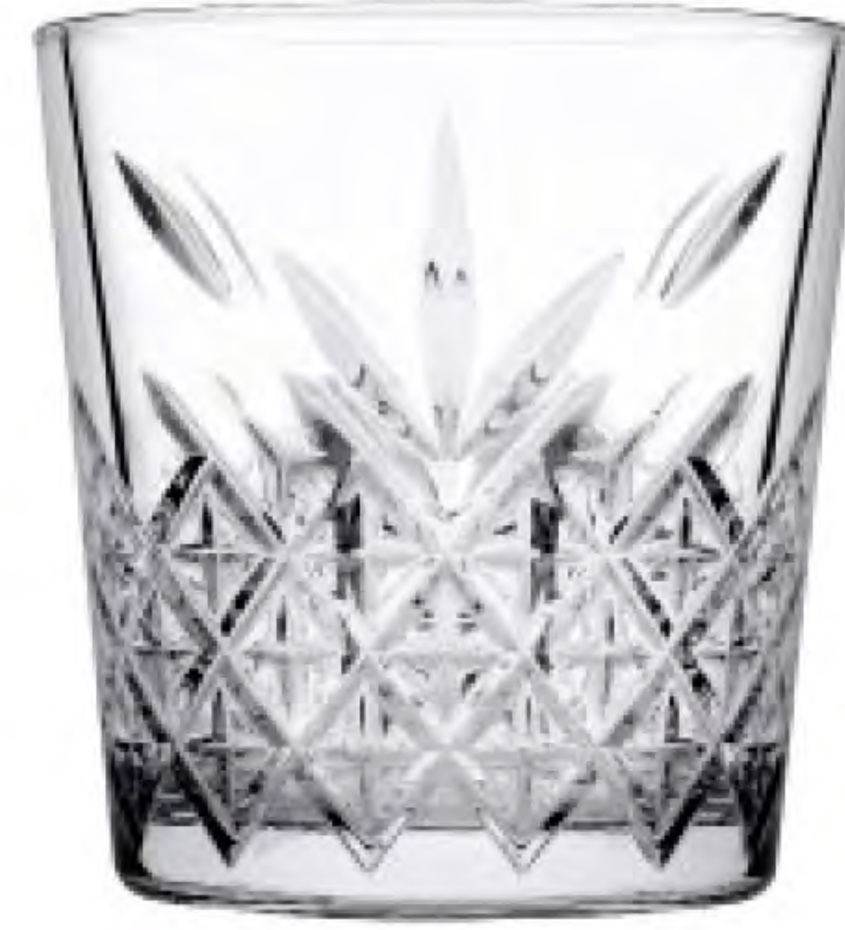
T P-520074 355cc 強化威士忌杯 H: 96.5mm φ: 92mm