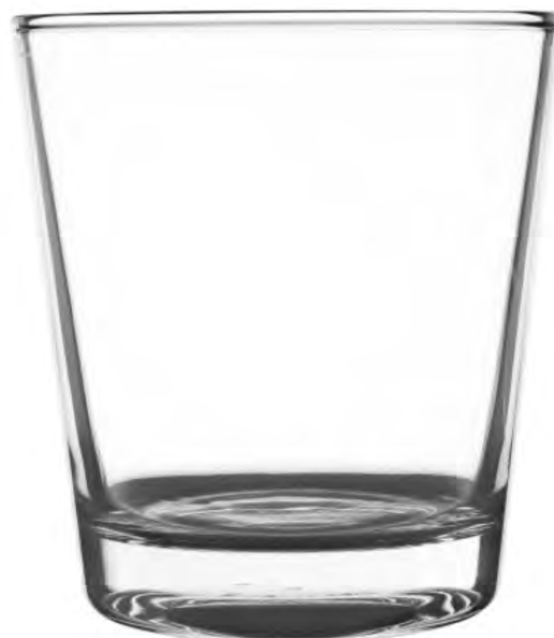
UG-384 279cc 水杯 H: 91mm φ: 83mm 6X12