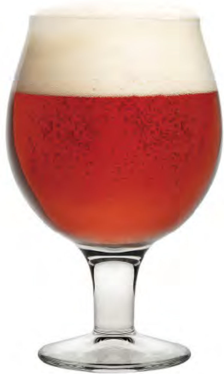
T P-440247 390cc 達夫特 啤酒杯 H: 142mm φ: 70mm