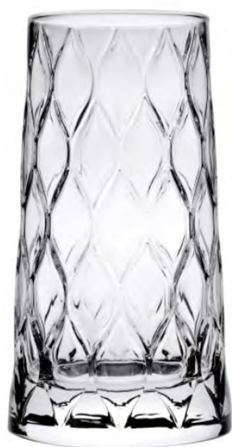
P-420855 345cc 火焰杯 H:140mm Φ:60mm 4X6