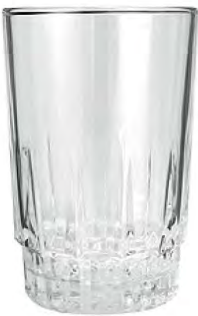
LG-106006 160cc 水杯 H: 90mm φ: 60.50mm 12X6