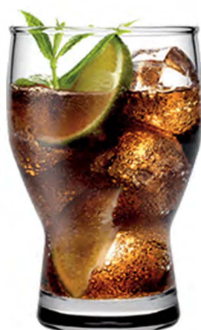
P-420967 415cc 里維爾啤酒杯 H: 129mm φ: 82mm