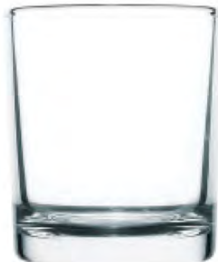
UG-348 75cc 試飲杯 H: 61mm φ: 52mm 6X24