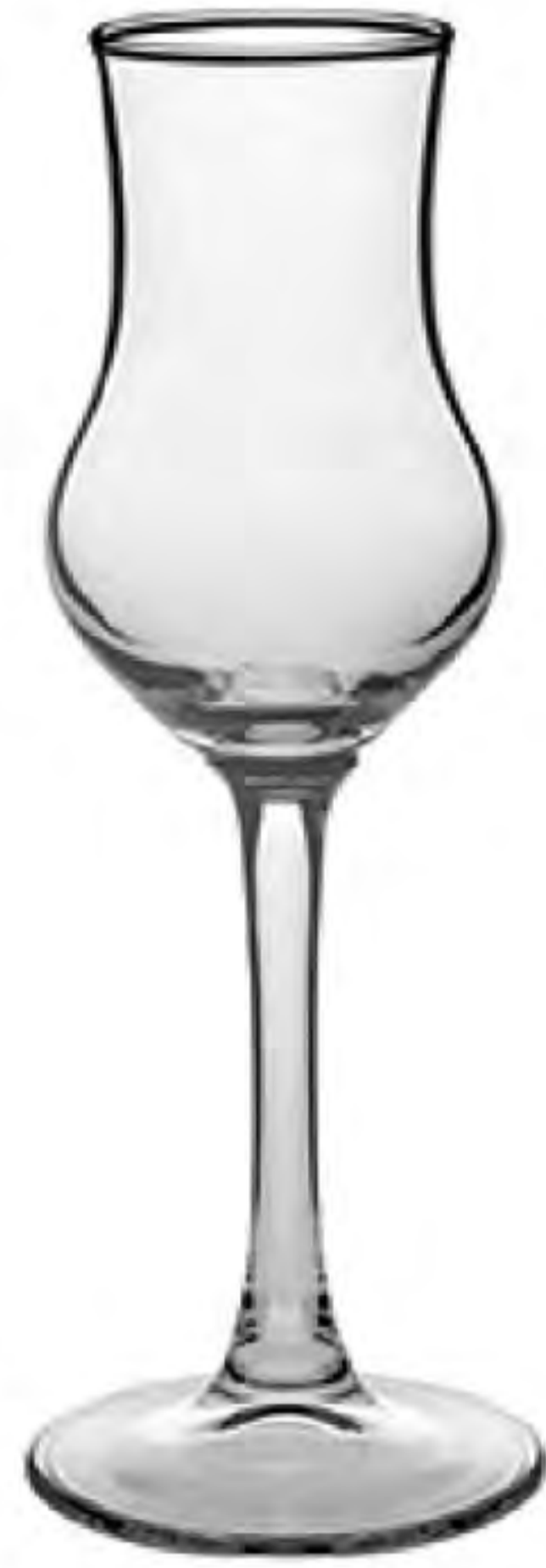
P-440111 95cc 甜酒杯 H: 180mm φ: 43mm