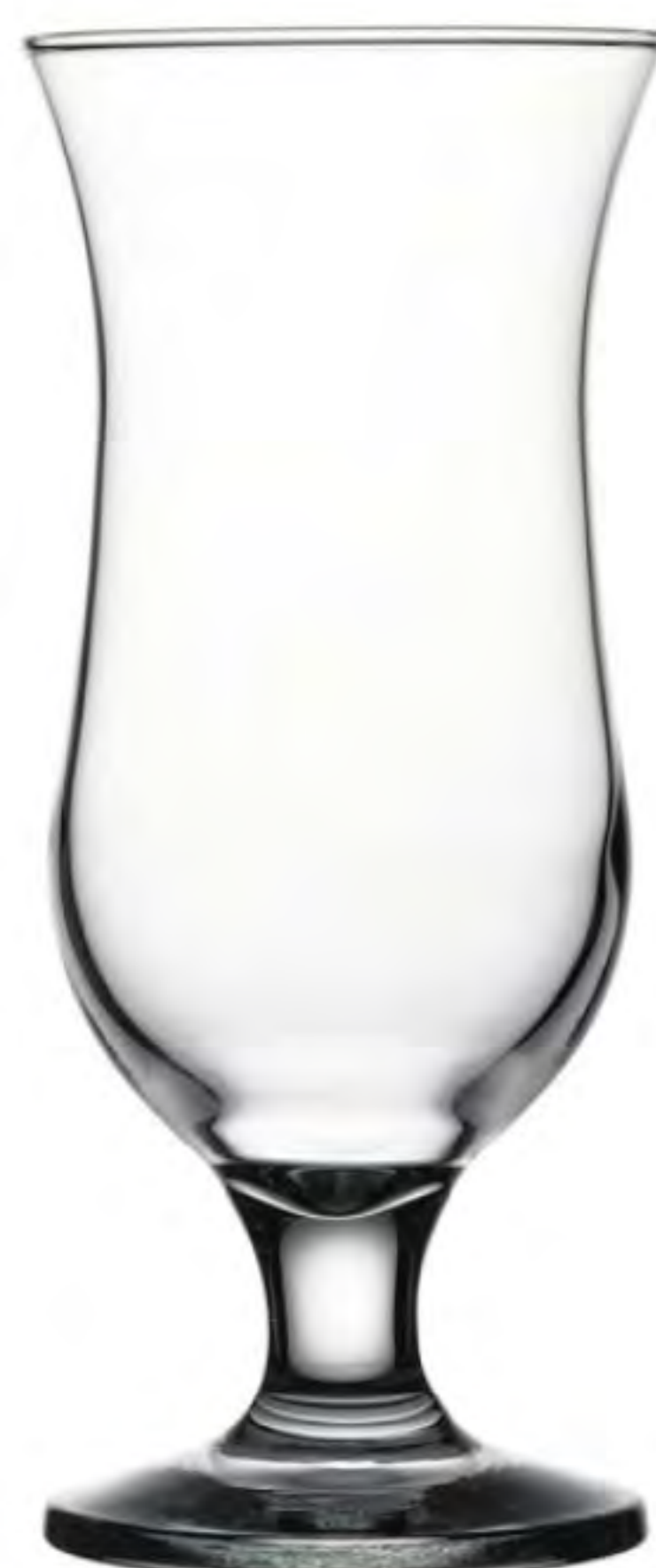
P-44403 470cc 雞尾酒杯 H: 196mm φ: 85mm