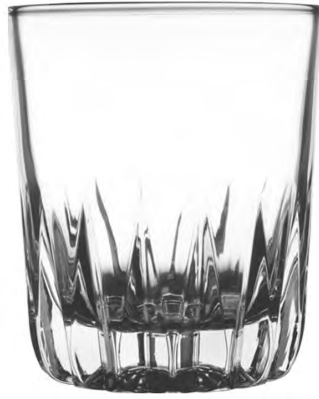
UG-385 278cc 威士忌杯 H: 92.8mm φ: 78.8mm 6X12