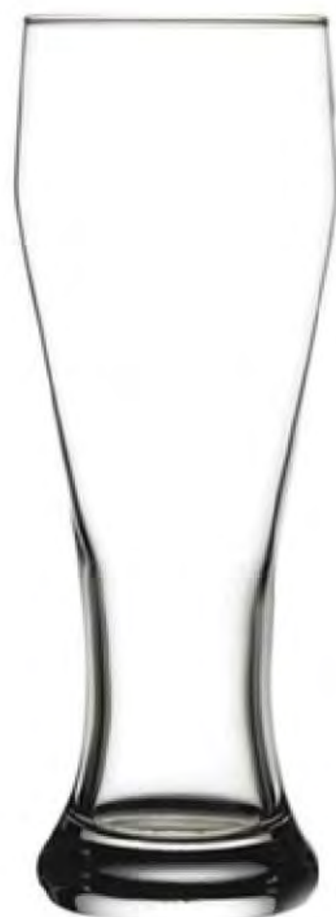
P-42756 665cc 啤酒杯 H: 234mm φ: 79mm