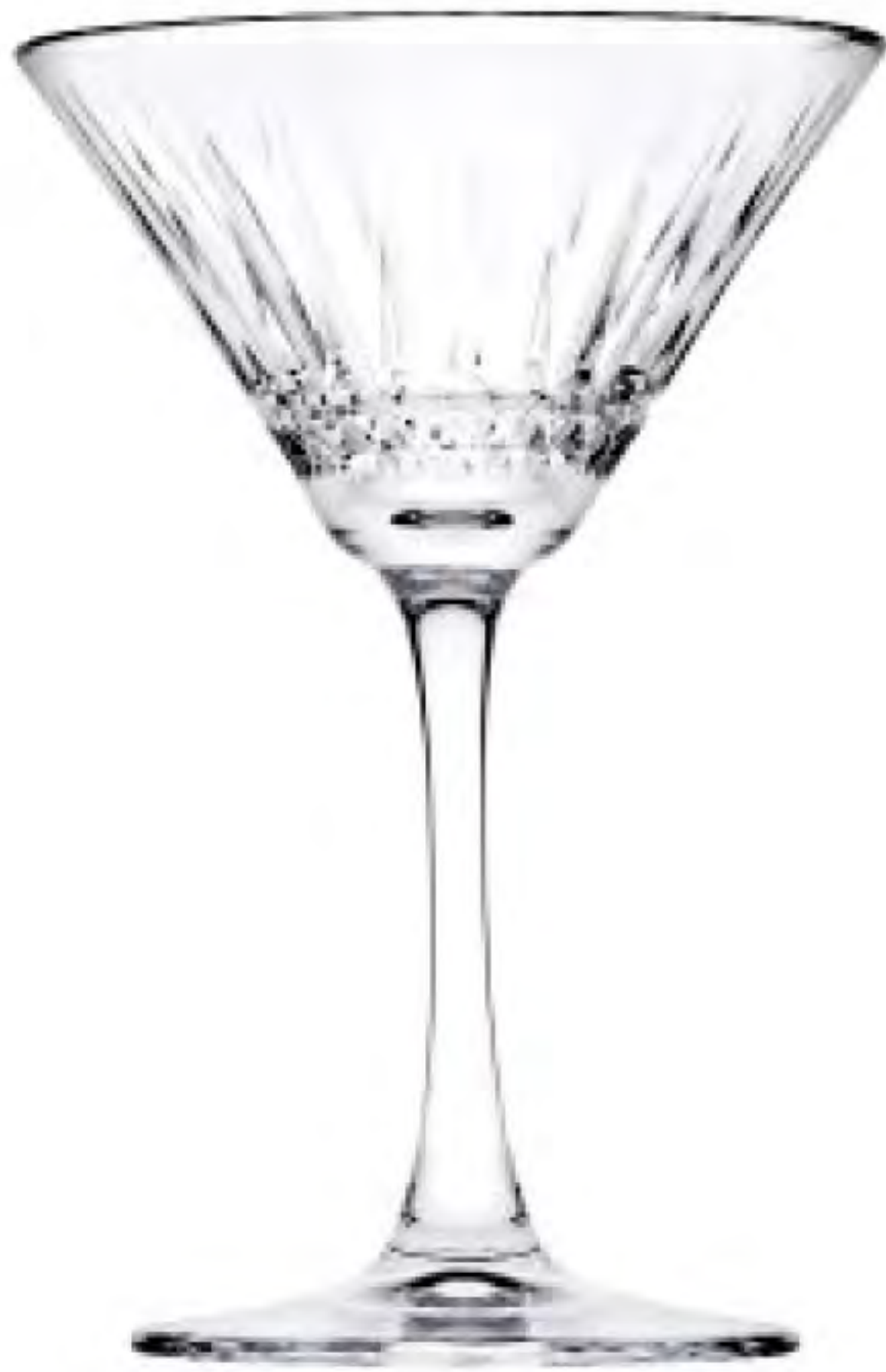
P-440328 220cc 雕花雞尾酒杯 H:172mm Φ:116mm