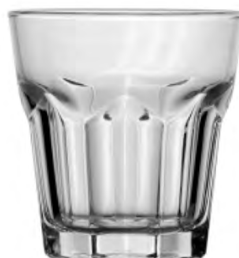
LG-440801 40cc 試飲杯 H: 57mm φ: 47mm 12X12