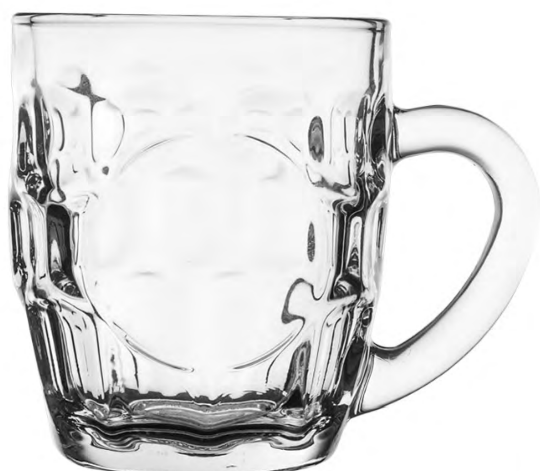
UG-217 301cc 有柄杯 H: 94.80mm φ: 75.30mm