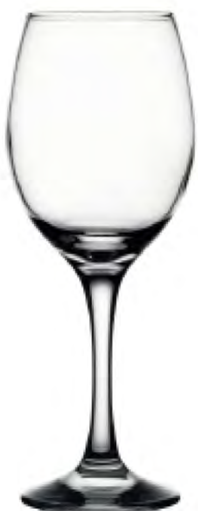
P-44997 390cc 紅酒杯 H: 207mm φ: 65mm