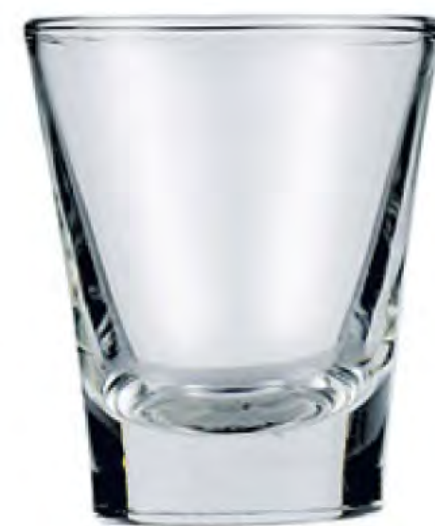
LG-440503 80cc 烈酒杯 H: 70mm φ: 59mm