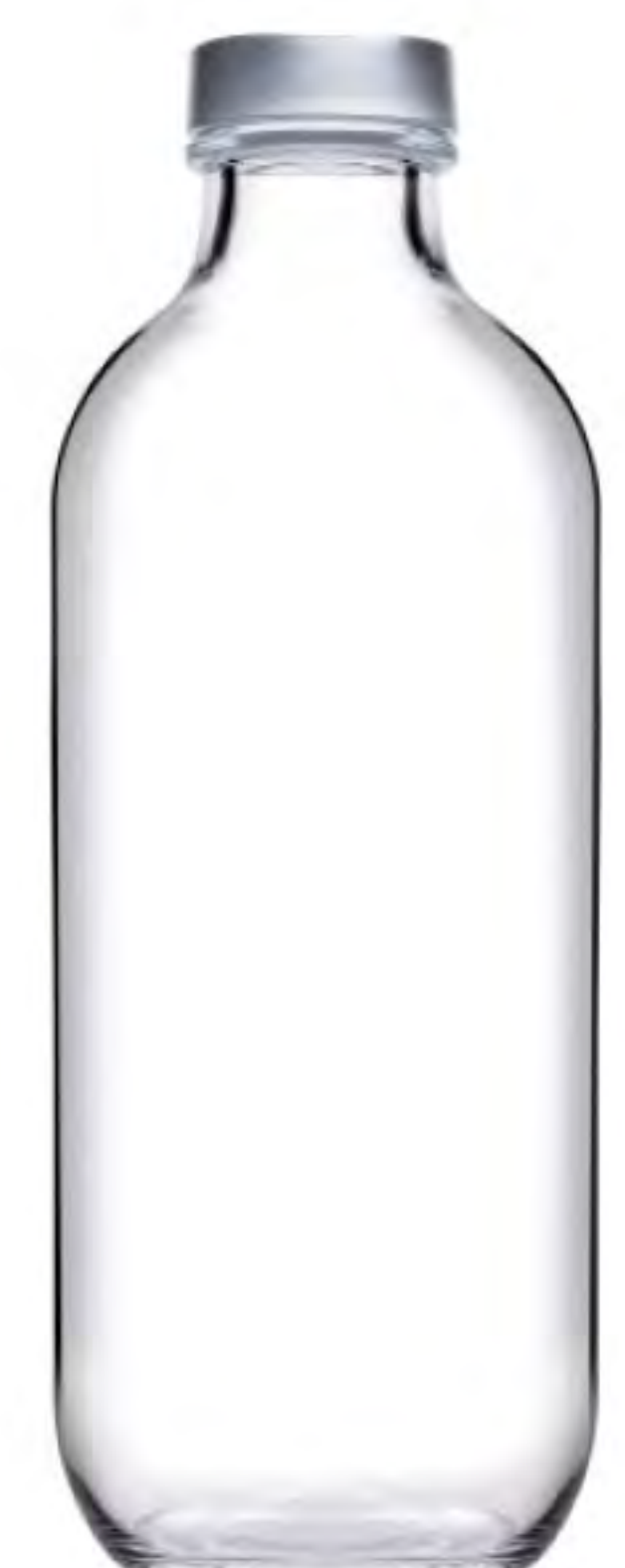
P-80355 540cc 精緻飲料瓶 H: 202mm φ: 36mm