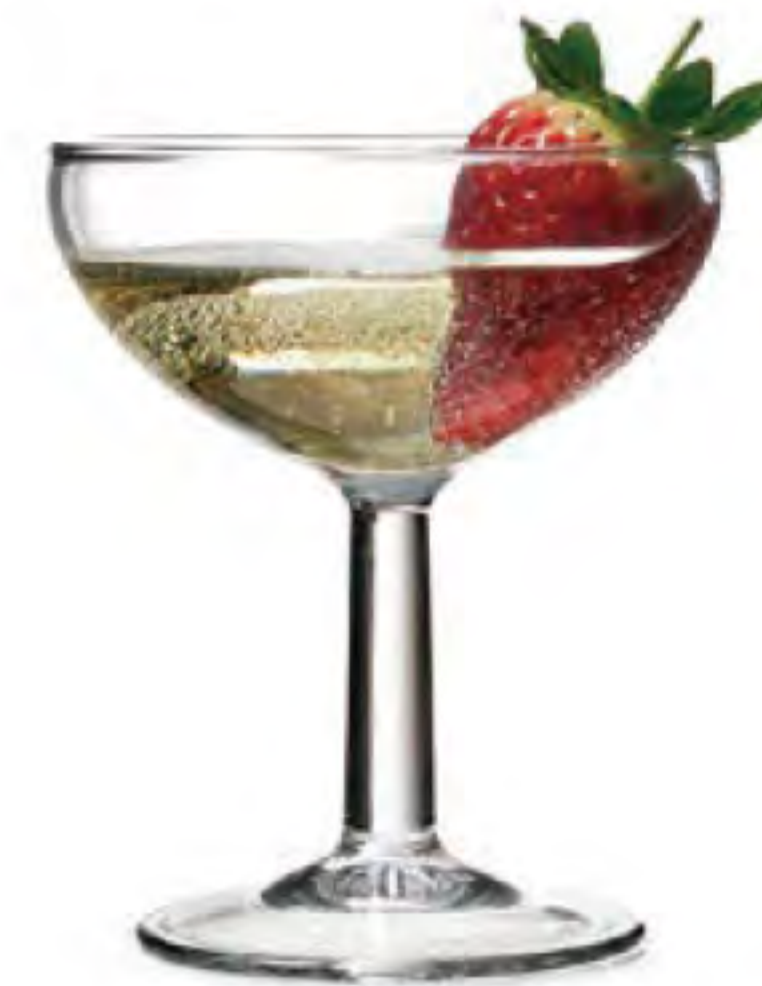
F-11945 130cc 半圓香檳杯 H: 88mm Φ: 104mm 12x6