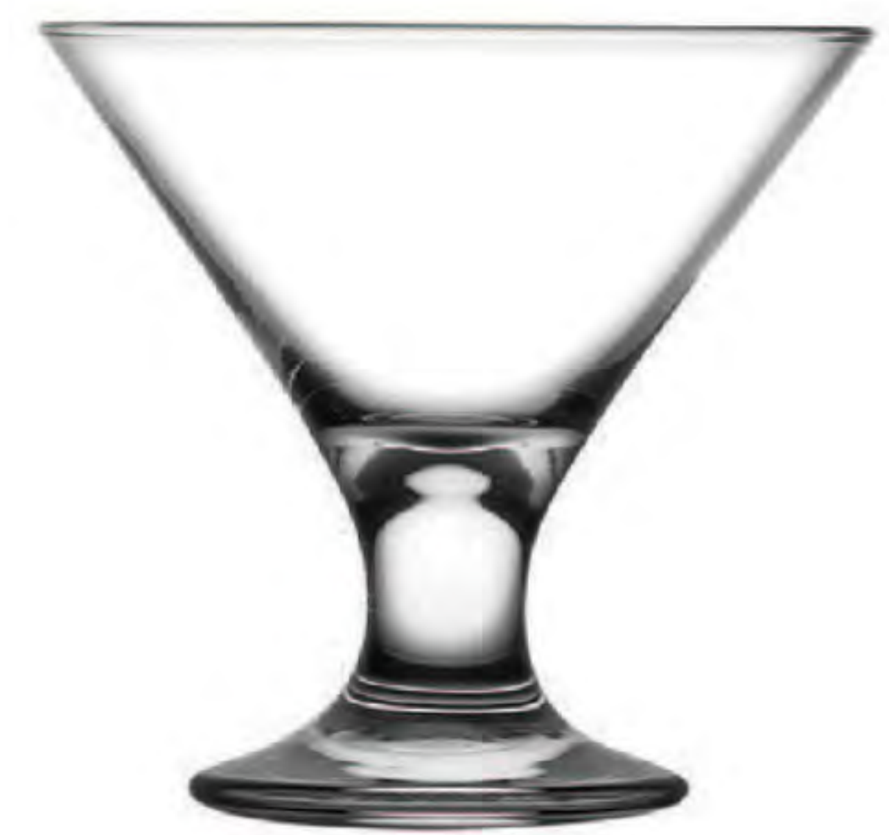
P-440410 185cc 點心杯 H: 99 mm φ: 107 mm