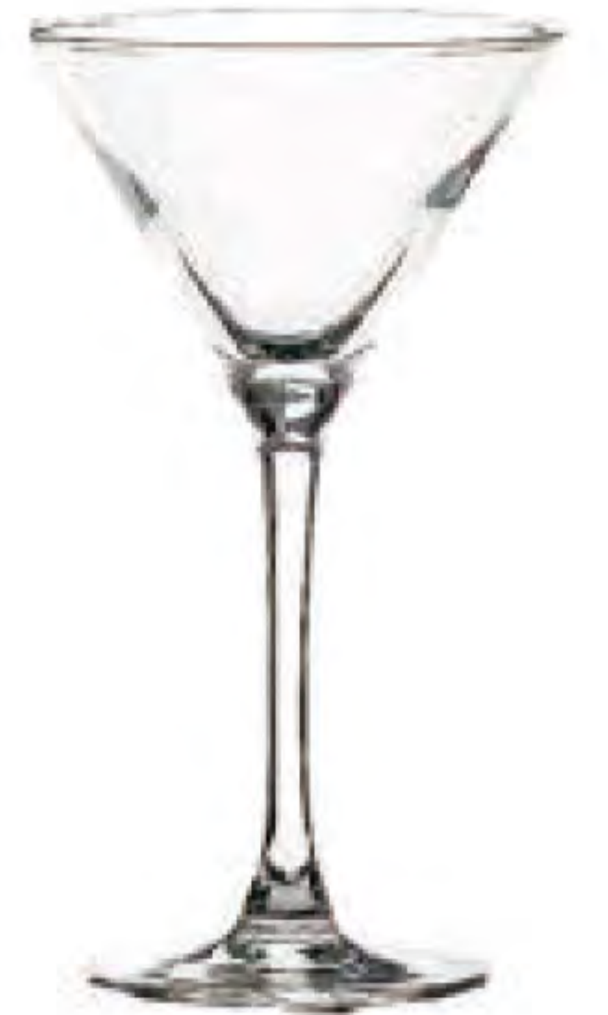
E-5972 150cc 馬丁尼杯 H: 165mm Φ: 93mm 6x4