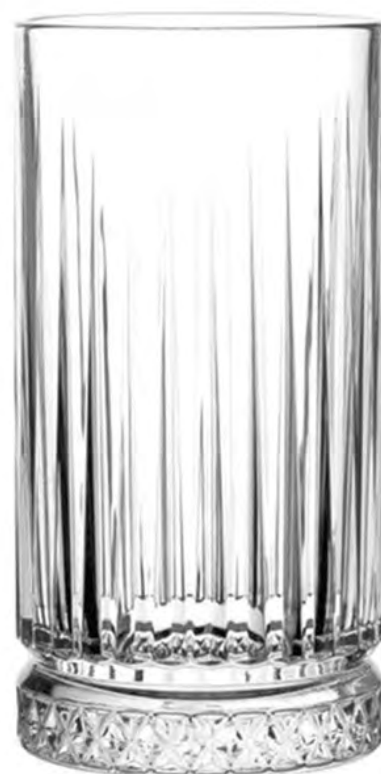
P-520015 445cc 雞尾酒杯 H:150mm Φ:76mm