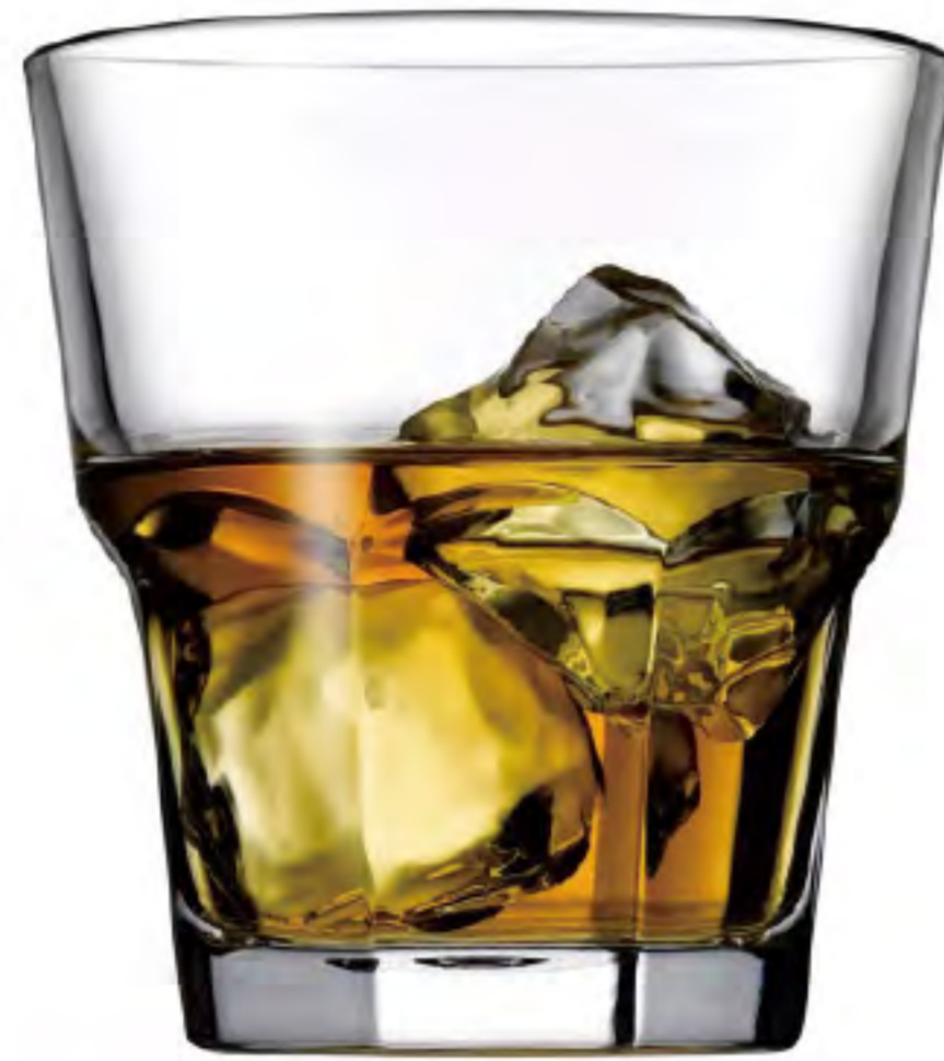
T P-52705 270cc 威士忌杯 H: 92 mm φ: 86 mm