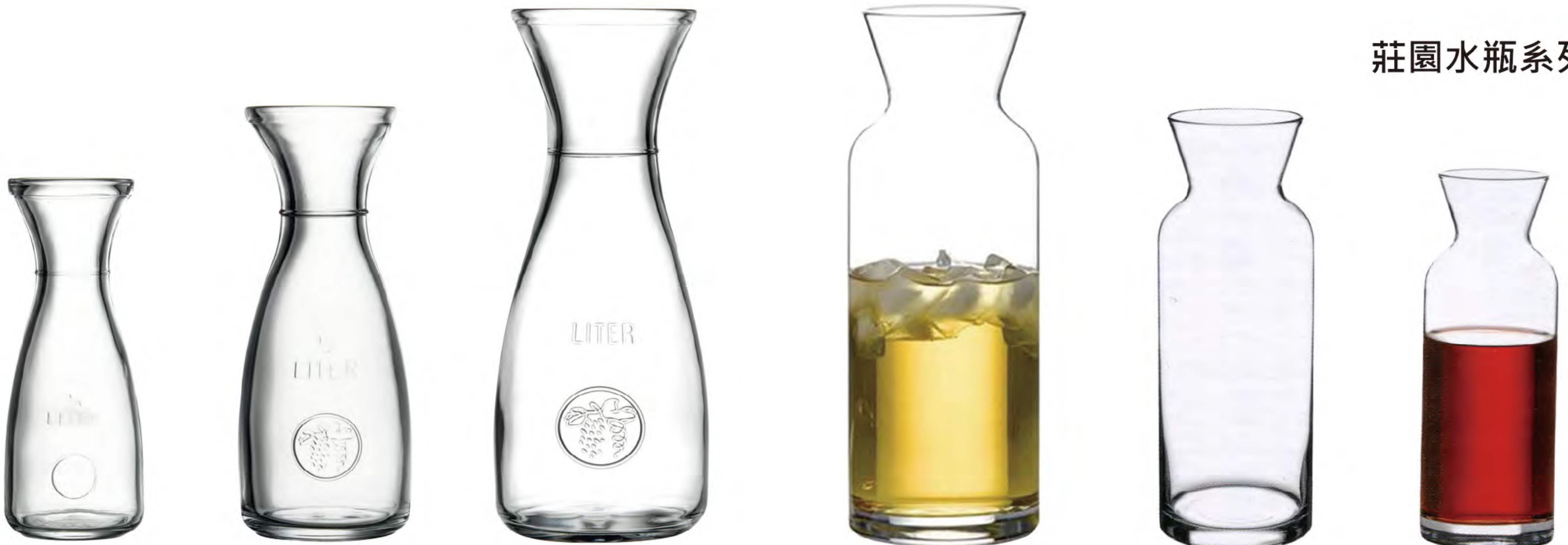
P-80112 250cc 冷水瓶 H: 176mm φ: 67mm