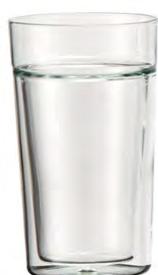
DW287 287cc 雙層杯 H : 137mm Φ : 73 mm