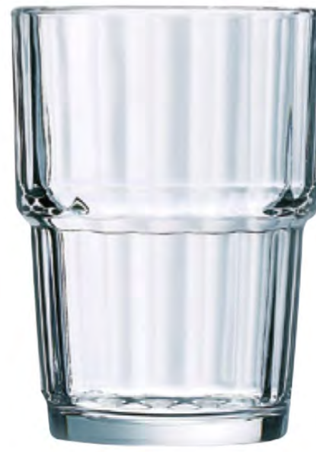
AR-61697 250cc 強化 條紋可疊杯 H : 94mm φ : 77mm