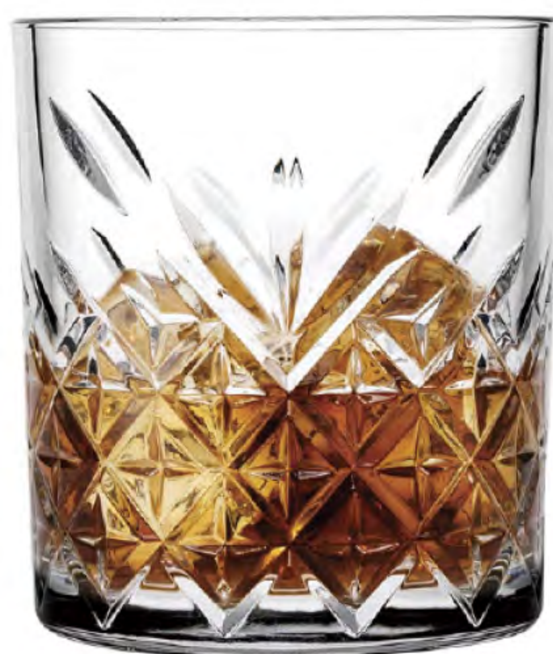
P-52790 345cc 威士忌杯 H:96mm Φ:85.5mm