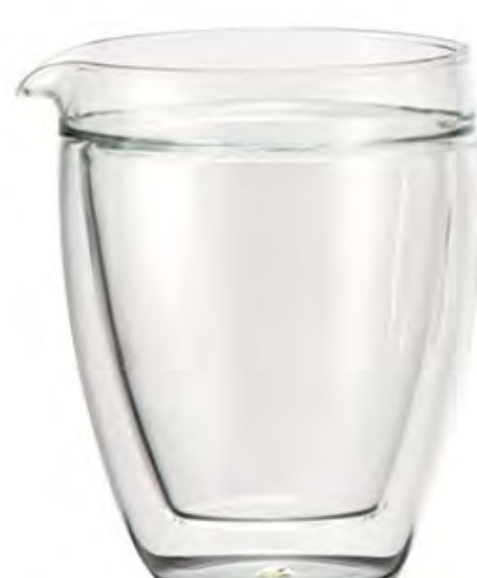
DWB314 314cc 雙層公杯 H : 114mm Φ : 80 mm