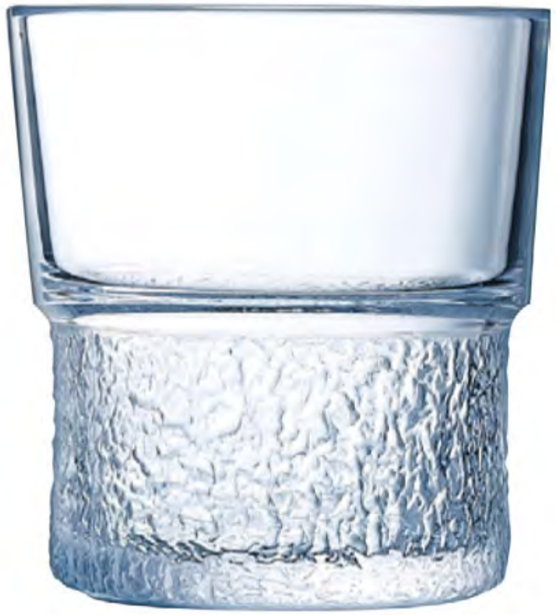
L-3674 210cc 強化 霧紋可疊杯 H : 77mm φ : 80mm