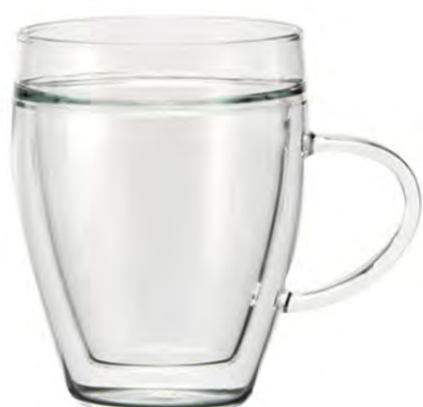
DWH-314 314cc 雙層馬克杯 H : 114mm Φ : 80 mm