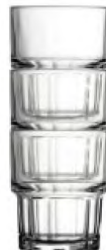
T P-52459 200cc 雙層水杯 H: 84 mm φ: 71.5 mm