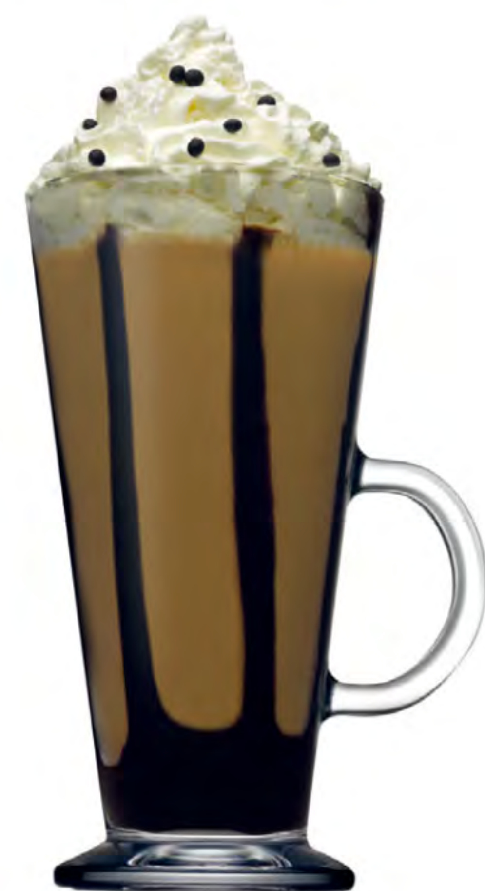
T P-55163 455cc 強化拿鐵杯 H : 175mm φ : 91mm