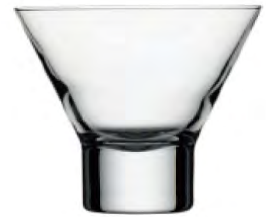
P-41813 230cc 冰淇淋杯 H: 87 mm. φ: 106 mm