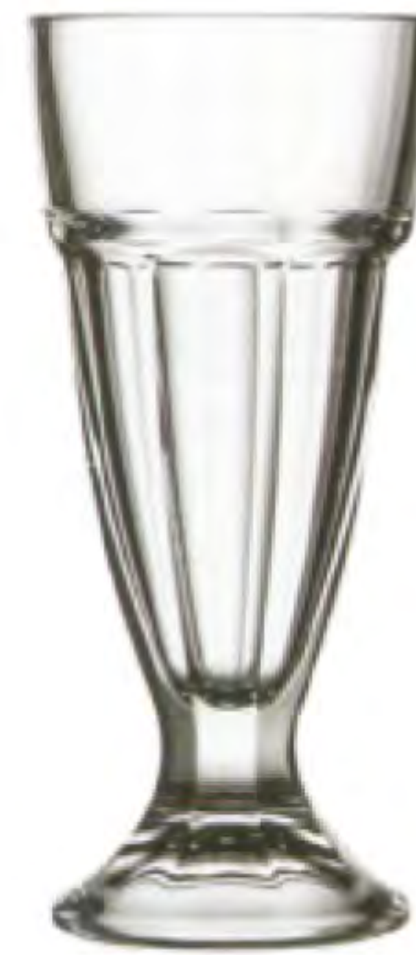
P-51128 冰淇淋杯 H: 188 mm φ: 72 mm