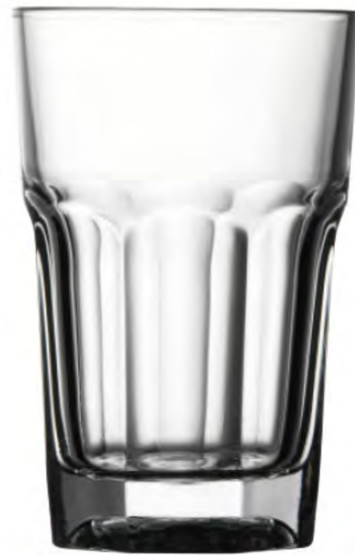
T P-52703 290cc 冰咖啡杯 H: 120 mm φ: 78 mm