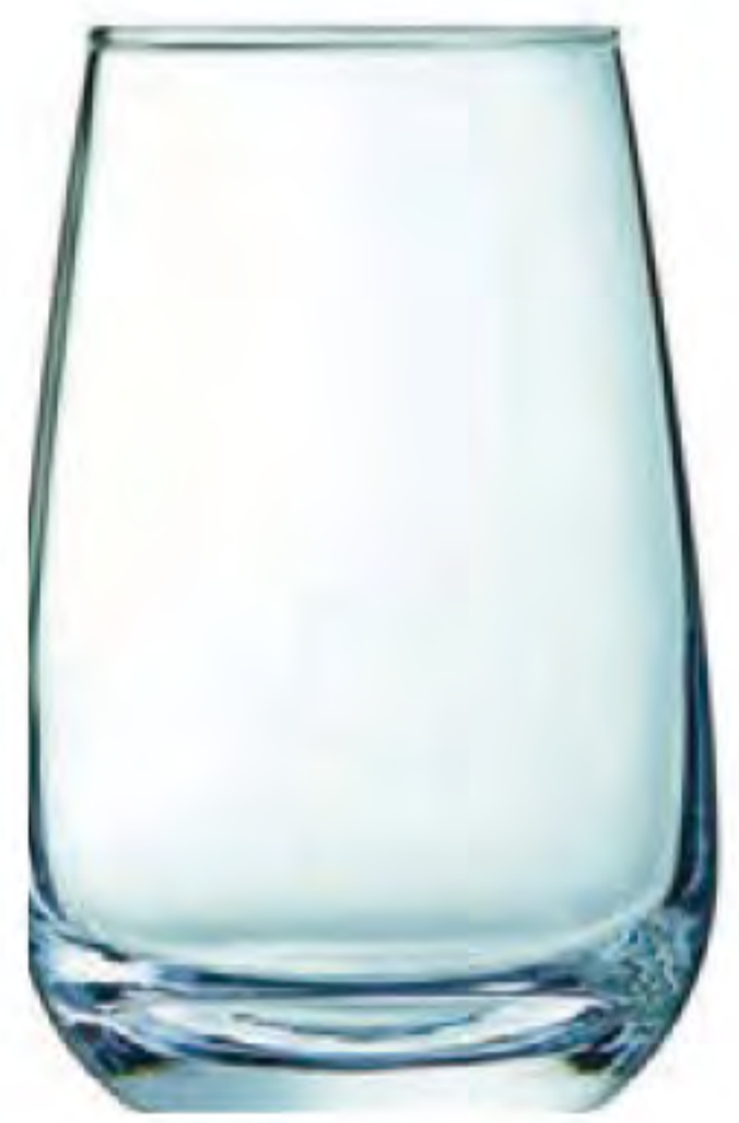
L-3501 350cc 干邑水杯 H: 125mm Φ: 81mm 6x4