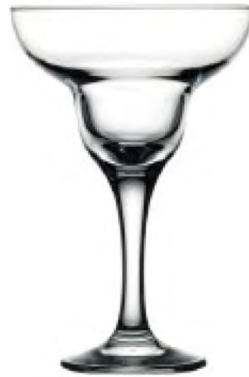
P-44386 305cc 瑪格麗特 冰淇淋杯 H: 169 mm φ: 115 mm