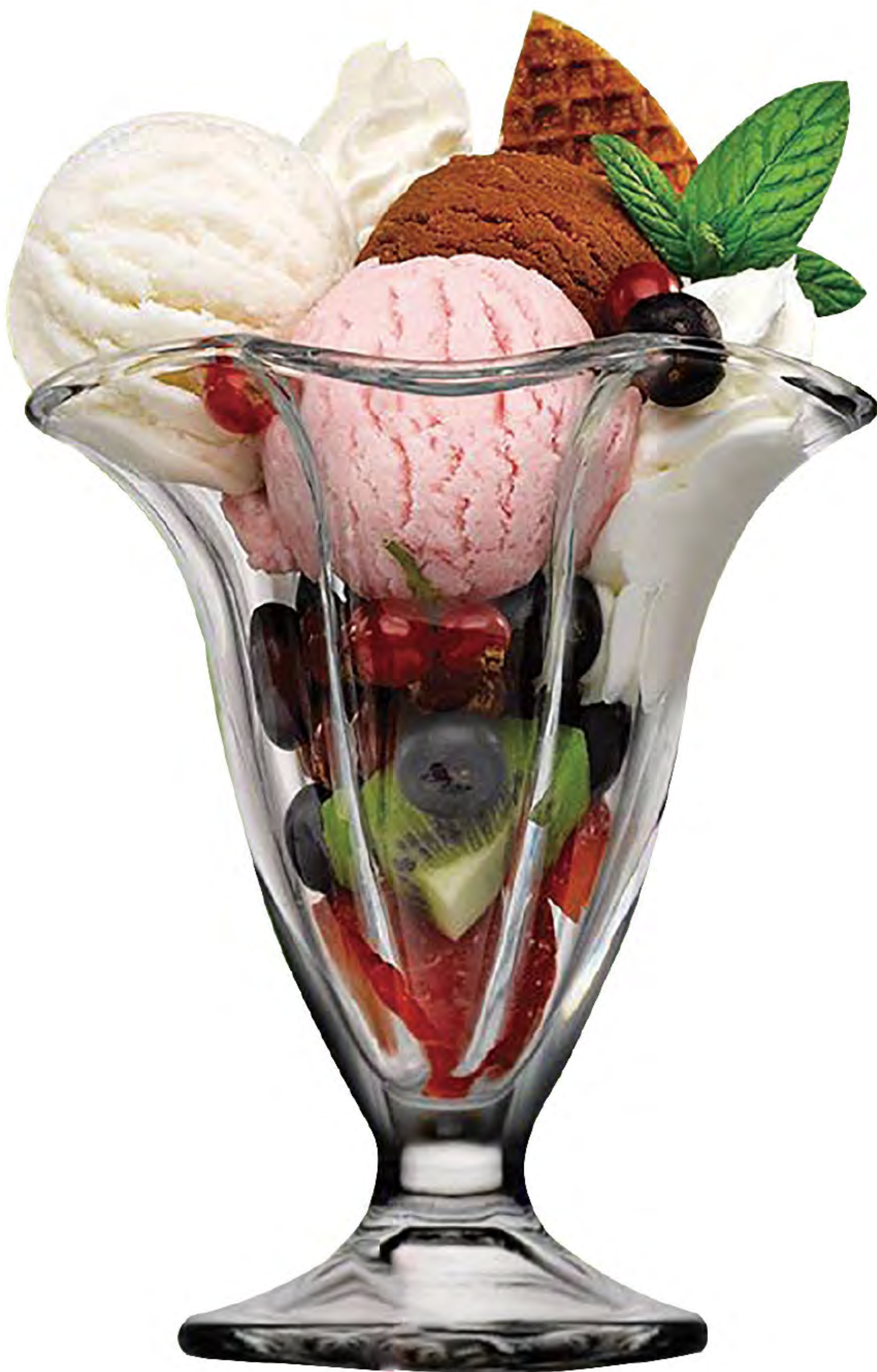
P-51068 花式冰淇淋杯 H: 118 mm φ: 115 mm