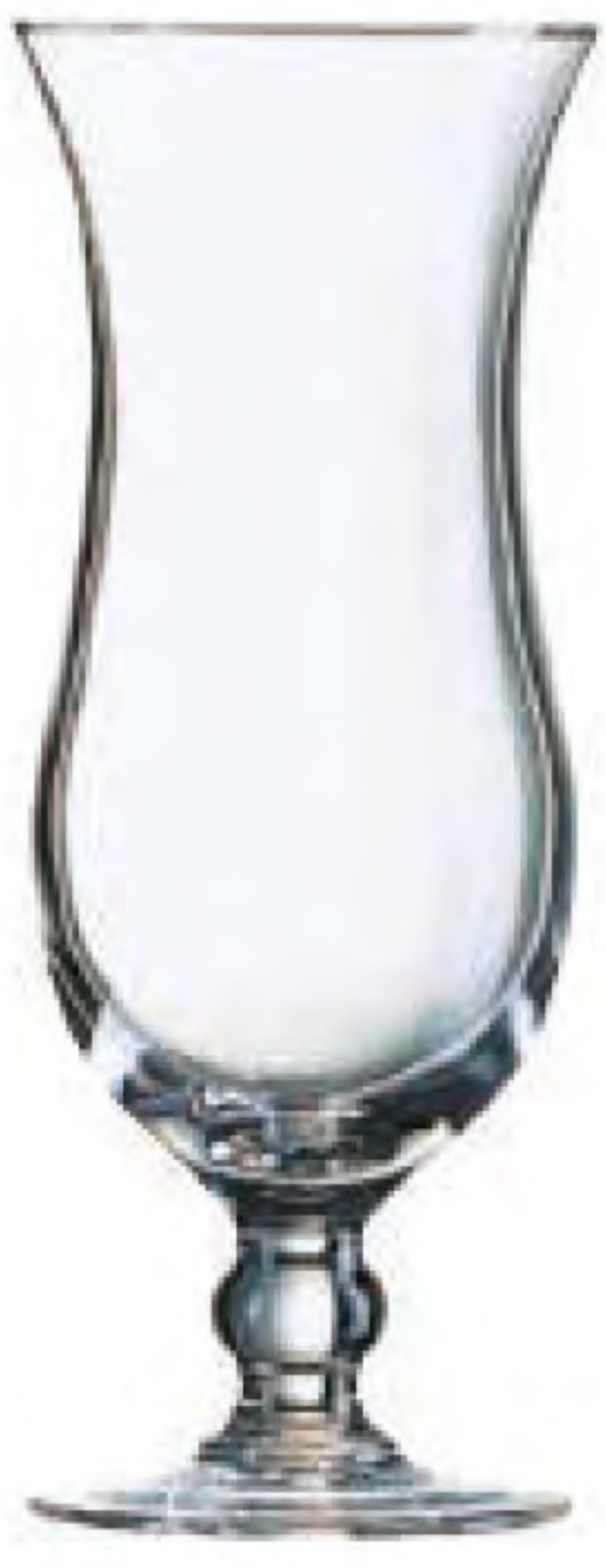
F-51253 640cc 風暴果汁杯 H : 250mm φ : 80mm 6x4