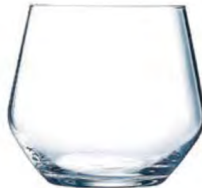
L-4750 360cc 羅亞威士忌 H: 83mm Φ: 74mm 6x4