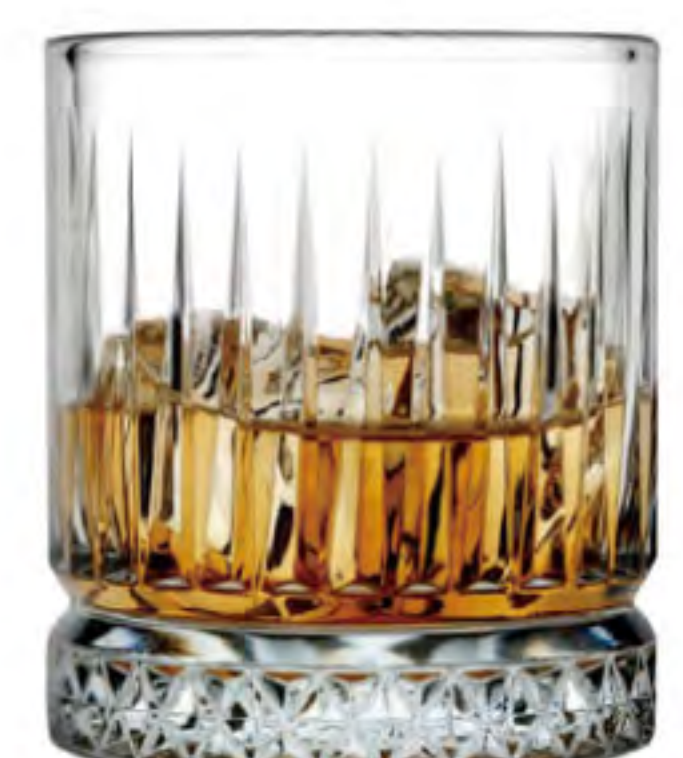
P-520014 210cc 威士忌酒杯 H:85mm Φ:73mm