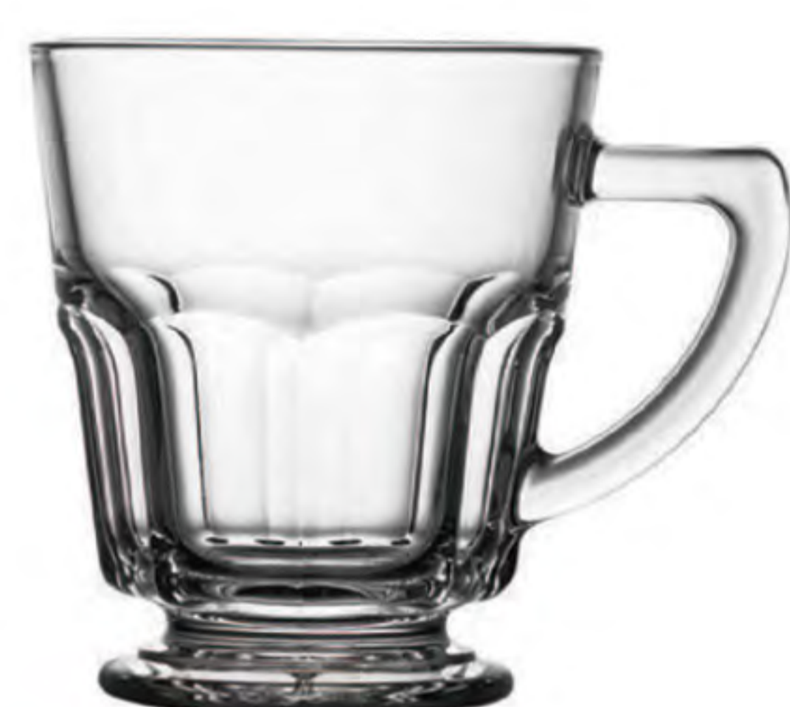
T P-55202 270cc 卡沙巴蘭卡 古典八角杯 H: 105.5 mm φ: 86 mm