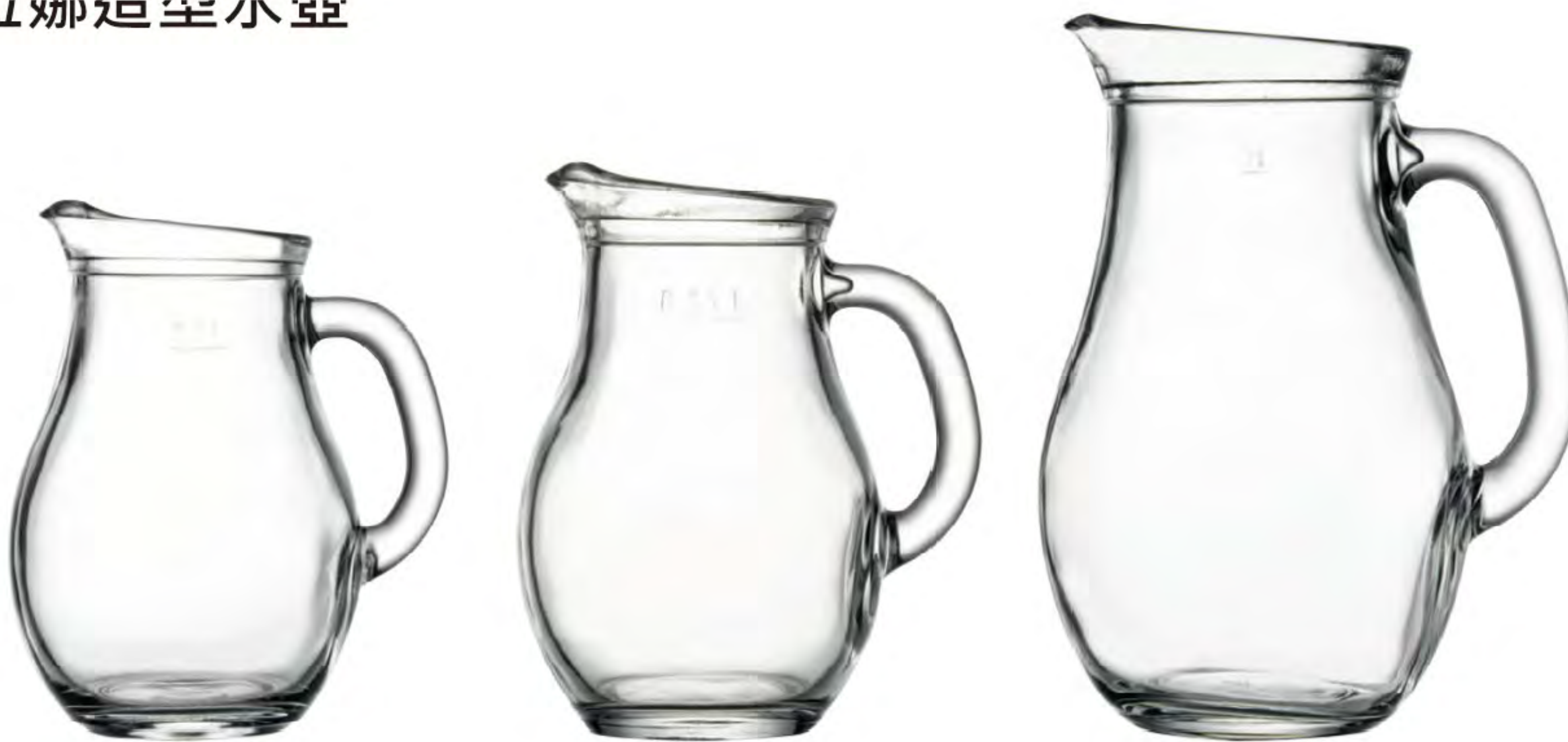
PH-80100 250cc 公杯壺 H: 122mm φ: 62mm