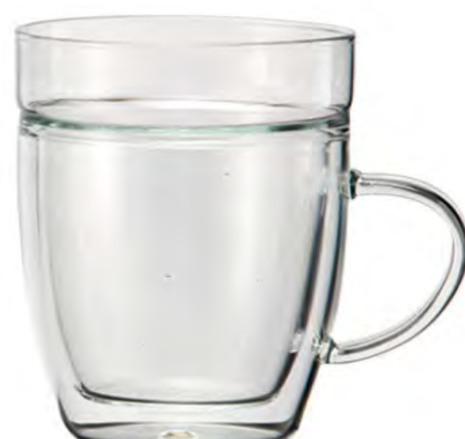
DWH-450 450cc 雙層馬克杯 H : 120mm Φ : 90 mm