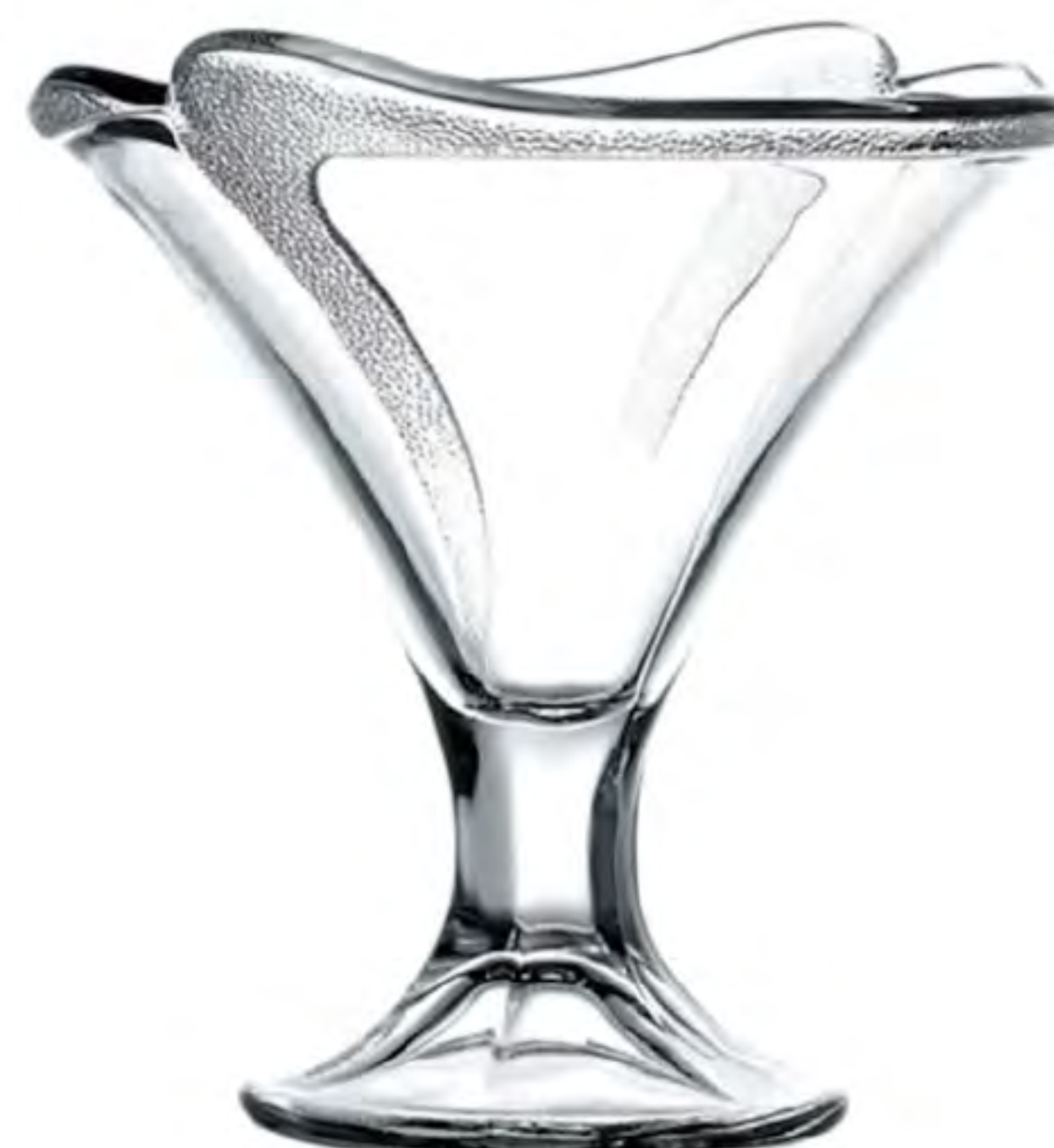
P-51328 花瓣聖代杯 H: 134.5 mm φ: 144.5 mm