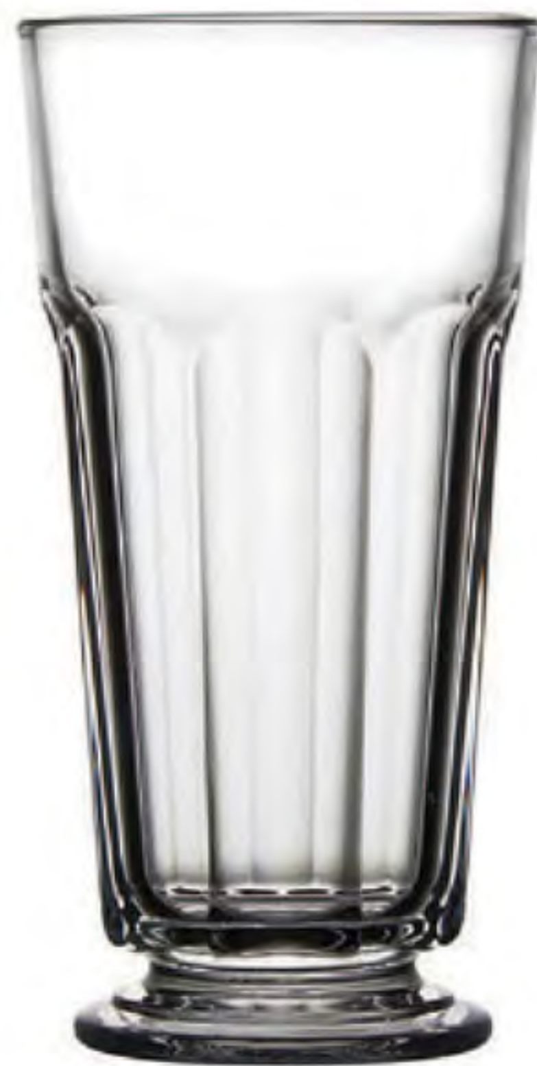
T P-52640 350cc 卡沙巴蘭 卡古典八角杯 H: 160 mm. φ: 80.5 mm