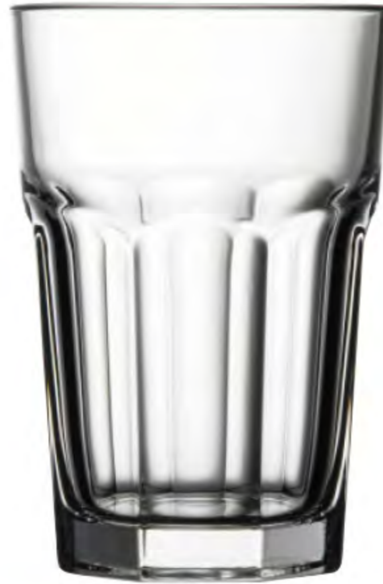
T P-52708 361cc 冰咖啡杯 H: 122 mm φ: 82 mm