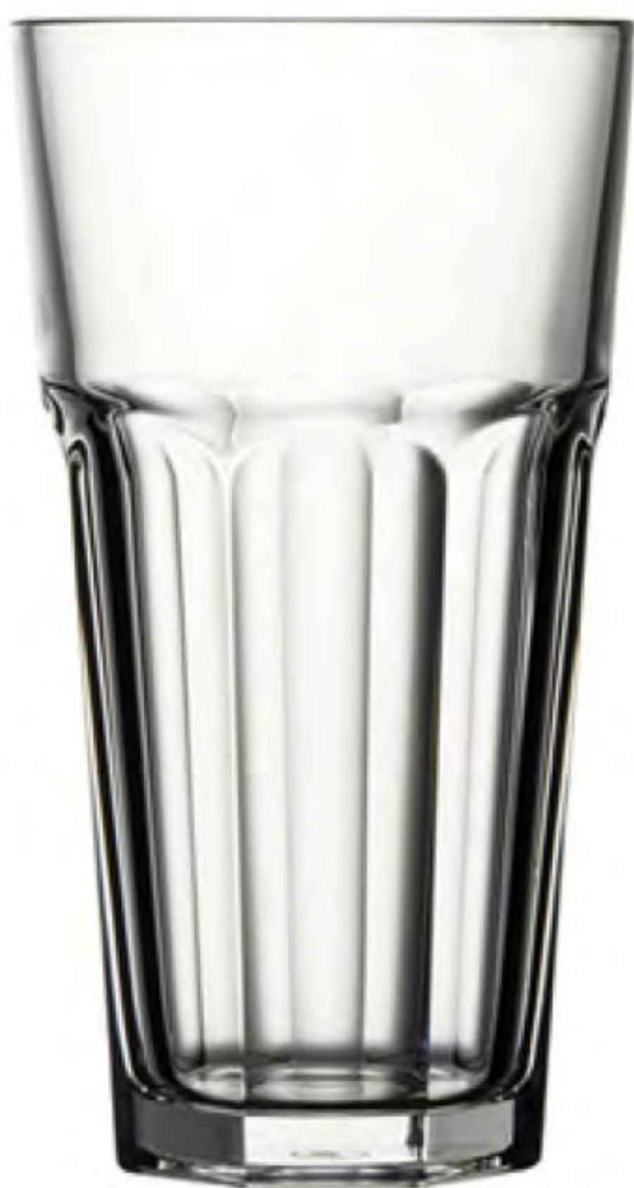
T P-52719 645cc 啤酒杯 H: 177 mm φ: 95 mm