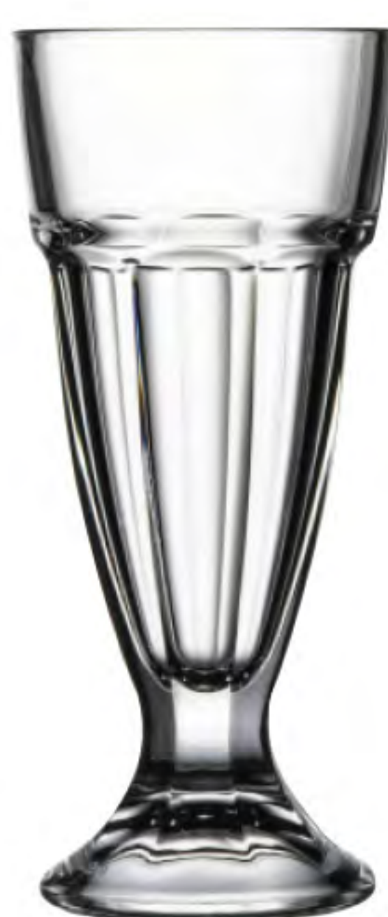
P-51128 294cc 咖啡杯 H: 188 mm. φ: 72 mm