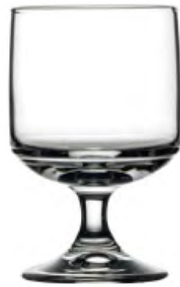
T P-44034 175cc 強化可疊杯 H: 104 mm φ: 65 mm