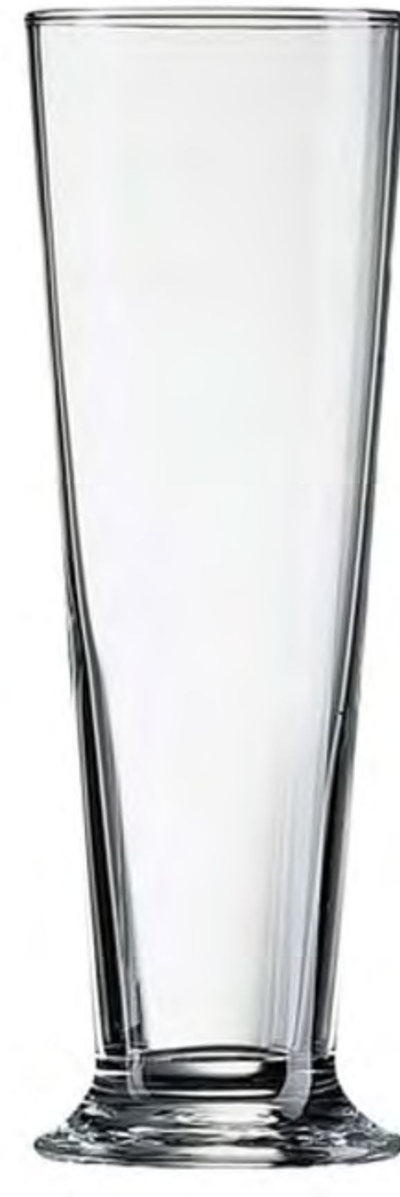
AR-25263 390cc 立茲杯 H : 206mm φ : 69mm 6x4