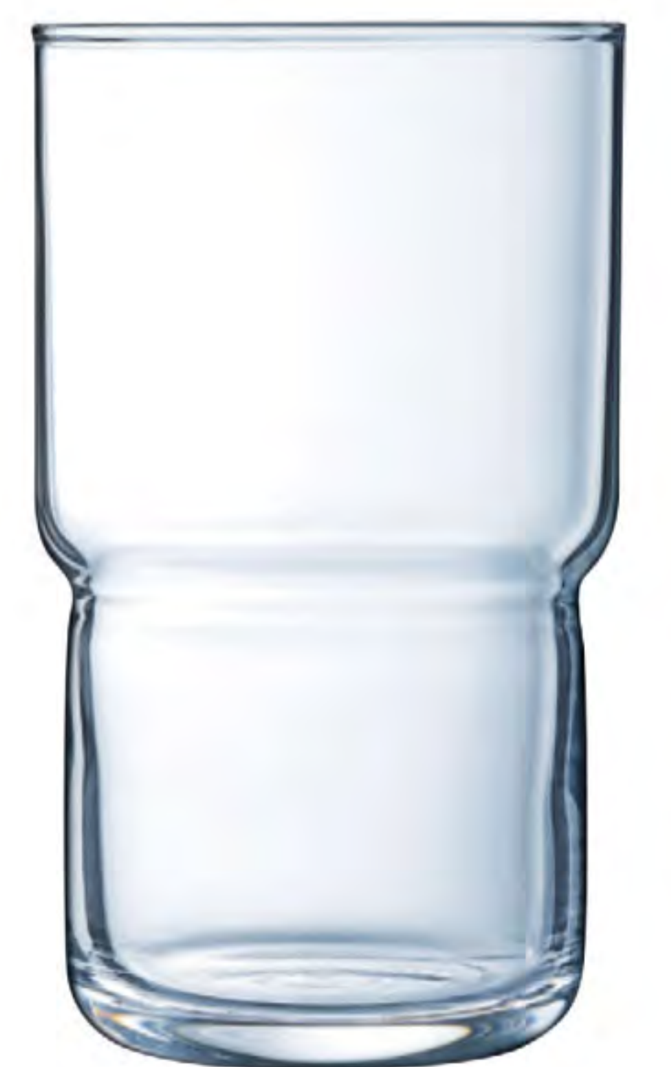
L-9946 320cc 強化可疊杯 H : 120mm φ : 70mm