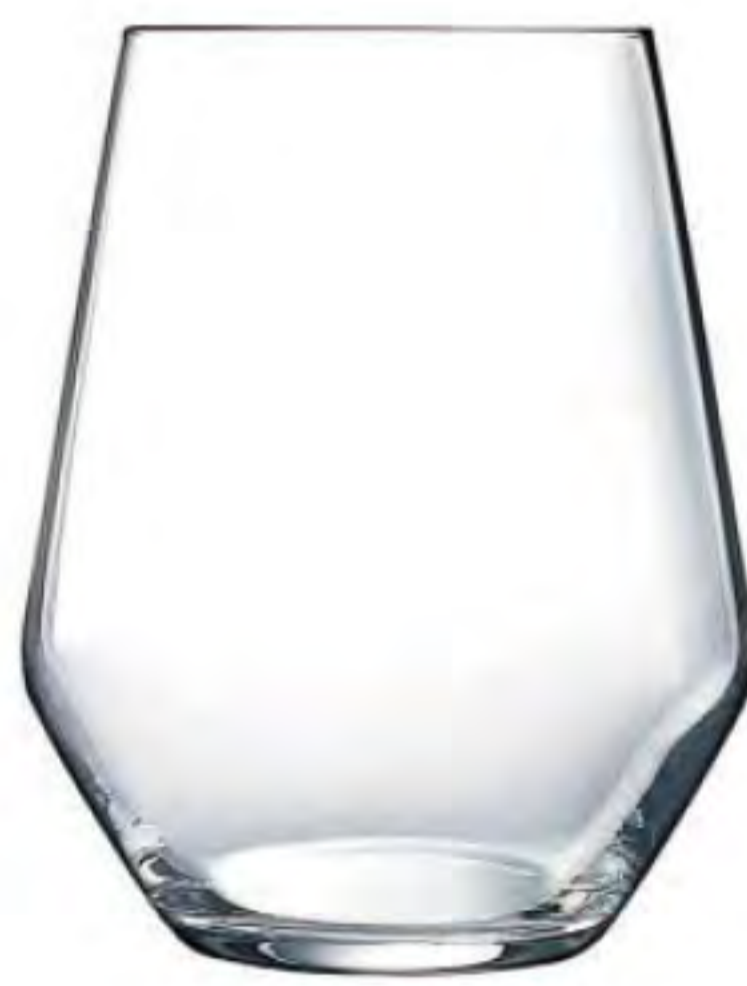
L-4749 400cc 羅亞水杯 H: 110mm Φ: 62mm 6x4