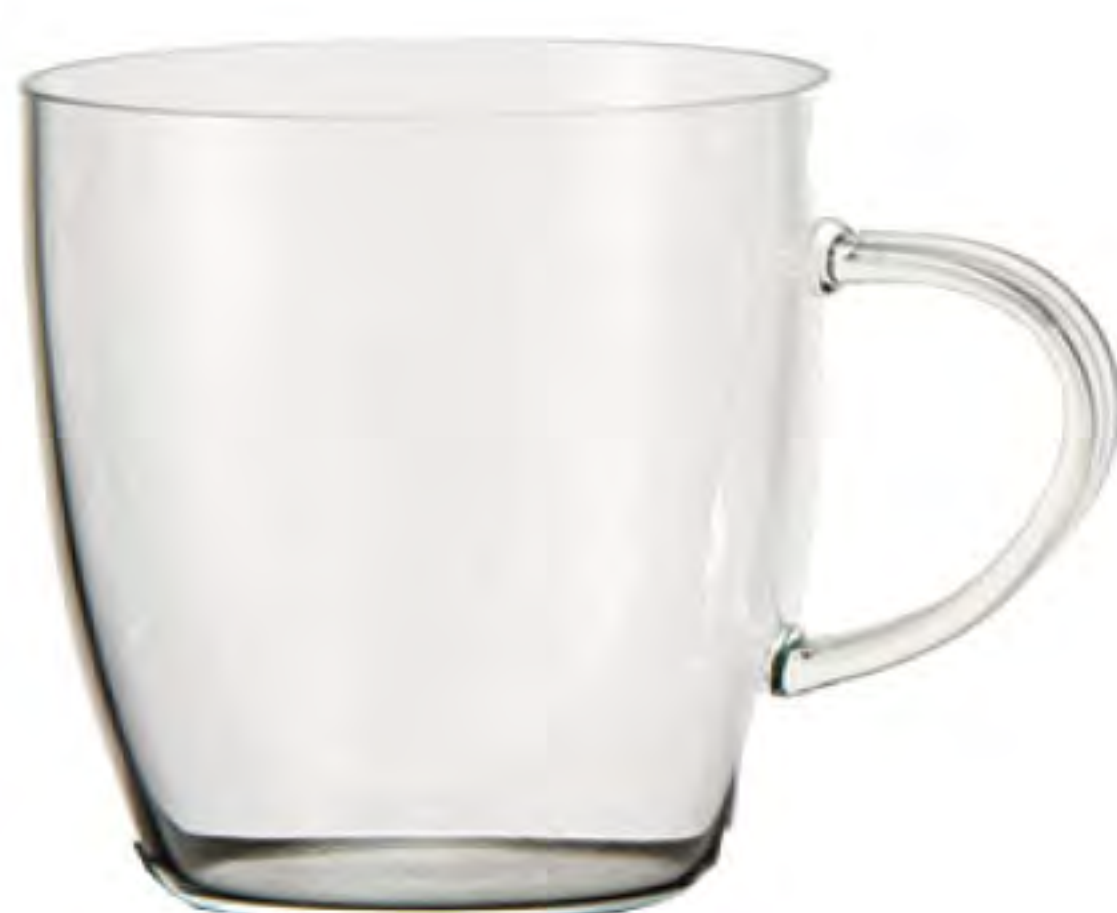
BGH450 450cc 耐熱馬克杯 H : 83 mm Φ : 98 mm