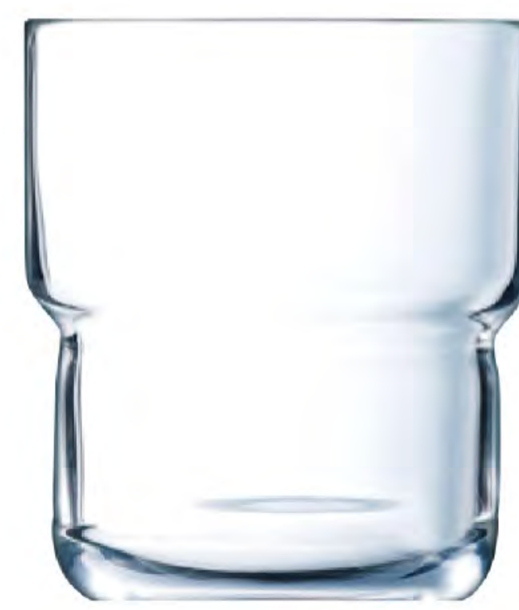
L-9945 270cc 強化可疊杯 H : 93mm φ : 76mm