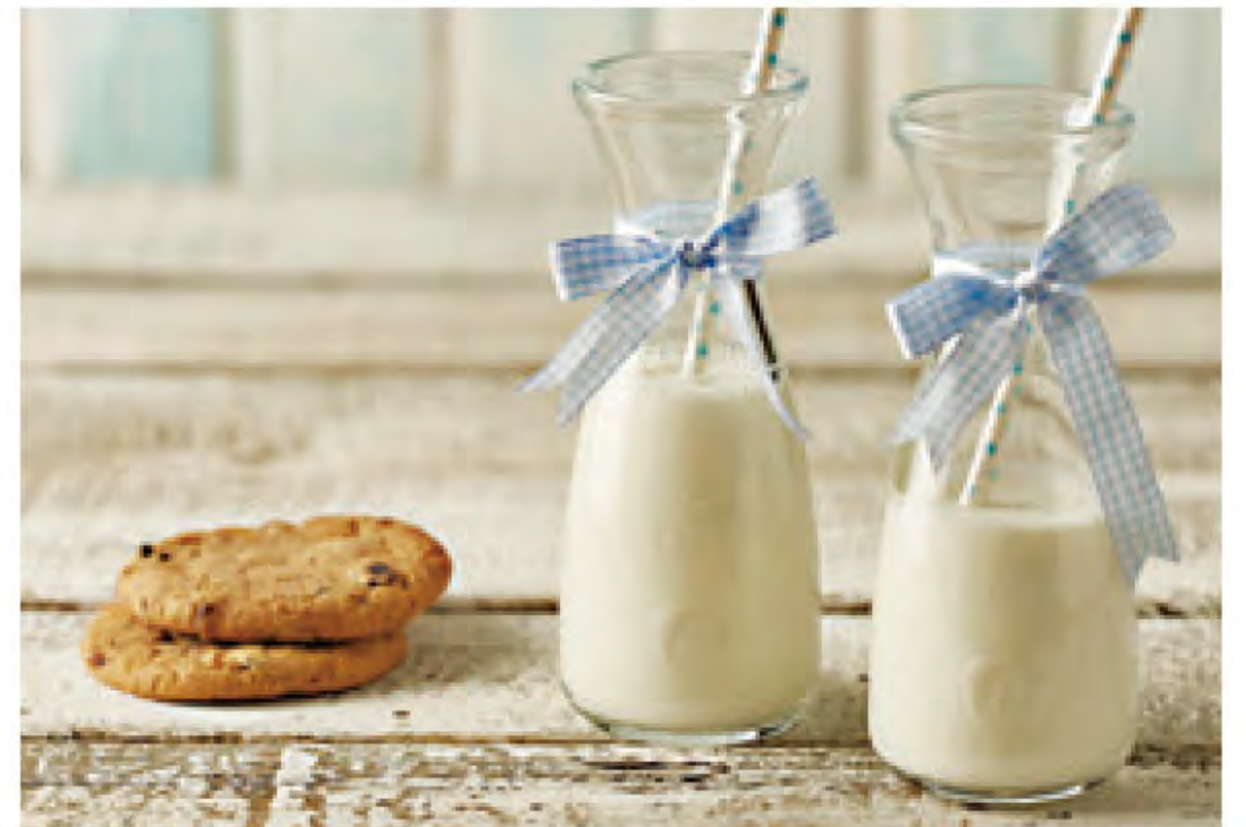
PH-80102 1000cc 公杯壺 H: 200mm φ: 97mm