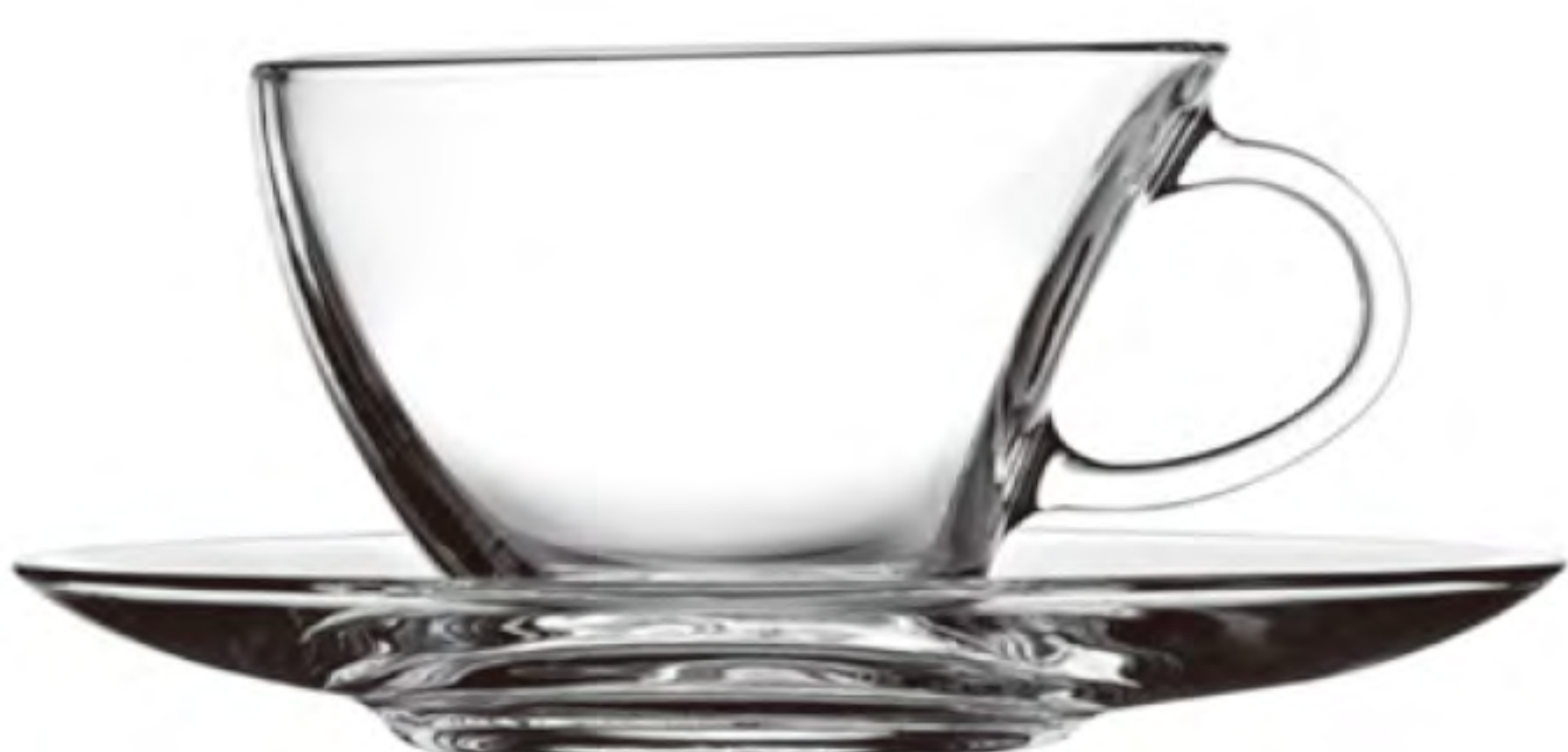
P-98396 230cc 帆船咖啡杯盤 杯 H: 67mm φ: 96mm 盤 H: 20mm φ: 137mm