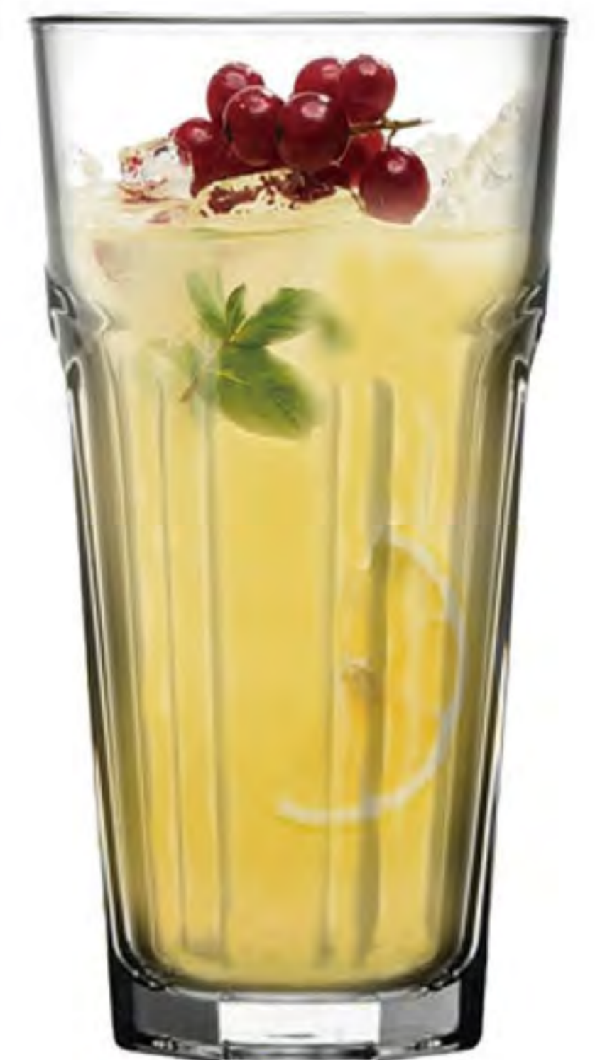
T P-52707 470cc 紅茶杯 H: 162 mm φ: 85 mm