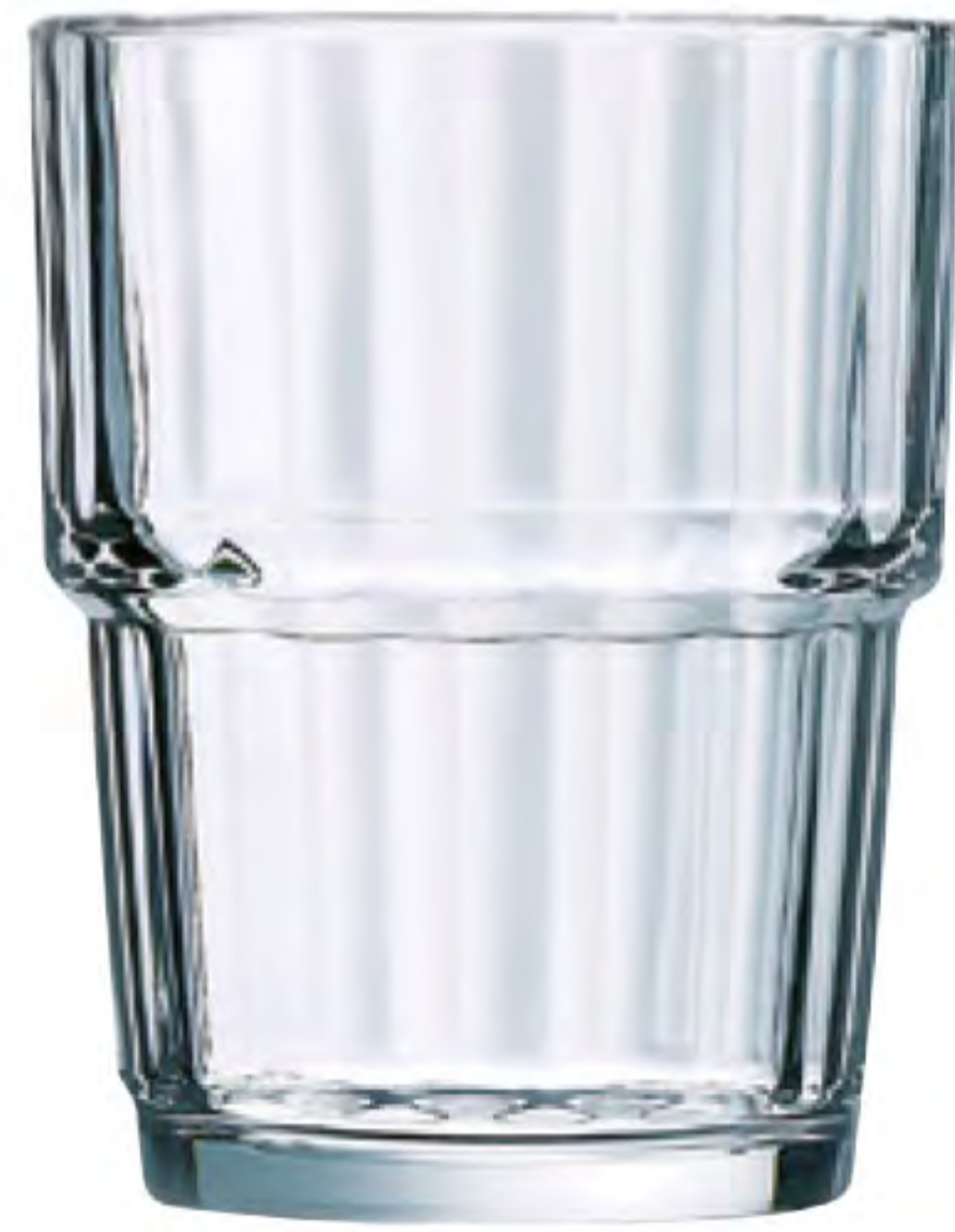
AR-60024 200cc 強化 條紋可疊杯 H : 88mm φ : 72mm