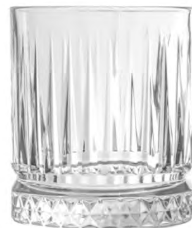
P-520004 355cc 威士忌酒杯 H:98mm Φ:84mm