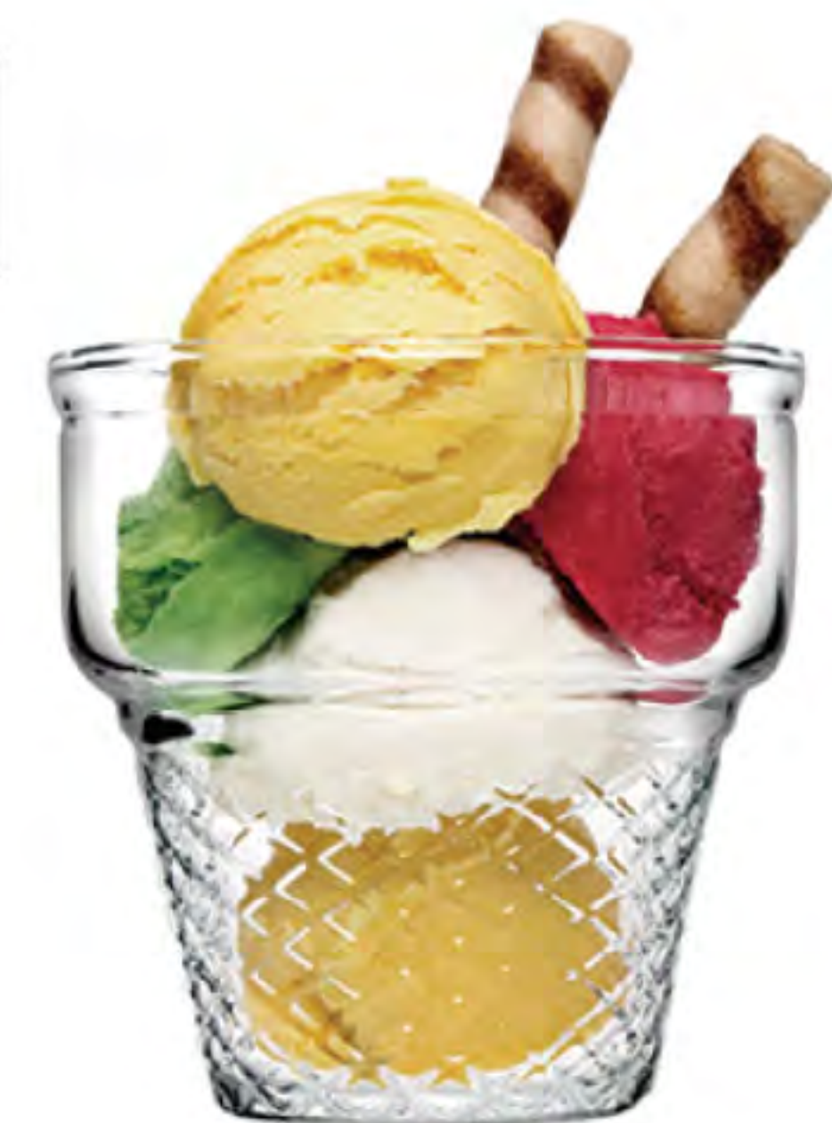
P-410006 245cc 沃福冰淇淋杯 H: 86 mm φ: 85 mm