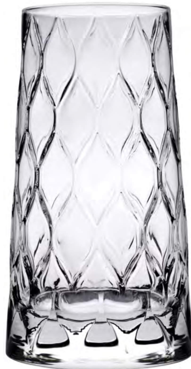
P-420955 450cc 火焰杯 H:150mm Φ:60mm 4X6