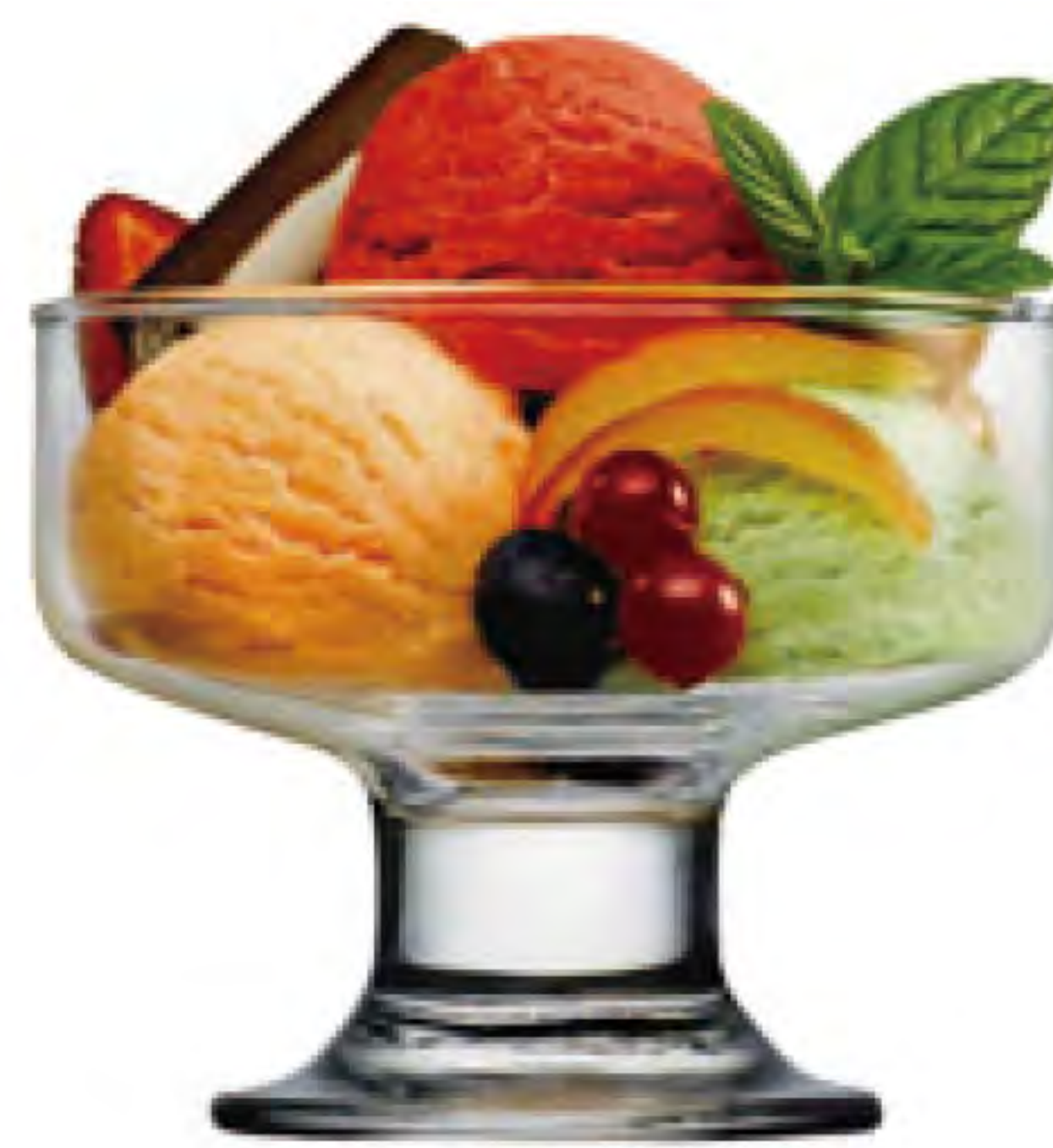
P-41016 265cc 聖代杯 H: 81 mm φ: 100 mm