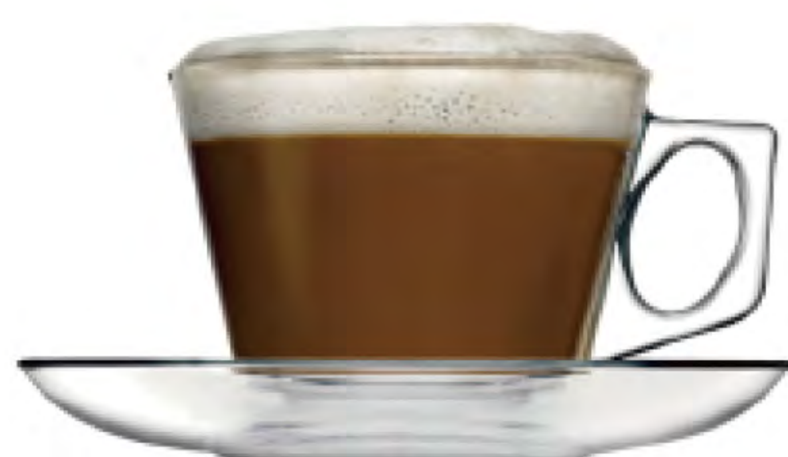
P-97302 195cc 咖啡杯盤 杯 H: 70 mm φ: 85 mm 盤 H: 20 mm φ: 137 mm