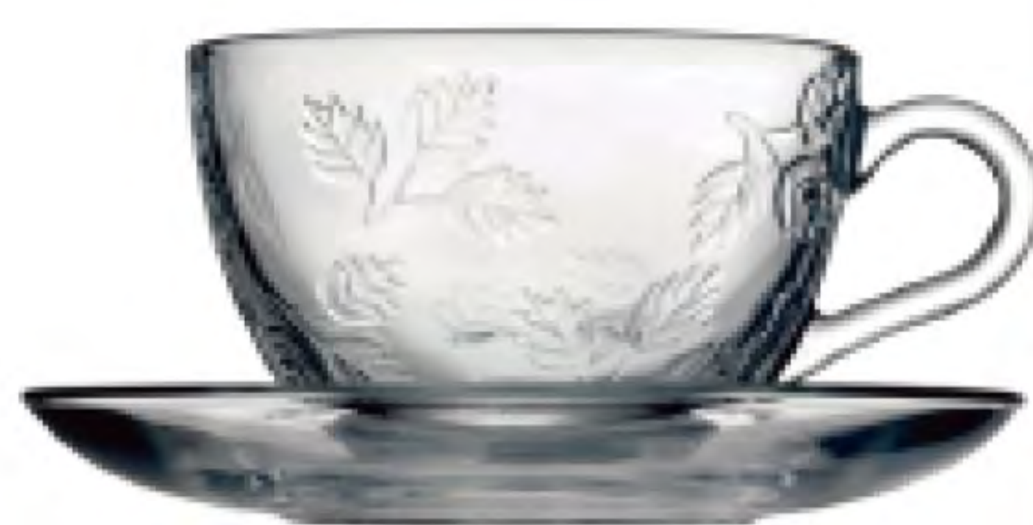
P-95481 220cc 雕花咖啡杯盤 杯 H: 64 mm φ: 91 mm 盤 H: 20 mm φ: 137 mm