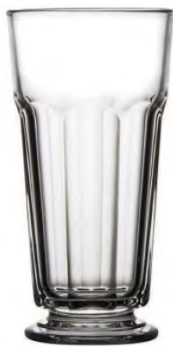
T P-52640 350cc 卡沙巴蘭 卡古典八角杯 H: 160 mm. φ: 80.5 mm