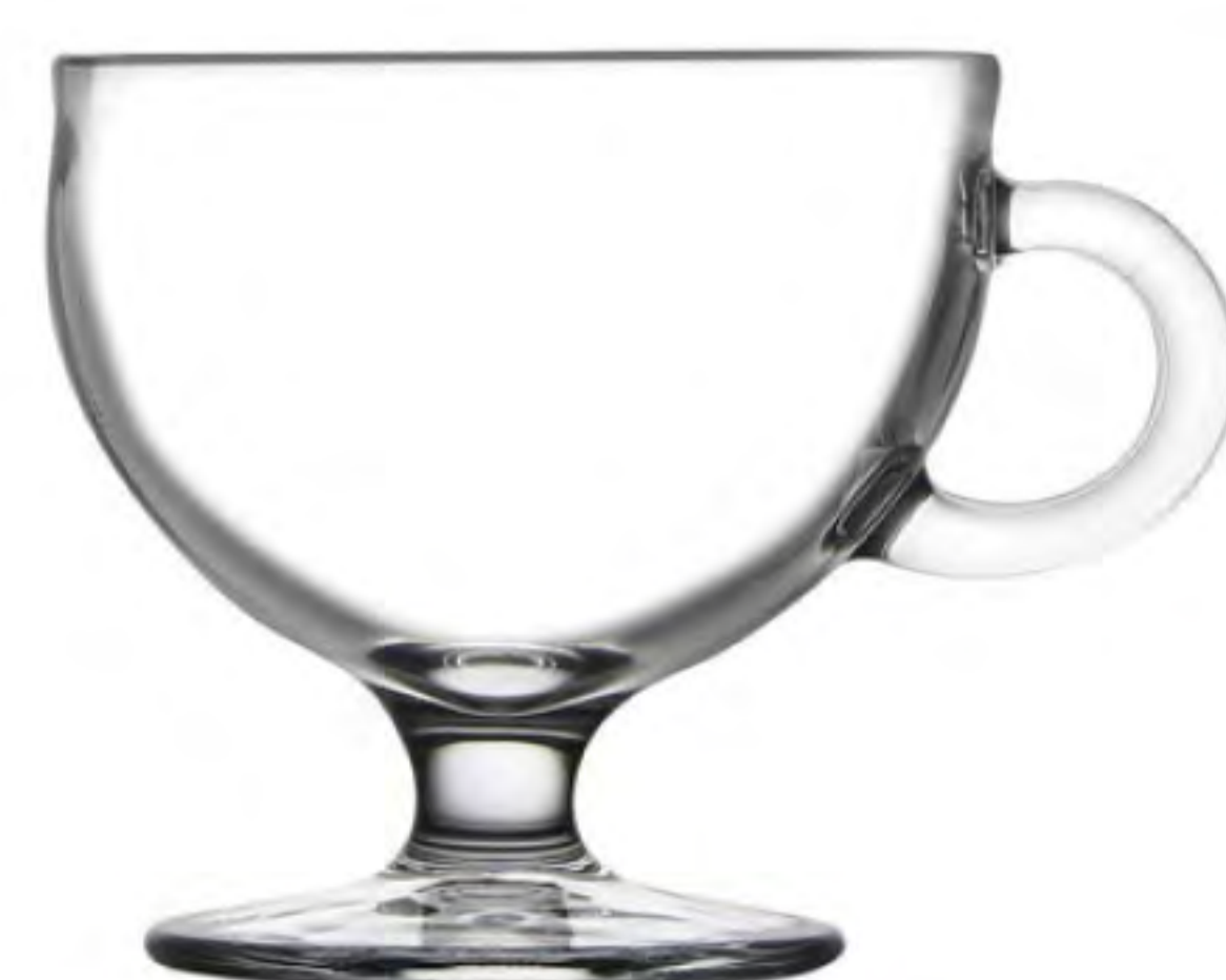
P-55182 250cc 咖啡杯 h: 98 mm φ: 93.5 mm