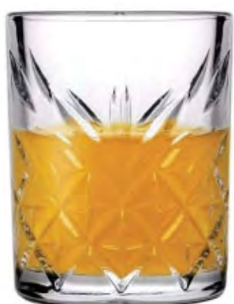
P-52780 60cc 烈酒杯 H:61.5mm Φ:48.5mm