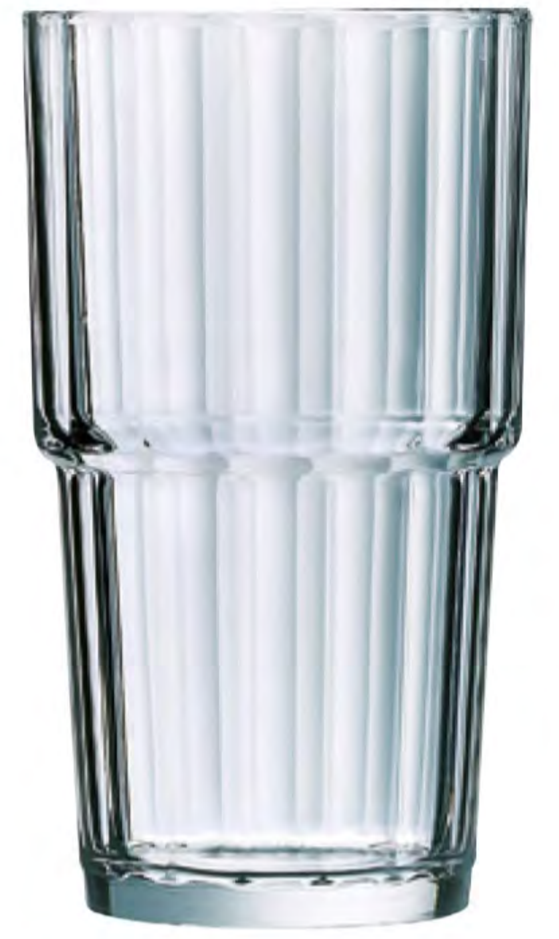
AR-61698 320cc 強化 條紋可疊杯 H : 125mm φ : 74mm