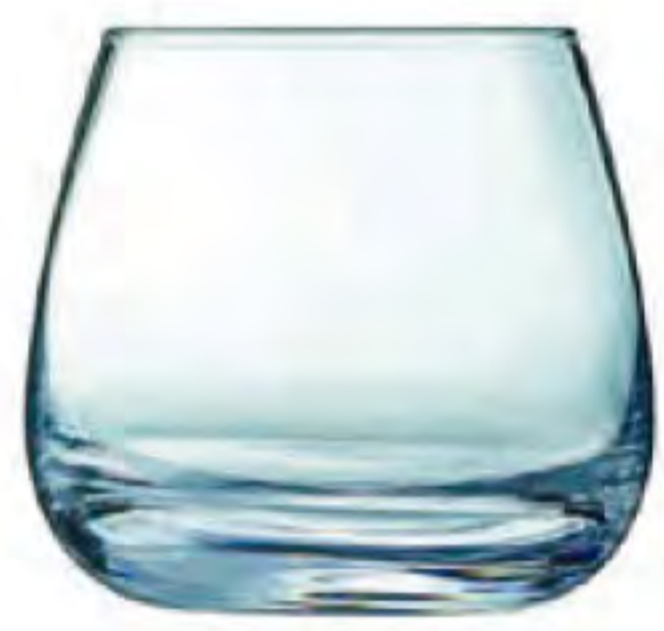
L-6930 300cc 干邑水杯 H: 84mm Φ: 92mm 6x4