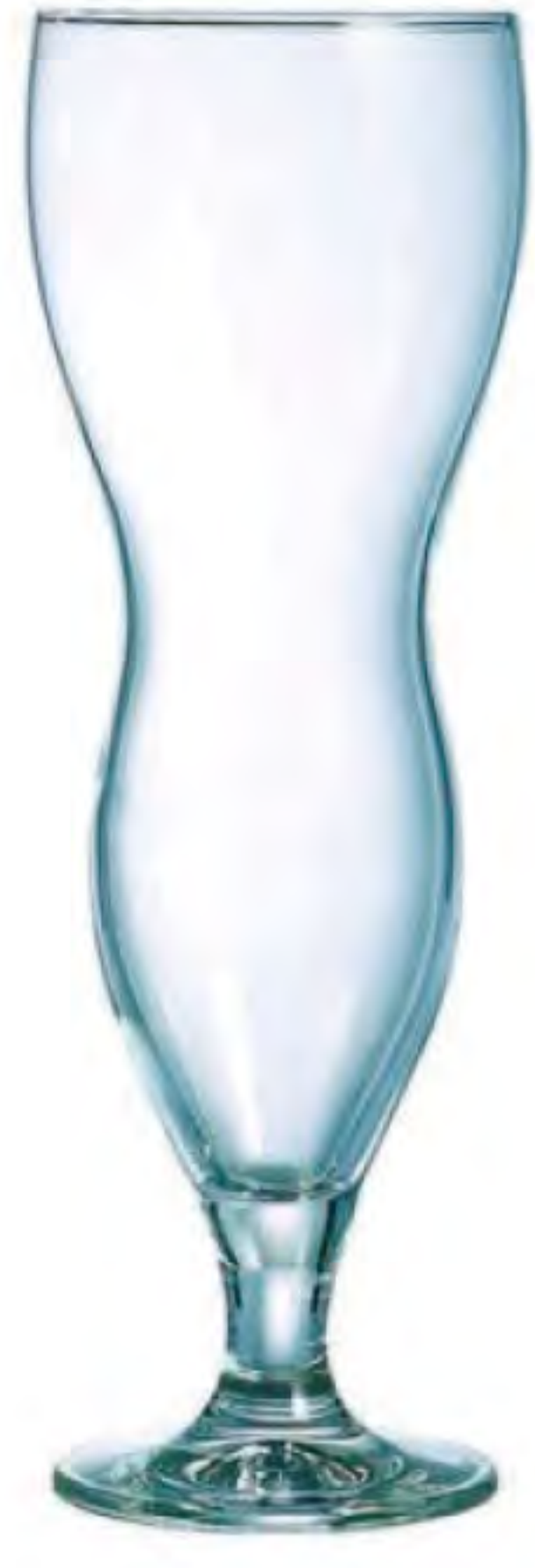
E-0530 440cc 雞尾酒杯 H : 220mm φ : 86mm 6x4