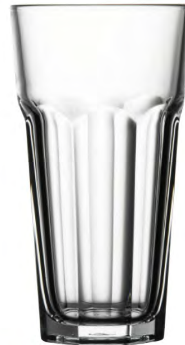
T P-52706 365cc 卡沙巴蘭卡 H: 148 mm φ: 79 mm