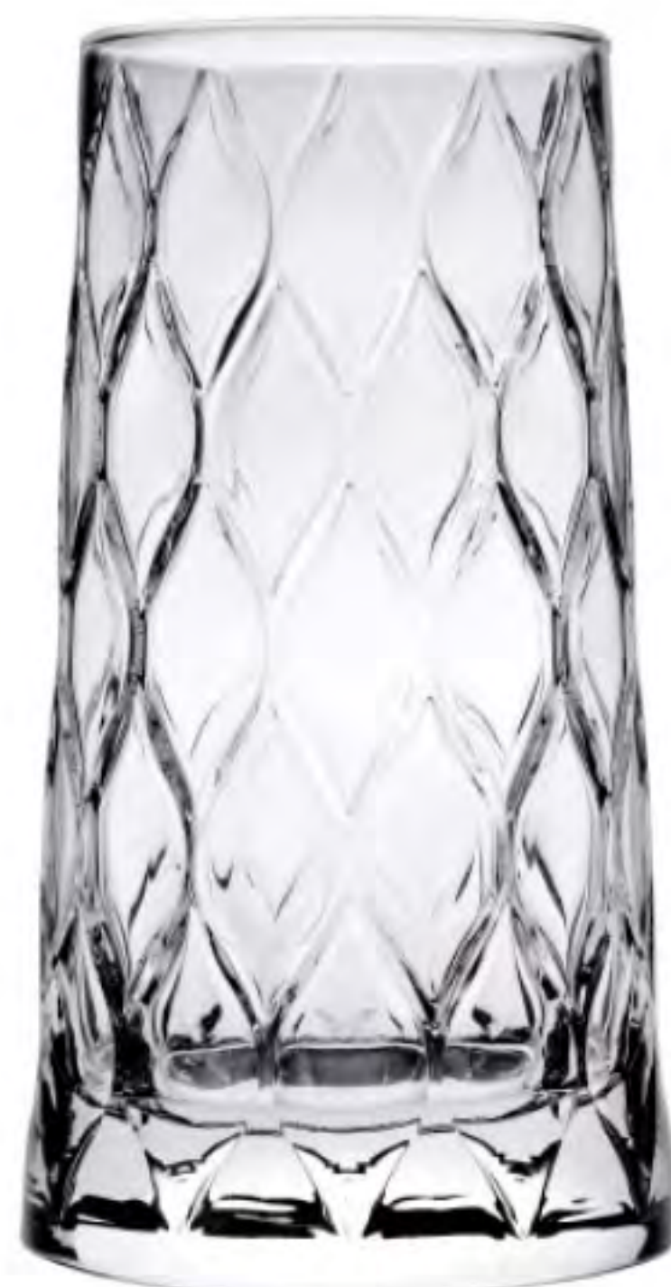
P-420855 345cc 火焰杯 H:140mm Φ:60mm 4X6