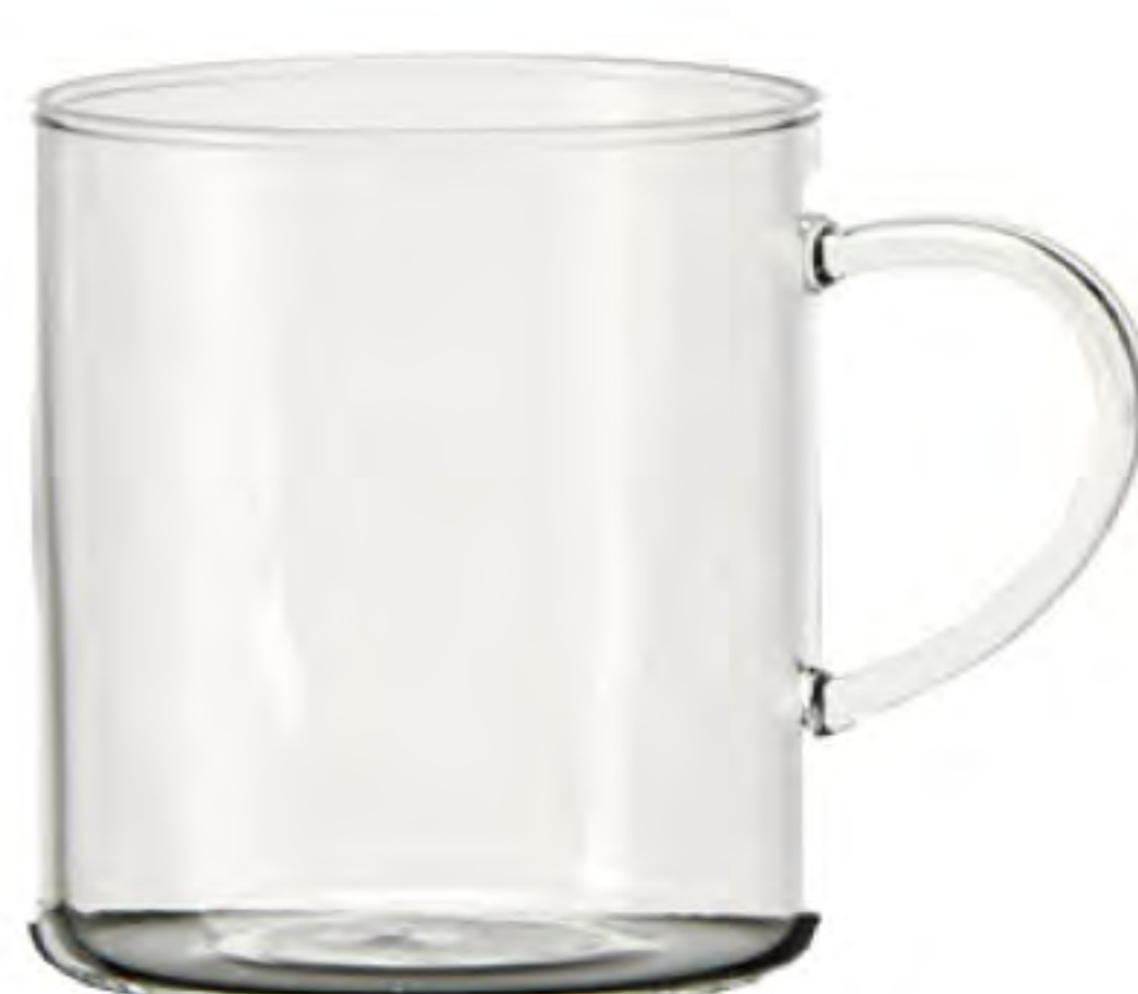
BGH430 430cc 耐熱馬克杯 H : 87 mm Φ : 81 mm