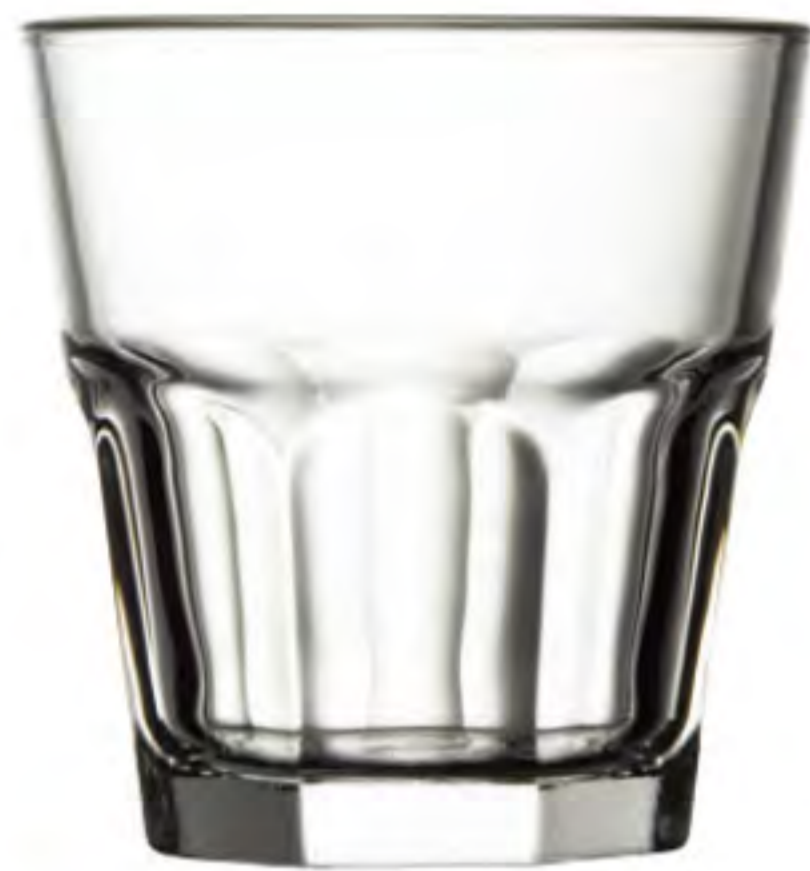
T P-52862 205cc 威士忌杯 H: 82.5 mm φ: 79 mm