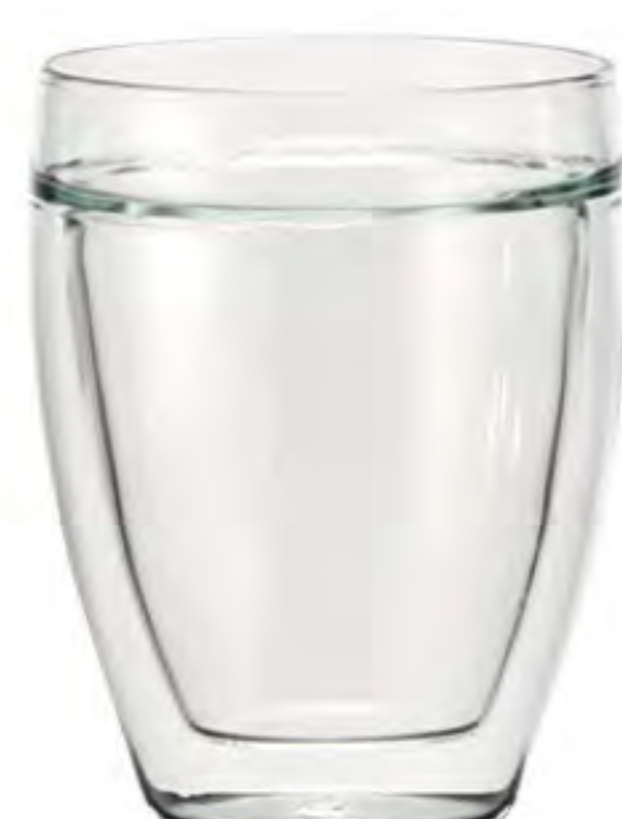
DW314 314cc 雙層杯 H : 114mm Φ : 80 mm