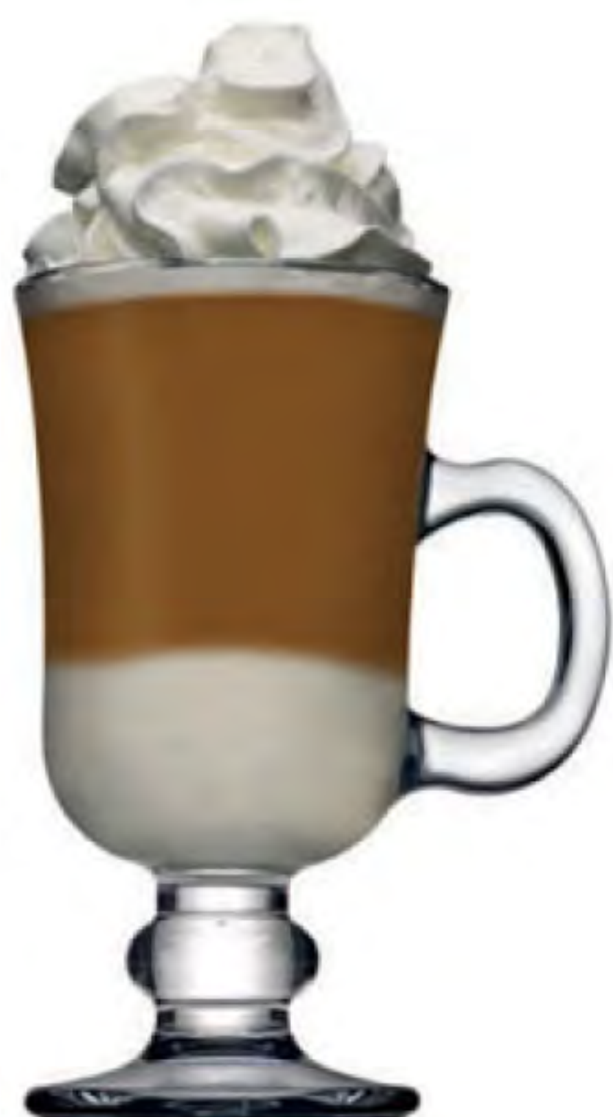
T P-55141 230cc 咖啡杯 H : 146mm φ : 76mm