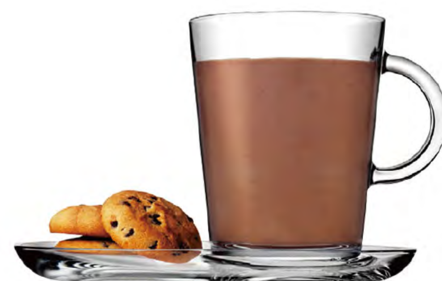
P-95781 400cc 咖啡杯盤 T 杯 H : 114mm φ : 90mm 盤 H : 16mm φ : 184mm