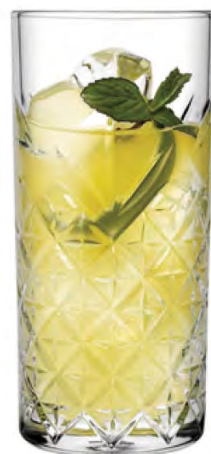
P-52820 295cc 果汁杯 H:143mm Φ:67.5mm