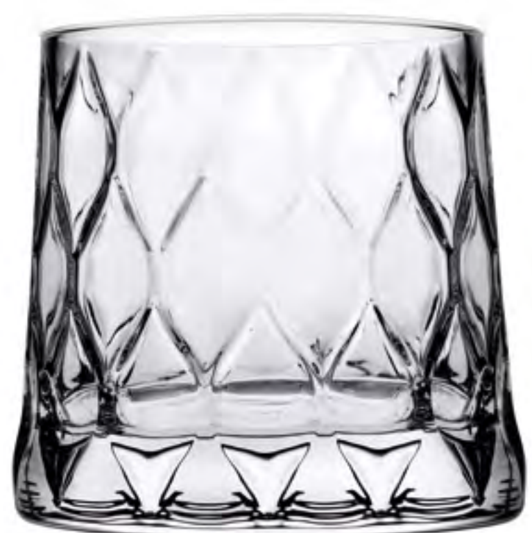
P-420194 300cc 火焰杯 H:85mm Φ:77mm 4X6