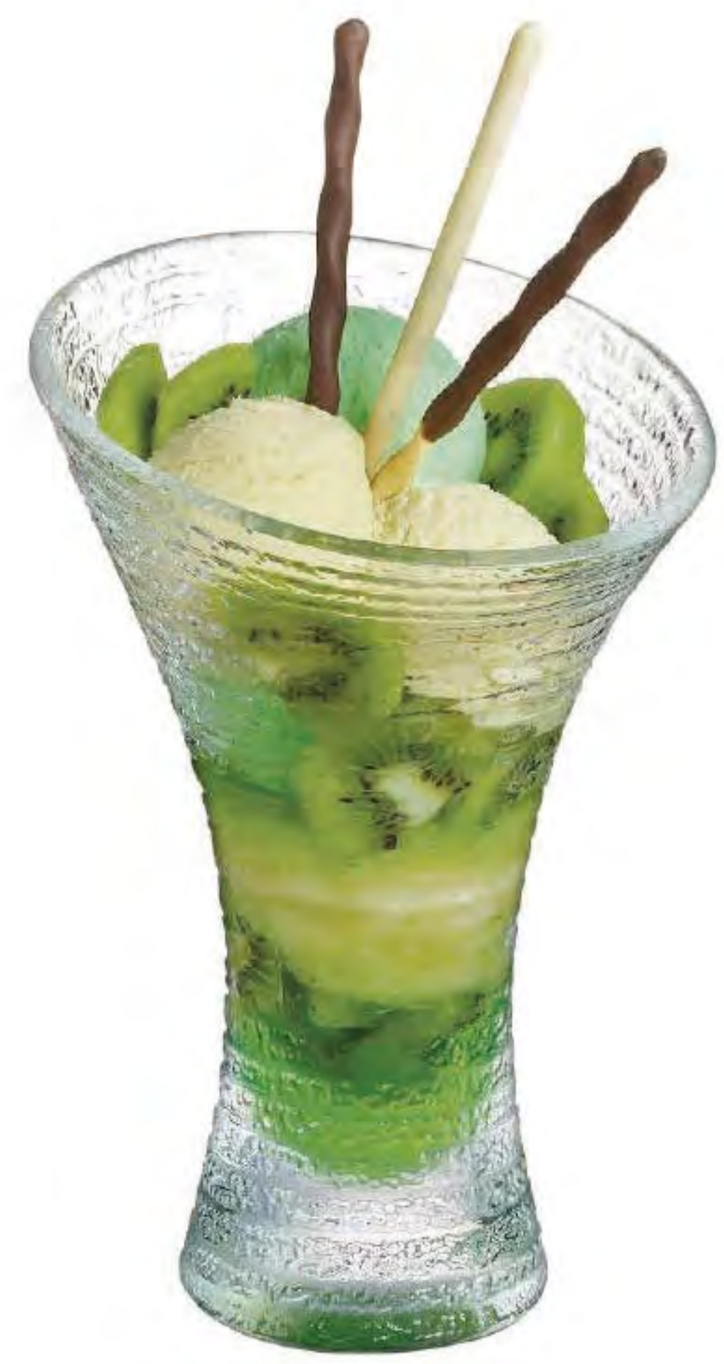
L-6757 410cc 冷凍杯 H : 198mm φ : 127mm 6x2