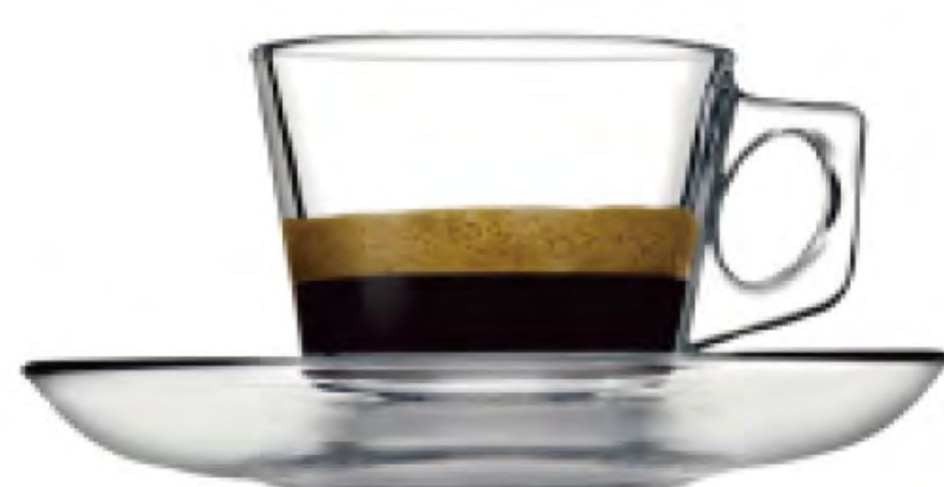
P-97301 80cc 濃縮咖啡杯盤 杯 H: 55 mm φ: 60 mm 盤 H: 19 mm φ: 108 mm