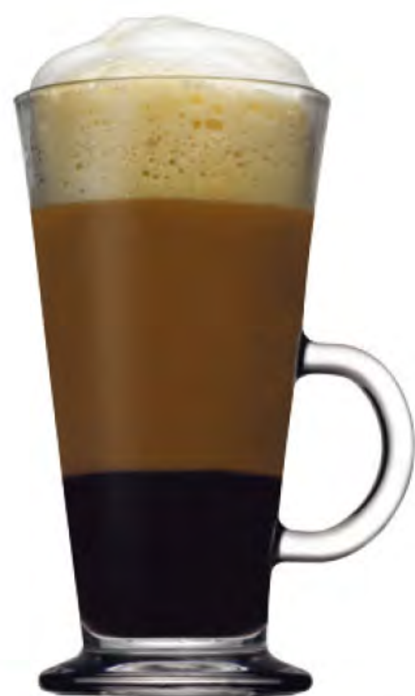
T P-55861 263cc 強化拿鐵杯 H : 148mm φ : 77mm