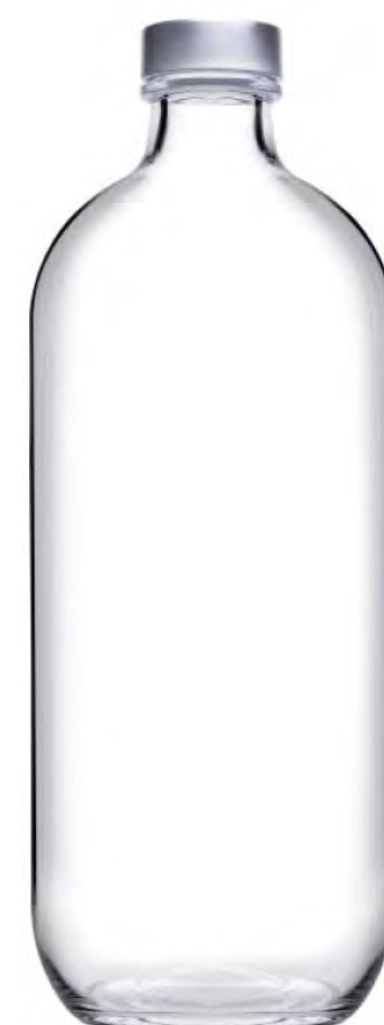
P-80355 1100cc 精緻飲料瓶 H: 250mm φ: 36mm