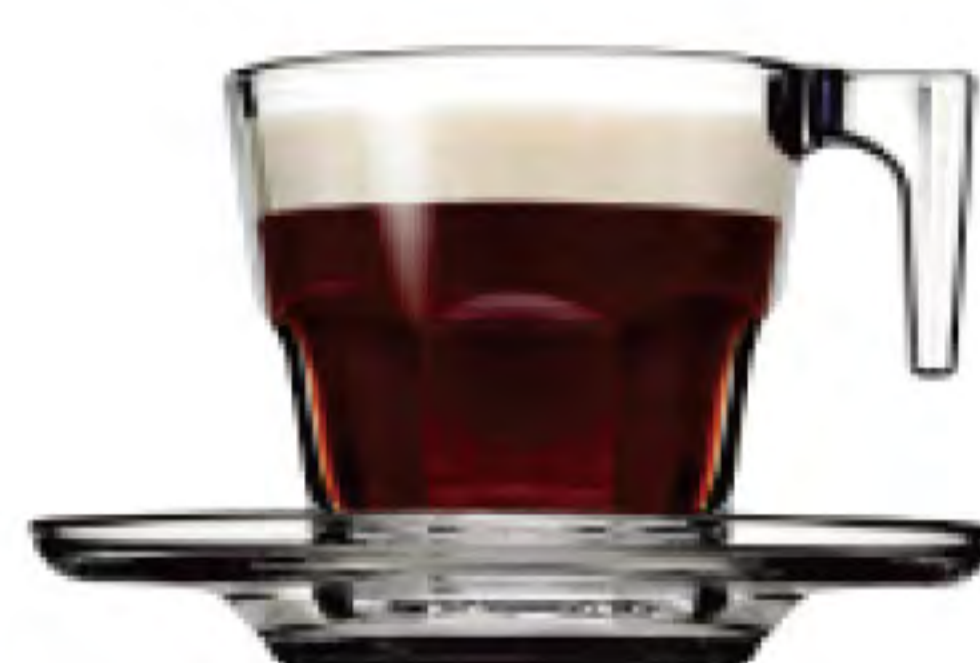
P-95753 75cc 濃縮咖啡杯盤 T 杯 H: 60mm φ: 58mm 盤 H: 17mm φ: 96mm