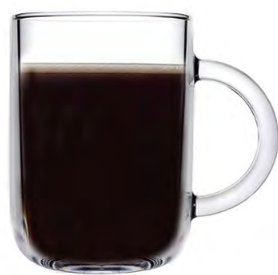
T P-55753 330cc 巴達克 強化馬克杯 H: 103 mm φ:76.5mm