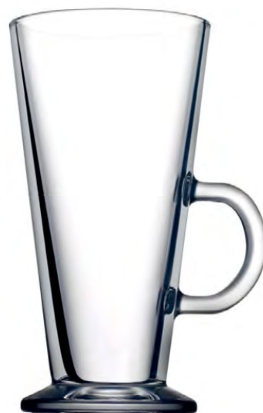
T P-55153 360cc 強化拿鐵杯 H : 168mm φ : 84mm