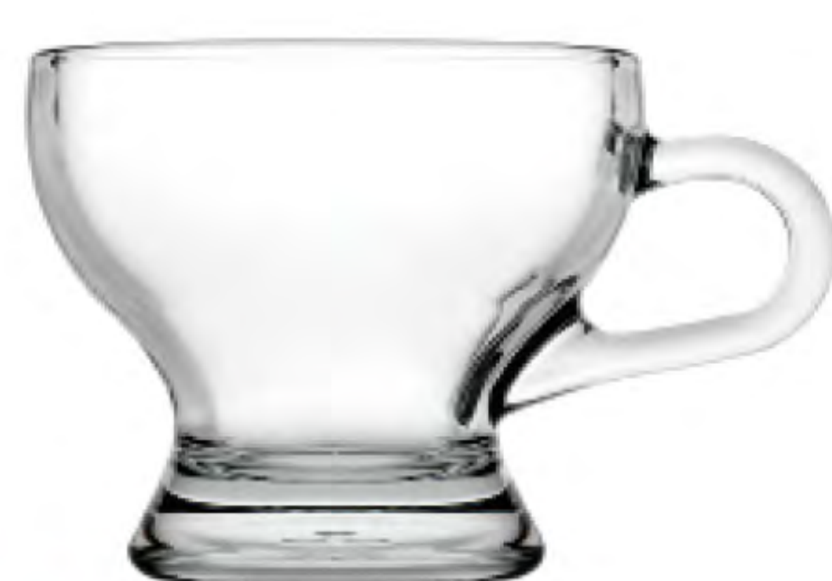
T P-55543 125cc 咖啡杯 (2 入) h: 70 mm φ: 78 mm