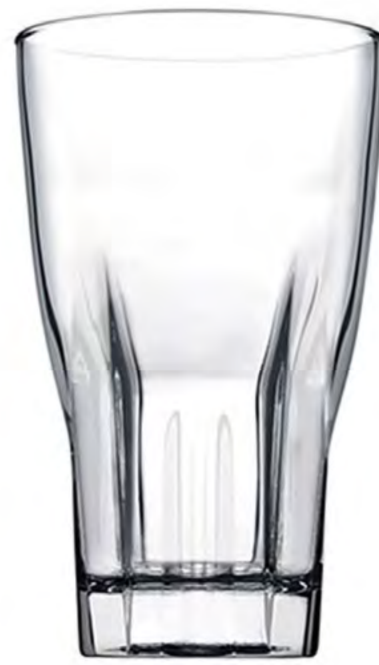
T P-52236 370cc 派對冷飲杯 H: 140 mm. φ: 84 mm