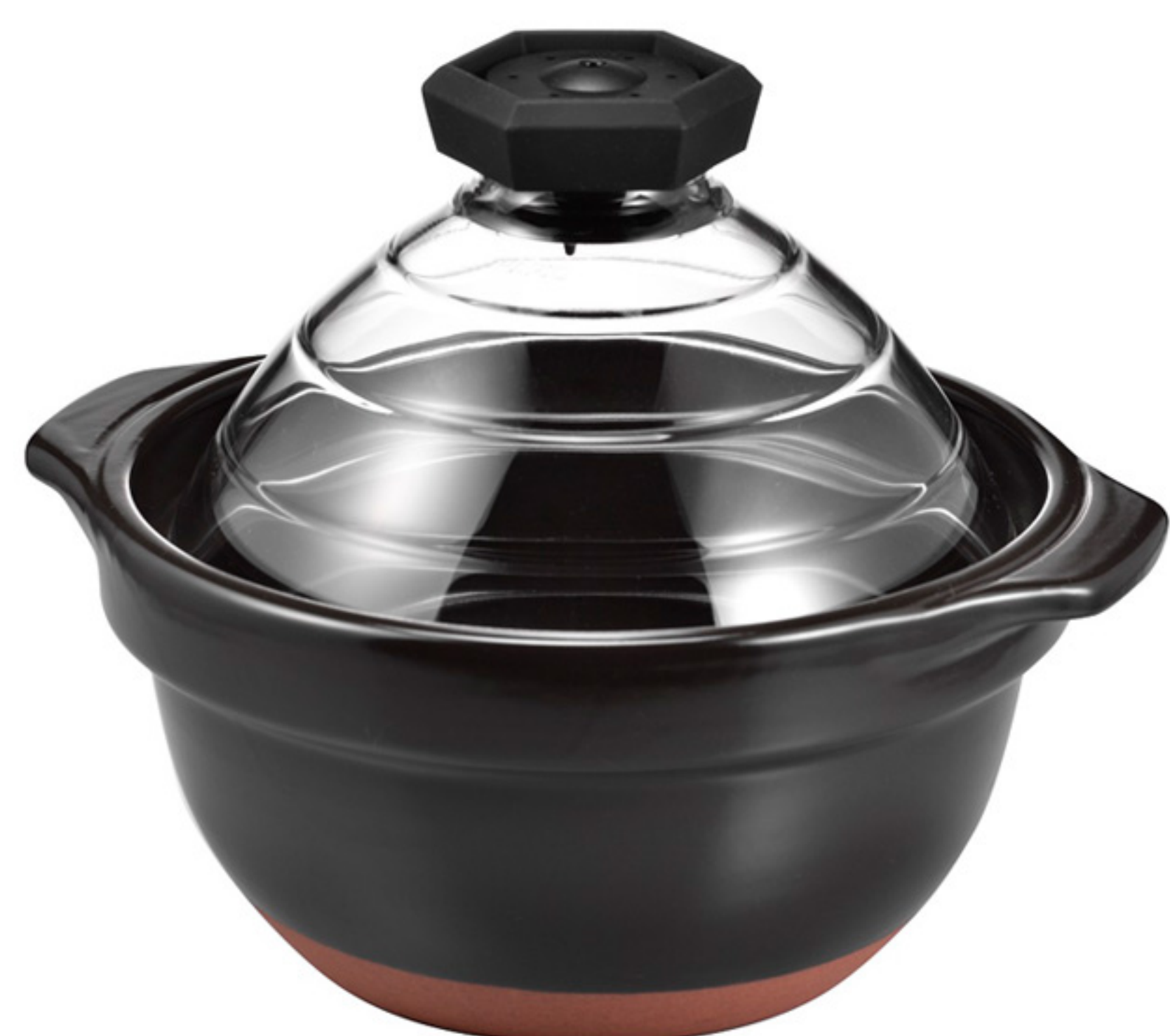
GNN-200B C/T4 萬古燒蛋形飯釜3合用

【長270・寬230・高210・口徑200mm】 【容量】3杯米 【材質】耐熱玻璃、耐熱陶器、PP、矽膠