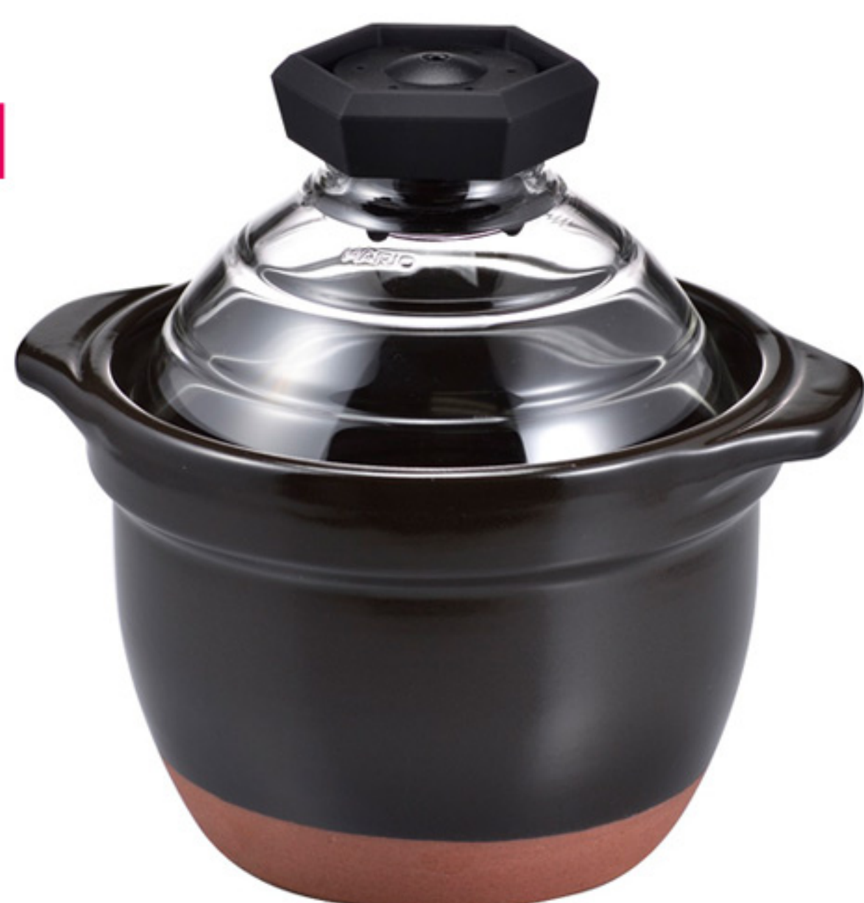
GNN-150B C/T6 萬古燒蛋形飯釜2合用

【長210・寬174・高190・口徑150mm】 【容量】2杯米 【材質】耐熱玻璃、耐熱陶器、PP、矽膠