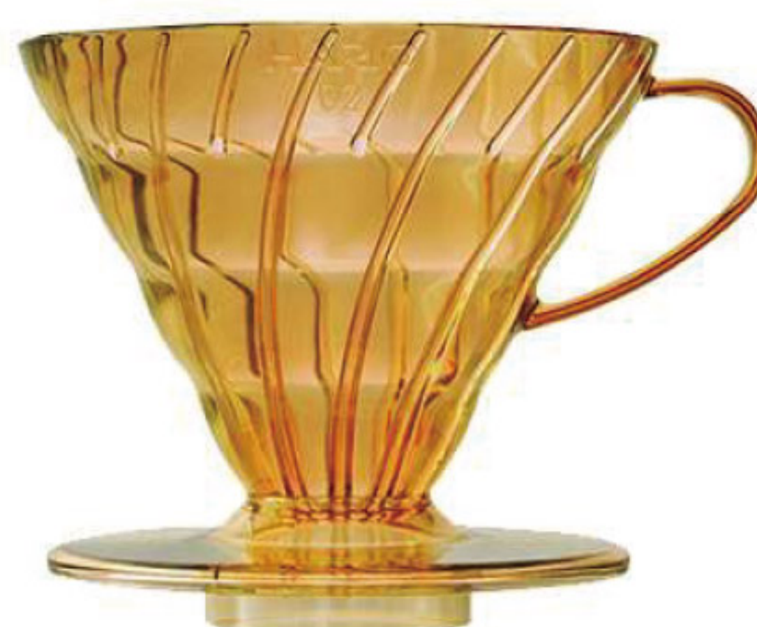
V60 蜂蜜黃 02 樹脂濾杯 VD-02-THY-A

C/T 48 長 137 寬 116 高 102 口徑 116mm 容量：1~4 杯用 材質：AS 樹脂、