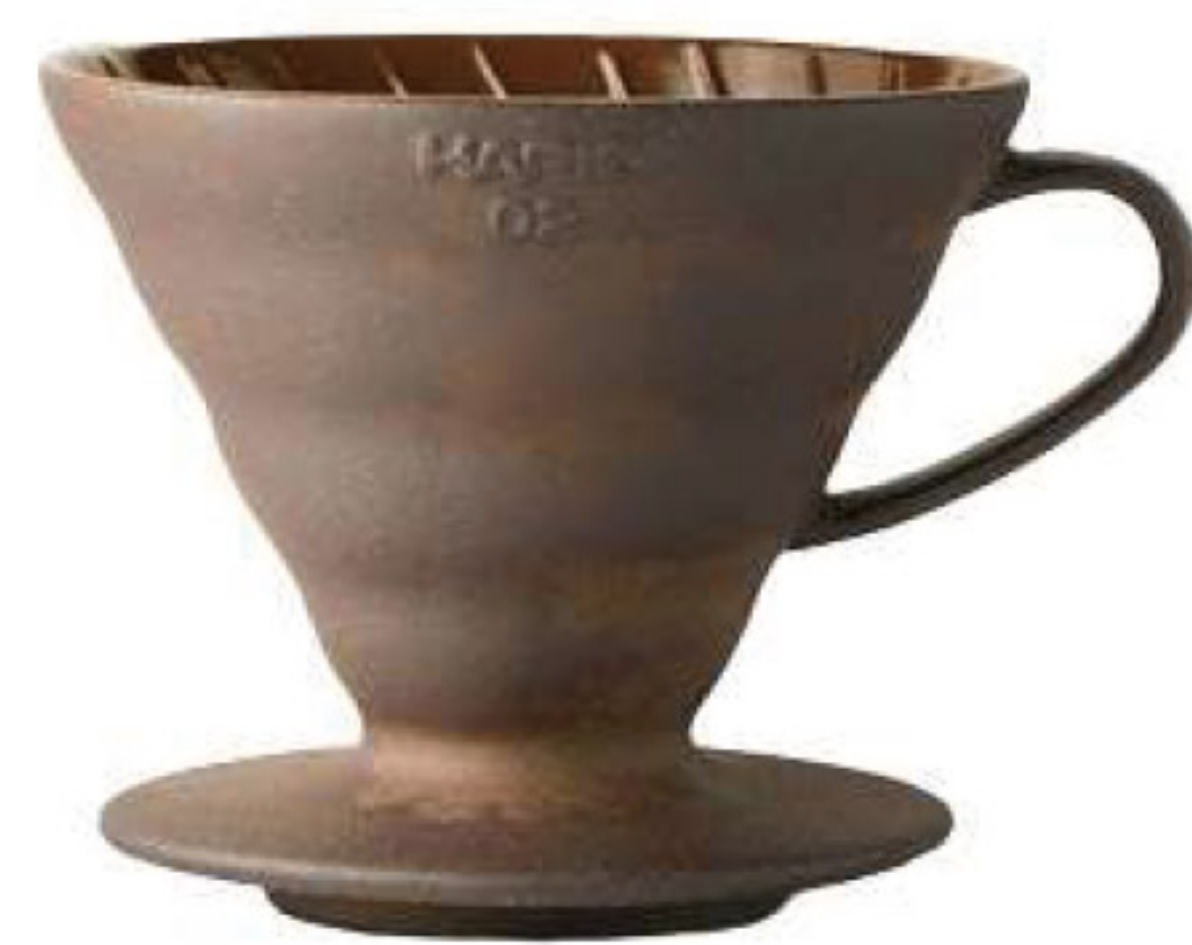
V60 老岩泥五次燒 02 濾杯 VDCR-02-BR5

C/T 36 長 140 寬 120 高 102 口徑 116mm 容量：1~4 杯用 材質：老岩泥