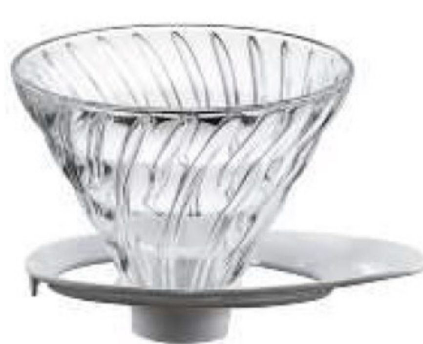
V60 旋風白 01 玻璃濾杯 VDGR-01W*

C/T 24 長 138 寬 97 高 77 口徑 97mm 容量：1~2 杯用 附量匙 材質：耐熱玻璃、PP