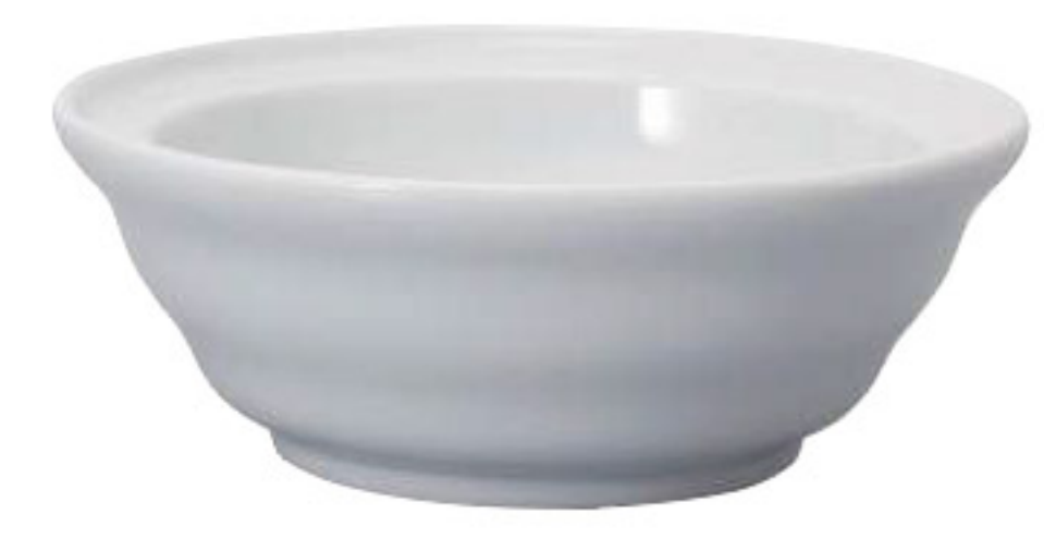
V60 濾杯盤 DT-1W