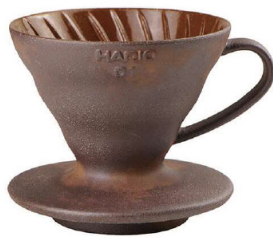
V60 老岩泥五次燒 01 濾杯 VDCR-01-BR5

C/T 40 長 119 寬 100 高 82 口徑 95mm 容量：1~2 杯用 材質：老岩泥