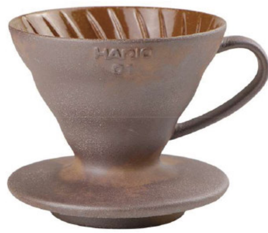
V60 老岩泥 01 濾杯 VDCR-01BR

C/T 40 長 119 寬 100 高 82 口徑 95mm 容量：1~2 杯用 材質：老岩泥