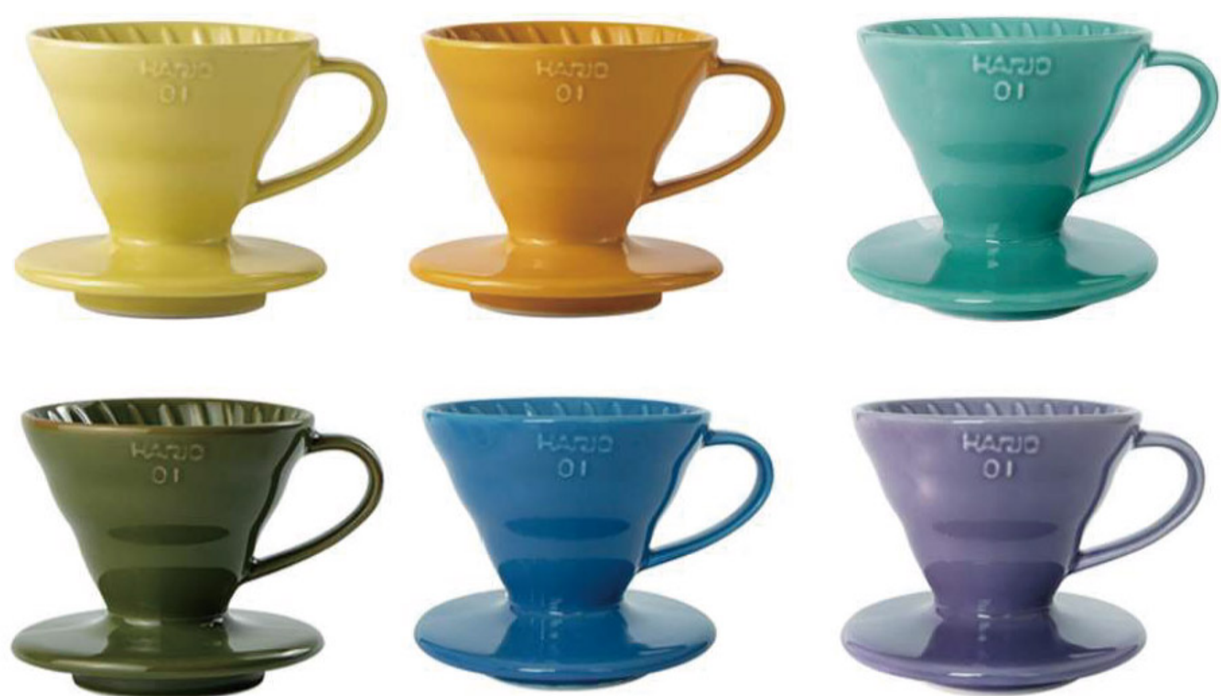
V60 彩虹磁石濾杯 01

C/T 36 長 140 寬 120 高 102 口徑 116mm 容量：1~4 杯用 材質：老岩泥