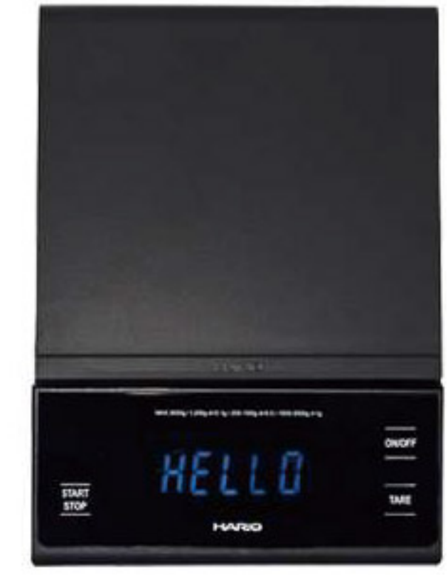
V60 手沖專用電子秤 WIDE VSTW-3000-B

C/T 20 長 120 寬 175 高 31mm 計量範圍：2~2000g 材質：ABS 樹脂