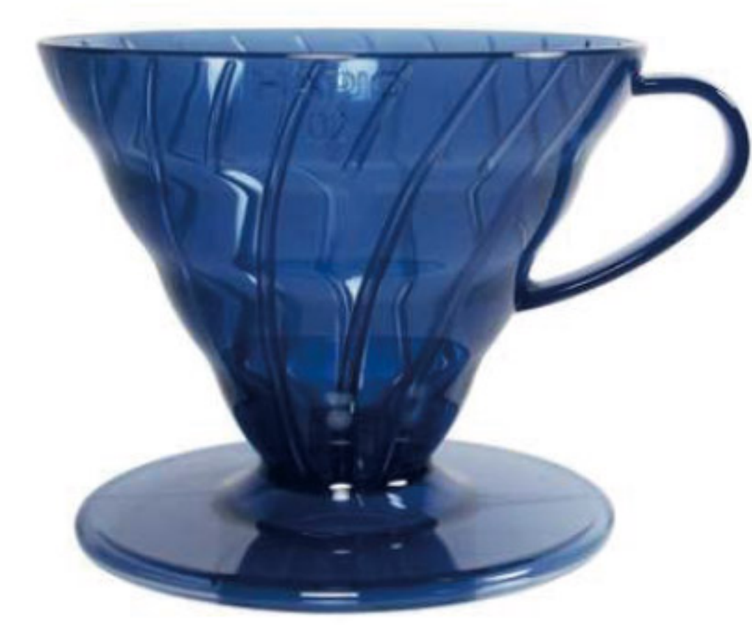
V60 普魯士藍 02 樹脂濾杯 VD-02-TBU-TW

C/T 48 長 137 寬 116 高 102 口徑 116mm 容量：1~4 杯用 材質：AS 樹脂、