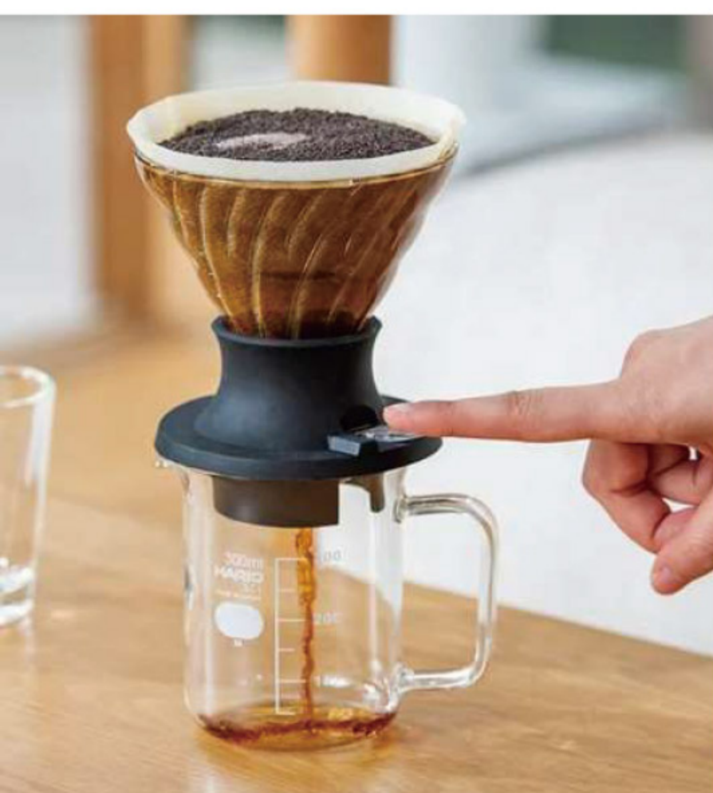
V60 浸漬式手沖濾杯壺組 SSD-5012-B

C/T 24 長 138 寬 115 高 95 徑 115mm 容量：1~2 杯用 附量匙 材質：耐熱玻璃、PP