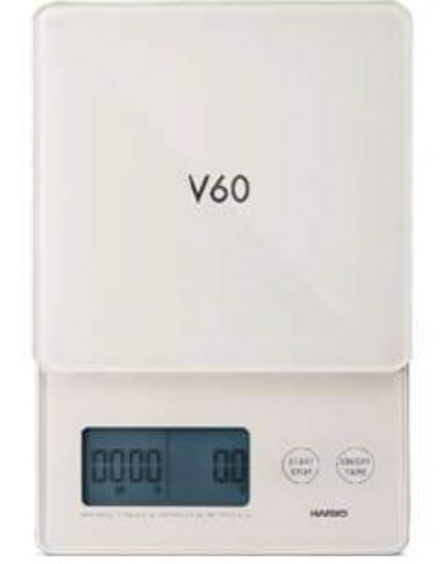
V60 琉璃白電子秤 VSTG-2000W-TW

C/T 24 長 130 寬 180 高 30mm 計量範圍：1~3000g 材質：ABS 樹脂