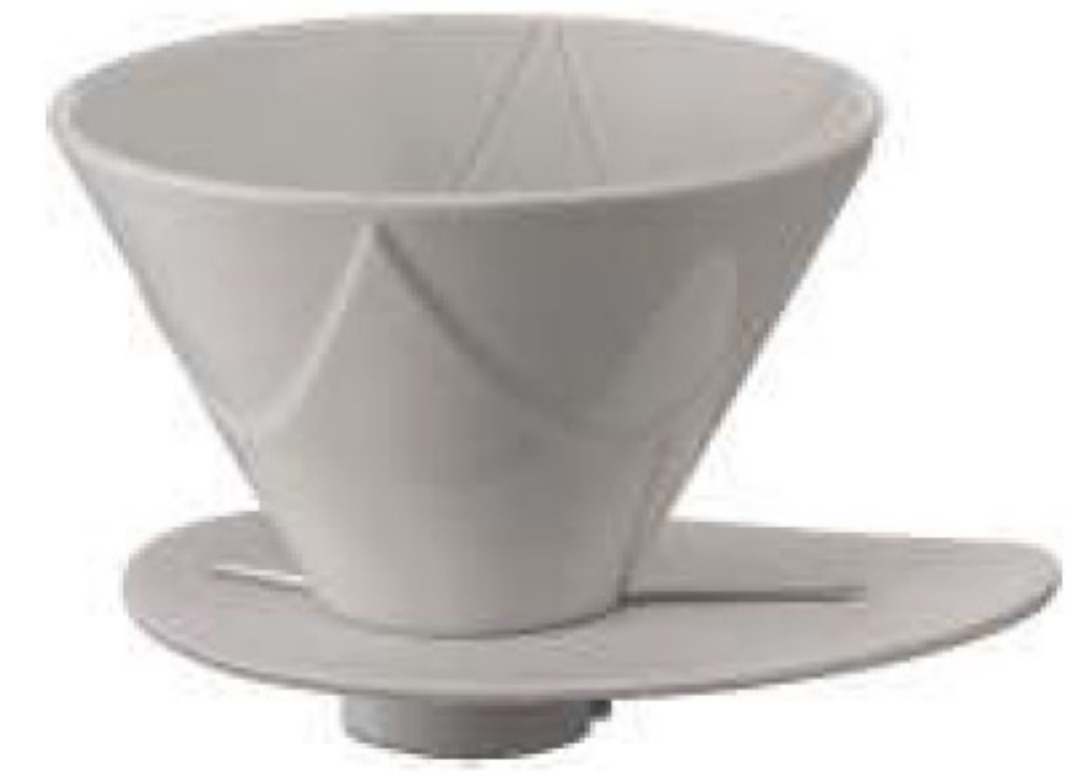
V60 磁石 01 無限濾杯 VDMU-02-CW

C/T 40 長 119 寬 100 高 82 口徑 95mm 容量：1~2 杯用 附量匙 材質：磁石、PP 榮獲 2007 年度日本 Good Design 大賞