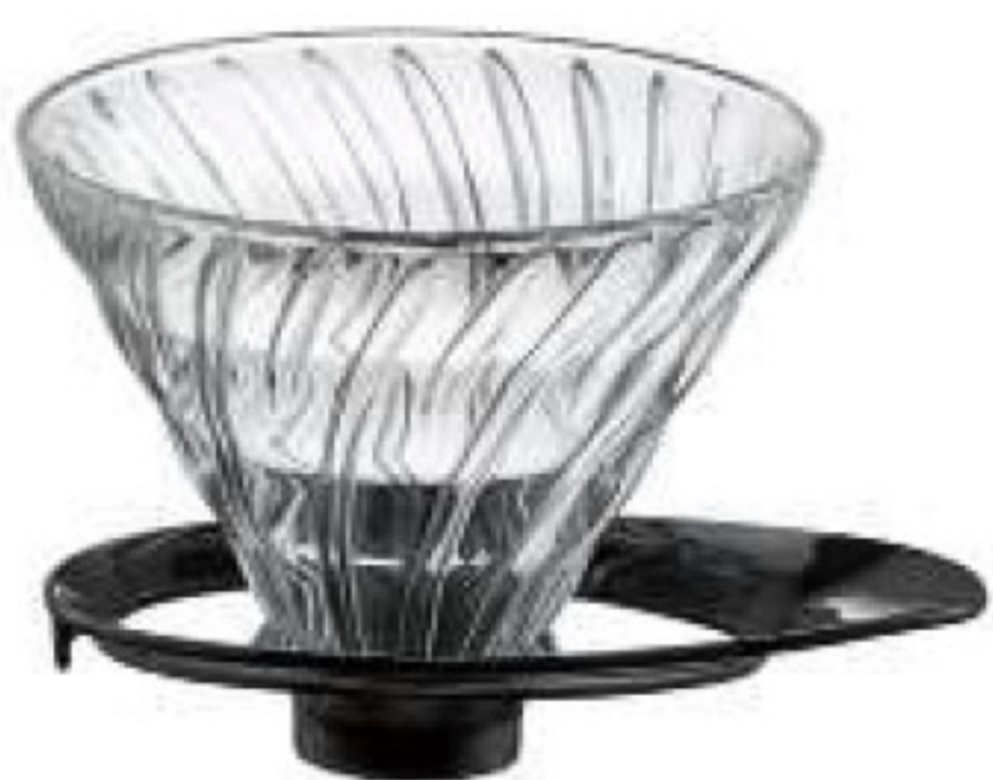
V60 旋風黑 01 玻璃濾杯 VDGR-01B*

C/T 18 長 127 寬 160 高 109 口徑 116mm 容量：1~4 杯用 材質：磁石、PP、聚酯纖維