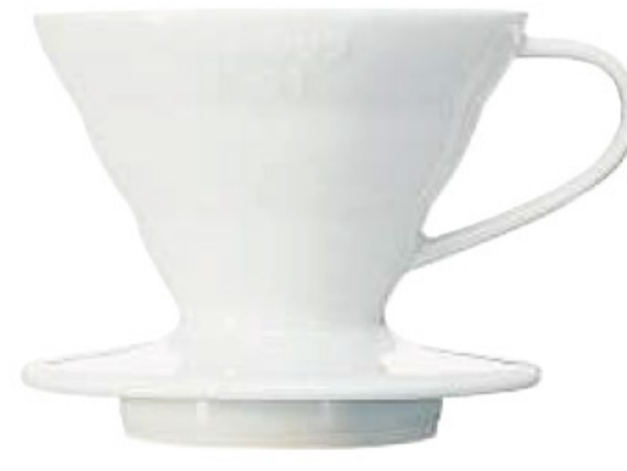
V60 磁石濾杯 01 白色 VDC-01W

C/T 24 長 124 寬 110 高 78 口徑 97mm 容量：1~2 杯用 附量匙 材質：耐熱玻璃、PP