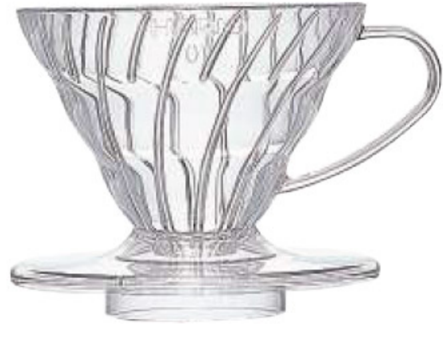
V60 樹脂濾杯 01 透明 VD-01T

C/T 48 長 115 寬 100 高 82 口徑 95mm 容量：1~2 杯用 附量匙 材質：AS 樹脂、PP 榮獲 2007 年度日本 Good Design 大賞