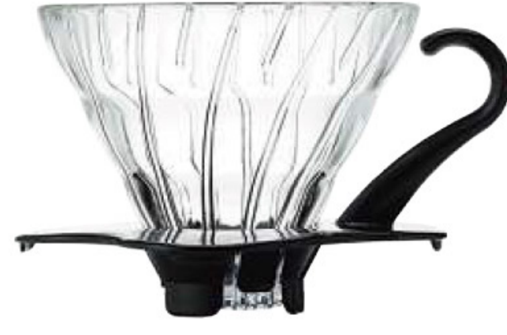
V60 玻璃濾杯 01 黑色 VDG-01B*

C/T 48 長 115 寬 100 高 82 口徑 95mm 容量：1~2 杯用 附量匙 材質：AS 樹脂、PP 榮獲 2007 年度日本 Good Design 大賞