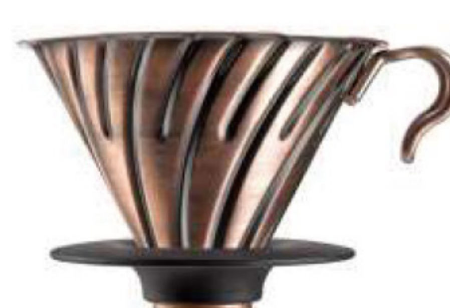
V60 金屬濾杯 02 古銅 VDM-02CP

C/T 12 長 135 寬 120 高 92 口徑 120mm 容量：1~4 杯用 (附 V60 量匙) 材質：銅、黃銅、PP