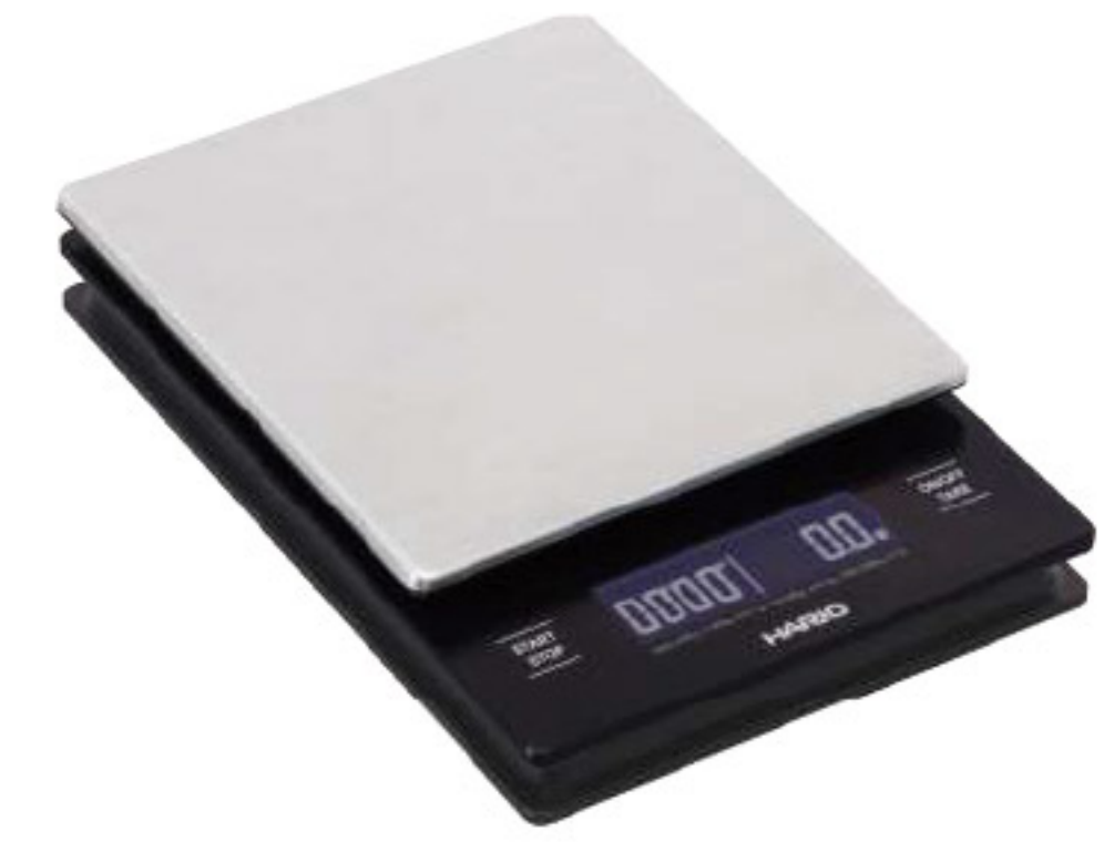
V60 電池式不銹鋼電子秤 VSTMN-INT-2000HSV

C/T 20 長 120 寬 190 高 29mm 計量範圍：2~2000g 材質：ABS 樹脂