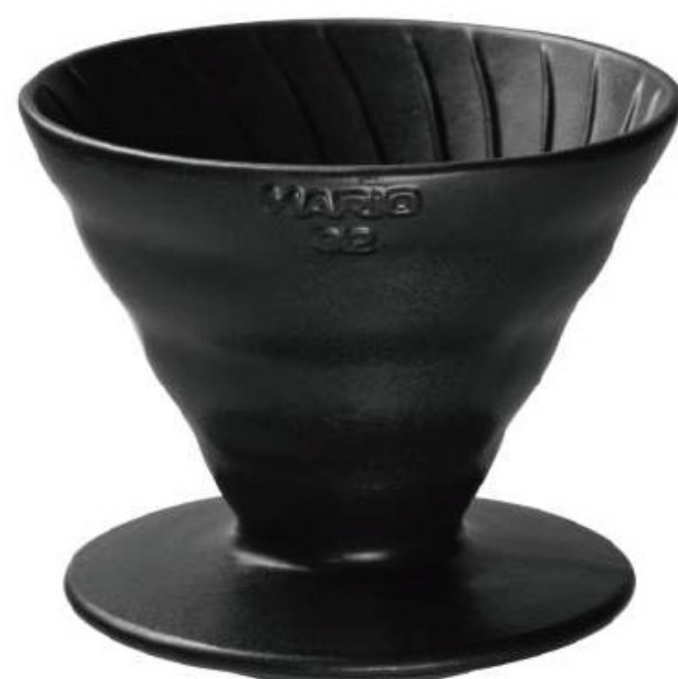
V60 火山黑老岩泥 02 濾杯 VDCR-02-B

C/T 40 長 119 寬 100 高 82 口徑 95mm 容量：1~2 杯用 材質：老岩泥