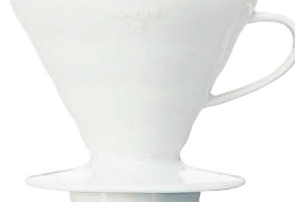
V60 磁石濾杯 02 白色 VDC-02W

C/T 24 長 128 寬 115 高 96 口徑 115mm 容量：1~4 杯用 附量匙 材質：耐熱玻璃、PP