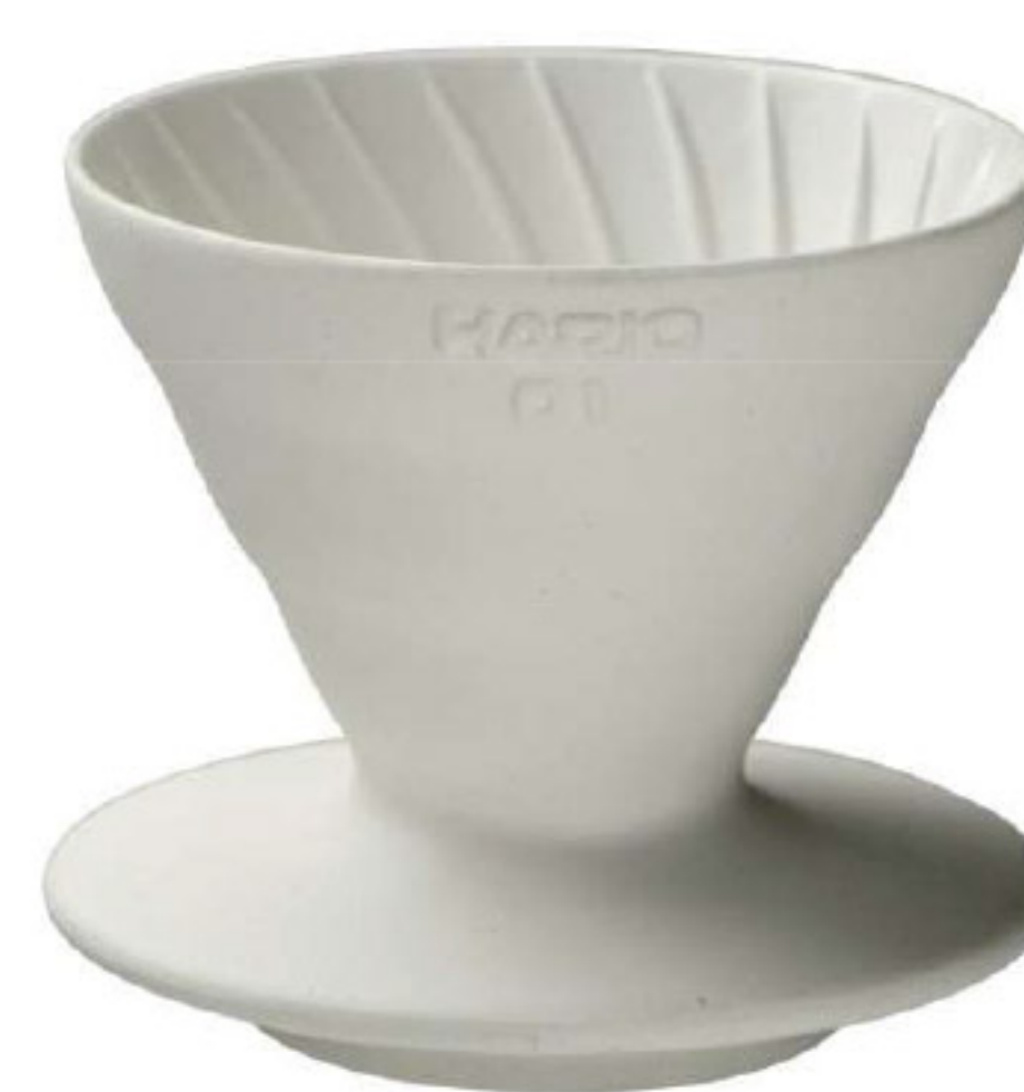
V60 象牙白老岩泥 02 濾杯 VDCR-02-W

C/T 36 長 140 寬 120 高 102 口徑 116mm 容量：1~4 杯用 材質：老岩泥