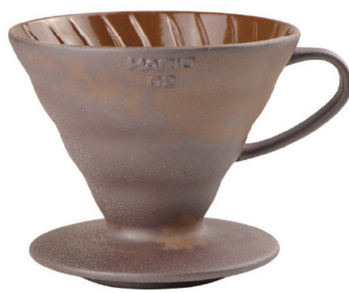
V60 老岩泥 02 濾杯 VDCR-02BR

C/T 40 長 119 寬 100 高 82 口徑 95mm 容量：1~2 杯用 材質：老岩泥