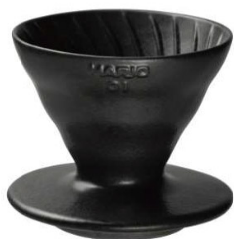
V60 火山黑老岩泥 01 濾杯 VDCR-01-B

C/T 36 長 140 寬 120 高 102 口徑 116mm 容量：1~4 杯用 材質：老岩泥