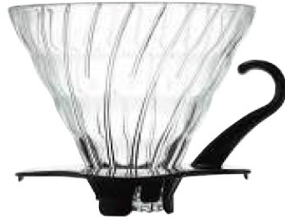
V60 玻璃濾杯 02 黑色 VDG-02B*

C/T 48 長 137 寬 116 高 102 口徑 116mm 容量：1~4 杯用 附量匙 材質：AS 樹脂、PP 榮獲 2007 年度日本 Good Design 大賞