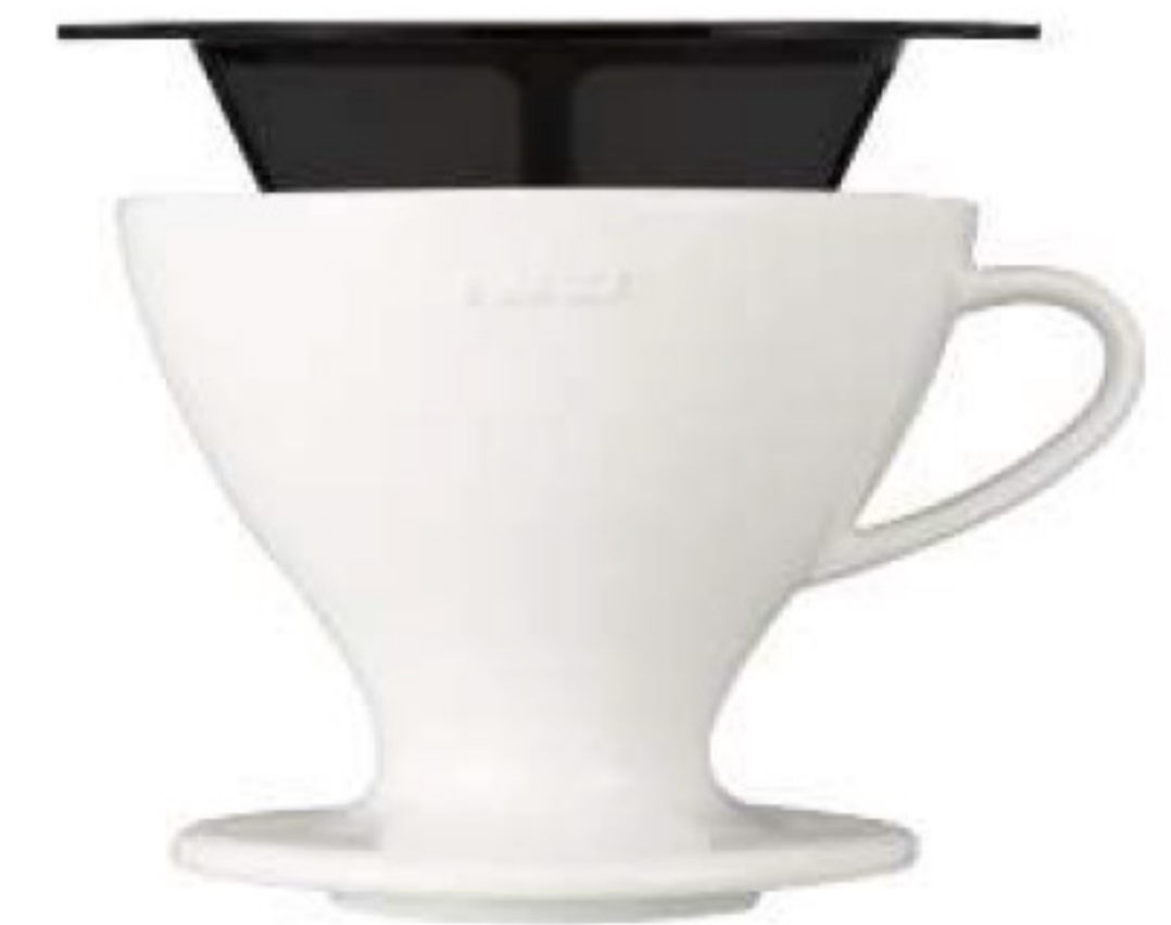
W60 磁石濾杯組 PDC-02-W*

C/T 36 長 140 寬 120 高 102 口徑 116mm 容量：1~4 杯用 附量匙 材質：磁石、PP 榮獲 2007 年度日本 Good Design 大賞