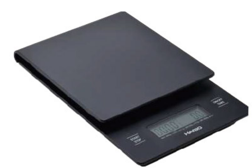
V60 專用電子秤 PLUS VSTN-2000B

C/T 20 長 120 寬 190 高 29mm 計量範圍：2~2000g 材質：ABS 樹脂