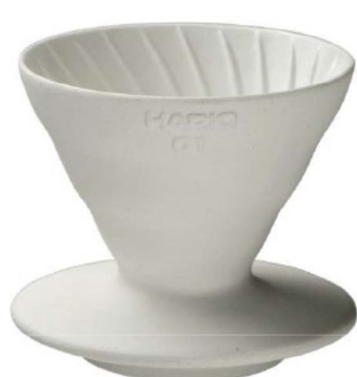
V60 象牙白老岩泥 01 濾杯 VDCR-01-W

C/T 40 長 119 寬 100 高 82 口徑 95mm 容量：1~2 杯用 材質：老岩泥