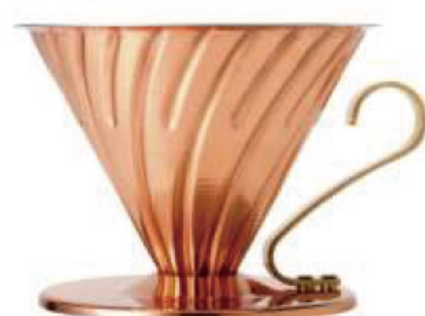
V60 金屬濾杯 02 純銅 VDM-02CP

C/T 12 長 145 寬 120 高 90 口徑 120mm 容量：1~4 杯用 材質：不鏽鋼、矽膠