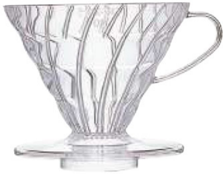
V60 樹脂濾杯 02 透明 VD-02T

C/T 24 長 117 寬 143 高 94 口徑 117mm 容量：1~2 杯用 材質：磁石、PP