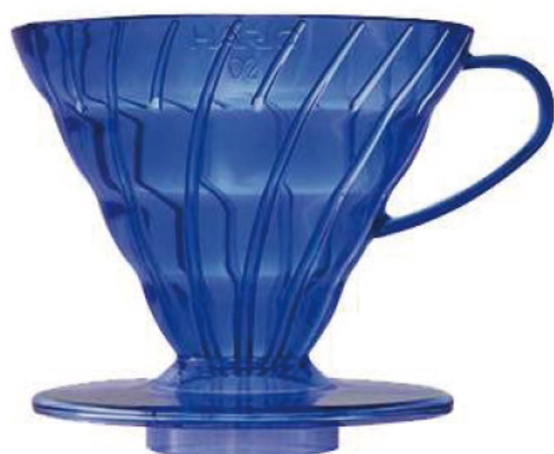
V60 藍莓色 02 樹脂濾杯 VD-02-TCB-A

C/T 48 長 137 寬 116 高 102 口徑 116mm 容量：1~4 杯用 材質：AS 樹脂、