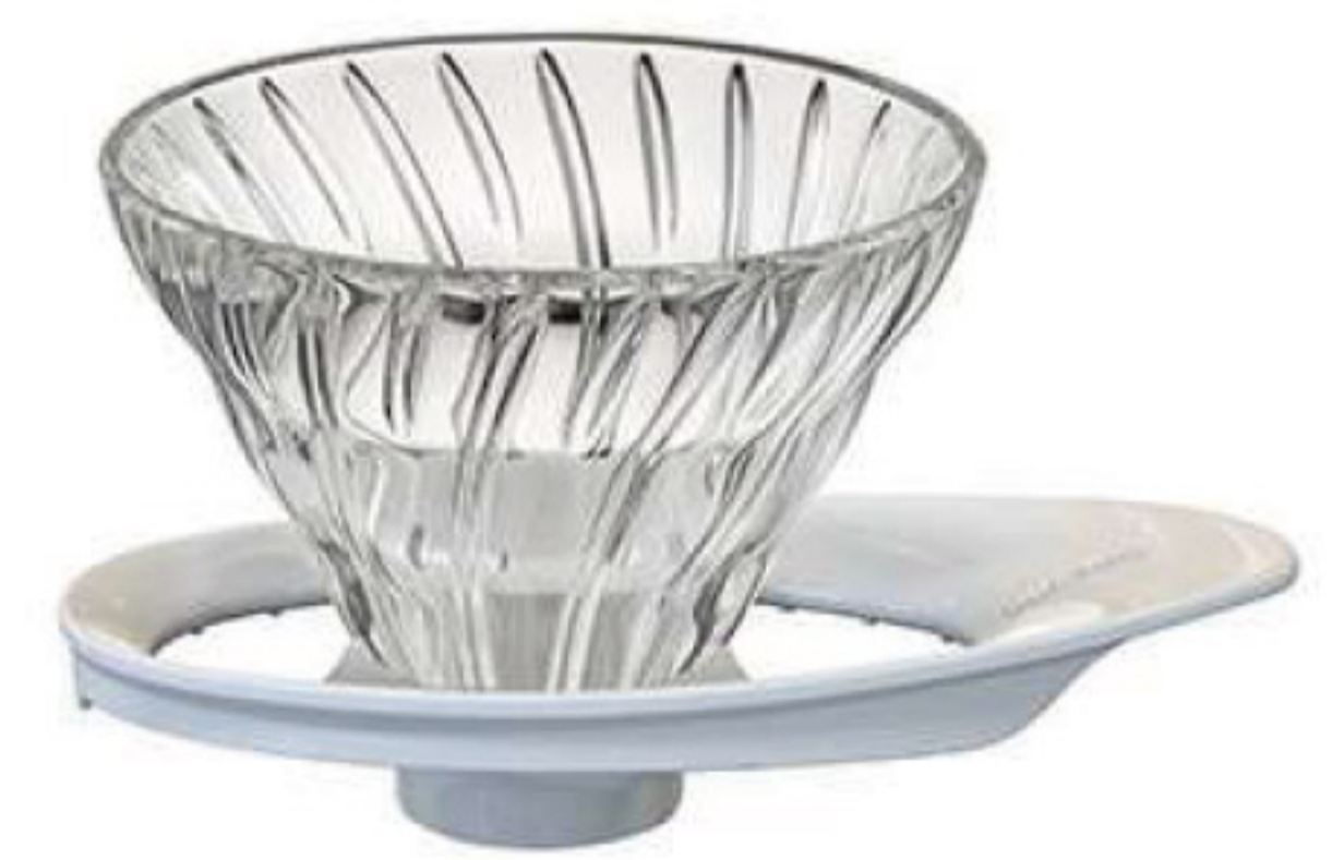
V60 旋風白 02 玻璃濾杯 VDGR-02W*

C/T 24 長 138 寬 115 高 95 徑 115mm 容量：1~2 杯用 附量匙 材質：耐熱玻璃、PP