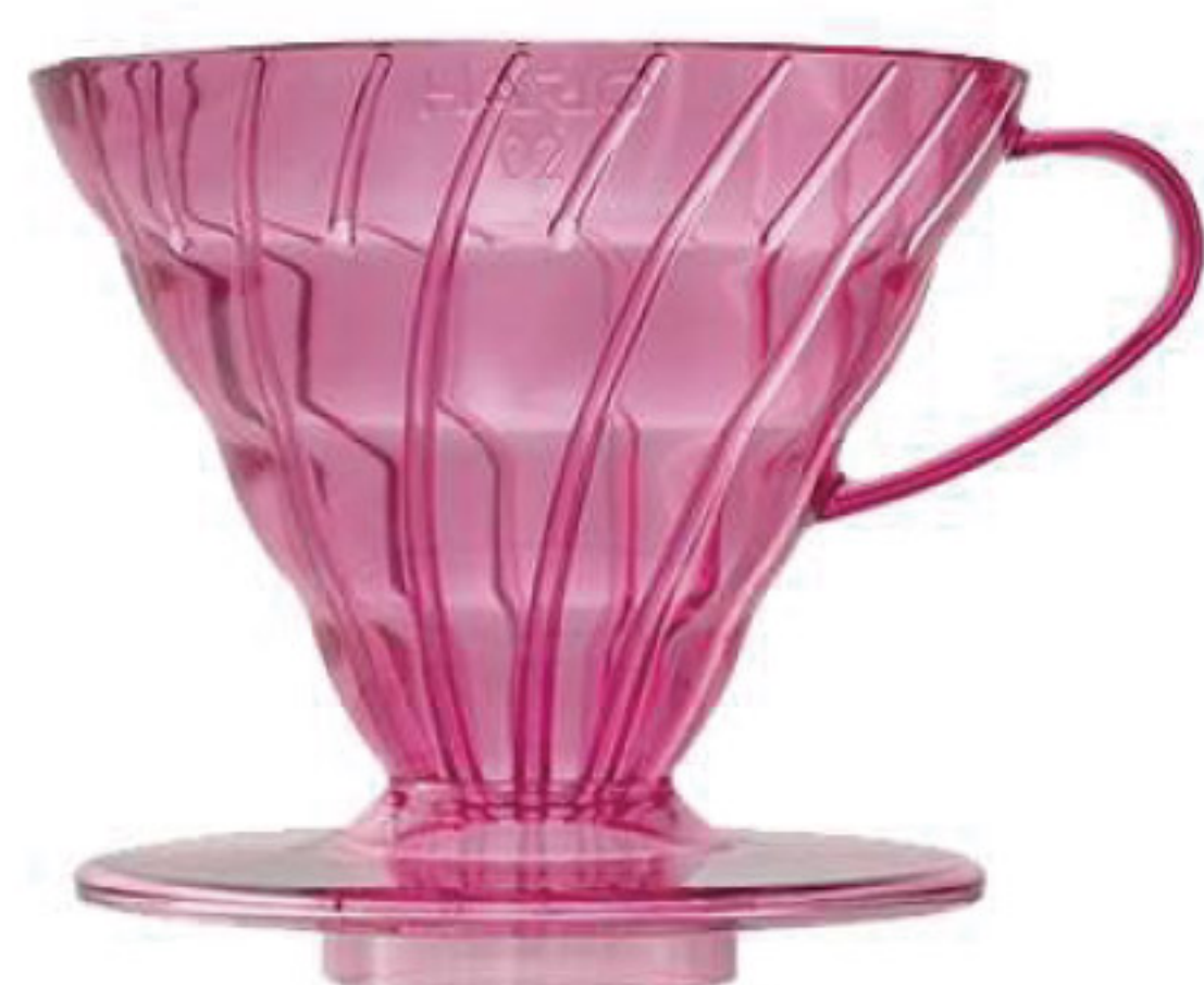
V60 莓果粉 02 樹脂濾杯 VD-02-TPP-A

C/T 36 長 140 寬 120 高 102 口徑 116mm 容量：1~4 杯用 附量匙 材質：磁石、PP 榮獲 2007 年度日本 Good Design 大賞