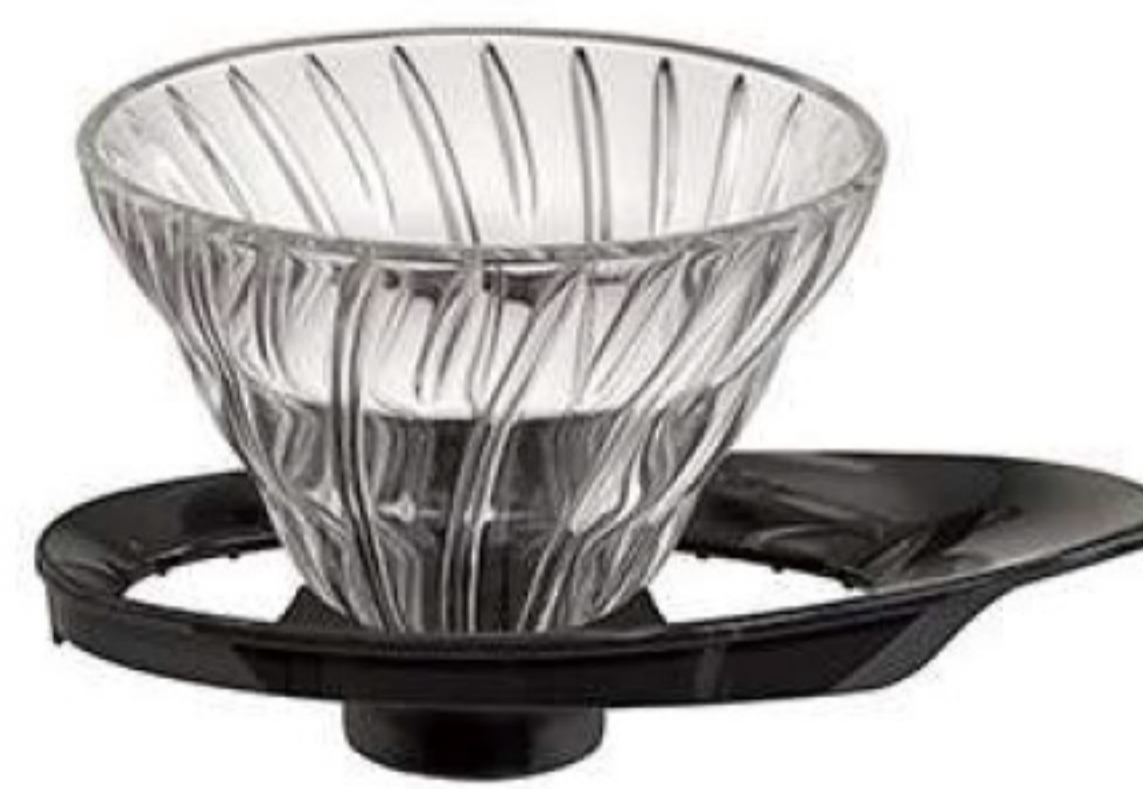
V60 旋風黑 02 玻璃濾杯 VDGR-02B*

C/T 24 長 138 寬 97 高 77 口徑 97mm 容量：1~2 杯用 附量匙 材質：耐熱玻璃、PP