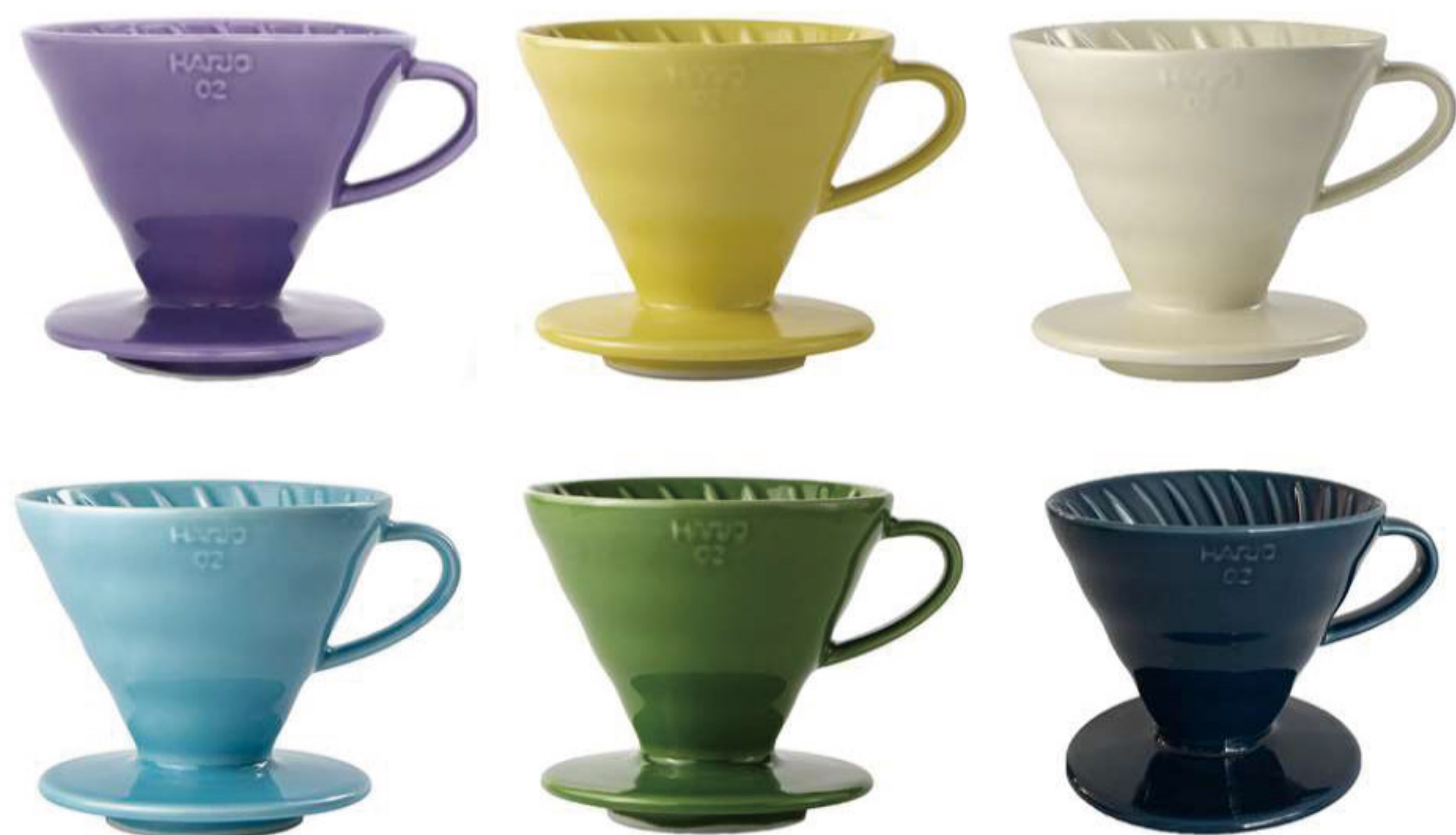
V60 彩虹磁石濾杯 02

C/T 40 長 119 寬 100 高 82 口徑 95mm 容量：1~2 杯用 附量匙 材質：磁石、PP 榮獲 2007 年度日本 Good Design 大賞