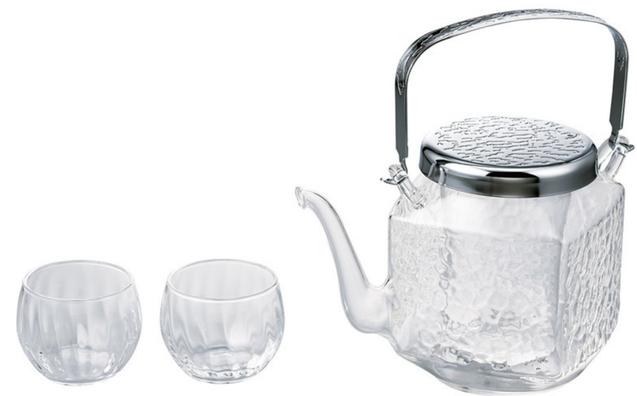
IDKG-1004-SV C/T 4 地爐利精緻角型冷酒器壺杯組

【長180・寬130・高165 口徑78mm】 【實用容量】360ml 【材質】耐熱玻璃、黃銅、聚乙烯 杯子: 高 42 口徑 73mm 容量: 65ml 材質: 一般玻璃