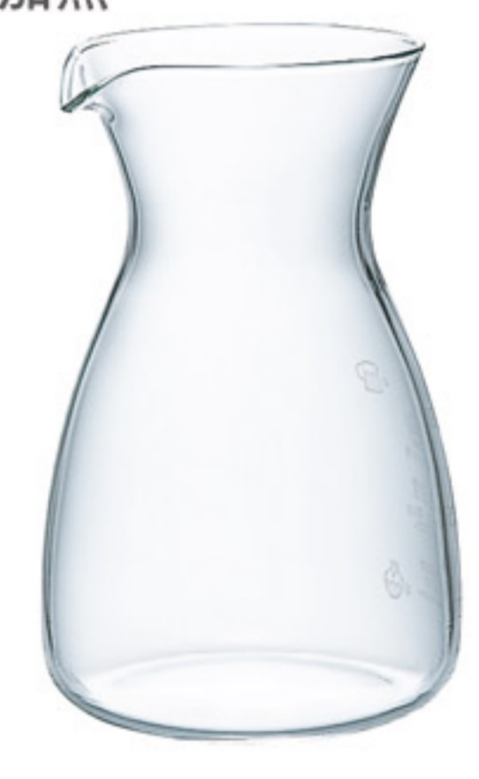
GT-2T C/T30 原創飲料壺