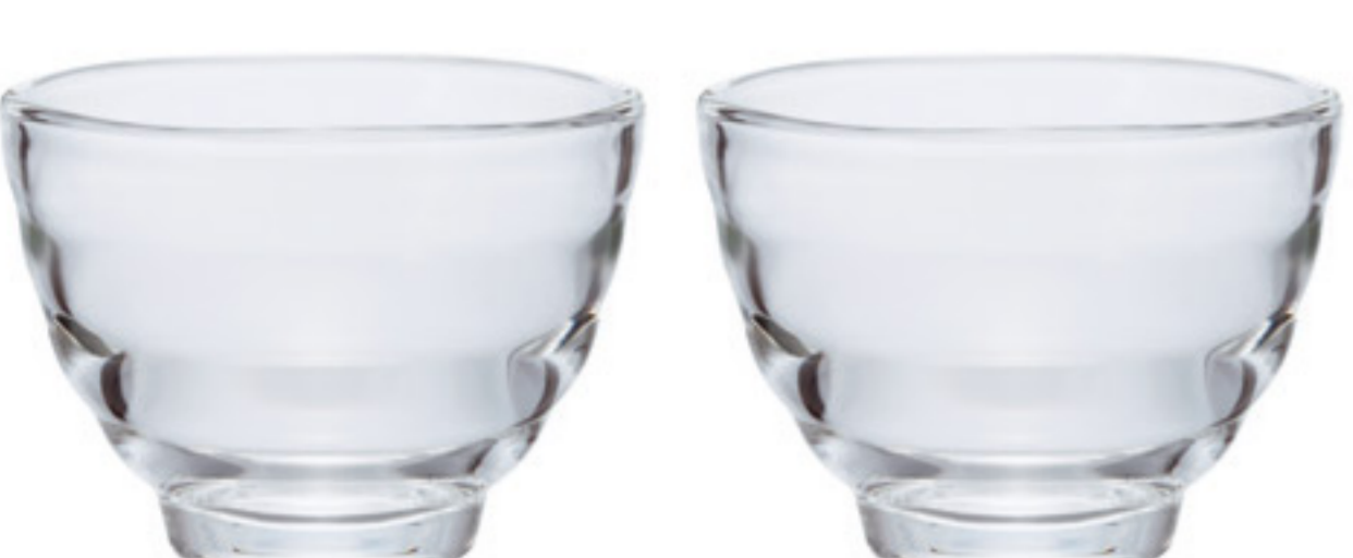
HU-0830 C/T30 湯吞耐熱小茶杯2入組