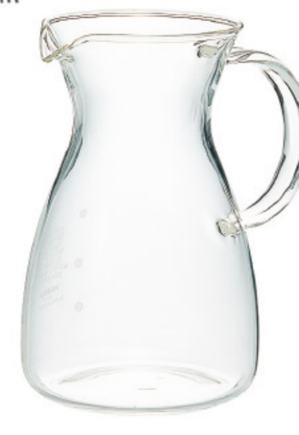
HCD-2T C/T24 極簡把手玻璃壺400

【長111×寬90×高138 口徑72 mm】 【實用容量】400ml 【材質】耐熱玻璃