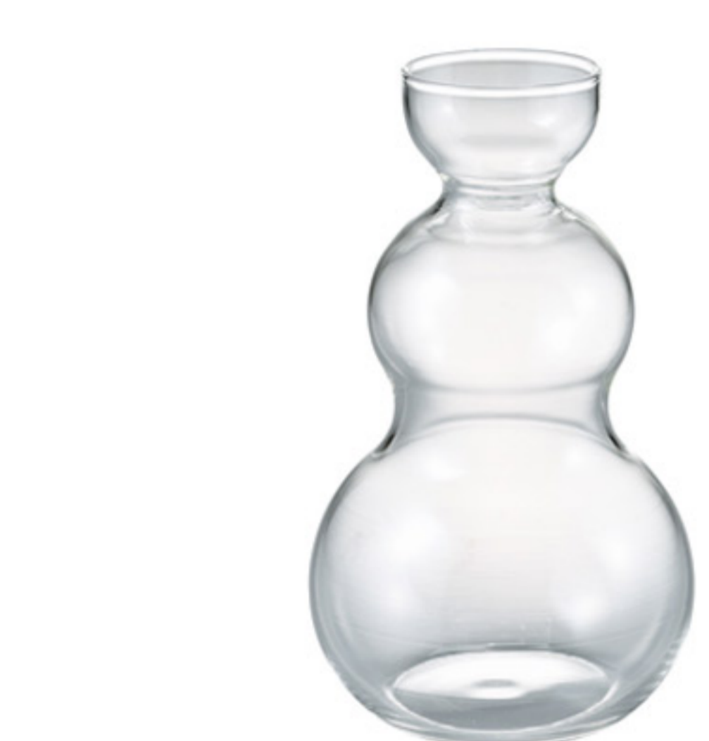
GT-2T C/T30 原創飲料壺