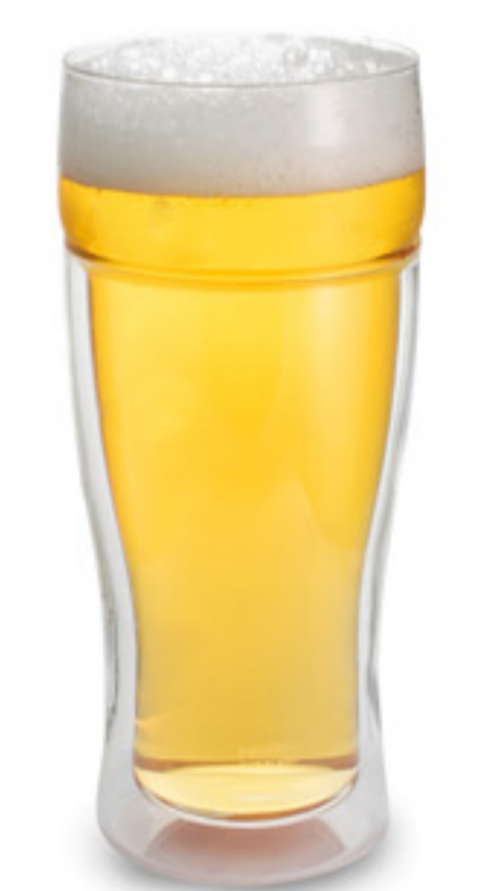
TBG-380 C/T24 雙層玻璃啤酒杯

【直徑85×高170 口徑65 mm】 【滿水容量】370ml 【材質】耐熱玻璃