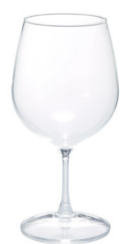
HFG-370-R C/T24 優雅高腳杯

【直徑84×高170 口徑65 mm】 【滿水容量】300ml 【材質】耐熱玻璃