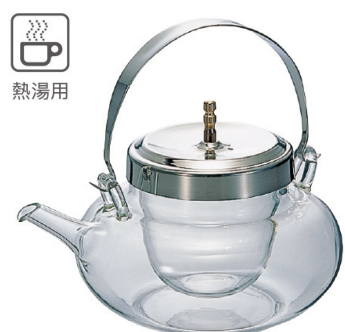
IDX-2MSV C/T12 地爐利精緻丸型冷酒器

【長162・寬130・高147・口徑78mm】 【實用容量】360ml 【材質】耐熱玻璃、黃銅、聚乙烯、不鏽鋼