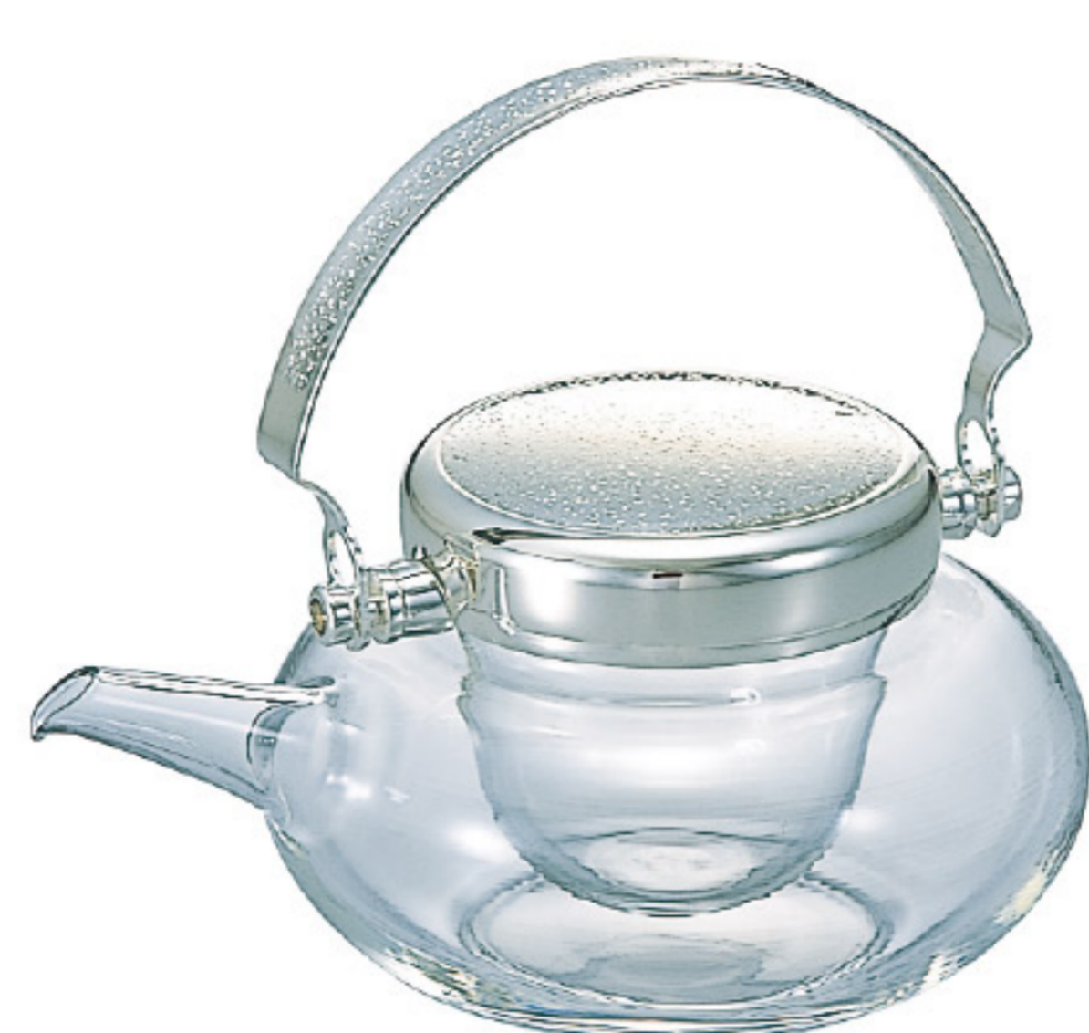
IDM-2ESV C/T12 地爐利雕花丸型冷酒器

【長162・寬130・高147・口徑78mm】 【實用容量】360ml 【材質】耐熱玻璃、黃銅、聚乙烯、不鏽鋼