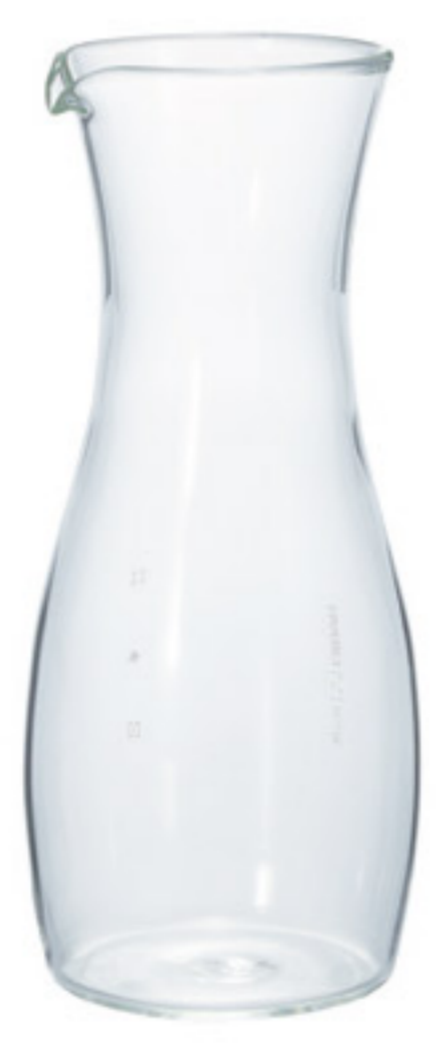
TI-300T C/T36 德利精粹水壺

【直徑70×高164 口徑60 mm】 【實用容量】300ml 【材質】耐熱玻璃