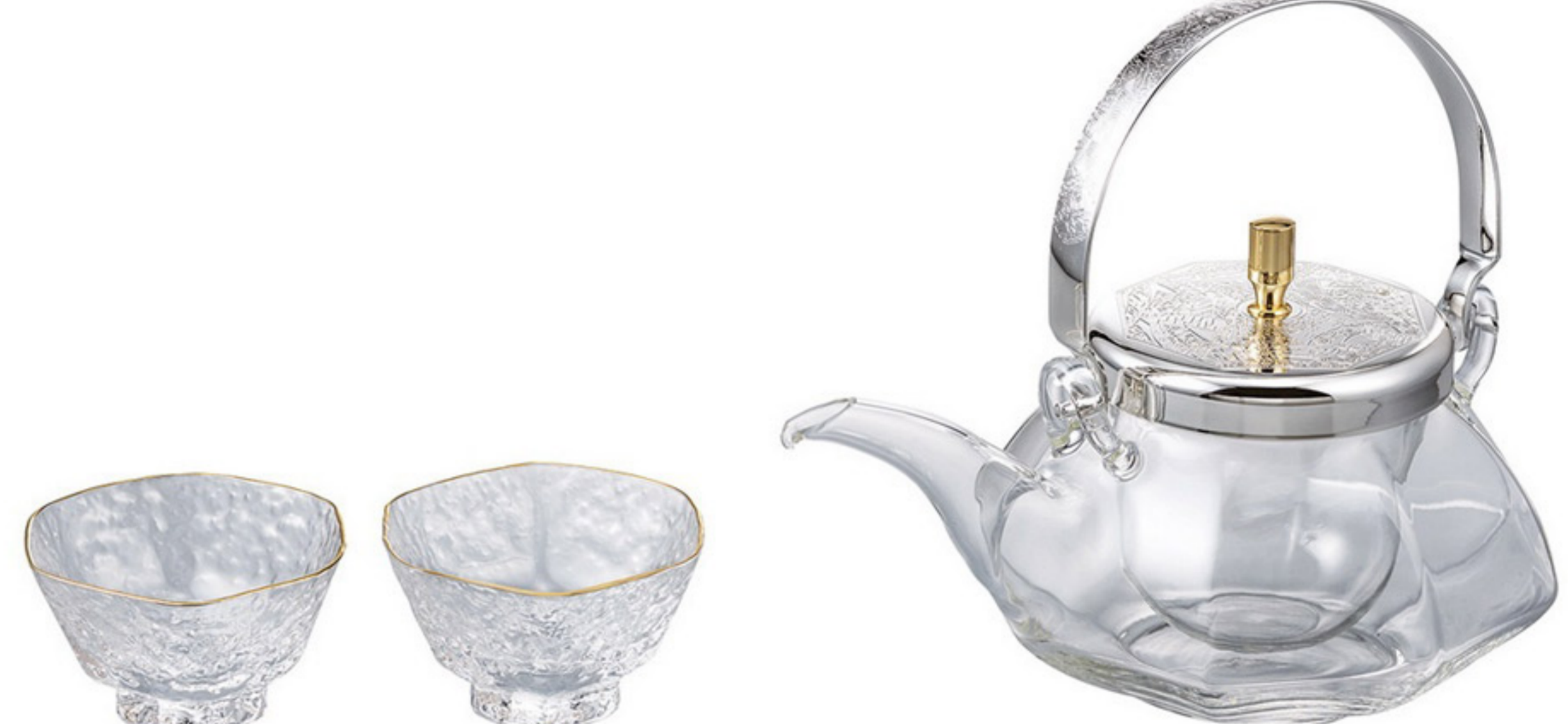
IDSG-2004-ESV C/T 4 地爐利精緻八角冷酒器壺杯組

【長162・寬130・高147・口徑78mm】 【實用容量】360ml 【材質】耐熱玻璃、黃銅、聚乙烯、不鏽鋼 杯子: 高 46 口徑 57mm 容量: 75ML 材質: 一般玻璃