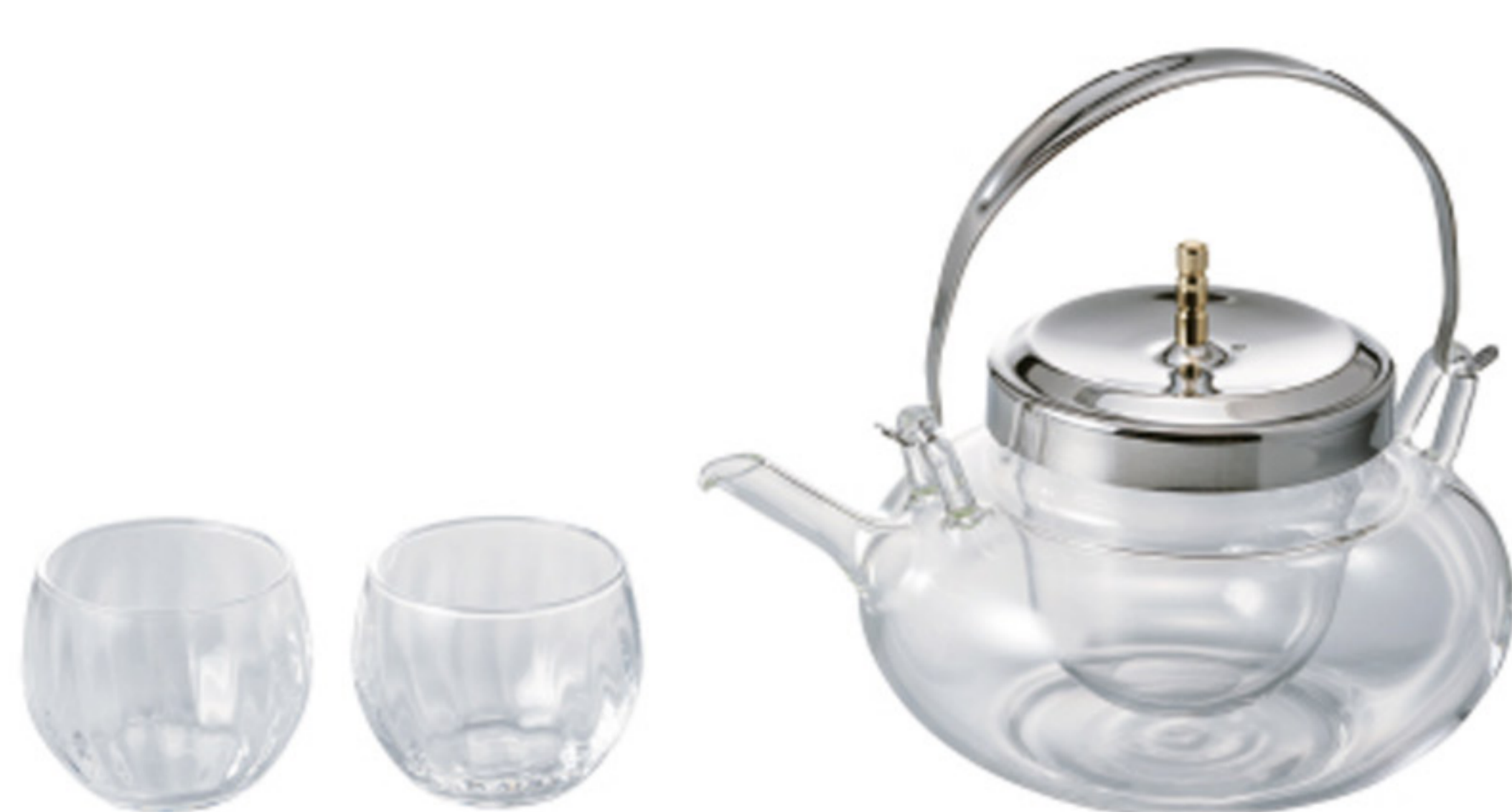
IDXG-8004-MSV C/T 4 地爐利精緻丸型冷酒器壺杯組

【長190・寬150・高420・口徑85mm】 【實用容量】720ml 【材質】耐熱玻璃、不鏽鋼、聚乙烯、矽膠、天然木、亞鉛合金