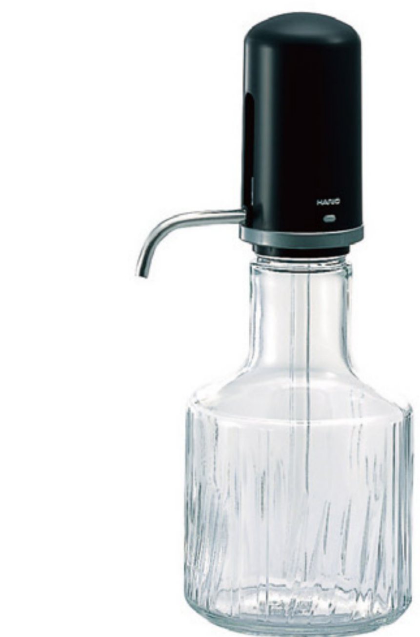
WP-11B C/T12 經典壓水壺

【長150・寬120・高310・口徑44mm】 【實用容量】1,100ml 【材質】玻璃、聚乙烯、不鏽鋼、矽膠、ABS樹脂