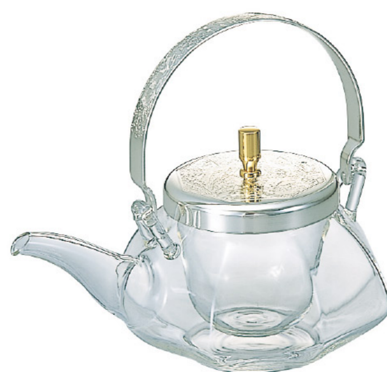
IDS-2ESV C/T12 地爐利八角冷酒器

【長180・寬130・高150・口徑78mm】 【實用容量】360ml 【材質】耐熱玻璃、黃銅、聚乙烯、不鏽鋼