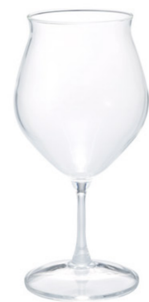
HFG-300-C C/T24 鬱金香高腳杯

【長150・寬120・高310・口徑44mm】 【實用容量】1,100ml 【材質】玻璃、聚乙烯、不鏽鋼、矽膠、ABS樹脂