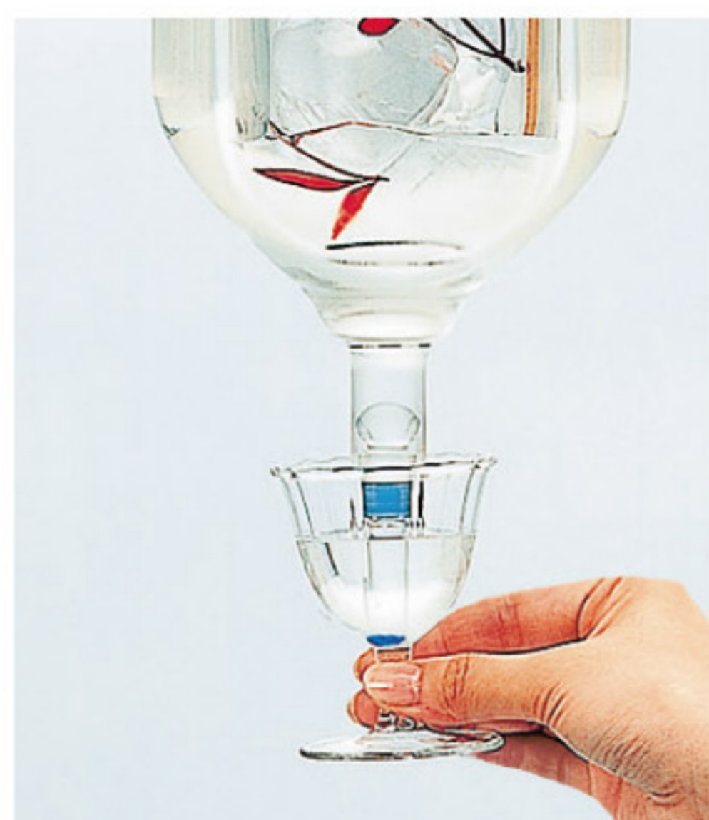
酒杯往上提，美酒就會流出